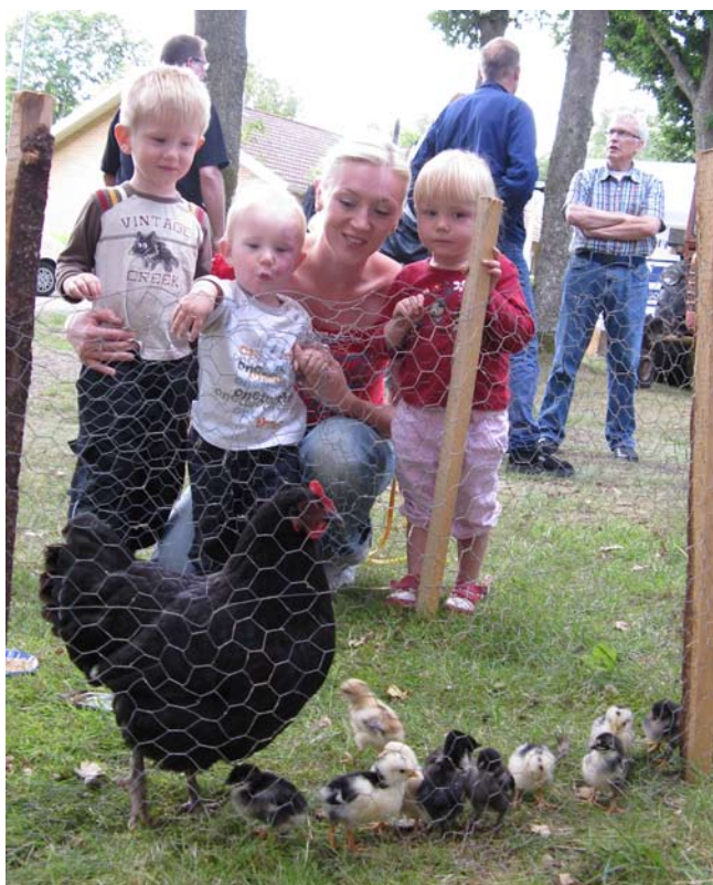
Hönsmamman och hennes små kycklingar ängslade de yngsta besökarna.