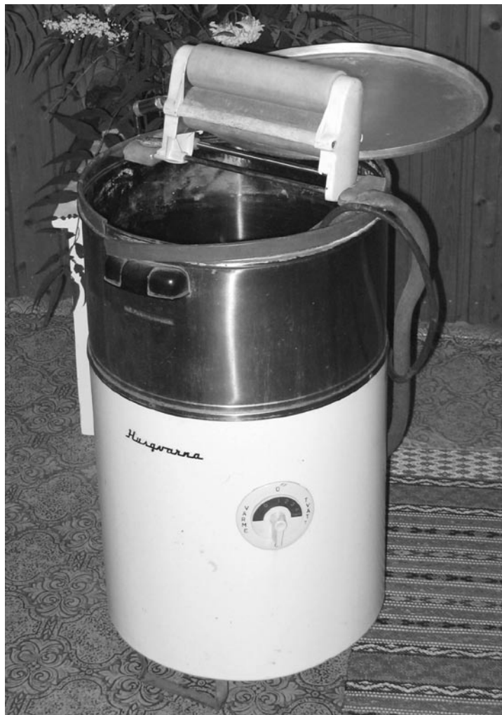
Veckotvättmaskinen var en revolution i många hem.

Ungefär samtidigt skulle vi börja sälja frysboxar. Det var något helt nytt. Tidigare hade husmödrarna konserverat bär och grönsaker. Att det gick att förvara bröd djupfrys var en nymodighet. Hos Carl Johanssons bestämde vi, att vi skulle ordna frysboxdemonstrationer på fem – sex olika platser i vårt kundområde. En av platserna var Hemvärnsgården i Ornunga. Eftersom jag ändå var uppe i de trakterna och pratade tvättmaskiner kunde jag ju passa på att dela ut inbjudningskort till en kväll i hemvärnsgården. Jag bodde inne i Vårgårdasamhälle och nu hade