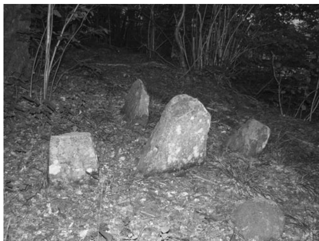
Gränsmarkering. Ett av gränsmärkena vid gränsen mot Halland.

Tre medlemmar från Sätila Hembygdsförening gick under åren 2004-2006 igenom kopior av registerbladen, som nu inte längre var av den bästa kvaliteten, dock