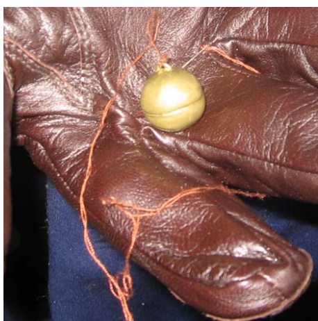
Kulknappen. En kopia av kulan finns i Horreds Hembygdsgård.

Karl XII stupade vid belägringen av fästningen Fredriksten i Norge den 30 november 1718. Han hade varit i krig sedan 1700. Han deltog gärna handgripligen i striderna och hade varit nära döden många gånger. Man började tro att han var osårbar, att han var "hård mot skott". Enligt en stark tradition sköts han av en av de egna. För att komma åt kungen hade man gjort en särskild kula av en knapp från kungens kläder. Man hade fyllt en rund mässingsknapp med bly. Kulknappen träffade sitt mål.