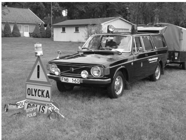
Polisbil modell äldre med sökarljus och saftblandare på taket.