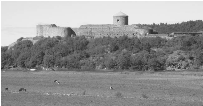
Bohus fästning. Bilden är taget från Bohusbron mot "Norge".

Bohus fästning i Kungälv byggdes 1308 som en gränzburg mot Västergötland, och tack vare sitt strategiska läge på Bagaholmen, där älven delar sig i två grenar, kunde borgen behärska handeln på Göta älv. Bohus slott väckte alltifrån sin tillkomst både för-