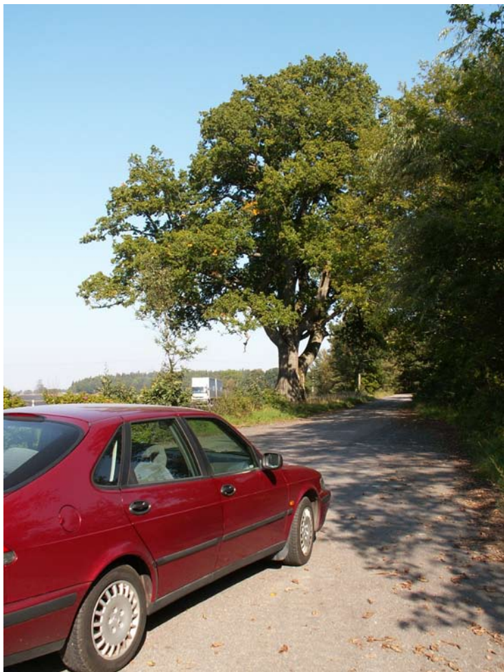
Vägek. Mellan gamla E3 och dagens E20 tronar eken i Södra Härene som fick Vägverket att ändra planerna.

Ekar är tåliga träd som brukar rida ut rejäla stormar. Eken i Södra Härene slår nog alla rekord, den fick Europavägen att flytta på sig en bit. Fast det berodde förstås på att hela bygden ställde upp till trädets skydd. 210 000 kostade det extra att dra vägen en omväg för att rädda trädet, och det var mycket pengar 1969. Men på kuppen räddades ett vackert träd och dessutom fick vägen en bättre och trafiksäkrare sträckning.