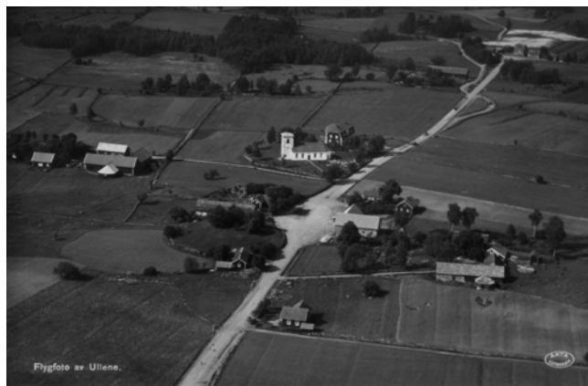
Ullene från ovan i mitten av 1930-talet.