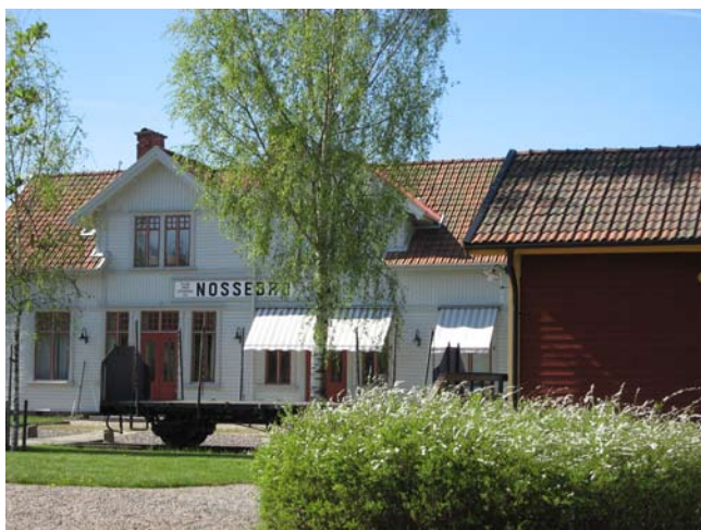
I Nossebro blev stationshuset Hembygds museum

Nossebros mest kända varumärke är marknaden. I mer än hundra år har knallar kommit till Nossebro för att "kränga" varor av olika slag till ortens folk och tillresande från när och fjärran. Inte lika känt är att det fortfarande finns ett stationshus i vårt lilla samhälle. Nu tänker jag berätta om denna byggnad som du måste besöka nästa gång du är i Nossebro.