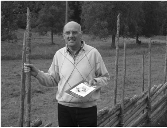
Bosse i Pinnahemmet med sin bok

till knivskarp satir. Ofta avslutas med en överraskande effekt, en västgötaclimax.