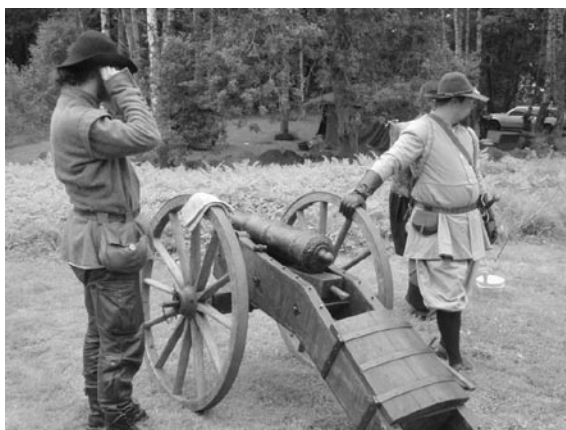
Det small rejält och tryckvägen kändes när Södra Härene hembygdsförening hade augustifest.

Den härsöndagen ordnade föreningen en liten utställning