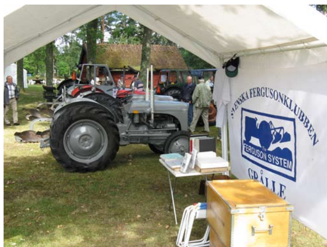
Grälleklubben finns alltid med på Essungadagen.

Den 61:a Västgötaträffen i Essunga avverkades traditionsenligt första söndagen i augusti. Västergötlands henbygdsförbund och Studieförbundet stod som arrangörer, medan Essungahembygdsföreningsvarade för de praktiska arrangemangen. Det blev ett heldagsprogram som krävde både lunch och kaffeservering.