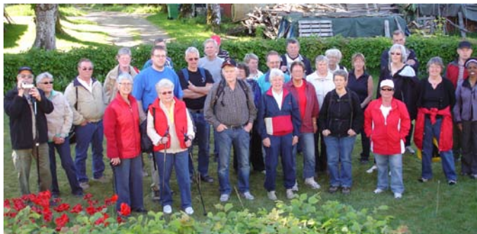
Byalaget på botanisk utflykt

Industriell verksamhet av olika slag har förekommit i Toarpsdal långt tillbaka i tiden. Vid stora fallet i Häljaredsån har en gång en vattenkvarn legat. Kvarn finns mjölnarbostaden som uppfördes 1860. Fallet är imponerande med cirka 10 meters fallhöjd. Kvarnrörelse har förekommit här i århundraden. (I Toarp fanns 1789 inte mindre än 40 kvarnställen. Antalet kvarnar var större, eftersom flera kvarnar låg på samma plats.) Verksamheten vid ån har varit livlig; förutom två kvarnar har här funnits