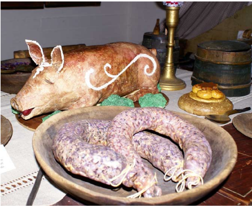
Helstekt griskulting och korv hörde förr julbordet till.