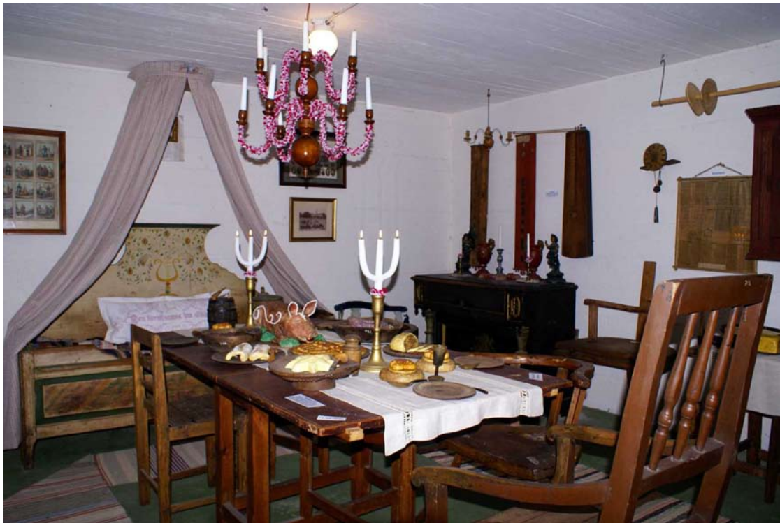
Julbordet står dukat med trätallrikar, såkaka, julgris, korv, julhög och allt annat som var vanligt förekommande i ett bondehem under 1800-talets slut.