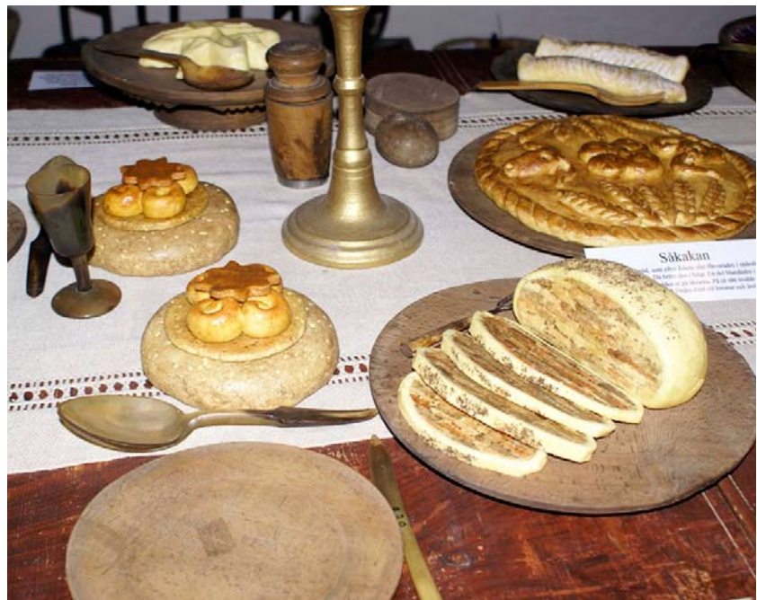
Såkakan och julhögen var förr i tiden ett viktigt inslag i julfrandet.