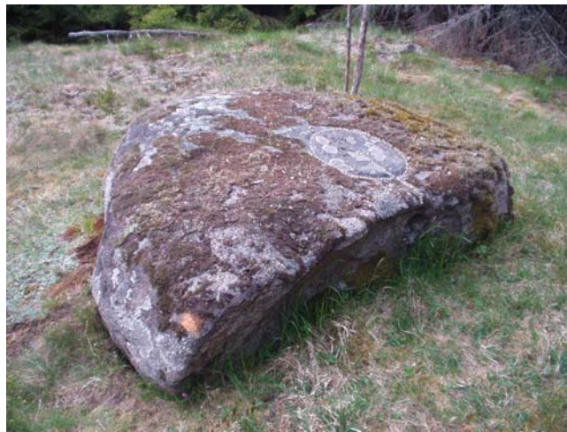
Vid torpet Korphult på Halleberg, som en tjärsten återfunnits.

Det är knappast troligt att det förekommit dalbränning på bergen. Däremot har 'grytbränning' förekommit. Det är dock endast vid torpet Korphult på Halleberg, som en tjärsten återfunnits. Den är meterstor, plan, något sluttande. På den är inhugget en ring med styvspår invändigt för avtappning ner till stenens lägsta punkt (bilden). Att inte flera stenar återfunnits kan bero på att det sällan fanns lämpliga sådana nära torpet. En moss-