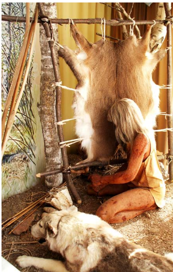
Människans bästa vän hunden, dök upp vid Hornborgasjön redan för 9000 år sedan. Den här är fotograferat på utställningen i Informationspagoden vid sjön.

Jaktkamraten fick snart fler uppgifter. Den skulle förstås hålla vakt vid bostäderna när olika hot, vargar exempelvis, dök upp, men när människan började hålla sig med tamboskap krävdes hjälp med att valla djuren. Ännu på 1800-talet användes vallhundar flitigt i Västergötland, framför allt på herrgårdarna medan de utnyttjades sällan av bönder och torpare. Inte minst flickor