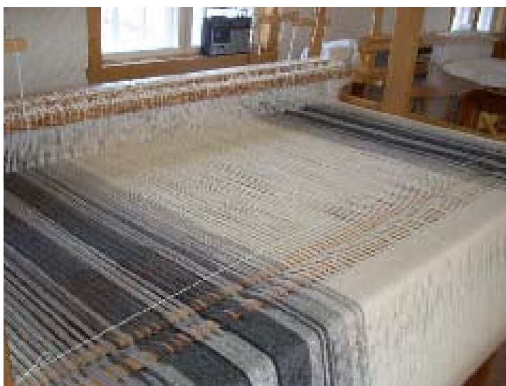
Varför väva? Glädjen att se hur arbetet växer fram.

Det är inte för att vi måste tillverka våra tyger och hemtextilier som mormor och farmor och generationer före, vi kan köpa allting färdigt och dessutom billigare än materialpriset till våra vävnader. Vad är det då som gör att vi offerar många timmar på att sätta upp väv och sen sitta där timme efter timme och väva? Troligen är