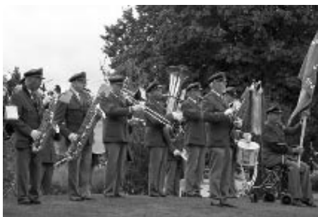
Nossebro Musikkår fick ett celeberrt uppdrag.