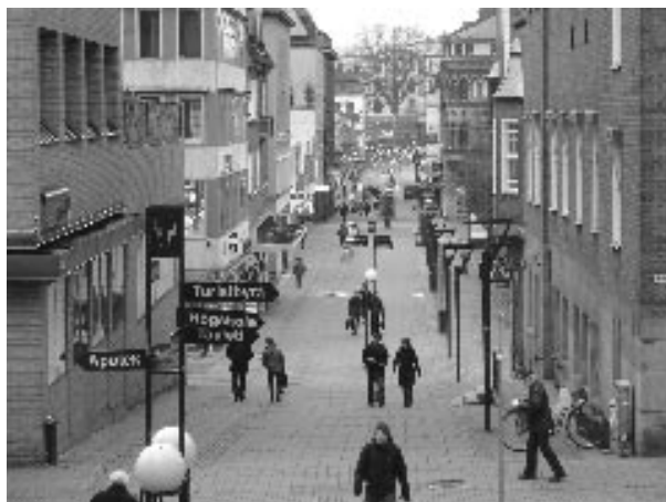
Stora Brogatan i Borås en onsdag i januari.