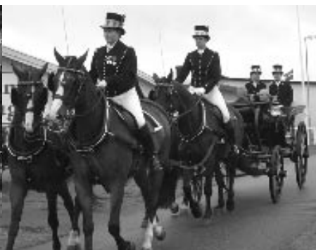
Häst ekipage med Kunglig glans.