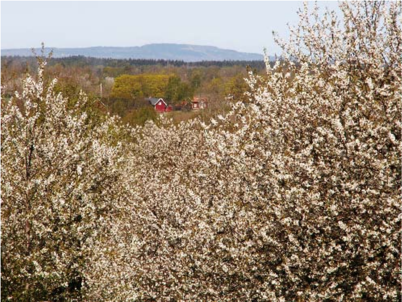
Vacker vårvy från Valle.