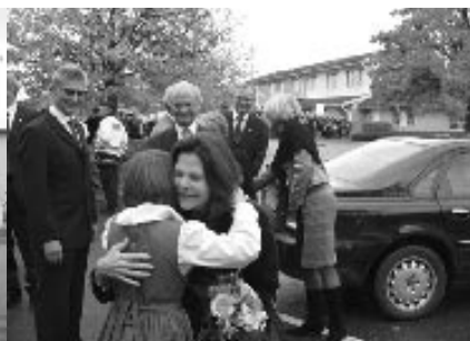
Drottningkram, ett minne för livet.