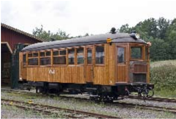
Gullhöna ungdomligt fräsch igen.

För en tid sedan skrev jag om barndomsminnen från resor med motorvagnen med det söta namnet Gullhöna på järnvägen mellan Nossebro och Trollhättan. Ja, den hette säkert något mycket tristare i järnvägskretsar, men bland allmänheten hette både originalet och alla senare motorvagnar på linjen Gullhöna. Nu är banan sedan länge borta, men inte Gullhöna. Det fick jag snabbt veta.