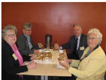
När man kommit fram och klarat av registreringen smakar det gott med kaffe antingen man kommer från Skaraborg eller Sjuhäradsbygden.