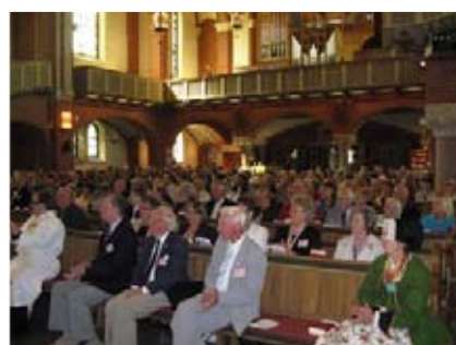
Gustaf Adolfskyrkan var välfylld med hembygdsvänner.