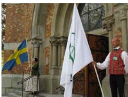
På kyrktrappan välkomnades ombuden av en fanvakt.