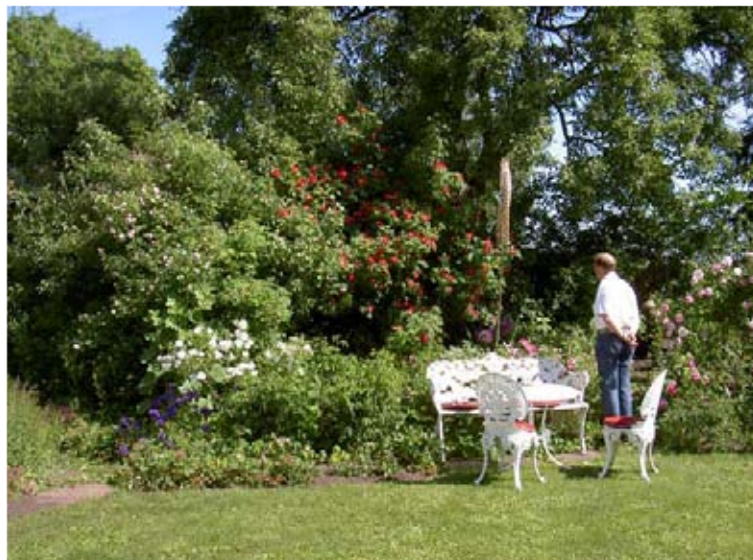
Rosenrädgården i Östra Tunhem.