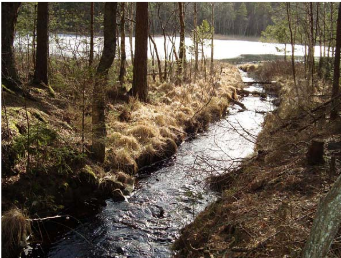
Den smala, sprängda kanalen vid utloppet i Grinnsjön.