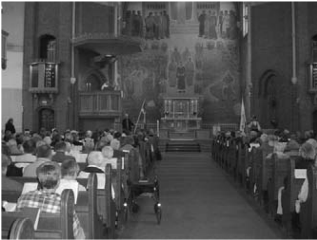
Högtidsgudstjänsten hölls i Gustaf Adolfs kyrkan.