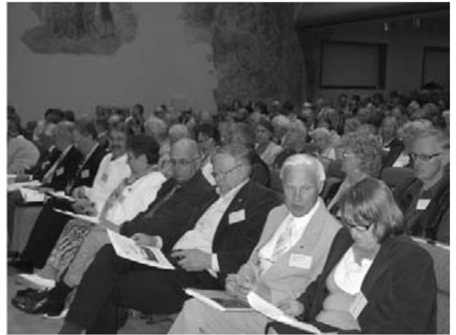
Årsmötesförhandlingarna hölls i Bäckängsskolas aula.