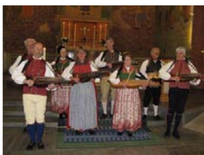
Borås Spelmanslag förhöjde stämningen i gudstjänsten.