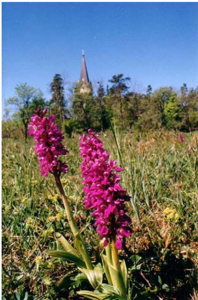
Änglamark. Sankte Pers himmelska nycklar frodas kring Österplana kyrka.

Men efter reformationen ansågs det ju inte riktigt passande med helgonnamn, det var alltför katolskt. Inte minst Linné gav blomstren mer lämpliga och neutrala