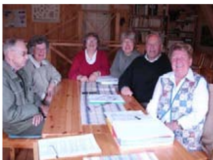
Det var det härgängets som sett till att allt blev så bra.