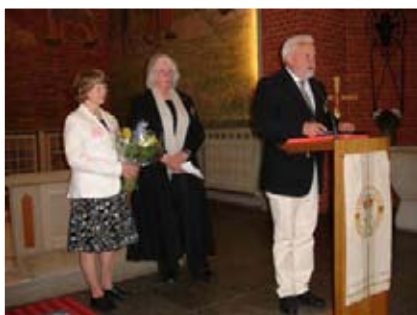
Att få ta emot Tengelandstipendiet är en stor ära.