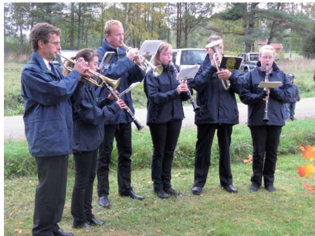
Dagen till ära spelade Mössebergarna på Ullaheia.