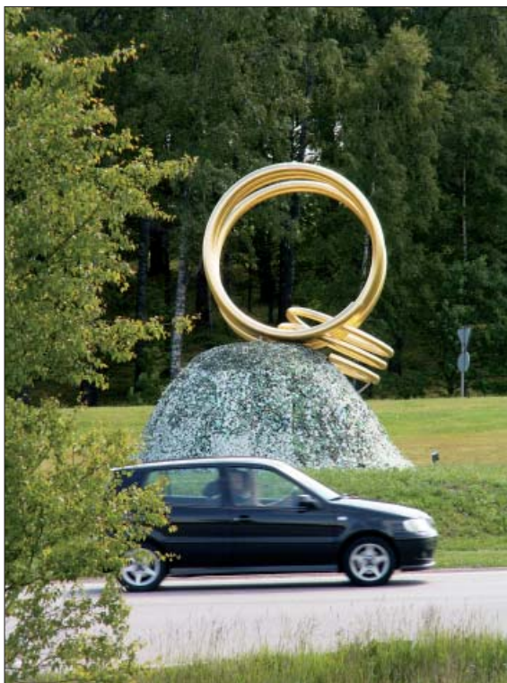
Vilken rondellskyltning! De jättelika gyllene ringarna berättar om den skatt man hittade här för drygt 100 år sedan.

Av någon anledning blev det inte av, kanske var det denne småkung från Skövde som besegrades och offrades vid Finnestorp? Guldet blev liggande tills en novemberdag