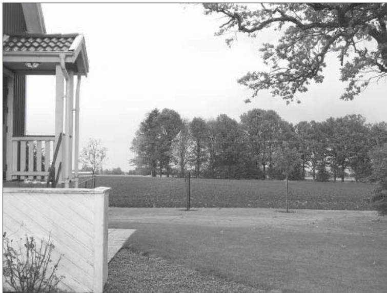
På en lövklädd åkerholme ligger Skarstads kolerakyrkogård. En stenunderträdens lövvalvdärute berättar om farsotens som drabbade många i bygden.

Epidemin startade i mitten av 1300-talet och spreds från land till land med skeppsråttorna och när den väl etablerats så svepte den fram från stad till stad och skonade ingen. Till Sverige kom den västerifrån via