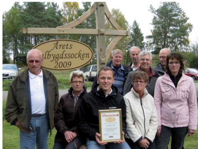
Glada Grolandabor som fick mycket beröm med sig hem.

i omfattning för varje år. Antalet utställningsplatser i Falköpings kommun uppgick till över 100 med bortåt 200 utställare. Det har blivit en riktig festkväll. Förutom traditionella ateljéer och utställningslokaler så är ett antal kyrkor öppna, liksom restauranger och andra samlingspunkter.