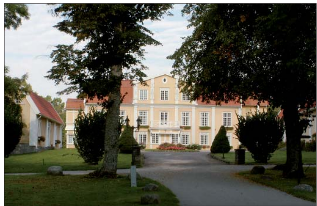
Ronnum utanför Trollhättan var platsen för ett litterärt kärleksdrama.

Menså kom för något decennium sedan ett storverk i två band om Thorild där allt avvisades. Kärleken på Ronnum var en tonårsförälskelse, och dog ut av sig själv som sådana brukar. Frågan är om inte litteraturvetaren som