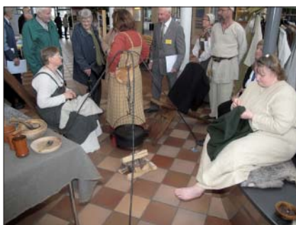
gammaldags hemarbete visades