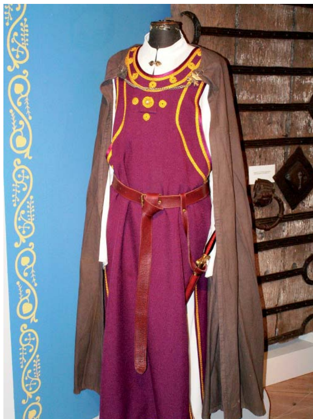
Välklädd. Så här stiliga kläder kan Birger Jarl ha burit enligt utställningen.

Om Birgers tidiga år vet vi inget alls, men han rörde sig säkert i de finaste kretsar. Den egna släkten var mäktig och dessutom hade man på tidens vis sett till att gifta in sig i andra stormannasläkter. Via mamma skall han rentav ha varit släkt med Sverkerska kungaätten. Birger följde traditionen. Först gifte han in sig i den rivaliserande Erikskungaättens genombröllopet med Ingeborg, syster