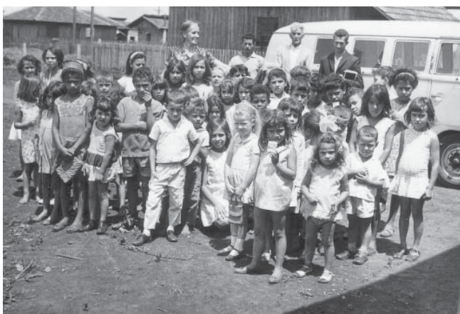
Söndagsskolan samlad, Arapongas.

Varje brev talar om stark tillit och tro på Gud. Han visar vägen, till honom kan man komma i både glädje och sorg. Man förstår att de känt en levande Gud som hela tiden fanns i deras närhet. Utan denna visshet om Guds hjälp och stöd hade det säkert varit svårt att klara all påfrestningar som pionjärbrevet innebar.