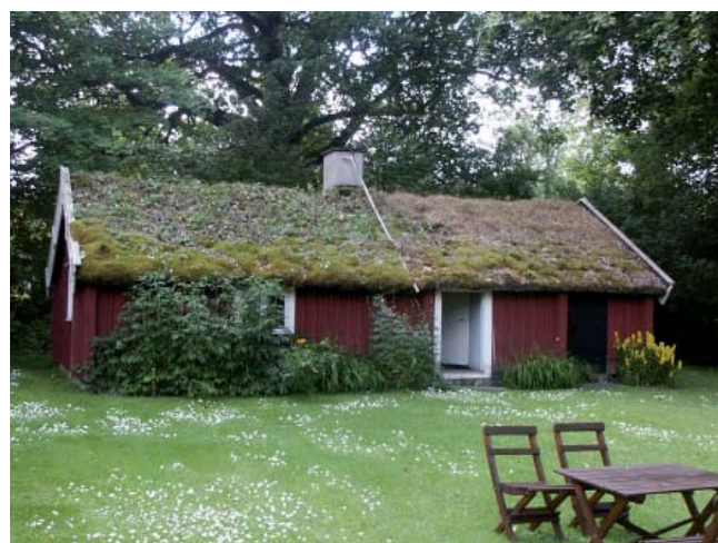
Fornstugan i Främmestad. Ett hus med historia.

Byggnader som inte tidigare fått eller kan få bidrag på grund av att de är flyttade prioriterades.