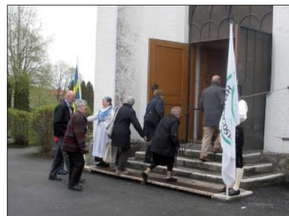
innan det är dags att gå till kyrkan.