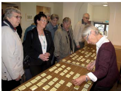
Först måste man registrera sig,