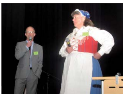
kommunalråden berätta om dagens Mark