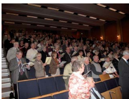
Uppmärksamma lyssnare fick höra