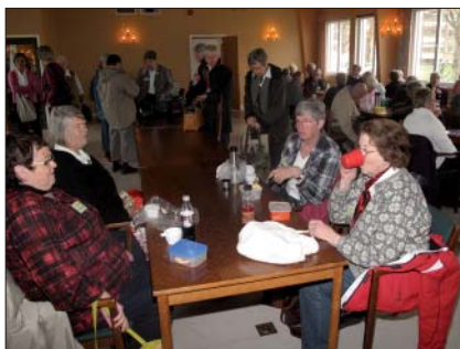
... sedan smakar det gott med lite kaffe