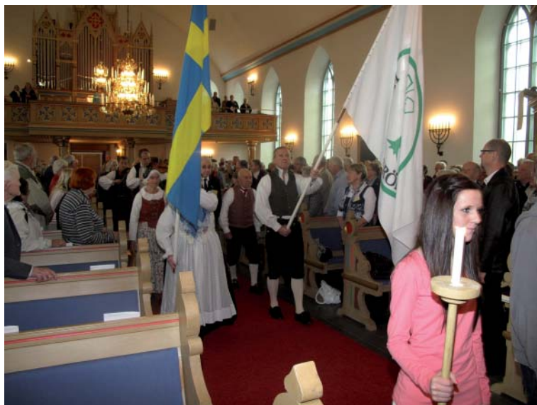
Intåg till högtidsgudstjänsten.

Söndagen den 9 maj samlades cirka 300 ombud och andra deltagare till Västergötlands Hembygdsförbunds årsstämma i Kinna.