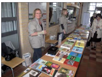
Birgits söser sålde Marklitteratur,