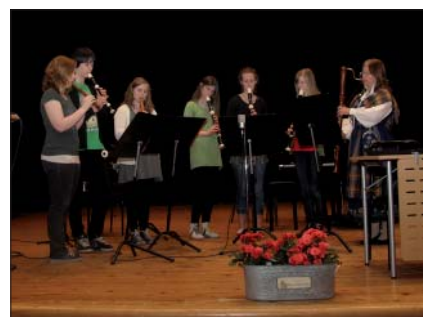
och musikskolan bjöd på skön musik.