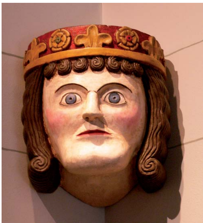
Birger Jarl. Så här kan han kanske ha sett ut i sin livstid enligt en skulptur i Varnhems klosterkyrka, här i en målad kopia på Skarautställningen.

Vilhelm Moberg var ju en baddare på bra historier, men historien om Birger Jarl och hans ättlingar var alltför otrolig för honom. Om Moberg läst en sådan rövarroman hade han avfärdat den som falsk och en karikatyr av verkligheten. En fabel som var omöjlig att tro på. Men denna ätt styrde Sverige i drygt 100 år och det var en tid som överträffade det mesta i våld, intriger och sex. En kunglig förbrytarfamilj, kallar Moberg den.