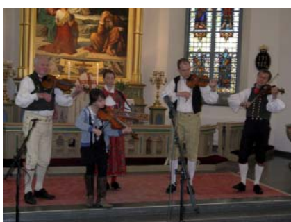
I kyrkan lyssnade vi till spelmansmusik,