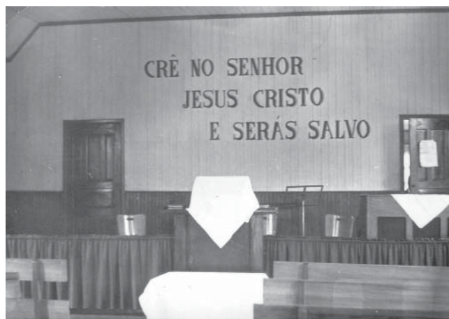
En kapell interiör, Arapongas.

Människorna är fattiga, familjerna är stora och bordåligt, många kan varken läsa eller skriva. Barnen är undernärda med stora magar. Ungdomar driver omkring på gatorna