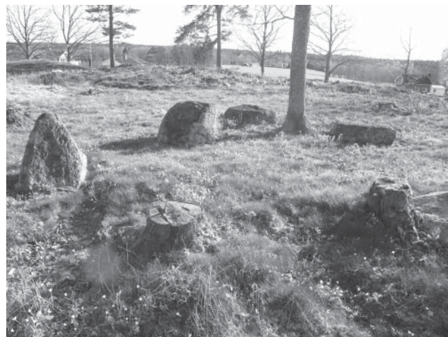
Stenar på Hönsahögen är ett riksintresse.