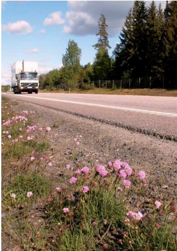
Ingen badstrand precis men triften trivs utmed E20 utanför Skara.

En roligare och mer spännande förklaring är att frön av trift helt enkelt blåst hit med starka stormar som härjat Västsverige. Men i så fall borde det ju växa trift överallt inne i landet. Nej, förklaringen till att den frodas vid vägkanten är helt enkelt den att blomman bättre än de flesta andra klarar av denna saltade miljö. Det skulle alltså bero på saltet som sprids vintertid.