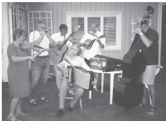
Vallefolk = Spelmansfolk från Valle härad Vallefolk är en grupp som har spelat ihop under 25 års tid och som aldrig har lyckats att bli osams på allvar. Våra framträdanden präglas av del av skämtsamma gnabb.