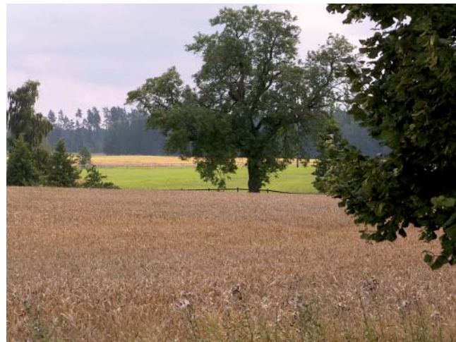
Förändring. Den forna ödemarken består idag av åkrar, hagar och skog.

I slutet av 1700-talet blev det oro bland nybyggarna på Hillet, för då hade Kronan planer på att använda Hil-