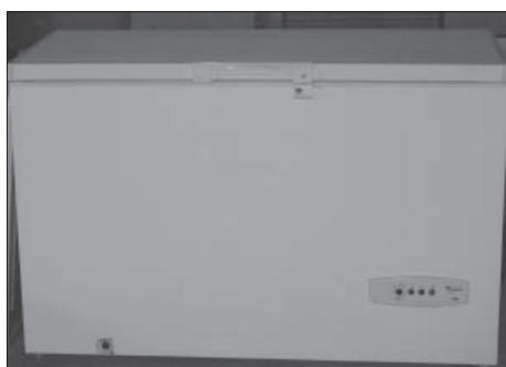
Frysboxen. Tänk vad mycket gott en frysbox eller frysskåp rymmer.

När vi tänker på att förvara vår mat under en längre period, då är det naturligt att gå till frysboxen eller frysskåpet. Men hur gjorde våra förfäder? De hade två förvaringsätt. Man torkade eller saltade köttet. När det gäller torkade livsmedel tänker vi idag kanske mest på fisk, till exempel det som blir vår lutfisk. Det är framförallt torsk och långa som blir vår lutfisk.