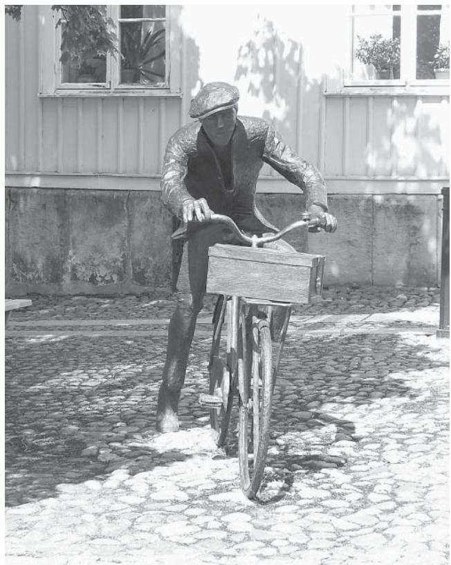
Bruksarbetaren på Gamla torget i Mariestad har förstås en unika på pakethållaren- Statyn är gjord av Wanja Nones Håkansson.

Ifrån denna västgötska metropol medelst bantåg, drivna med koks, utgick ett fyrkantigt föremål som kallades unicabox.