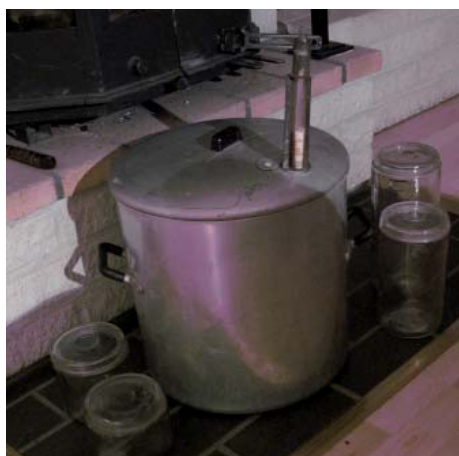
Konserveringsapparaten. Var säkert en revolution. Utebyggena ordnades kurser för husmödrarna.