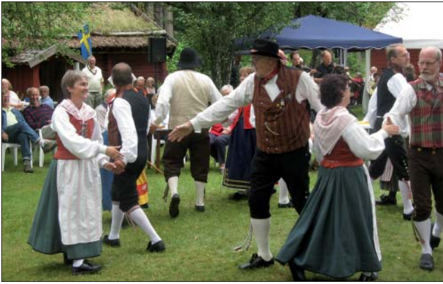
Folkdanslaget hör också till Västgötaträffen.

Veteranfordon, videovisning, ponnyridning, gårds målningar av M. Raatikainen, musikgudstjänst med kyrkoherde Sven Bild och Vallefölk, folkdansuppvisning och som avslutning på träffen Västgötahumor i tal och ton av Carl Thulin. Dessemellan lunch och kaffeservering. Det var vad Essunga hembygdsförening kokat ihoptillsammans med medarrangörerna Västergötlands hembygdsförbund och Studieförbundet.