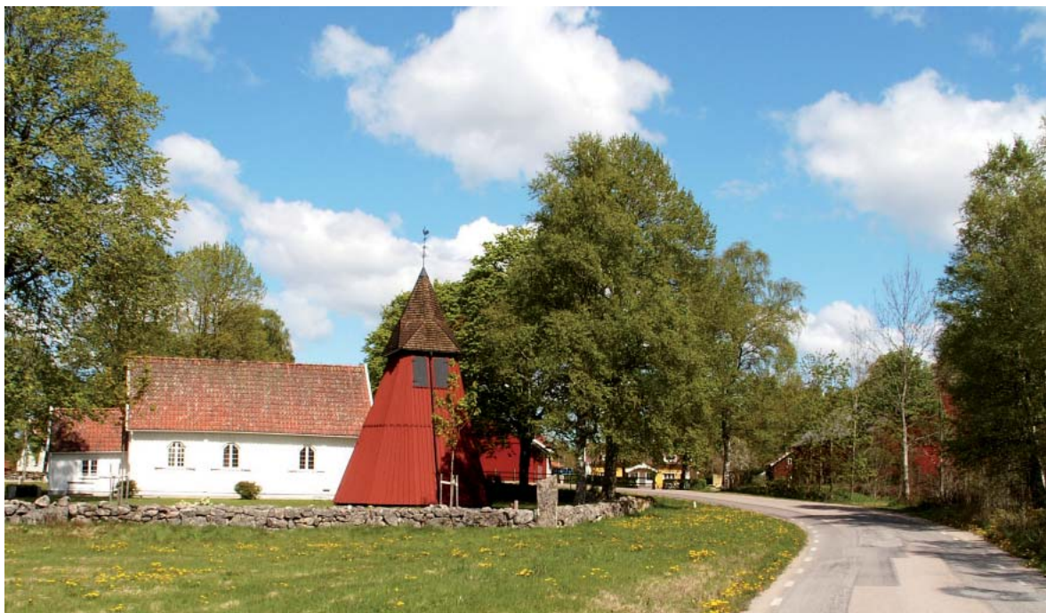
Rofyllt. Den lilla vägen gör vördnadsfullt en omväg kring kyrkan.