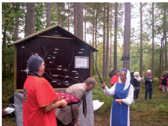
Drottning Astrid dubbar landshövdingen till riddare av hålvägen med hjälp av väpnaren Ulf Unosson

Sedan var det välkomsthälsning av kommunfull-