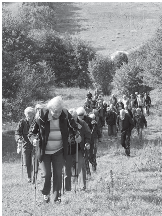
I skogar, berg och dalar. På bygdevandring i Skagen.

Därefter fortsatte vandringen tillbaka mot parkeringsplatsen. På vägen passerades Övergården, Mossen och Ekeberget. I varje gammalt torp finns en historia