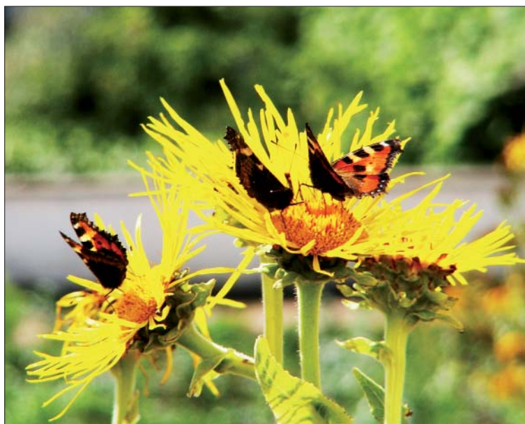
Matdags. Fjärlarna har bråda tider, det gäller att ladda upp för att klara en lång hård vinter.

Allra tuffast är kanske citron fjärlen som nöjer sig med att krypa ned bland visset gräs eller blåbärs- eller lingonris och klara sig ändå. De stänger av all energi-