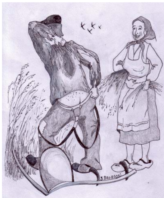
Stackars Kalle. Men det var lika svettigt ä'ndå. Skjortan åkte också av.

- Du går la bätter i å kasta å böxerna me, så vi slipper sinka arbetet på de hära viset.