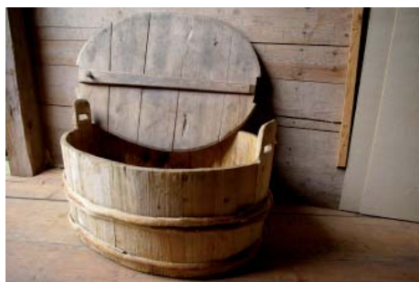
Saltbaljan. Föregångaren till konserveringsapparaten som under flera hundra år hjälpte husmor att förvara maten.