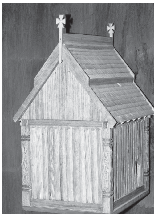
Kanske var den försvunna kyrkan en enkel träbyggnad som den här modellen på museet i Skara.