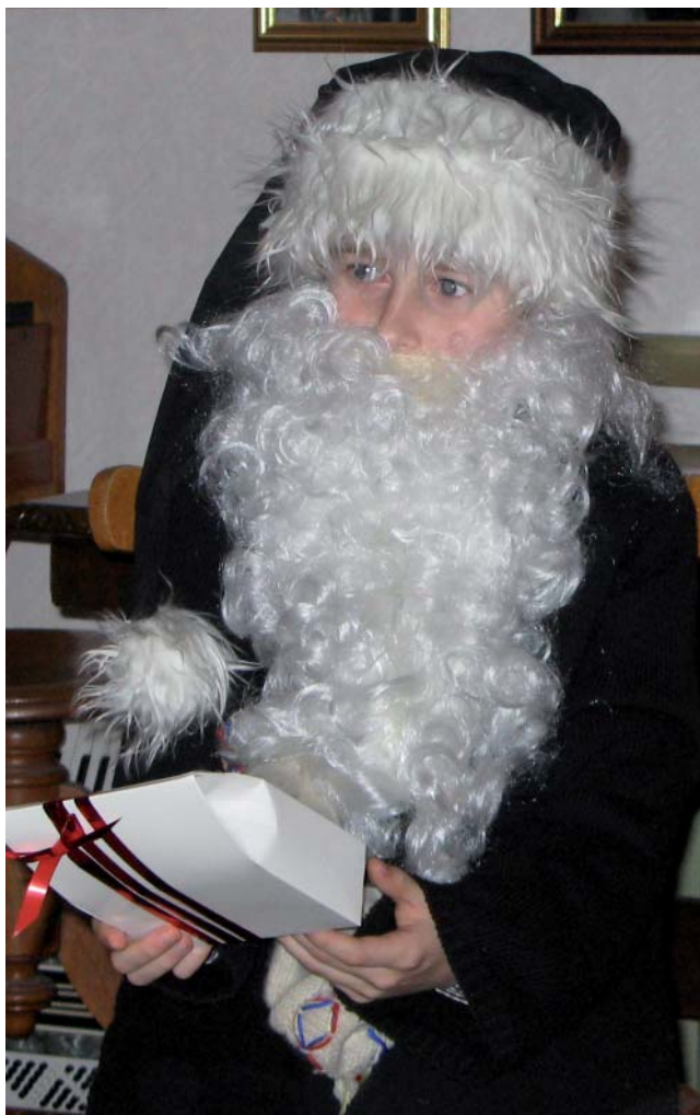
Alternativ dräkt. Redan 2008 testade en av de yngre Asklandatomtarna en alternativ dräkt, men den röntte ett visst motstånd.

- Kan vi vänta med arbetstiderna till nästa stämma i Mullsjö?. Ett tydligt ja igen.