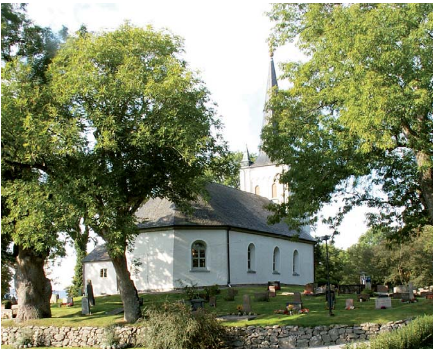
Vänersnäs kyrka. Farligt område för alla rävar.

Varggroparna var över huvud taget till besvär. En gång hamnade en gammal gumma i församlingen i en varggrop och hittades först nästa morgon. Då tryckte gumman i ena kanten av gropen och vargen i en andra, båda lika rädda. Och riktigt illa var det förstas när en gästande fin ung dam, dotter till kyrkoherden i Flo, tog