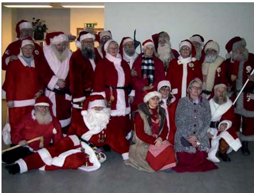
Årets gruppfoto. Vid varje årsstämma dokumenteras deltagarna med ett foto, men tyvärr vill inte alla ställa upp på bild.

Tomteparaden svänger in till årsmöteslokalen, där en riktig tomtelunch var dukad. - Viktiga förhandlingar väntar och då måste alla vara mätta och belåtna, förkla-