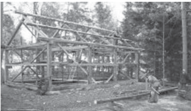
Nytt båthus men i gammal stil.

Kållandsö Hembygds och Fornminnesförening fick för några år sedan en fiskebåt. Denna gåva blev anledningen till att det nu byggs ett båthus på hembygdsgården. Ett naturligt beslut med tanke på att Kållandsborna genom alla tider har varit beroende av sjön och fisket för sin försörjning.