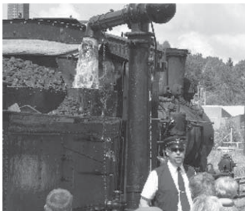
I Kvarnabo där loken vattnas har en platta monterats som berättar om att järnvägen här är byggnadsminne.

För 40 år sedan lades persontrafiken på gamla stolta Västgötabananned, men de hartåg entusiasterna vägrat inse. Både mellan Skara och Lundsbrunn och Anten-Gräfsnäs går det fortfarande att uppleva 40-tals nostalgi med kolröksfrustande ångtåg. Nu har delar av den 12 km långa sträckan mellan Anten och Gräfsnäs rentav blivit byggnadsminne. Det är en halvmil mellan Humlebo banvaktstuga och Kvarnabo station som på detta sätt uppmärksammas som ett tack för alla års slit med att bevara minnet av smalspårseken.