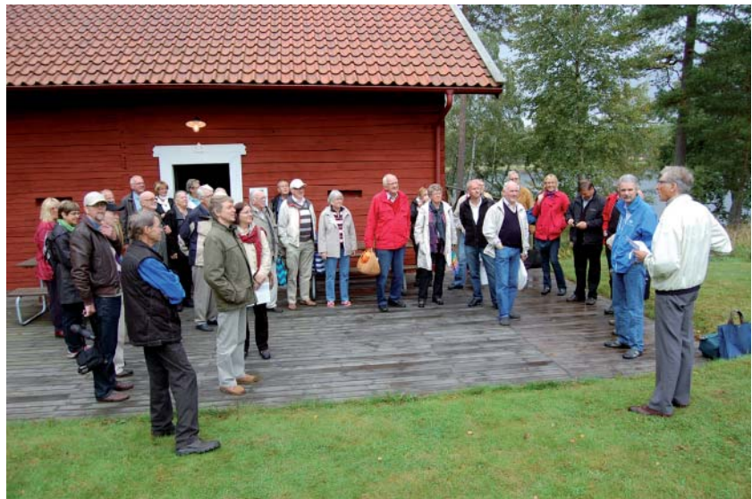
Gillesmedlemmar med anhöriga inför dagens utflykt samlade på Hembygdsgården i Tranemo.