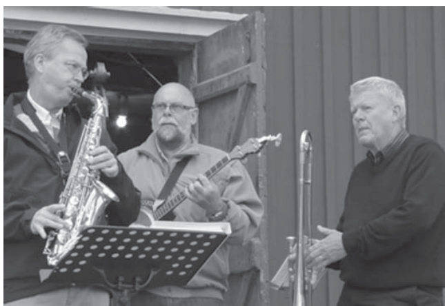
Musikanter vid kvarnen.