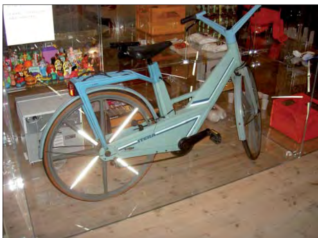
Plastcykeln blev dock aldrig någon succé

Under de drygt hundra år som plasten funnits har den hunnit förändra vår vardag i grunden och är en av förutsättningarna för det välfärdsliv vi lever. Idag är plastprodukter trendiga, samtidigt som materialets negativa miljöpåverkan är mer uppmärksammas än någonsin.