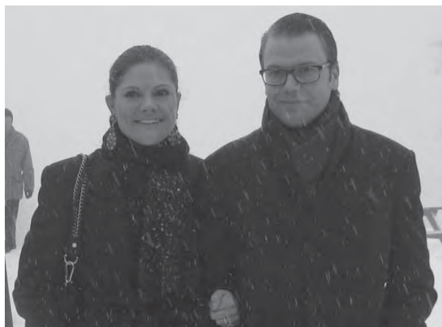
Kronprinsessan Victoria och Prins Daniel i snövädret på toppen av Kinnekulle 22/10 2010.