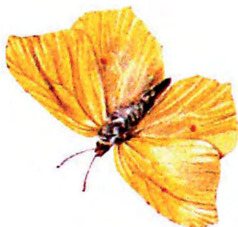
Citronfjärilen vet att hantera brakveden. .