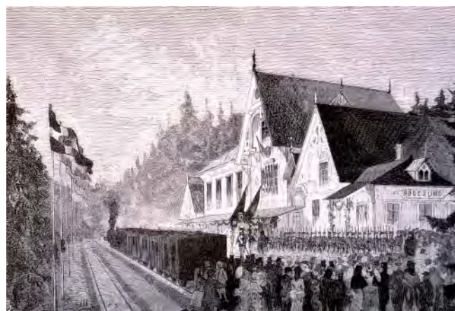
Karlsborgståget till Skövde invigdes storstatligt vilket denna teckning av Carl Larsson visar.

På andra sidan bangården var, mellan tvenne flaggprydda stänger, utspänt en vit duk varpå voro med blomsterord målade orden HELL! LYCKLIGA FURSTEPAR. Därunder voro stora blomsterdekorationer och stora lövkransar och på båda sidor därom voro på var sin tavla målade G. W. Och därunder LYCKA VÄLGÅNG och därunder i jämnhöjd med staketet blomsterkvastar och