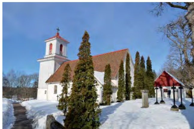
Kilanda kyrka med Ekmanska familjegraven och Beyerska gravkoret.

en lägre lantbruksskola i såväl teoretiskt och praktiskt hänseende, och då under årens lopp tillbakagång i något hänseende, ej kunde förmärkas utan sträfandet hos skolans nitiske, insiktsfulle ledare städse gick ut på att åt skolan bibehålla den rangplats bland anstalter av dylikt slag den vetat förvärfva sig, var det ej underligt, att det betydelsefulla arbete tillmodernäringsens fromma, som där utfördes, skulle vinna erkännande icke blott inom sällskapets område, utan snart sagt öfver hela vårt land. Trots lantbruksskolans goda resultat lades den ner 1912. Myndigheterna ville ha större och färre skolor.