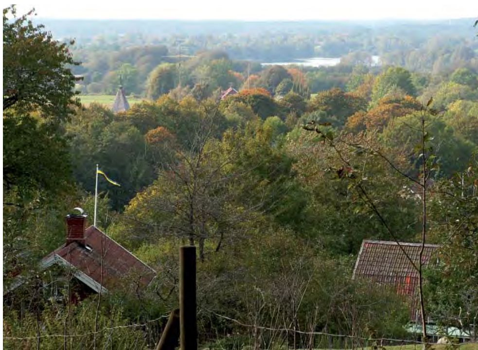
Halvvägs upp i backen kan man se denna imponerande syn över Valle med Öglunda kyrktorn skymtande till vänster bland lövmassorna.

Det där med kläderna låter konstigt idag, men när man ser gamla bilder på naturvänner på vandring så är herrarna alltid klädda i kostym, hatt, väst och slips medan damerna har en prydlig dräkt, handväska och en