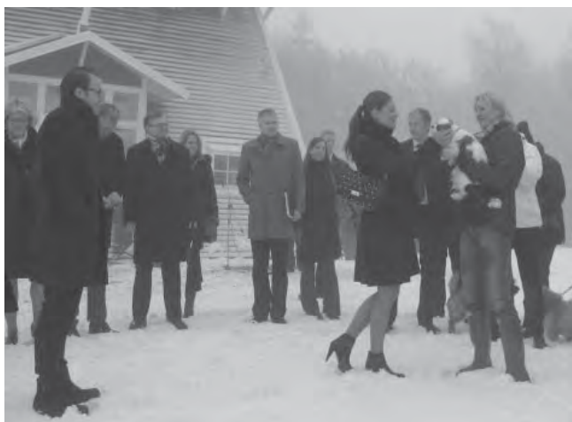
Kronprinsessan fattar tycke för en liten hund framför utsiktstornet på Kinnekulle.