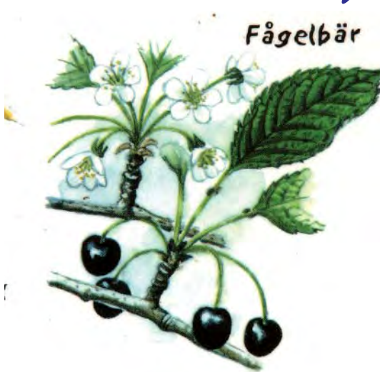
Fågelbär envisas man med att tala om på informationsskyltarna.

sig ganska ofta, liksom åtskilliga andra.