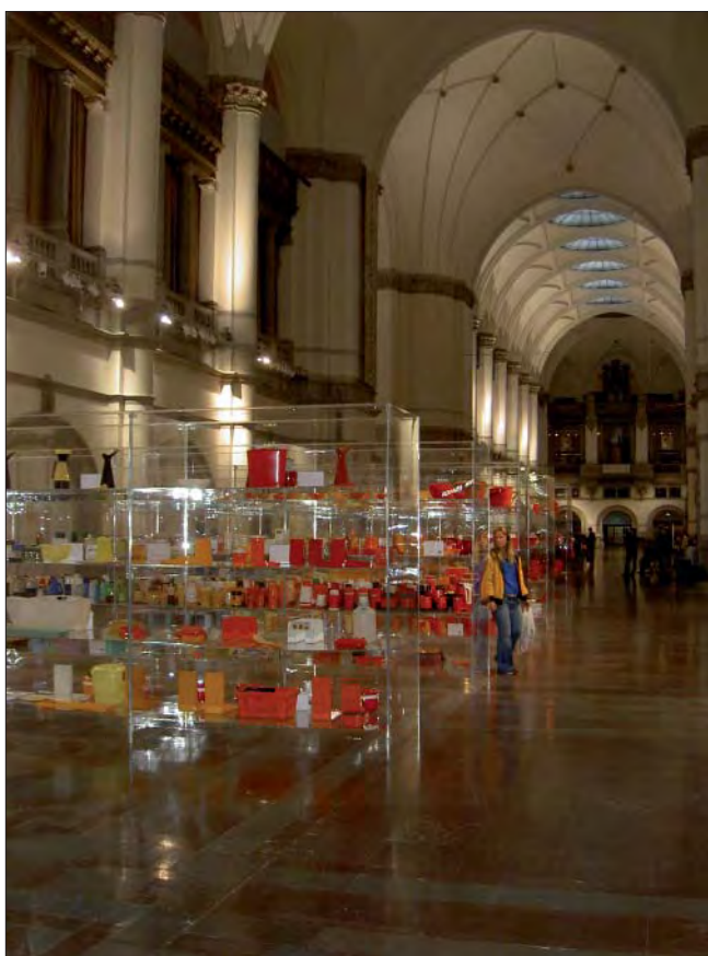
Plast i alla former utställda i Nordiska Museets stora hall.

Utställningen tar utgångspunkt i hemmet, med mängder av exempel ur Nordiska museets samlingar. Här samsas bakelittelefonen med klassiker formgivna av Stig Lindberg och Carl-Arne Breger. Den anonyma vita trädgårdsstolen, kanske världens mest spridda plast-