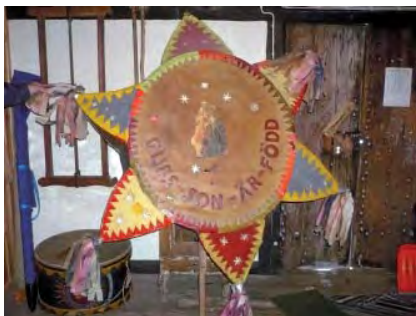
Den gamla julstjärnan i Amnehärads hembygdsgård

Julen 2009 var det tre gånger ute i Gullspång, Ot-