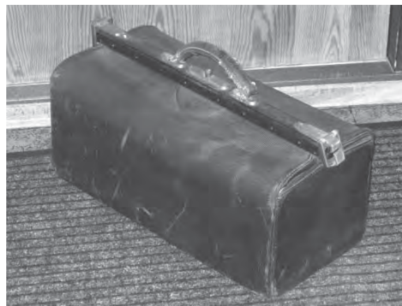
Doktors väska. Väskan som var med på alla sjukbesöken.

började en egendomlig procedur eftersom mannen höll byxorna uppe genom att ha en lång lina lindad runt livet. När alla varven lindats av låg en rejäl hög med tunt rep på golvet. Efter undersökningen vidtog pålindningen av linan. Patienten kunde ju inte gå ut i väntrummet med repet i handen. Min fars förvåning över det ovanliga arrangemanget var så stor att han inte kom sig för att fråga mannen varför han inte ville använda livrem eller hängslen. Han var kanske fäst vid sin "livlina"?