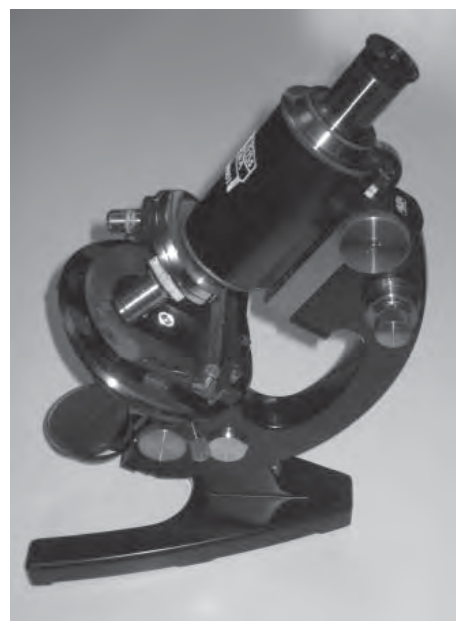
Mikroskopet. I lab-utrustningen ingick mikroskop.

En dag kom en medelålders man in på mottagningen och klagade över att han hade ont i knät. Min far bad honom ta av byxorna så att han kunde se på knät. Nu