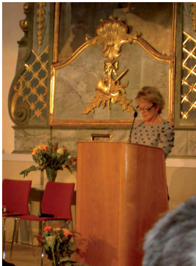
Kulturministern Lena Adelsohn Liljeroth i talarstolen i Barocksalen under Hembygdens Helg.

Frågan som många i hembygdsrörelsen ställer sig idag är "kommer pengar till projektet Hus med Historia finnas kvar under en längre period?" Den ställdes från publiken och ministern svarade att det kunde hon inte på stående fot utlova. Frågan är om detta diskuteras i