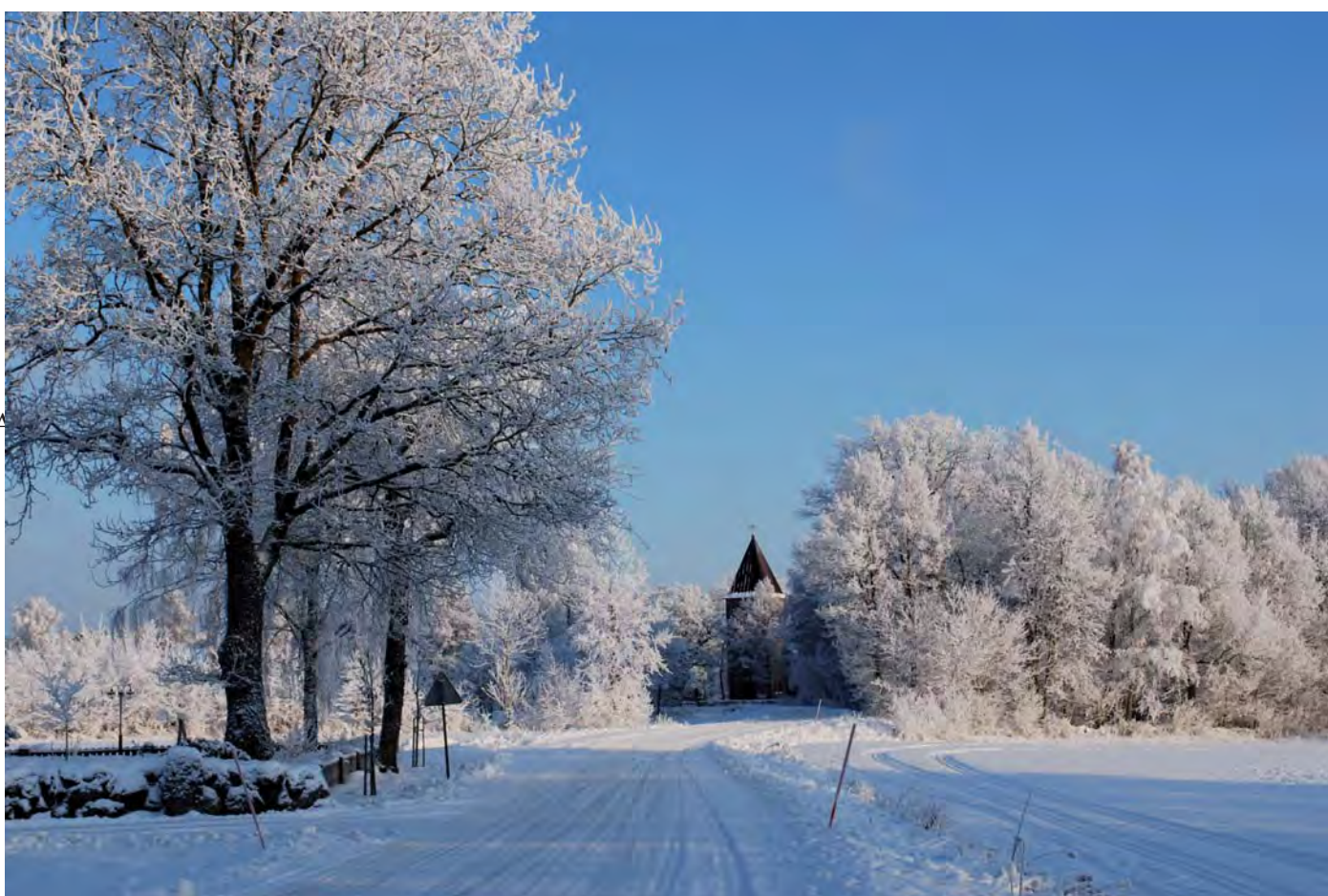
Asklanda kyrka i vintrig omgivning