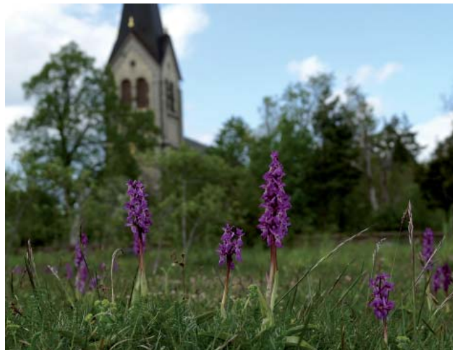
Österplana kyrka i vårskrud, S:t Pers Nycklar

På 1100-talet uppfördes Västerplana stenkyrka till Jungfru Marias ära. Troligtvis byggdes kyrkan på samma plats där det tidigare stått en stavkyrka. I mitten av 1800-talet beslöt kungliga befallningen att kyrkan skulle rivras och sockenborna skulle hänvisas till Medelplana kyrka. Västerplana borna vägrade förstöra sin kyrka. I över