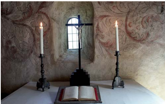
Altaret i Västerplana kyrka

I början av 800-talet uppfördes små enkla kapell eller altare här och där på Kinnekulle. Den kristna läran kom med vikingarna som kom hem efter att ha varit i det ortodoxa bysantinska riket. På 1100-talet följde många yrkesskickliga hantverkare missionärernas spår, till Kinnekulle kom bl.a. stenhuggare främst från England och Tyskland. Ett stort antal stenkyrkor växte upp och kyrkorna stod kvar i tusen år och mer. Att Kinnekulle blev intressant för dessa invandrande stenhuggare berodde på att här fanns platsen där vår förste kristne kung Olof Skötkonung blivit döpt och här fanns ett berg där det var lätt att bryta sten.