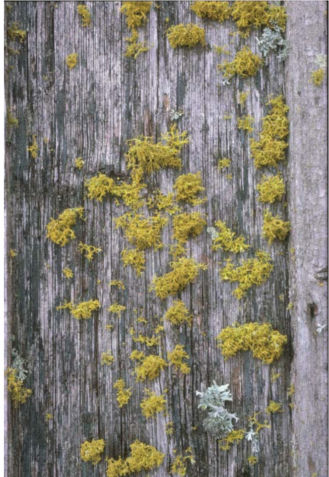
Varglav. Fotot av brädorna med varglav i Ornunga är taget den 11 maj 1979 av Anders Bohlin.

Vill man se varglav på naturliga ståndorter kan man