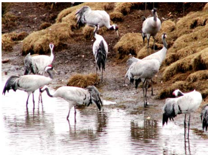
Trognast bland de tidiga turisterna är tranflockarna.

Torparna skulle betala arrende genom dagsverken,