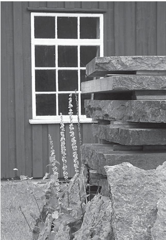
Exteriör från Råbäcks Stenhuggeri.

8 lägenheter i varje hus för arbetare vid cementfabriken. Husen på Falkängen var på väg att förfalla i början av 1980-talet och kommunen försökte sälja dem för en krona styck. Rivningshotet var överhängande, dock beslöts att husen skulle renoveras och sedan dess har Falkängens Hantverksby och Vandrarhem funnits där. I denna miljö finns hembygdsföreningens Bruksmuseum som speglar bruksamhällets uppkomst och människorna som verkat där.