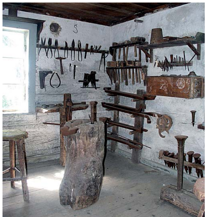
Interiör hos Eskilssons Kopparslageri.