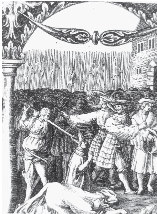
Biskop Vincentius avrättas i Stockholms blodbad.