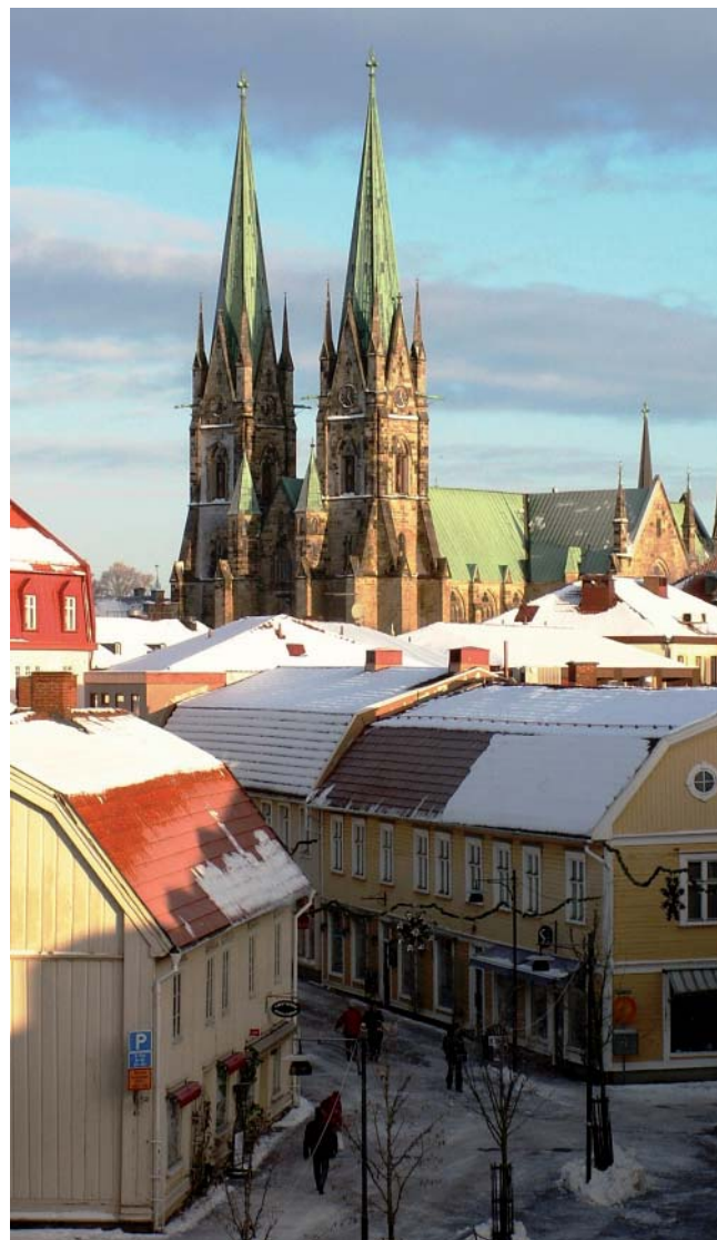
Skara domkyrka hann biskop Slagheck aldrig sätta i gungning.

På tavlan i domkyrkans vapenhus finns alltså Didrik Slaghecks namn och enligt den var biskop Didrik verksam här i två år, 1520 – 1521. Vincentius och Didrik Slagheck råkade särskilt illa ut bland Skaras biskopar, men det