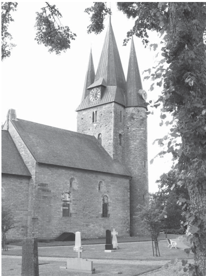
Husaby kyrka kan innehålla svaret på en tusenårig gåta.