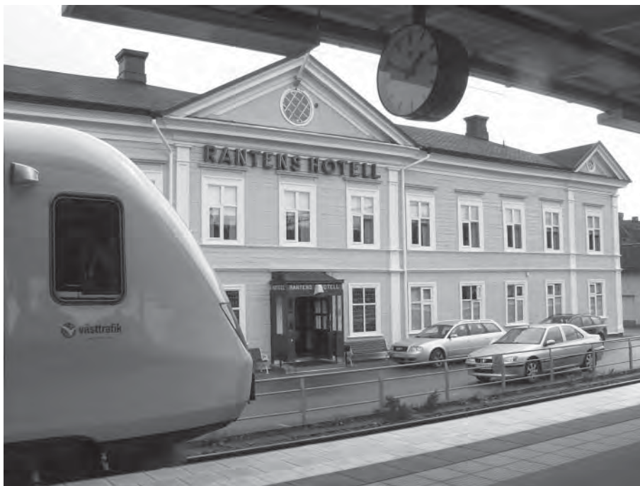
Rantens järnvägsrestaurang lockar fortfarande resenärerna på Västra stambanan.

järnvägen väster om Billingen, men öster om Mösseberg, vilket skulle kunna gynna folk inom ett stort område. Men det blev väl alltför omständligt.