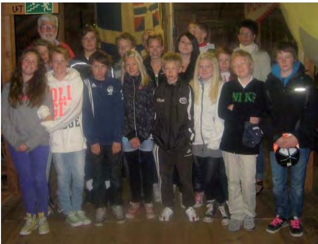
Elever från Lyrestads skola gästade Hammagasinet.

fick bland annat träffa en lanthandlare, en telegrafare, med både stolpskor och hjälm. Vidare ett antal damer i tidsenliga kläder, och naturligtvis den tidigare nämnda bonden. Samtliga klasser från förskola till sexan deltog, och frågorna haglade. Att det var en givande dag var både vuxna och barn överens om. Bilden visar klass 6 med sina lärare.