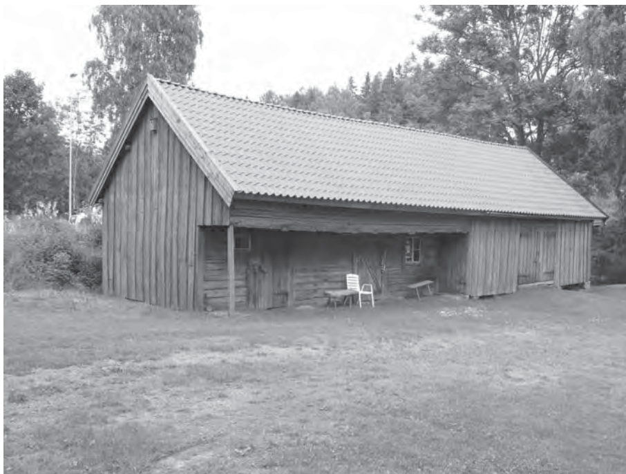
Ladugård med skonke. Skonken var en gång mellan fähuset och ladan så man kunde gå under tak när man bar in fodret till djuren.