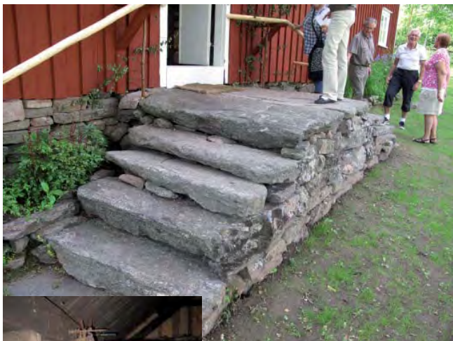
När vi satt och lyssnade hur man jobbar i Södra Ving fick vi en känsla av att här är allt högt i tak. Men så fick vi gå upp för den gamla trappan då fick vi en annan bild av verkligheten. Inne i den gamla njälarbostaden är de inte högt i taket. Uppe på vinden finns det ett museum. Det Du ser på bilden har förmodligen varit en förrådsplats för matvaror.