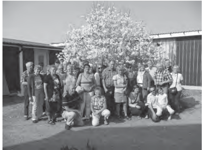
Kaffepausen hos Café Magnolia var uppfrioskande för både kropp och själ.