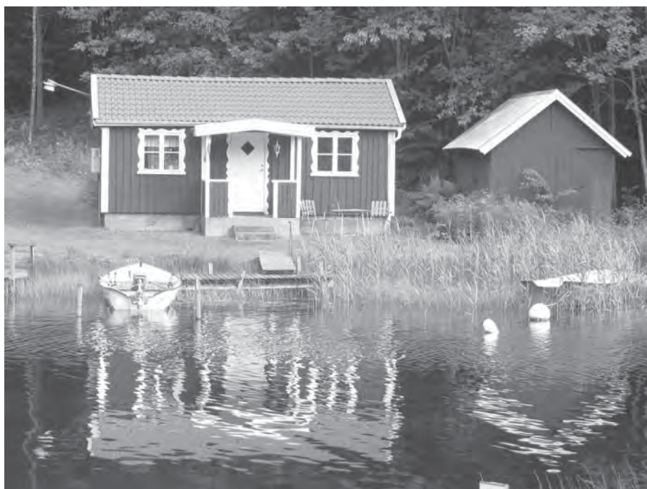
Bastun blev utställningshall. När hembygdsföreningen tog över bastun blev den en plats för sammanträden men även en plats för miniatyger.

Ett stort arbete har lagts ner på att identifiera personer