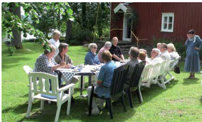
Tårtkalas i S Ving när Västgötabygden kom på besök.