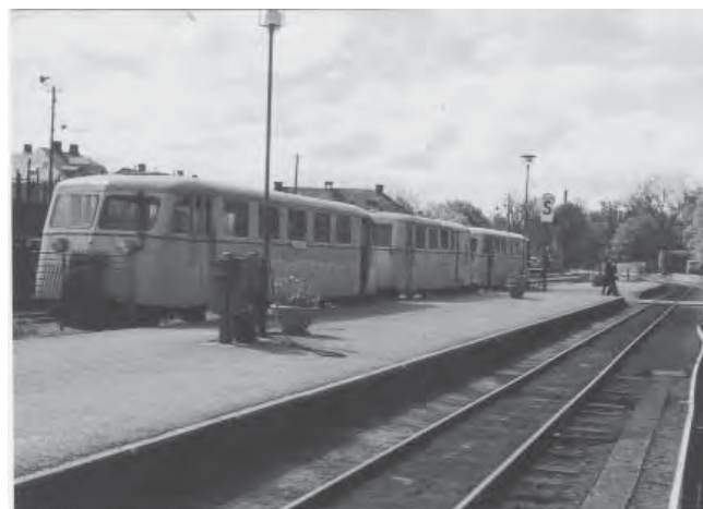
Môsa-Maja vid perrongen i Mariestad efter avslutad tjänst.

Môsa-Maja var ju folkets namn på tåget som trafikerade linjen Mariestad–Moholm. I början var det ett ånglok som döpts till Maja. Och eftersom hon passerade Jula mosse fick hon prefixet ”môsa”, vilket ju mossen heter i dialektal version. Under tidigt 1940-tal ersattes ångloket med en dieseldriven rälsbuss, och även den fick förstås heta Môsa-Maja. Men Karl-Olofs många minnen av tåget