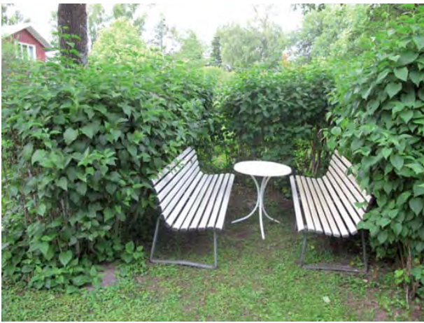
Sitter man i syrenbersån har man en fin vy framför sig där sjön Tolken blir ån Viskan. Har man tur kan man få en tårtbody av föreningens tårtbodyexpert.