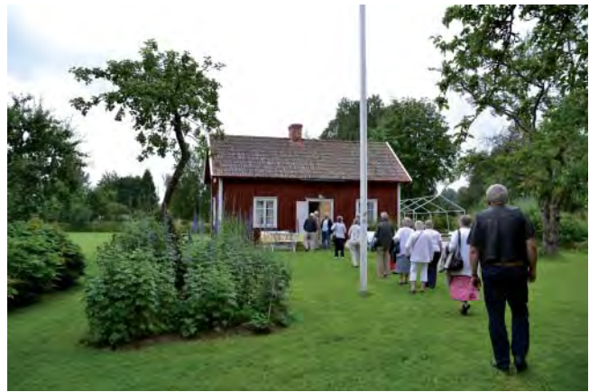
Gäster på gång. Valby Sörgården var målet för Rackeby Fornminnesföreningens utflykt.