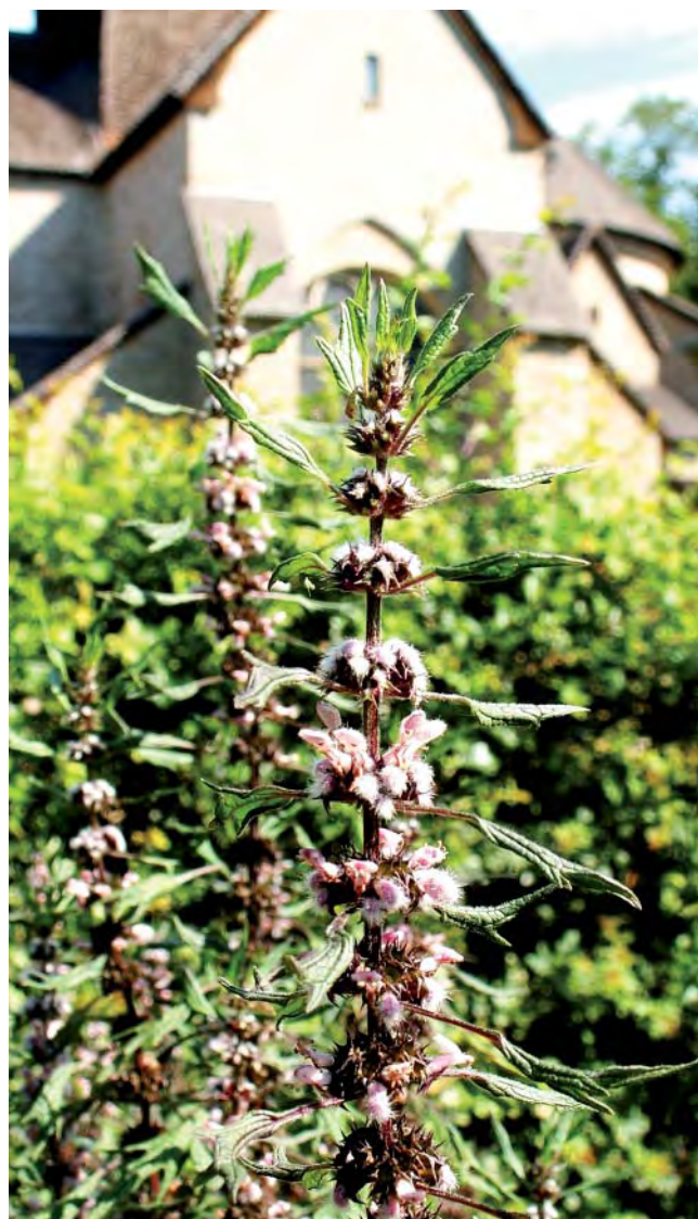
Hjärtstillan skall ha lugnat oroliga hjärtan och botat melankolin.

Hur som helst så påpekas det även i reklamen för växt-