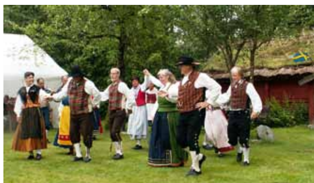
Essunga folkdansare lyste som vanligt av glädje när de dansade.

Lotus Europa 67, ägd av Hans Bahrenfuss, Essunga.