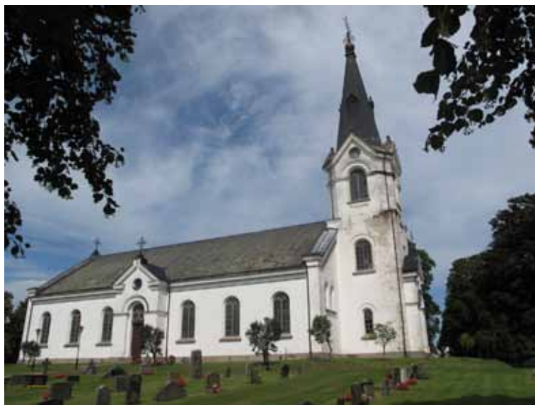
Hassle kyrka är en av de få som har tornet åt öster.