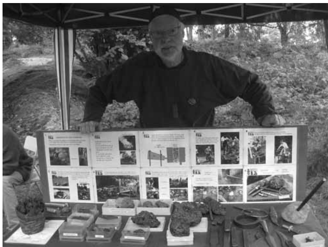
En av "vikingarna" vid ett bord med bilder och material från järnframställning.

Söndagen den 28 augusti arrangerade Kinna Hembygdsförening sin traditionella Hembygds- och Familjedag i Mariebergsparken i Kinna.