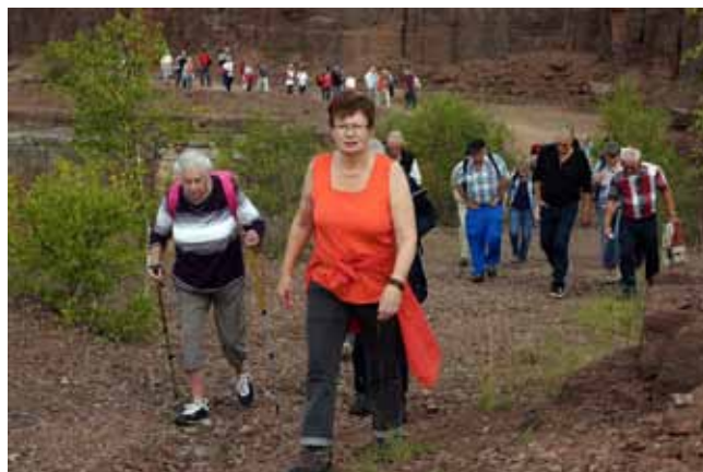
Vandring från Stenbrottet upp mot gården Rustsäter.

Text Roland Antehag