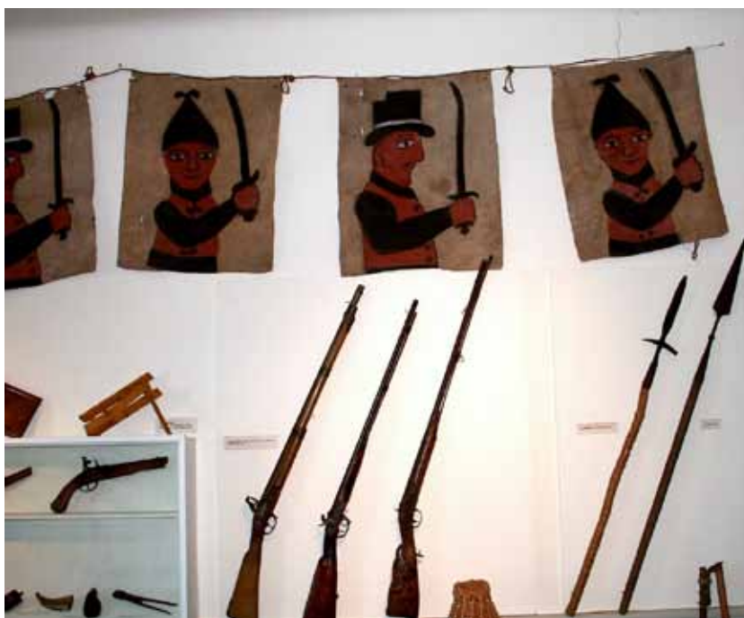
Skrämmande konst. Varglapparna på Vadsbo museum skulle en gång hjälpa till att hålla vargstammen nere.