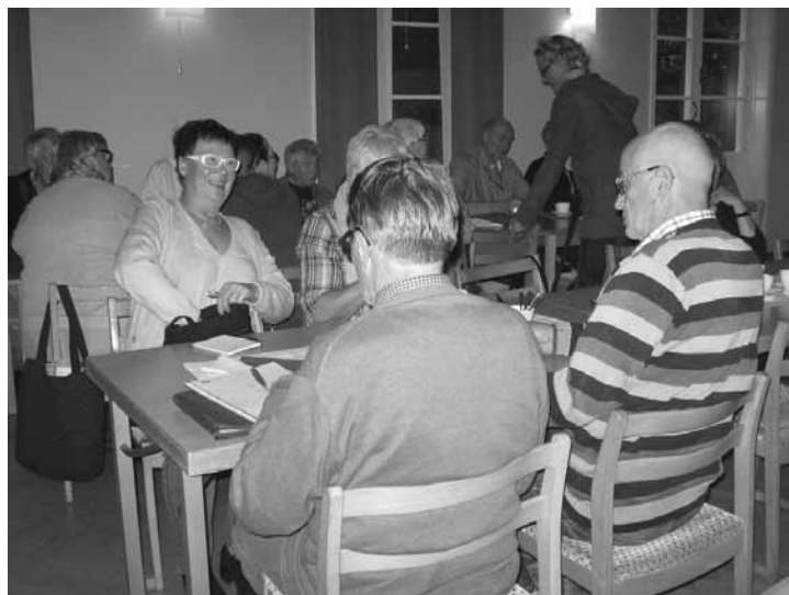
Samtal pågår. En bild från träffen i Västra Tunhem.