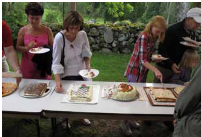
Visst är det festligt med hembakade tårtor till eftermiddagsfikat en sommarlördag.