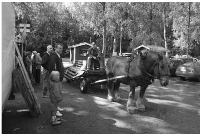
En åktur med häst och vagn är en upplevelse.

Trestads center är ett industri- och affärsområde, som ligger där städerna Trollhättan, Uddevalla och Vänersborg möts.