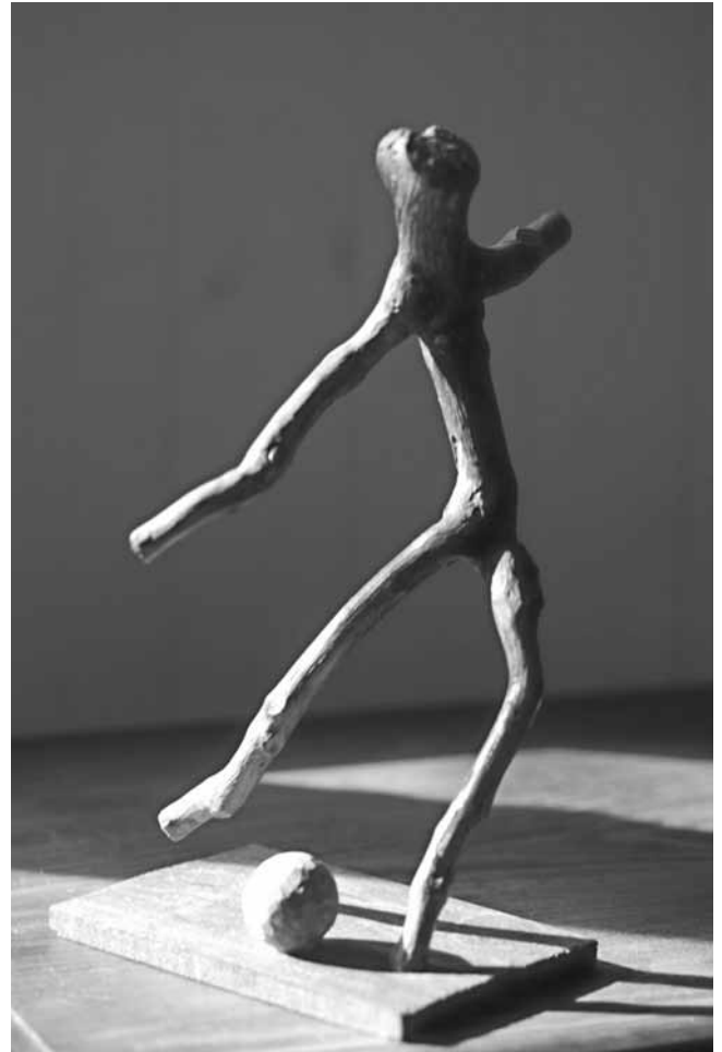
En naturlig dansös.