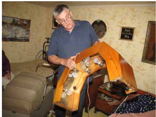
'Solarium' modell äldre. Om frun ville bli solbränd fick gubben föra 'solariet' fram och tillbaka över frun.