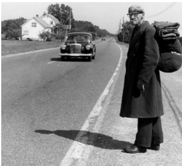
dä ä en luffare på jaert!