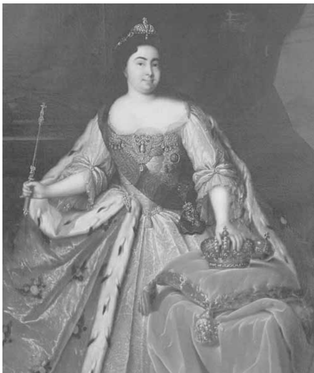
Katarina , en vanlig flicka från Toarp?

Den fattiga och föräldralösa flickan från Toarp i Västergötland som blev kejsarinna, maka till Peter den store, mannen som skapade det moderna Ryssland. Visst är det en romantisk och söt historia av bästa veckotidningsmärke. Men kanske är det lika rätt att tala om den stackars flickan som drabbades av krigets våldtäkter och gick som en vandringspokal bland segerherrarna.