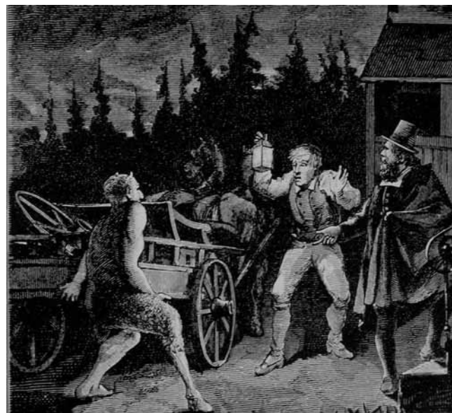
Förklaringen. Hin Onde själv tvangs ersätta ett borttappat hjul när biskop Svedberg skulle resa till Brunsbo.

Biskopens bokkammare var säkert välfylld före branden, han var flitigt att skriva och höll sig med ett eget tryckeri i Skara. Bland annat sammanställde han en psalmbok, som dock underkändes som varande icke renlärig. Men i vart fall psalmen Herre signe Du och råde, som skrevs