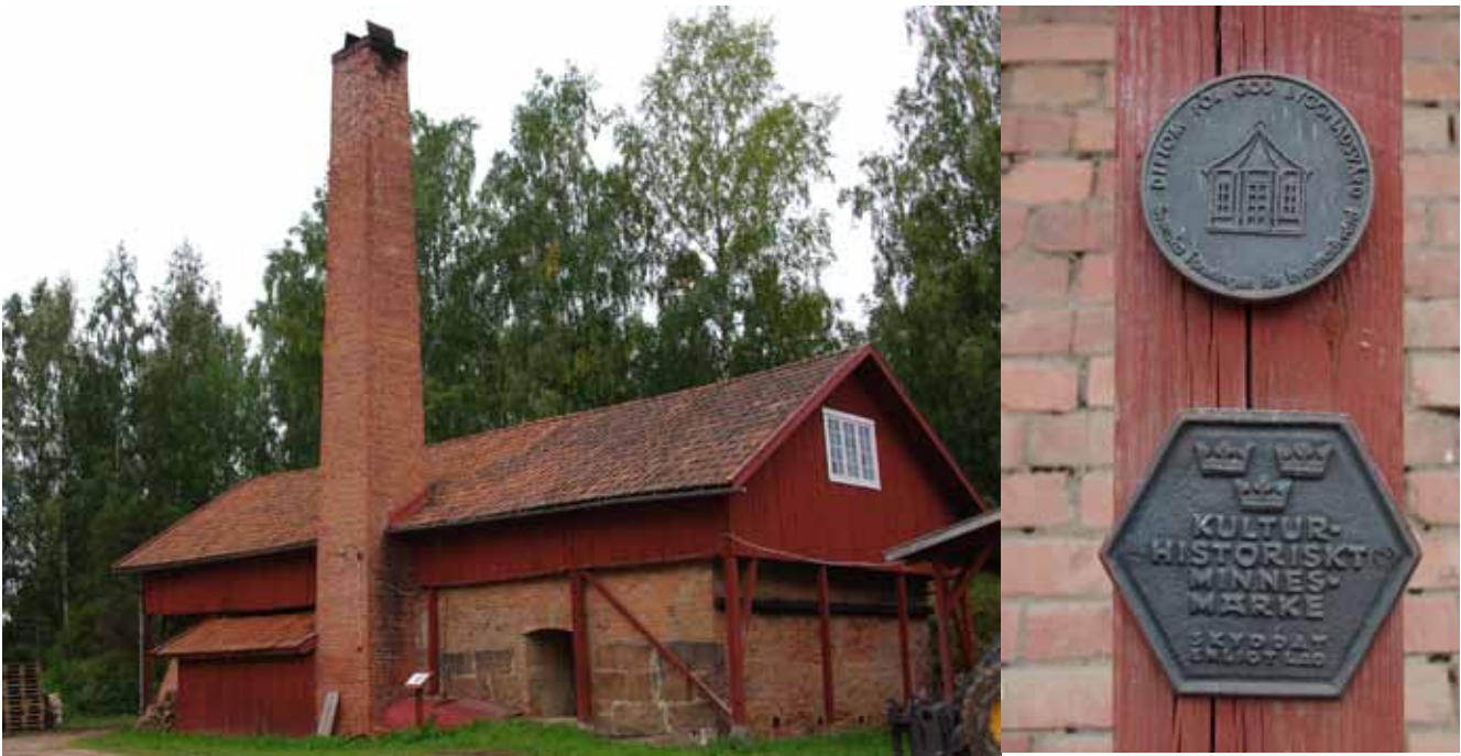
Horns Tegelbruk räddades av en eldsjäl.