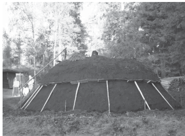
Kolmila på Hunneberg av senare datum.

Så länge månen sken gick det väl bra, men när den