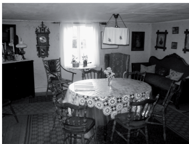
Finrummet på Kyrkebol. På julaftonen samlades familjen i finrummet. Bilden är tagen cirka 100 år senare.

Det var först och främst den stora järngrytan med