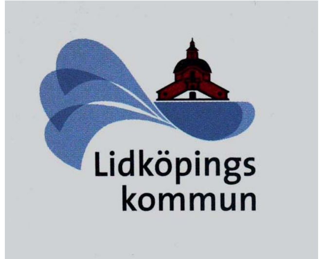
Vågen. Idag gör Lidköping vågen mot turisterna, och vid sidan ses gamla Rådhuset.

Numera kallas han förstås på amerikanskt vis för Santa Claus, eller bara Santa. Men det är nog inte som tomte han har blivit en symbol för Lidköping, och en