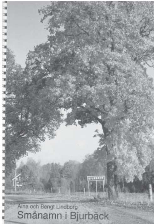
I Bjurbäck hittade man 800 olika smånamn som nu redovisas i en bok.

Det är en föredömligt välorganiserad bok där man kan söka namnen i flera olika register, och finna dem kommenterade både utifrån karaktären på namn och rent geografiskt. Men det roligaste är förstås de många förklaringar till de gamla namnen som ges. Inte minst exempel på hur namnen kan leva kvar även efter att orsa-