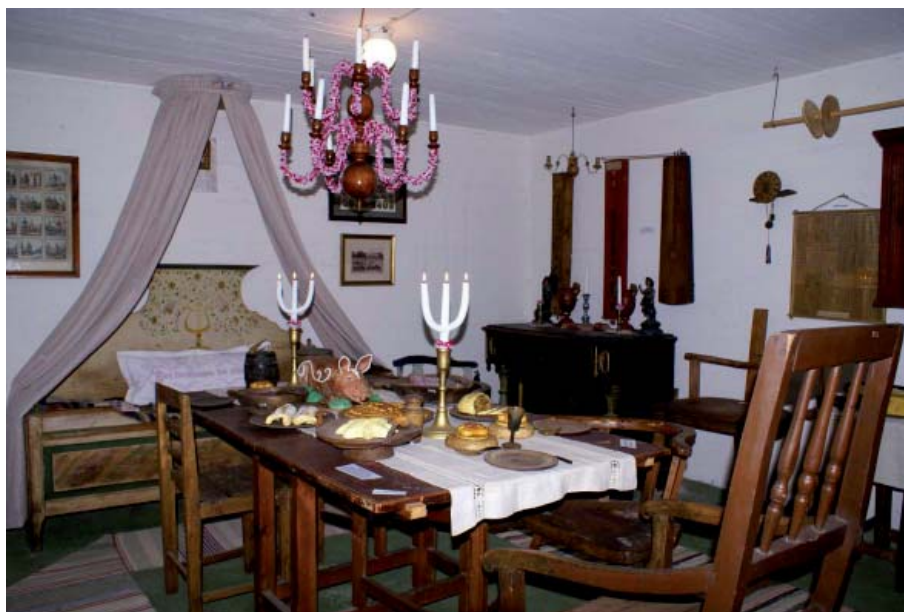
Godhjärtad mora. Kanske var det från ett liknande här dignande julbord som Mor på Heden delade med sig.

Det är dagen före julafton 1870. De flesta förberedelserna är man färdig med. Man har bryggt juldricka och man har slaktat och bakat. Nu återstår endast städningen. Husets kvinnor håller som bäst på med skurningen. Man tager sand och strör ut på golvet, tager sedan trämbaret med vatten samt granristvagan, och så skuras det.