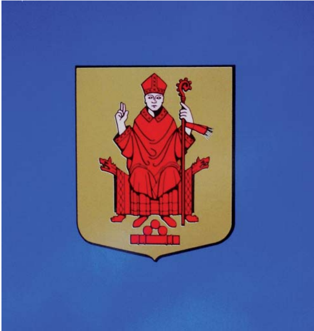
Jultomten. Sankt Nicolaus lyser på en gammal skolbok från Lidköping.

Länge var tomten Lidköpings egen symbol som syntes i alla sammanhang. Nu har han petats undan till förmån för gamla Rådhuset och en jättevåg, som möjligen kan locka surfare. Den symbolen syns numera i alla kommunala sammanhang, medan den gamle tomten – eller Sankt Nicolaus om det skall vara fint – inte får vara med och lysa bland alla moderna tomter i juletid.