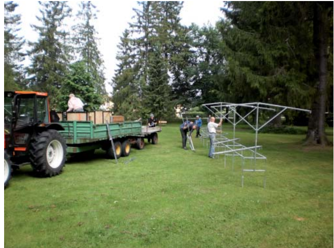
Uppbyggnad. Det krävs mycket arbete för att atälla i ordning inför slöjdmässan i Hjo.

Grevbäcks Hembygdsförening anordnar sedan drygt 30 år Slöjdmässa i Hjo Stadspark. Mässan hålls alltid fredagsöndag andra helgen i juli. För att allt skall fungera, så bra som möjligt, krävs mycket arbete. Det börjar med att priser och vad som skall gälla för mässan fastställs i oktober-november.