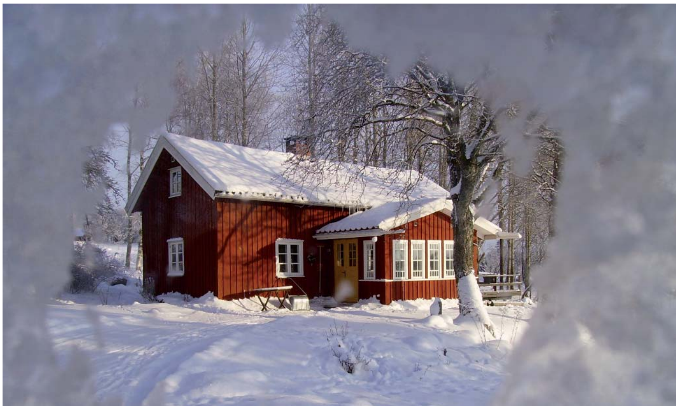
Vinterskrud. Torpet Korsberga en solig vinterdag

Vi fortsätter vår serie om vad de gamle hade för uppfattning om årets olika månader.