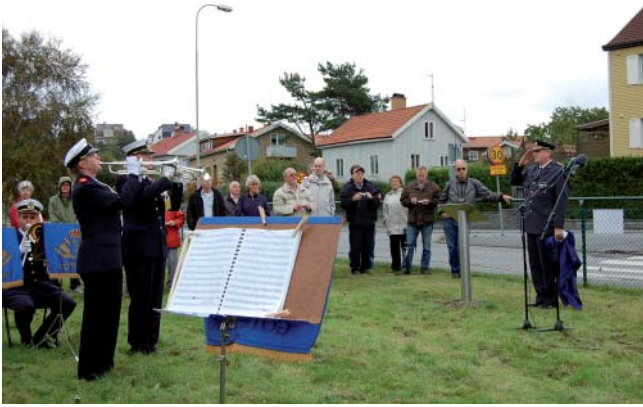
Pompa och ståt var det när Göteborg Radio firade 100-årsjubileum.