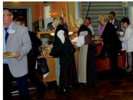
Utspisningen av lunchen i Tidaholms stashotell