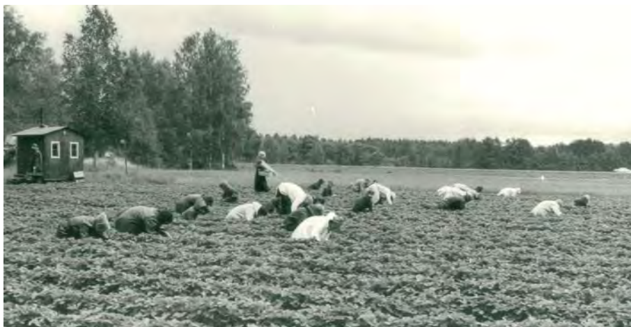
Joordgubbsland i Finnerödjatrakten för cirka 40 år sedan. Foto Nerikes Allehanda. Finnerödja Hembygdsförening disponerar en rad jordgubbsbilder.

Andra året i Finnerödja fick jag bo på andra våning i stationshuset, där en av stationskarlarna och hans familj bodde. En lördagskväll ropar tågklararen (stinsen) att jag skall komma ner. I väntsalen satt en grupp engelsktalande flickor. Eftersom han trodde att jag var bra på engelska skulle jag hjälpa dem med tågtider till Stockholm och Oslo. Enligt min lärare på samskolan i Alingsås var mina språkkunskaper mycket begränsade, men nu skulle jag få bevisa motsatsen. Flickorna läste vid universitetet i Oxford men kom från flera olika länder,