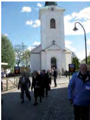
På väg ut ur kyrkan efter gudstjänsten.