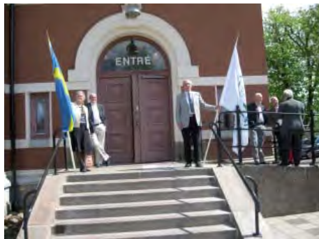
Vid ingången till stämmolokalen i Tidaholms stadsbibliotek.