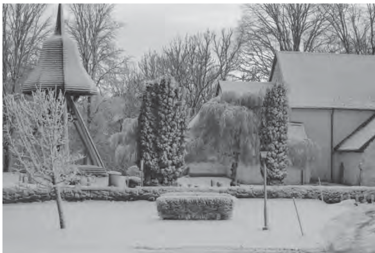
Gökhems kyrka en vinterdag.

Mitt emot kyrkan från 1100-talet ligger Hembygdsgården i Gökhem. Den byggdes i början av 1870-talet som kombinerad fattigstuga, skola och lärarbostad. Hembygdsföreningen tillträdde som ägare 1984. Särskilt på hösten är den vedeldade ugnen där populär för brödbak.