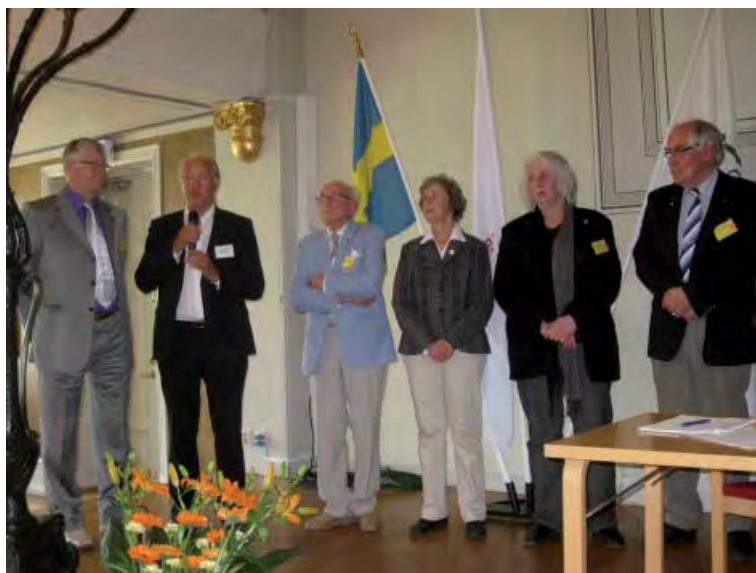
Presentation. Några av ledamöterna i den nya styrelsen.