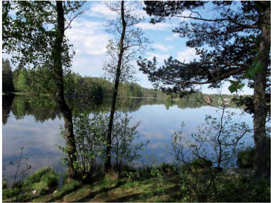
Europaväg. För våra förfäder var åar och sjöar den tidens europaväg.

Arbetsgruppen har funnit att södra Ätradalen med förgreningar visar upp ett vägnät med en urtida struktur tillsammans med hällkistor, bronsålders- och järnåldersgravar, resta stenar och kyrkor från tidigt kristnande. År 2009 upptäcktes kapellet i Södra Säm, ett av de största bevisen för bygden som en port för tidig invandring. Det äldsta beviset för en tidig invandring genom Ätradalen just Ätradalen är den så kallade Bredgårdsmannen i Marbäck, daterad till 9.800 år gammal.