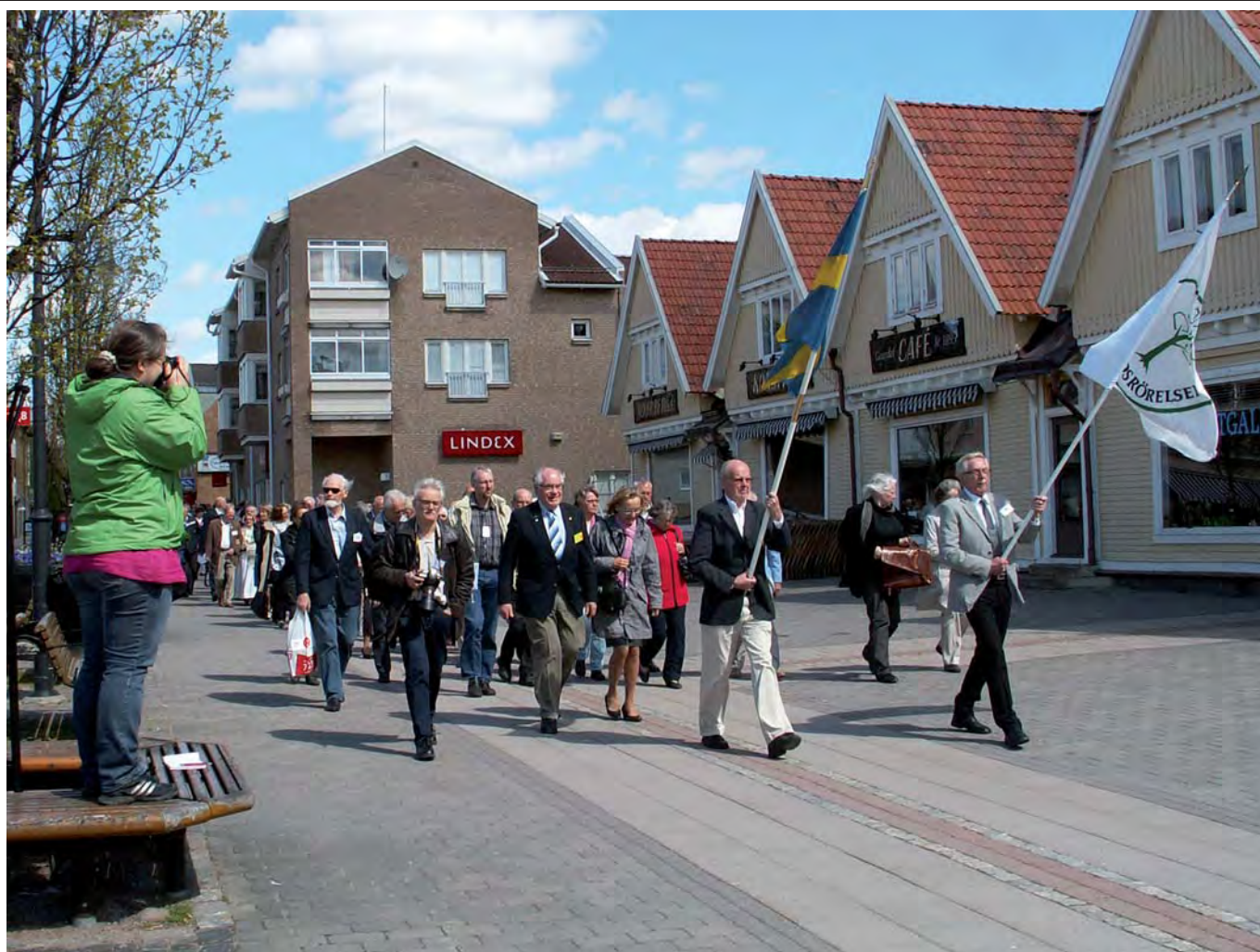
Hembygdsförbundet på marsch