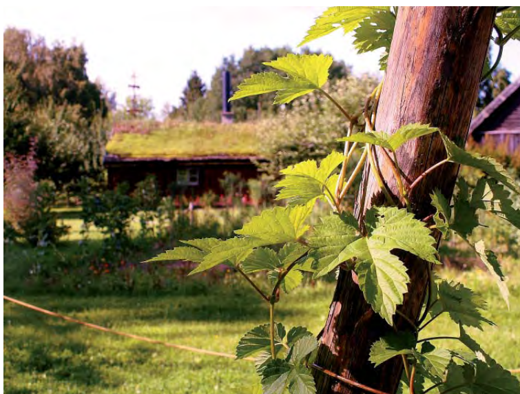
Humlestörarna var obligatoriska vid gårdarna förr.

Vid tiden för trettioåriga kriget under 1600-talet hade denna skyldighet utökats till 200 störar humle. Och det var i Västergötland de största odlingarna fanns – allra störst på Huljesten i Stenstorp där humlegården bestod