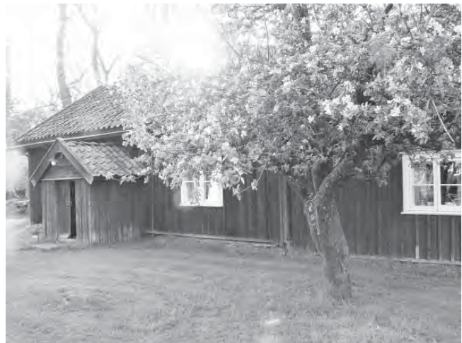
Persgården i Karleby , idag en räddad idyll tack vare Ullervad-Leksbergs hembygdsförening.

Ullervad-Leksbergs Hembygdsförening bedriver en livaktig utåtriktad verksamhet, där hantverksdagar, naturstigar, men kanske särskilt midsommarfirandet är tradition.