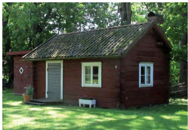
Timmerhuset är ett resultat av en studiecirkel.