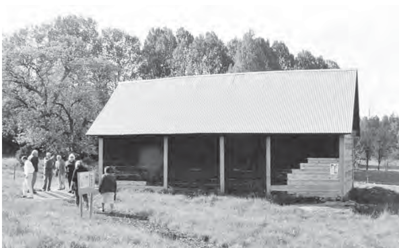
Hus med historia. Det senaste projektet är renoveringen av soldatladugården på Lorentzberg.

Tidigt började föreningen ta upp seden med gemensamt midsommarfirande, som länge funnits i Karleby. Det är ett av föreningens största arrangemang med tusentals besökare. På 1980-talet och framåt anordnades