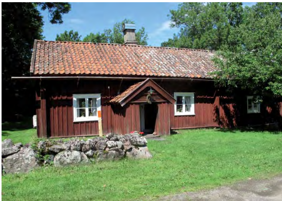
Persgården i Karleby. Här har Ullervad-Leksbergs hembygdsförening sitt hemvist.

En solig dag i juni hälsar vi på i Vadsbo hos Ullervad-Leksbergs Hembygdsförening, som fick utmärkelsen Årets Hembygdsförening år 2012. Det har regnat enormt, och det står vatten på den styva leran.