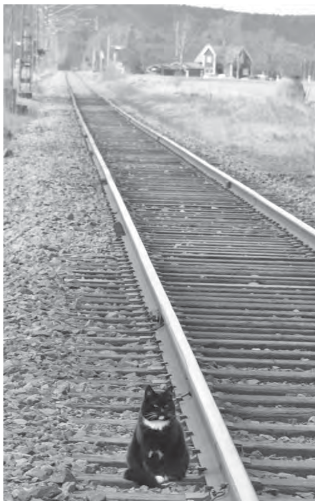
Va katten väntar han på? Tåget stannar ju inte här.

Salstad är ett av otaliga exempel på de samhällen som växte fram kring järnvägarna, fast den verkliga byggboomen kom väl kring sekelskiftet 1900, Salstad var ovanligt tidigt ute. Och medan man på andra håll möjligen kan ana den gamla järnvägsbanken i form av en ovanligt lång och rak gata så finns järnvägen kvar här fortfarande.