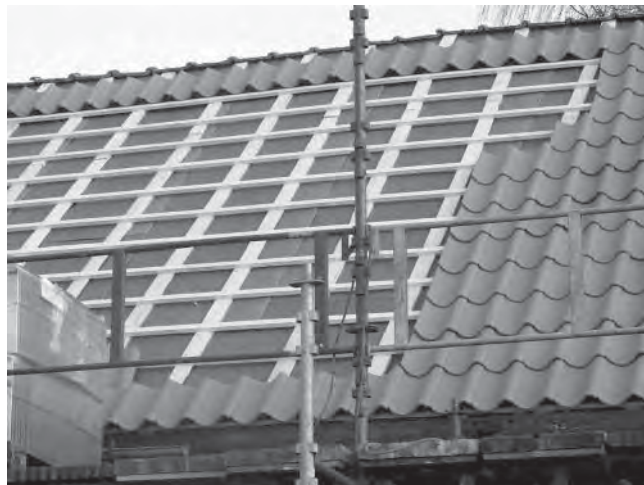
Enkupigt tegel på taket gav byggnadsvårdsbidrag.

År 2009 och 2010 sökte vi bidrag för att kunna lägga nytt halmtak. Pengar fanns att söka för hembygdsföreningar för byggnadsvård i projektet "Hus med historia". Beräknad kostnad för nytt halmtak var ca 500.000 kronor, men tyvärr fick vi avslag på våra ansökningar. Genom länsstyrelsen fick vi förslaget att istället lägga enkupigt lertegel och ansöka om byggnadsvårdsbidrag för detta. Så gjordes år 2011 och vi beviljades ett bidrag på 100.000 kronor. Total kostnad för omläggning av taket är beräknat till cirka 160.000 kronor.