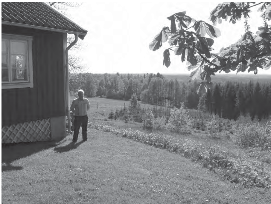
God utsikt. Från Götseredsstugan har man en fantastisk utsikt.

När Carl von Linné var ute på sin västgötaresa år 1746 red han från Borås till Alingsås upp på ”Wästgötha fjällar” i Sandhult någon mil från Borås. Om man i dag åker från Borås mot Alingsås på väg 180 är det också nu stora höjdskillnader. På Götsereds fjäll 303 meter över havet i Sandhults socken ligger Götseredsstugan, Sandhults hembygdsförenings hembygdsgård med en fantastisk utsikt. Vid klart väder kan man se TV-masten på Brudaremossen i Göteborg 60 km bort.