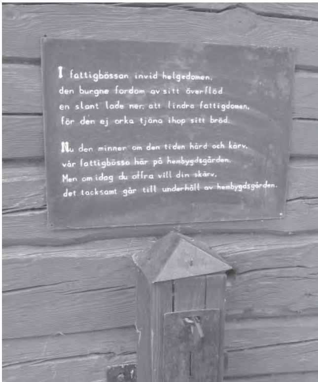
I fattigbössan invid helgedomen den burgne fordom av sitt överflöd en slant lade ner.

År 2007 anlades en örtagård med fyra kvarter, bland annat kålgårdar och en humlegård. Förr skulle det finnas 200 humlestänger till varje mantal. Örtagården anknyter till gamla tiders odling av trädgårdsväxter i Karleby. Där finns timjan, salvia och citronmeliss, som förr odlades för sin läkande förmåga, men också mer ovanliga växter som kardbenedikt och stenkyndel.