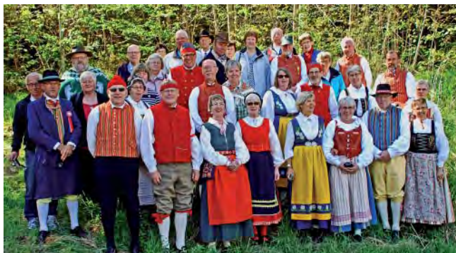
Västgötar i vackra folkdräkter besökte Oslo syttene maj.

Det har blivit tradition, att ett gäng glada resenärer, från Lidköping och Skövde med omnejd, besöker Norge på deras Nationaldag. Resmålen har växlat under åren, men i år blev det Oslo.