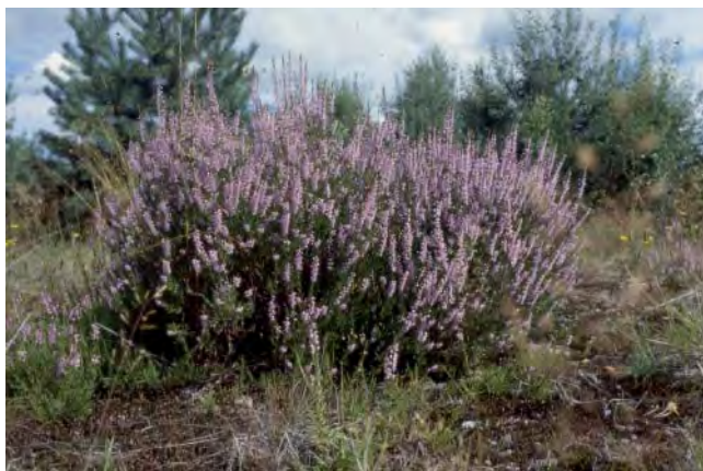
Ljung är Västergötlands landskapsblomma.

Att ha en bukett med ljung inomhus var inte bra. Det