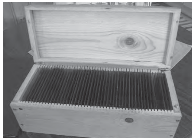
Glasplåtar. I bildarket finns också gamla glasplåtar som var föregångare till filmrullarna.

Föreningen har haft en studiecirkel som arbetat med torpinventering, och 1977 sattes den första markeringskylten upp. Cirkelns arbete resulterade 2005 i boken ”Torpen i Sandhult”, där alla 247 torpen finns med GPS-angivelser.