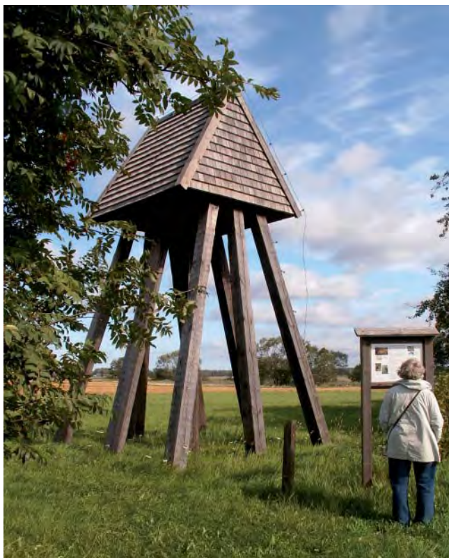
Karleby kyrka – traditionen som blev sann.

På 1980-talet genomförde Ullervad-Leksbergs Hembygdsförening ett projekt som kom att få stor betydelse för bygden och hela Västergötland.