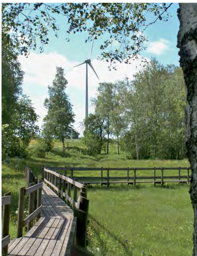
Orkidékärret utanför Dimbo satsar tydligen på miljövänlig elkraft.

En handfull knallröda ängsnycklar tittar yrvaket upp och ser mest ut som bortglömda tomteluvor. De strama vaxnycklarna har hunnit lite längre och lyser ute i kärret där de ljuvt rosa majvivorna verkar vara på väg att ge upp.