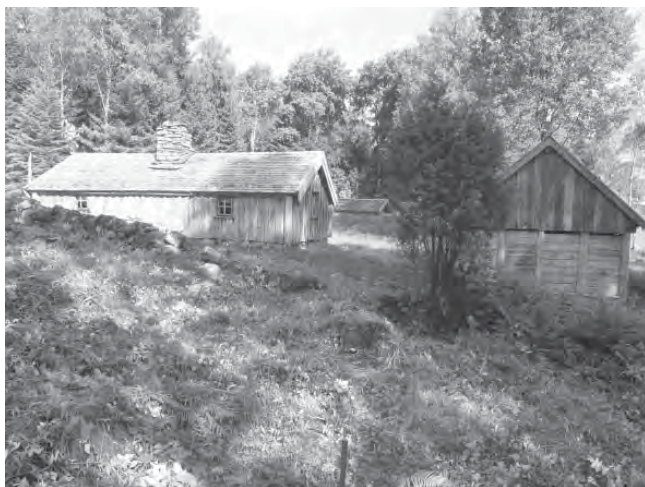
Hus med historia på Svältornas Fornminnesförenings museigård.

I Västgötabygden nummer 3-2011 berättade vi om de föreningar som beviljats bidrag för 2011 i projektet Hus med Historia. Maxbeloppet var satt till 125.000 kronor. I Västergötland var det två föreningar som beviljades 125.000 vardera. Den ena föreningen är Ullervad-Leksbergs Hembygdsförening. Den andra föreningen är Svältornas Fornminnesförening i Asklanda-Ornunga i Vårgårda kommun. De två föreningarnas projekt är ganska olika. I nummer 2-2012 kunde Du läsa om hur man i Ullervad-Leksberg renoverade soldatladugården på Lorentzberg. Här kan Du läsa om att Svältornas Fornminnesförening nu genomfört sitt arbete.