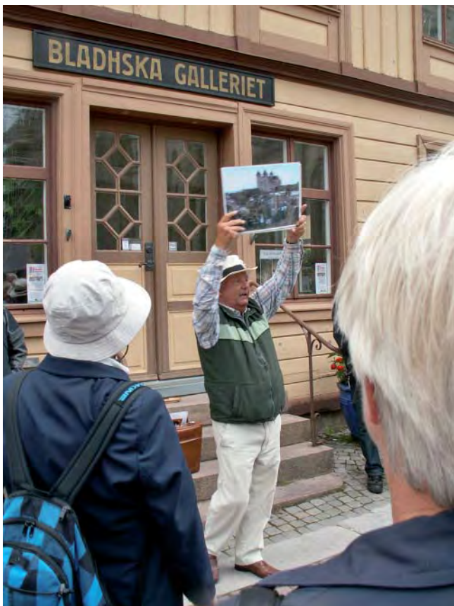
Stadsvandringarna utgår från Bladhnska Galleriet, granne med Biblioteket.