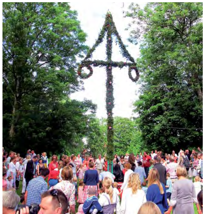
Midsommarstången är rest på Persgården.