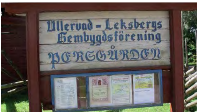
Välkomstskylt med information.