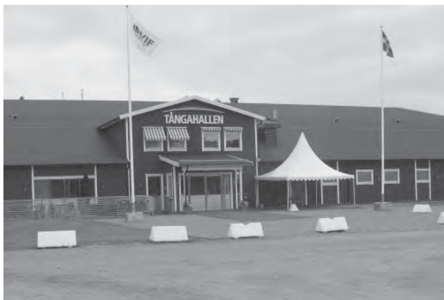
Välkommen till Vårgårdas fina evenemangshall.

Välkommen på en kulturarvsdag om samverkan och nytänkande