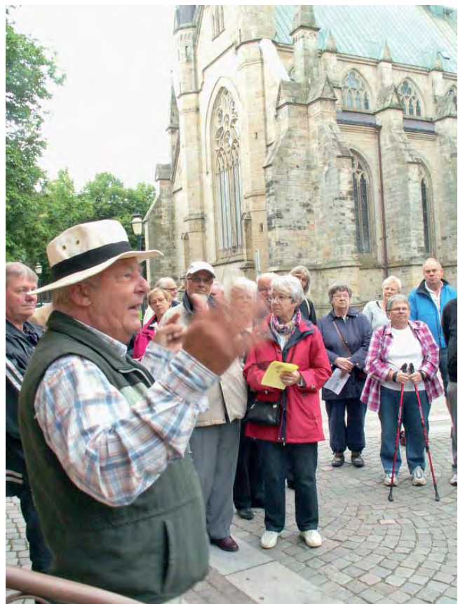
Domkyrkan är nästan alltid med i bilden när det gäller Skara.