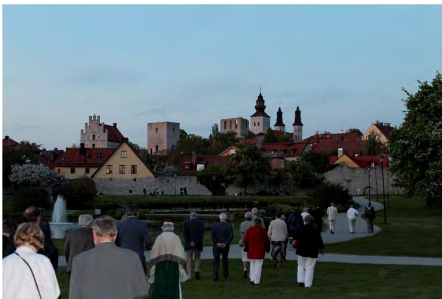
Visby. En karaktäristisk siluett över Visby.

De övriga till stämman inlämnade motionerna gällde: