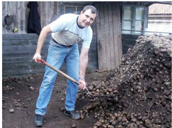
Några ton potatis blir potatisgryn och potatismjöl på maleridagen i Vänga.

En tradition i Vänga är de så kallade maleridagarna. Då startar vi upp stärkelsefabriken och tillverkar potatisgryn och potatismjöl. Vi gör slut på några ton potatis på maleridagen. I år är det den 8 september som fabriken är i gång och det blir en del kringarrangemang som vanligt. Sedan några år tillbaka äger hembygdsföreningen både stärkelsefabriken och Vänga kvarn. Kvarnen är fortfarande i drift. I anslutning till kvarnen