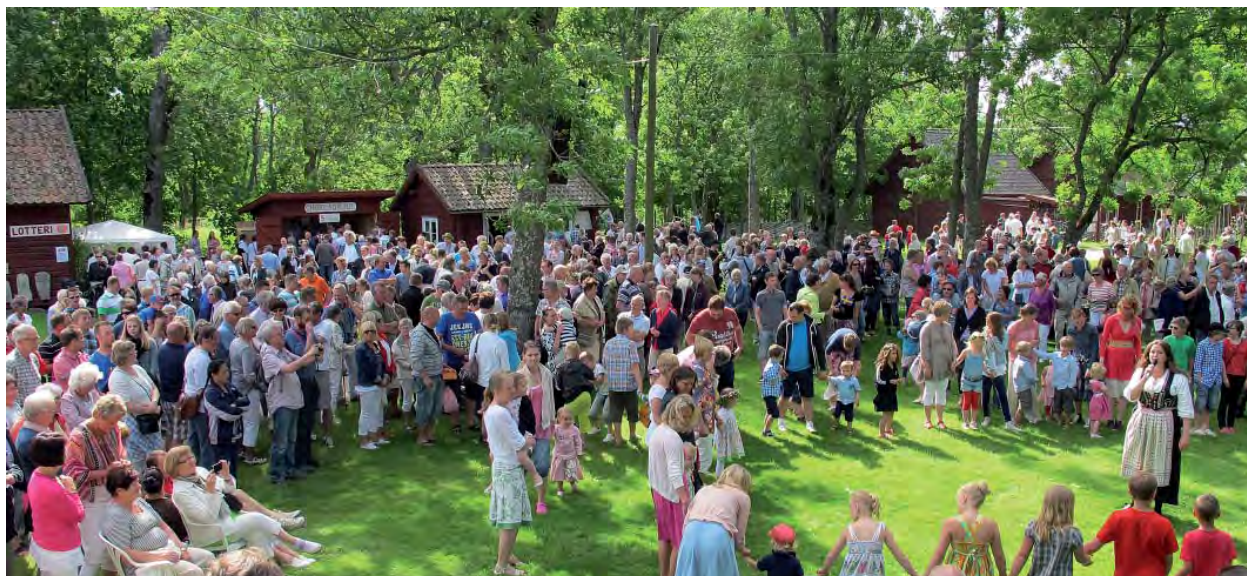
Folkfest. På midsommaraftonen samlas flera tusen personer på Persgården.