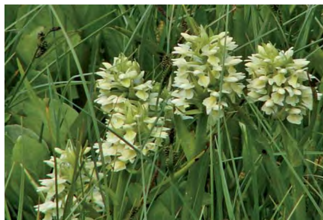
Vaxnycklarna har börjat blomma vid mitt besök.

Nu sitter jag på huk på en bred och torr träspång som utgör en hjälpanne bro över mörka vatten. Att skorna är ömtåliga med luftintag och byxorna helst inte skall blötas ned gör inget. Jag har mitt på det torra. Jag skulle rentav kunna fika här mitt i blomsterprakten, men det