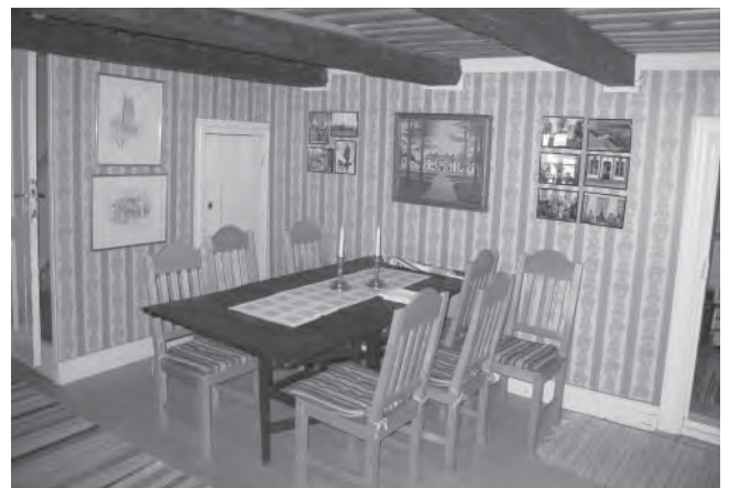
Väggarna berättar. Inne i Persgården finns det gott om bilder på väggarna som berättar om bygden.

Från en tapetfabrik i Borås fick man goda råd och en del material. Men tapeterna trycktes på Persgården av några medlemmar i föreningen. Det vidbygg-