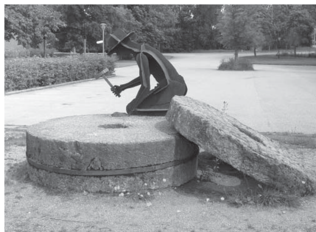
Kvarnstensminne. Ett minnesmärke över kvarnstenshuggarna i Lugnås

I egentlig mening egendomliga folknöjen är icke att omförmäla. Men under åren har inom länet liksom an-