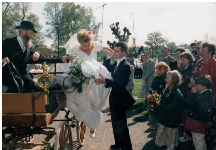
Inget upptåg. Brudgummen hjälper bruden ned från bröllopsskjutsen.

Har du frågor om arkivet eller undersökningen när