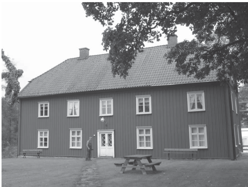
Seglora Prästgård uppförd 1793.

Namnet Seglora är ganska bekant genom Seglora kyrka på Skansen i Stockholm. Träkyrkan från 1700-talet flyttades år 1916. Den gamla kyrkogården vid Viskan finns kvar med sina fyra stigluckor, och på andra sidan vägen ligger den gamla prästgården från år 1793.