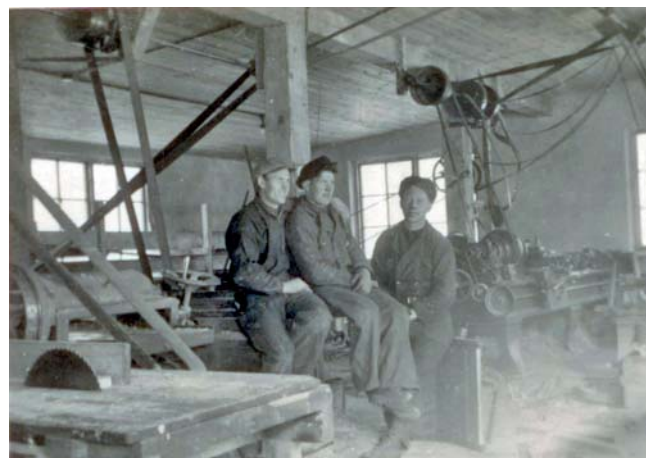
Ljrhalla Tröskverksfabrik. Många drivremmar såg till att maskinerna fick fart. Bilden från 1940-talet.

Kanske tycker både Du och jag att ljudnivån har blivit