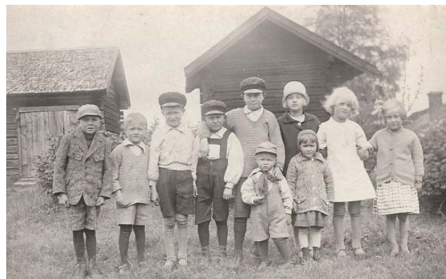
Barnaskara i sydbyn Oxberg på 1920-talet

Men ibland regnade det och då fick vi hitta på något inomhus. Det gick bra att leka gömmebo också i en lägenhet. Vi rullade in under sängar, gömde oss i garderober, smög upp på vinden. Litet dammiga blev vi