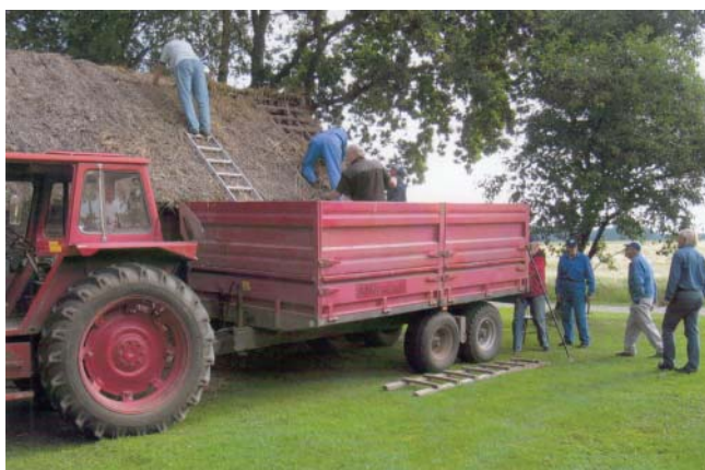
Rivning av det gamla vasstaket.

Ett sådant här arbete är kostsamt och utan goda bidragsgivare hade vi haft svårt att klara av det. Vi sökte och fick bidrag från det statliga projektet Hus med Historia, från Lidköpings kommun och från Sparbanksstiftelsen I Lidköping. Dessutom har föreningens medlemmar