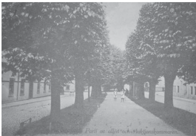
Vykort. Allégatan i Borås på den tiden den gjorde skäl för namnet. Ur Leif Josefssons vykortssamling .

Detta uttryck använde vi skämtsamt när jag var barn och vårt lilla gäng lekte på Allégatan, Sparregatan, Kvarngatan i Borås, det var vårt revir. Ibland tågade vi iväg till Annelundsskogen (som vi aldrig kallade parken) och där lekte vi rymmare och fasttagare, smög in i det förbjudna området vid det gamla vattentornet, byggde hyddor. Inne i en sådan hydda kunde vi sitta med några serietidningar som vi bytte med varandra. Det var Pigge och Gnidde, Fantomen och Karl-Alfred. Ur våra munnar stack det ut en pinne som vi snurrade på då och då och slickepinnen gav då ifrån sig en ljuvlig saft. Några hade en kolaslickepinne, som de bet tag i och drog ut så att den blev väldigt lång innan de tuggade i sig hela härligheten. Ibland bjöd vi varandra på en bit av en lakritsrulle, som hade en liten blank pärla i mitten. Godiset hade vi förmodligen köpt i källaraffären i hörnet av Åsbogatan och Sparregatan.