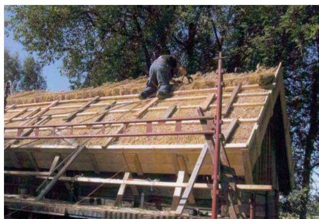
Första sidan börjar bli färdig. Reglarna på det färdiga taket är till för att skydda den färdiglagda vassen,