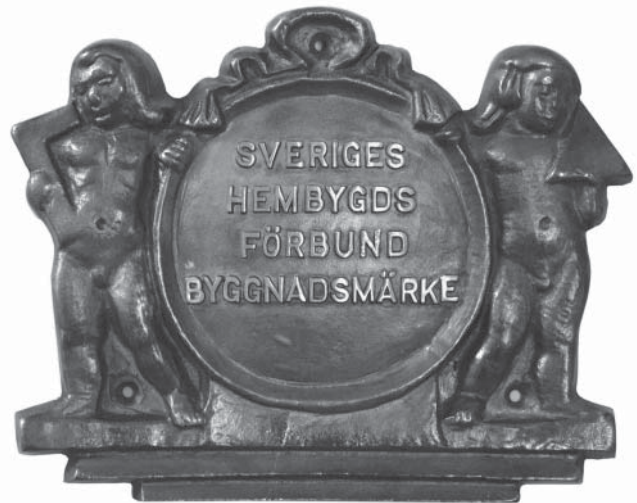
Belönade. Sveriges Hembygdsförbunds byggnadsvårdspris 2012.

Föreningen Backstugans Vänner bildades i juni 2005 för att försöka rädda Kulla undan förfall och vandalisering. Samma år skänktes huset till föreningen. Under åren som gått har en varsam renovering skett under överinseende av och med stöd av Västarvet, Länsstyrelsen, Riksantikvarieämbetet och Trollhättans Stad.