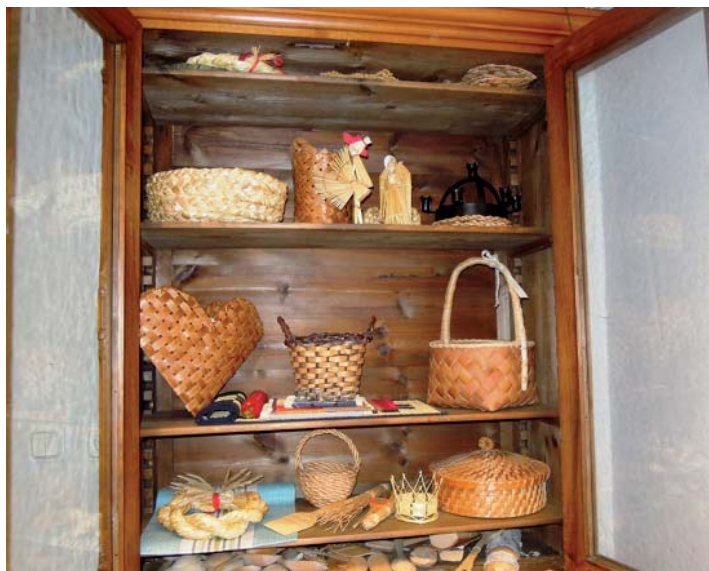
Hemslöjdsalster från bygden på Borås museum.