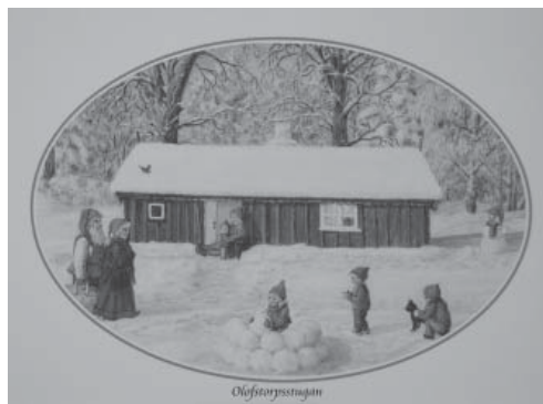
Vårt senaste julkortet.