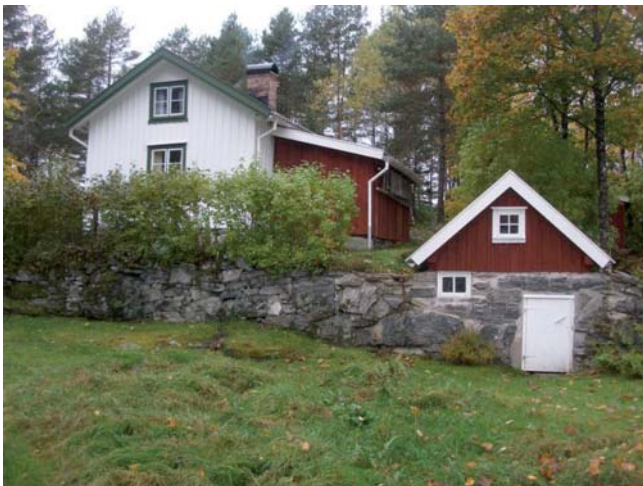
Backstugan Kulla i Upphärad med vidbyggd vedbod, samt källare intill.