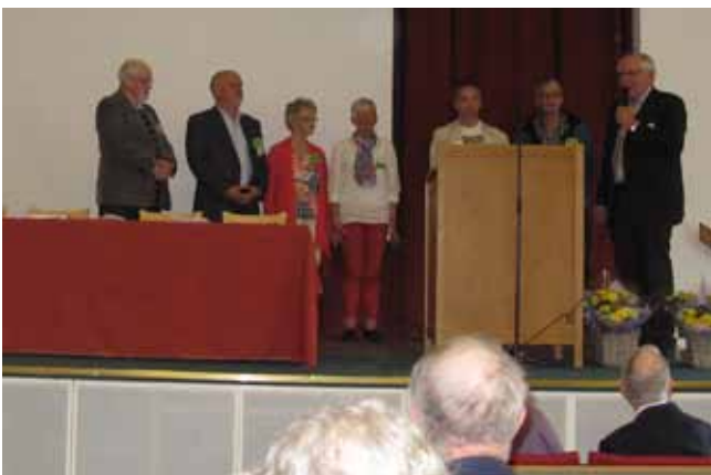
Tack och beröm. De arrangerande föreningarna fick ta emot beröm och stort tack för ett fint jobb.