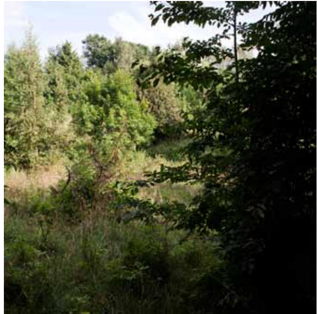
14 augusti 2012 såg det så här ut, det vill säga man ser inget av det gamla landskapet.

skall bli en bok så småningom men redan nu kan du på nätet ta del av Tores bilder då och nu och Åkes kommentarer i text om du söker på mulensmarker.se.