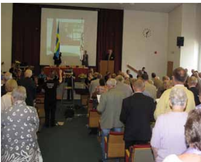
Värdigt. Traditionsenligt inleddes förhandlingarna med Hymn till Västergötland som deltagarna sjöng stående.