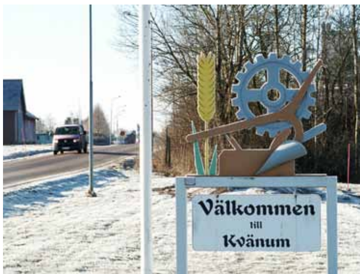
Jordbruk och industri samsas på skyltarna som välkomnar till Kvänum.

De många företagen som siktade på jordbruket medförde förstås problem. Man gjorde som förr i smedjan, hittade man något bra så härmade man efter. Men det fungerar ju inte med patentlagar. Så det kunde bli lite av vilda västern med dueller om vem som varit först med nyheterna. Striden stod het kring halmhacken, en anordning för att förenkla hanteringen av halmen efter skördeträskorna.