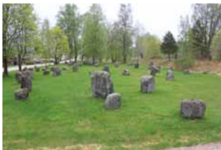
Domarringsfältet i Sjötofta.