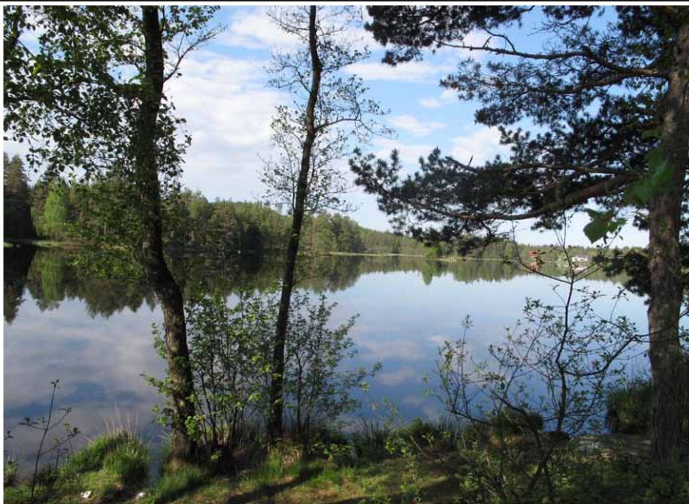
Sommarbild från Ljurs damm.