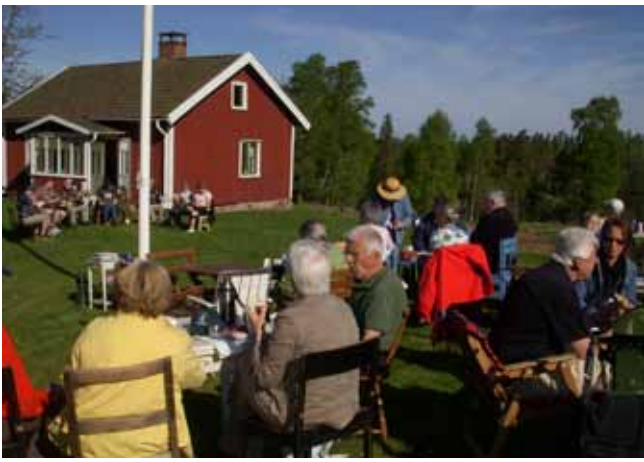
Gökotta på Dammsjöås.

förening med hälften vardera. Sedan dess har en gemensam kommitté skött torpet väl, men det har blivit få allmänna sammankomster. Torpet är genuint bevarat med mangårdsbyggnad, undantagsstuga, ladugård och några uthus. Ingen ström finns, så detta betyder gott kokkaffe på vedspisen.