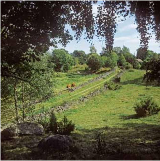
28 augusti 1984 kunde man se denna idylliska väg med stenmurar och betade marker i Skår i Gökhem socken.