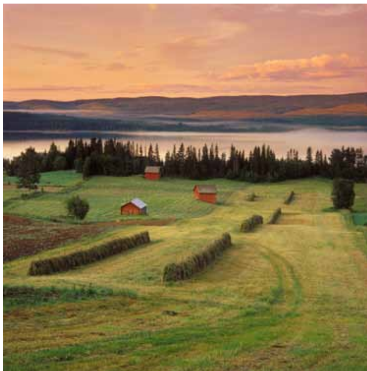
Mest publicerad. Den här bilden som är tagen i närheten av Åreskutan i Jämtland är Tores mest publicerade bild.

Vem är Din förebild som fotograf? Vilken är Din bästa