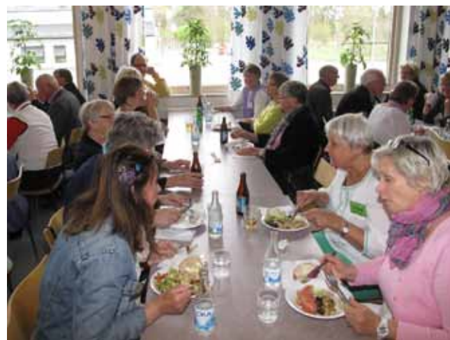
Smaklig måltid. Tranängsskolans matsal var en trevlig restaurang med god mat och god service.