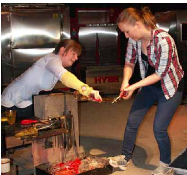
Glasblåsare i Glasets Hus.

Stämman hade anordnats av hembygdsföreningarna i Tranemobygden och inleddes i Limmared, där Glasets Hus var huvudattraktionen. Flera visningar ägde rum under förmiddagen, och stämmodeltagarna kunde registrera sig från kl 8.30 i en närliggande lokal, vilket innebar att inga köer uppstod. I lokalen hade också hembygdsföreningarna sina utställningar. Ljungsarp visade sina bleckslagartraditioner med till exempel en gammal bärplockare och en portör. Länghem visade 1950- och 1960-talets industri med textil och jalusier. Tranemo är känt för sin järnframställning med bland annat rödjord som råvara. Den kan innehålla 60-65 procent järn. Det finns olika typer av ugnar som grop-, schakt- och självdraugsugnar. En utställning om kyrkoherden på 1800-talet i Tranemo Anders Elgqvist, som varit missionär i Kina och kunde 13 språk, väckte intresse liksom den nyutkomna boken om hans liv. Limmareds hembygdsförening visade kläder från mors och mormors tid. Ambjörnarps hembygdsförening berättade om scanning av glasplåtar och om äldre bilder och Mossebo om sin träkyrka och om Mossebo Stom.