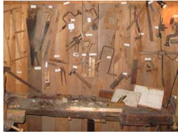
Snickarbo. Det finns gott om gamla verktyg i snickarbo. Prydligt på plats och numrerade.