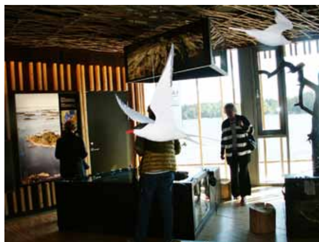
Turister. Riktigt långväga turister svävar i taket