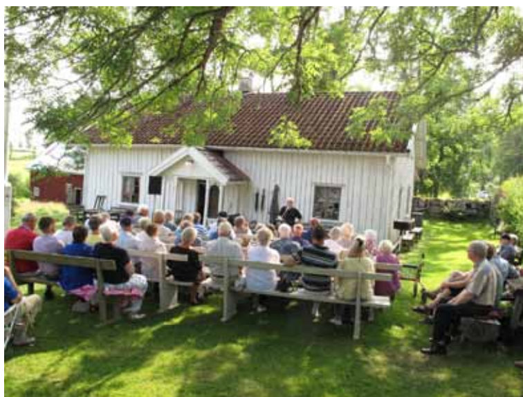
Skön plats. Lördagssamlingarna på Kyrkebol är populära och bjuder på ett varierat program.

I mitten av 1930-talet pratade man om kris i befolk-