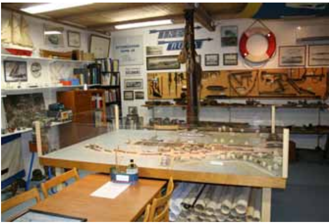
60-talsmodell. Så här såg Otterbäck+ens hamn ut på 1960-talet.

2010-11 färdigställdes inredningen och flytten påbörjades. Arbetet utfördes till största delen av kunniga medlemmar, hjälpsamma och skickliga hantverkare utförde arbeten som inte klarades av med egen kraft. Lokala leverantörer gav också goda rabatter på material.