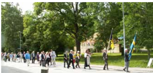
Fornminnesföreningen på marsch mot framtiden och museet.

På fornminnesföreningar ställs förstas speciella krav så när Västergötlands fornminnesförening jubilerade handlade det om 150 år. Starten skedde i Skara den 11 juni 1863, och nästan på dagen 150 år senare firades detta i Skara, bland annat med en utställning över sig själv på museet.