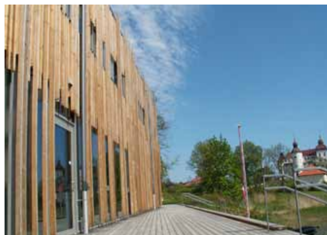
Kontrast. Om greven tittat ut från ett slottsönster hade han nog retat sig på "rishögen" borta på stranden.

Annars finns där massor av tillfällen att lära även för oss äldre. Via en rad TV-skärmar kan vi välja att informera oss om olika företeelser i och kring sjön, men också om berg och annat intressant naturligt. Fast jag måste erkänna att jag denna ljuvliga dag föredrog utsikten över den solbelysta viken, det var naturinforma-