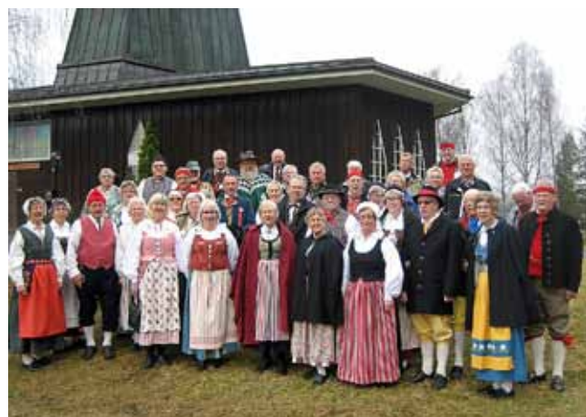
Finklädsla. Västgötar som firade Norges nationaldag.

17 maj började med flagghissning till blåsmusik och kyrkobesök i Tingnes kyrka. Salut och Flaggborg. Fagernes Musikkorps angav tonen i Barnetåget med härlig Marsch musik, från Nord-Aurdals skola till Valdres Folkmuseum. Gatorna kantades med många norrmän i sina vackra dräkter som "gratulerade med dagen". Valdres Folkmuseum, en otroligt vacker plats, med utsikt över vattnet, underhållning och tal på "amfiet på