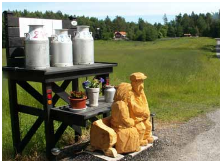
De möttes vid mjölkabor't.

Här finns dessutom ett åldrat par sittande vid mjölk- bordet, de kanske möttes där för 60 år sedan. Bordet