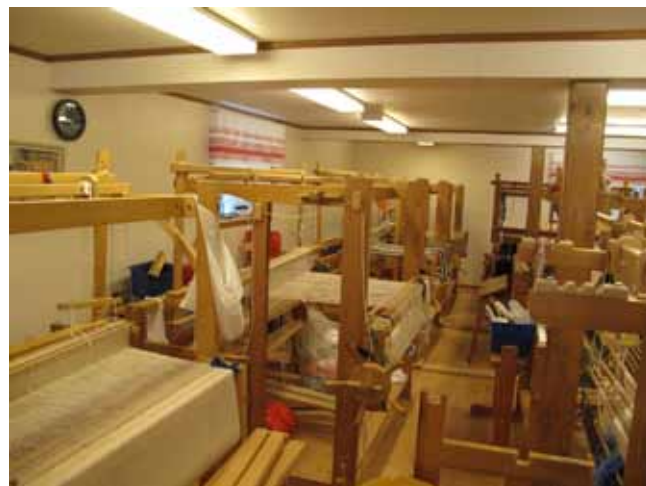
Vävstugan. Fähuset blev en praktisk vävstuga.

Vidare visas stenmangeln i gång, och det finns en loppmarknad. En gammal ”Grälle”, en Fergusonstraktor har fått ett särskilt utrymme, och där finns också en del äldre jordbruksmaskiner.