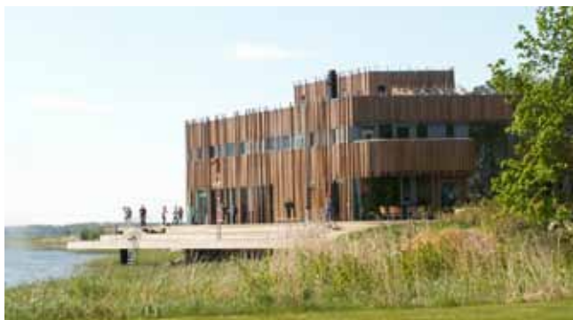
Fågelbo. Som ett kungligt fågelnäste ligger Victorias Naturrum vid Vänerstranden.

Om greven tittat ut genom ett fönster på Läckö slott hade han sett en hög med pinnar som ett jättelikt fågelbo en bit bort på stranden. Förmodligen hade han ropat på en betjänt för att få skräpet bortstädat, och hade han hört att rishögen var en födelsedagspresent till Sveriges kronprinsessa hade han fått ett utbrott. Så behandlades inte kungligheter på hans tid.