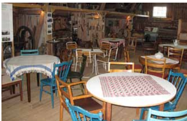
Rännet. Mitt på rännet finns fikaborden och utmed väggarna finns det gamla bruksföremål.

Hembygdsföreningen har under många år odlat lin som sedan beretts till garn, ofta tillsammans med elever vid Sjöbyskolan. Marbolärft omtalas redan på Gustav Vasas tid.