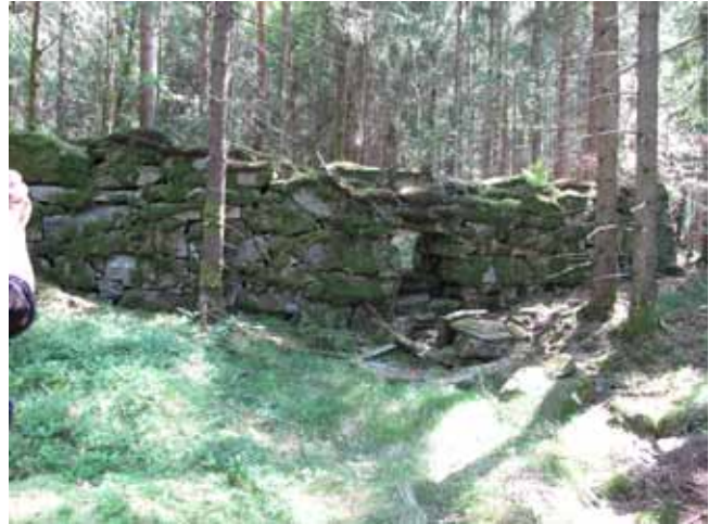
Dämnet. För att få ett vattenmagasin hade man murat upp en damm istället för att lägga upp en jordvall.

Ekarebo kvarn byggdes först högre upp utefter ån