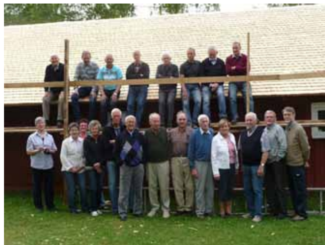
Belöning. Arbetslaget samlat för fest efter avslutat arbete.

Men styrelsen ville bygga mer. Ett uthus byggdes och ytterligare en fällfärdig ryggåsstuga ”Liljas stuga” i Södra Säm skänktes av ägaren och byggdes upp i Hembygdsparken. Samtliga i styrelsen ställde upp som borgenärer för ett skuldebrev på 30.000 kro-