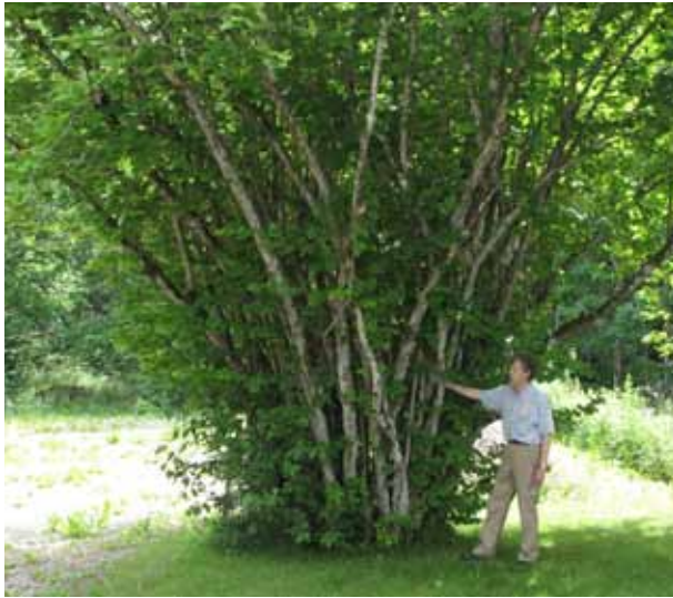
Cirka 4,5 meter. Då är den här busken 400 år? Om en buske växt upp i lite bättre jord, växer den snabbare, men den är nog 150-200 år, tror Åke.

och Åke. Sedan bar det av till Asklanda kyrka och här poserade Åke mellan ett par ekar från 1600-talet. Åke frågar mig om jag vet på vilken säregen plats vi står. Jag dröjer lite med svaret, men då berättade Åke att Asklanda kyrkogård är den enda i landet som har ekar planterade på 1600-talet runt kyrkan. Men han tycker att det är dags för lite gallring runt omkring för ekarna behöver ha ett avstånd på fem meter från kronan till andra trädets grenverk.