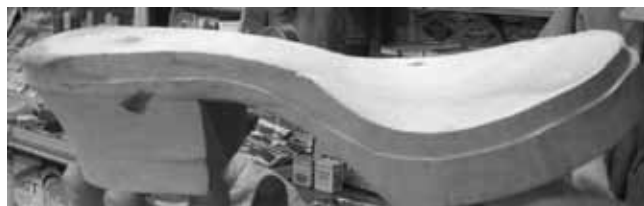
Toffelbotten. En viktig handelsvara fram till 1960-talet.