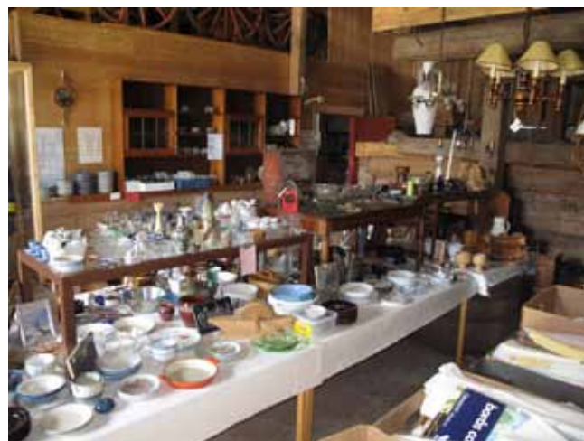
Loppis. Under några sommarveckor har man loppmarknad på logen.

Ladugårdens fähus har byggts om till vävlokal. Ett 20-tal vävstolar får plats, och Studieförbundets kursverksamhet flyttades till Klockarebolet 1994. Två grupper är i verksamhet varje vecka under terminerna. Strax intill finns en slöjdlokal, och för skolbarnen finns det under till exempel sportlov möjligheter att syssla med hantverk och bland annat tillverka fågelholkar. Föreningen har också fått pengar för att göra lokalerna tillgängliga med handikapptoilet och hiss upp till andra våningen. Ett angrepp av hussvamp har medfört behov av ombyggnad och sanering, men även det har åtgärdats på ett bra sätt.