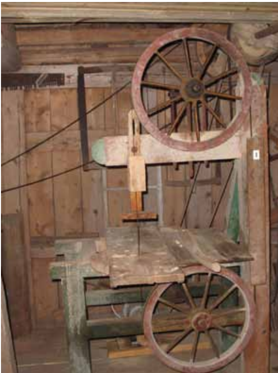
Bandsåg modell äldre.