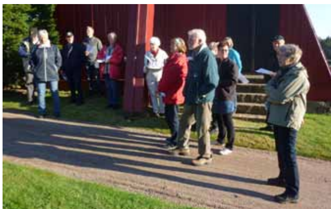
Kyrkogårdsvandring i Ljungsarp.