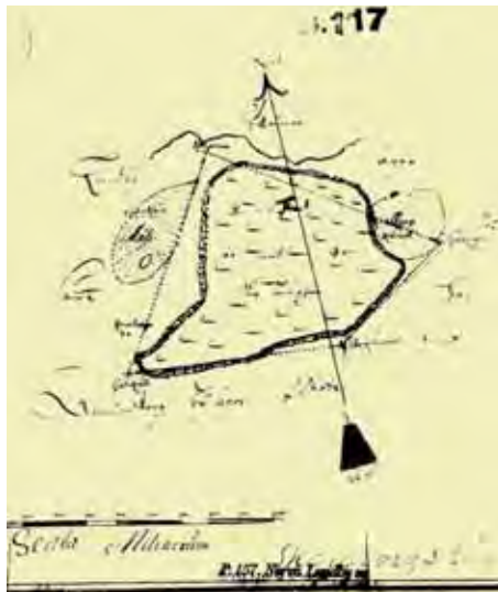
Karta från insteningen av Himmelsberget. Siftis- och Landsbiblioteket, Skara

Kronoparkens totala areal var vid detta tillfälle cirka 30 tnd, varav 24 tnd det vill säga hela höjddatån var ”bevuxen med vacker granskog.”