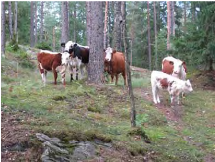
Skogsbete. Ända in på 1950-talet var det inte ovanligt att djuren gick på bete på gårdens utmarker eller en allmänning.

land var 32 kappland och varje kappland ca 155 kvm. Samtidigt skulle skogsbeståndet och marken graderas i nio olika grader. Efter graderingen kom lantmätaren fram till att varje oförmedlat mantal skulle få 53 tunnland och 25 kappland efter graderat värde. Han hade fått nästan samma graderad areal på varje mantal, och det måste ha skett genom att efteråt ändra gradering och areal. Ett tunnland full skog motsvarade ett tunnland efter gradering. \frac{3}{4} skog betydde att fyra verkliga tunnland blev tre efter gradering. De utmarker som låg närmast byarna hade ingen eller föga skog, kanske på grund av kornas betande, och var graderade \frac{1}{4} . Fyra verkliga tunnland blev ett. Mossar var graderade \frac{1}{32} , 32 tunnland blev ett efter gradering.