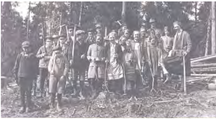
Skoldag. Många skolbarn i byskolorna fick vara med och plantera skog.

skogsodling i Ale härad till ett möte i Älvängens tingshus. I sitt inledningstal påpekade han särskilt vikten av att odla skog och framhöll särskilt det stora behovet i Ale härad. Han inbjöd till en diskussion över detta ämne och vad som kunde göras för att öka skogsodlingen.