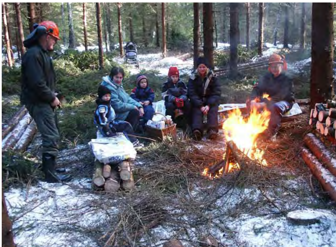
Fikapaus i skogen