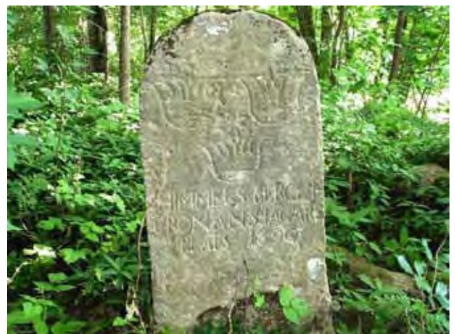
5-stenarör vid Himmelsberget.

I samband med att Carl XI startade reduktionen tillsattes även en skogskommission för att rannsaka Kronans skogar och allmänningar. Resultatet av denna rannsaking innebar att bland annat Billingen blev förvandlad från allmänning till kronopark som gränsbestämde och instenades. Vid detta tillfälle blev även Himmelsberget försett med gränsmärken. Hur denna gränsbestämning gick till finns beskrivet i Kongl Skogskommissionens Insteningsbok 1692-. Gränsmarkeringarna bestod av 5-stena rör, det vill säga 4 stenar i fyrkant och en hög hjärtsten i mitten. Dessa hjärtstenar var försedda med inskription: ”Himmelsberget Cronans Jägareplats 1690.” Diametern på dessa stensättningar var i allmänhet 1,8 meter.