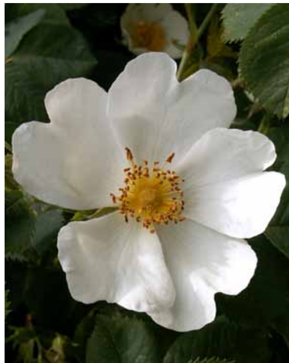
Gudhemsros. Rosens fem kronblad symboliserar Marias ärbähet, barmhärtighet, mildhet, skönhet och gudomliga glädje.