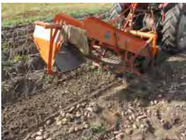
Potatisupptagare som kom på 60-talet.