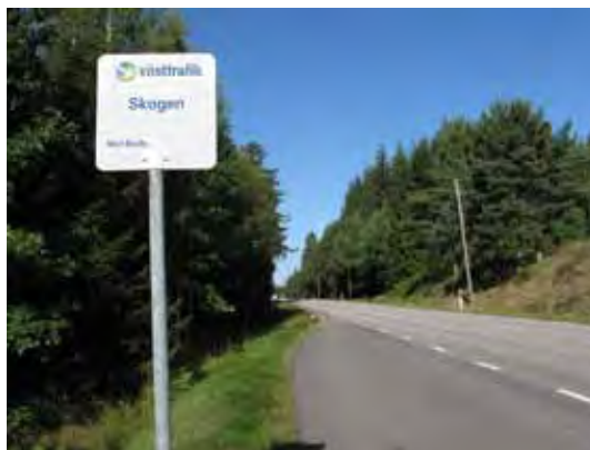
Hållplats Skogen. Detta nummer är ett temanummer om skogen.

Vilan på en liten bergknalle med långa repor efter istiden, förhoppningsvis undan mygg och knott, för tankarna till ursprunget. Det är tolv tusen år sedan isen försvann, medan de