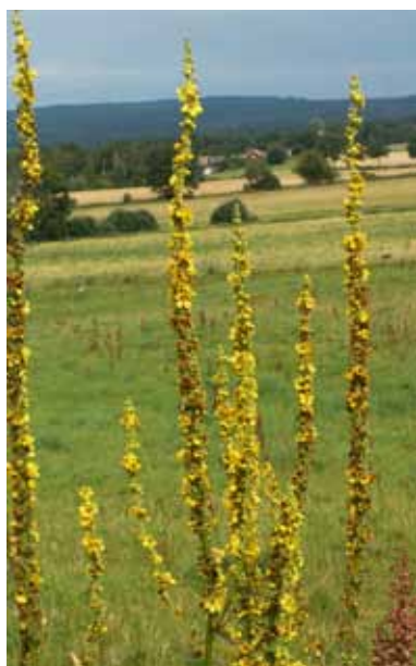
Jungfru Marie kyrkoljus är en symbol för de vaxljus kvinnor höll i handen vid första kyrkbesöket efter födseln.