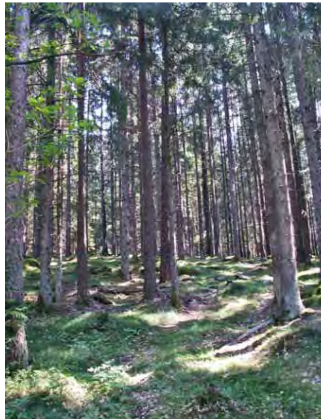
Skogen fick stort värde i slutet av 1600-talet.

Den kunnige och flitige Tivedenforskaren Ingemar Wikenros skildrade härom året dessa hårda strider i olika domstolar ingående och faktarikt i boken När skogen fick ett värde. Några skogliga tvister runt Viken. Det verkar som kung Valdemars då 400 år gamla