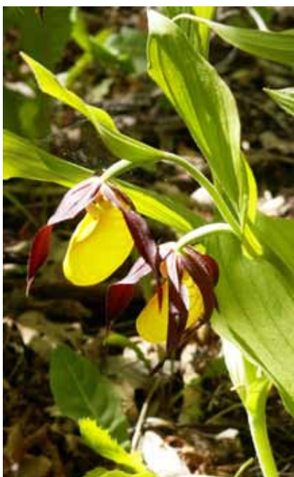
Marias borttappade skor.

Boken om Mariaväxterna handlar om den folkliga fromheten kring Maria och om hur växter med hennes namn ansågs särskilt ge kvinnor hjälp och stöd vid exempelvis graviditeter, födsel eller vård av barnen som förr dog i skrämmande stor omfattning. Det var till Maria kvinnorna vände sig, det fanns ett Mariaaltare i alla medeltida kyrkor. I kyrkans manliga värld var det väl självklart att det var