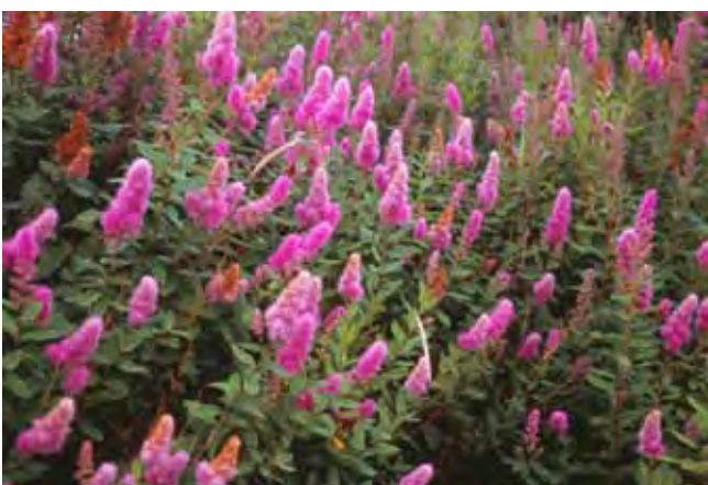
Klasespirea. Spirea x billardi, konkurrerade på 1800-talet ut den tidigare odlade häckspirean.

Örter för att bota krämpor av olika slag förekom också. I en tid då läkekonsten inte var så utvecklad var det ofta självhjälp som gällde. Man fick förlita sig på olika växters förmåga till hjälp. Växter som man kunde hitta i skog och mark men också kunde odlas i trädgården. Kunskapen om detta var kanske inte allmän men kloka gummor eller gubbar fanns i alla socknar.