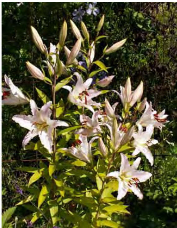
Liljan är en av symbolerna för den oskuldsfulla Maria.

Ofta går denna läkekonst och folkliga fromhet in i