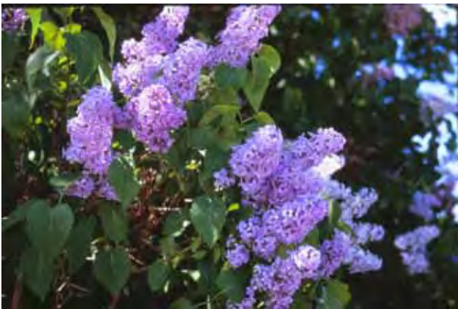
Syren. Syringa vulgaris, den gamla bondsyrenen står kvar på många platser.