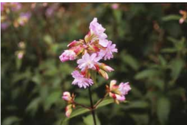
Såpnejlika. Saponaria officinalis, förr odlad som nyttoväxt eftersom bladen och jordstammen innehåller ämnen som kan användas som såpa.