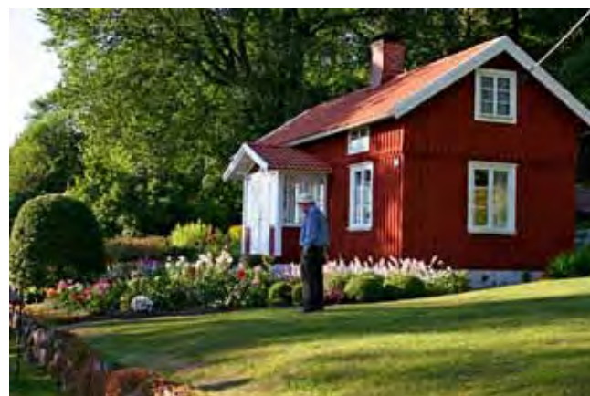
Dahliaodlare på Floget i Tunhem, juli 2013.

I kursen har vi bland annat lärt oss att trädgård för gemene man är något ganska nytt, det var vid herrgårdarna och prästgårdarna som trädgårdskulturen utvecklades. För det vanliga folket var det källanden som gällde. Kål kallade man alla växter som var nyttiga och gick att äta. I de värderingar som gjordes i samband med laga skifte hittar vi ofta källanden som en tillgång men också antalet fruktträd värderades. Men man hade också en del växter för lust och fågring. Vid inventering av gamla torpgrunder hittar man ofta en del växter som, trots att det kanske gått mer än ett sekel sedan sis-