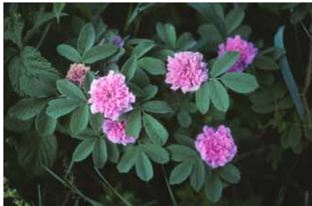
Bukettros. Rosa majalis v. foecundissima, som odlats sedan 1500-talet i Sverige kräver inte mycket näring.