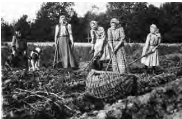
Potatisupptagning i Asklanda på 20-talet.