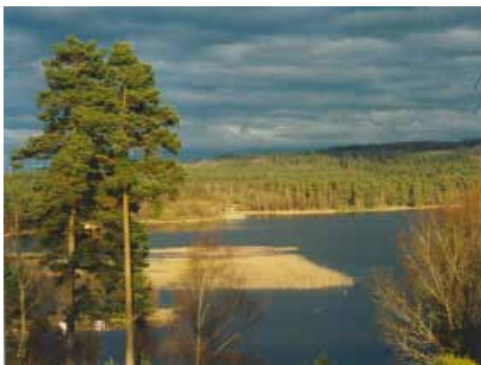
Skogsvy från Fristad. I förgrunden Öresjö och i bakgrunden skogsmarkerna i Gingri. En vy som ändrats sig mycket på 100 år.