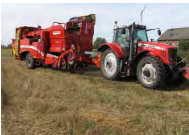
Potatisupptagare av årsmodell 2013.

Man kan fundera över hur folk kunde klara sig utan potatis innan Jonas Alströmmers såg till att den kom till vårt land.