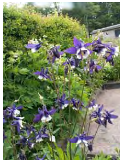
Vår Frus handskar.