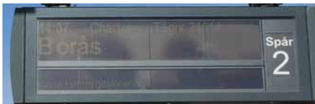
Vi är med på järnvägskartan.

För ett par månader sedan skrev jag i ett mejl till styrelsen för Kinna Hembygdsförening att: