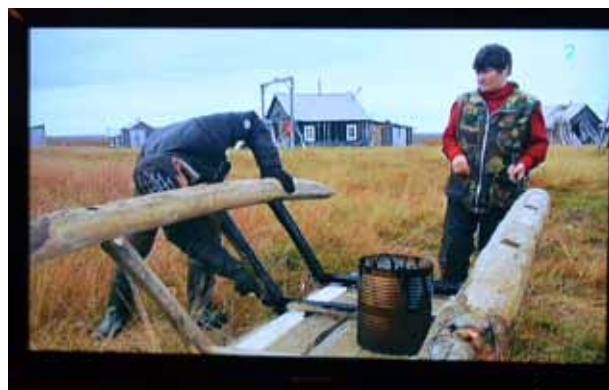
Dagens TV, en Sharp 42".