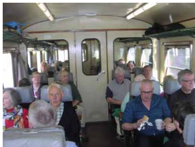
Fullsatt. Resenärerna i en av de två fullsatta vagnarna.

Första uppehållet för vår resa var i Varberg, varifrån tåget gjorde ett kort uppehåll och gick sedan vidare på Västkustbanan via Halmstad där två timmar var avsatta för fri disposition, antingen man nu ville stilla hungerkänslan genom ett besök på en lunchrestaurang eller tulla på den medhavda picknickkorgen. Många tog i det soliga höstvädret en promenad i staden för att bese Carl