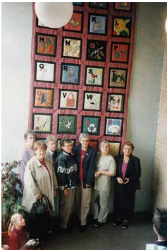
Bolstavs- och siffervepa.

Föreningen äger tre hus: Liandergården, Kruta-Johans stuga samt Hembygdsstugan Fornåsen. Stugorna ligger granne med samhällets skola, där finns omkring 130 barn från förskoleklass till och med årskurs sex.