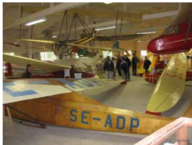
Interiör från museet.

plom och hedersmedlemskap i Segelflygets Veteransällskap (SVS). Dessutom är han Flygsportsförbundets guldmedaljör, ”för att ha arbetat med segelflygplan under stora delar av sitt liv”.