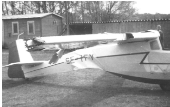
Motorspatzen efter haveriet

Källor: SVS' hemsida, www.svs-se.org Falköpings kommuns hemsida, www.falkoping.se