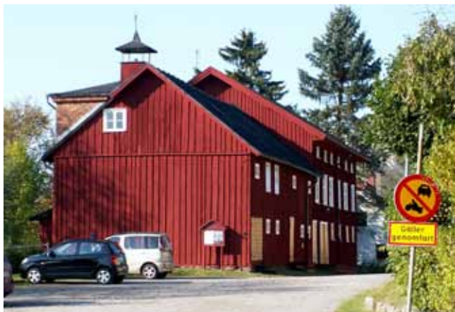
Bengtssonska magasinet är det enda som finns kvar i Vara.

De höga siffrorna gällde alltså 1866 så det var ingen tillfällighet att Havrebanan, som den kom att kallas, fick stationer i både Laskes centralort Vedum, och i Barnes huvudort Vara. Just Vara blev centrum i detta havrerike, det lär ha funnits 16 spannmålshandlare här