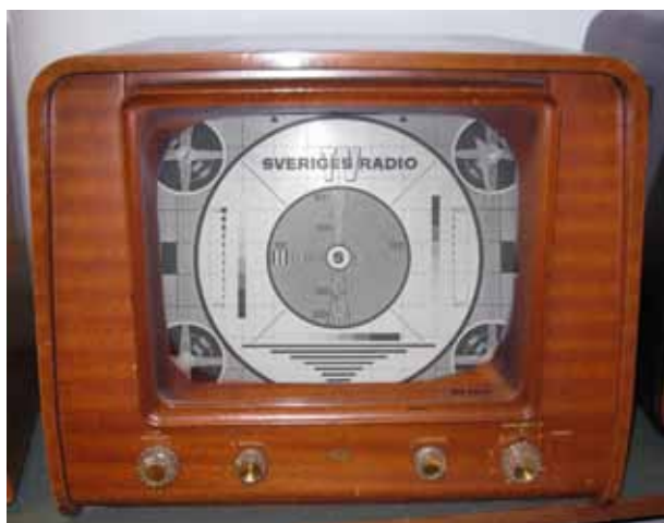
AGA från 1950-talet 15". Radiomuseet Göteborg.

Västergötlands Hembygdsförbund Box 15 SE-534 21 Vara