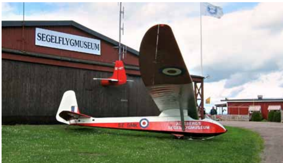
Ållebergs Segelflygmuseum.

Segelflygmuseet på Ålleberg, stiftat av Segelflyget och Falköpings kommun och aktivt stöttat av ideella krafter i Segelflygets Veteransällskap, SVS, med att renovera och underhålla flygplanen och övriga inventarier.