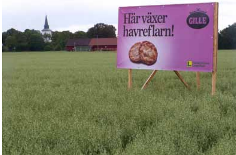
Livskraftig. Havren är en livskraftig gröda, här kan man se havreflarnen växa.

med en lång rad magasin vid stationen. Idag återstår bara ett, Bengtssonska som det kallas och det byggdes just järnvägens startår. Där skall det bli en utställning som speglar denna viktiga epok i slättens historia.