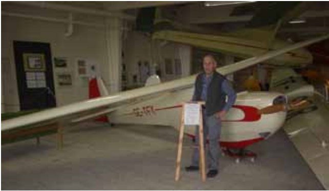
Motorspatz SF 24B

seats ägo är en av världens första serietillverkade motorseglare, Motorspatz SF 24B, tillverkad i Tyskland av Scheibe från början av 1960-talet. Köptes ny till segelflygskolan på Ålleberg för att användas i utbildningen. Den såldes sedan till Aeroklubben i Malmö där den havererades 1969. En smålänning köpte skrotet och förvarade den i en lada i 35 år!