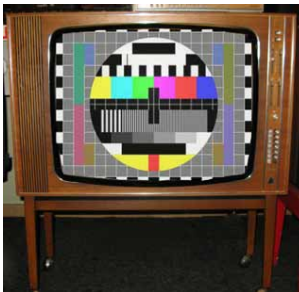
Luxor Färg-TV 23" från 1970-talet. Radiomuseet Göteborg