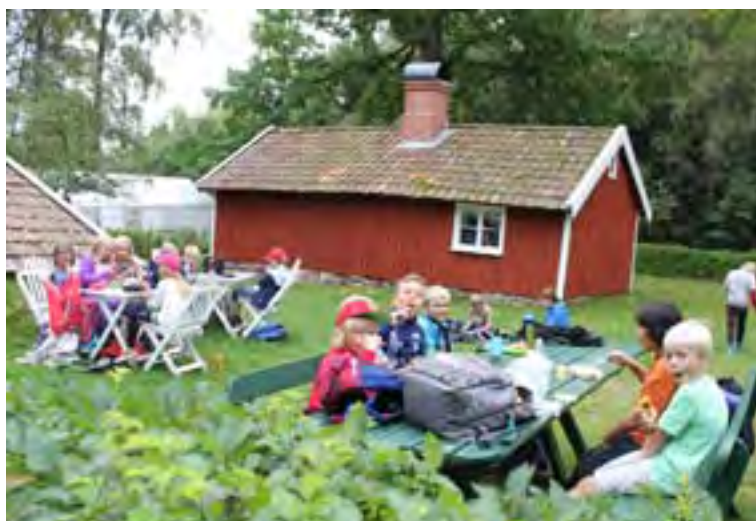
Skolklass på besök i vår hembygdsgård.

Föreningens sommarverksamhet bedrivs sedan många år tillbaka vid torpet. Vi börjar med att göra en grundlig vårstädning, och därefter startar vi den 1 maj. Vi håller därefter torpet öppet för visning varje fredag för allmänheten, fram till början av augusti. Vi tar även