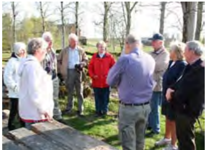
Studiebesök. Studiegruppen samlad utanför kyrkoruinen i Tämta.

Vi bildade en studiegrupp för att försöka tränga lite djupare in i historien om kyrkornas tillkomst och hur den