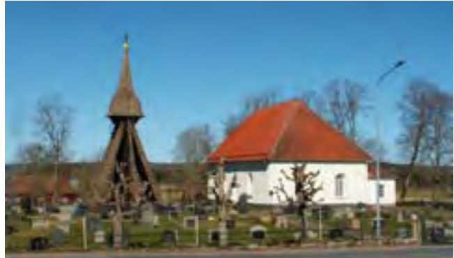
Daretorp. Inte en endaste hund syntes vid Daretorps kyrka vid mitt besök.

Från andra socknar vet vi att det inte bara var hundar som syndade i kyrkan. Till kyrkan måste man gå och gudstjänsterna var oerhört långa, så det talas om att det ofta var stort spring ut och in i kyrkan. Ibland av naturliga skäl, men stundom antyds det att gubbarna tullade på medhavda flaskor ute på kyrkogården för att pigga