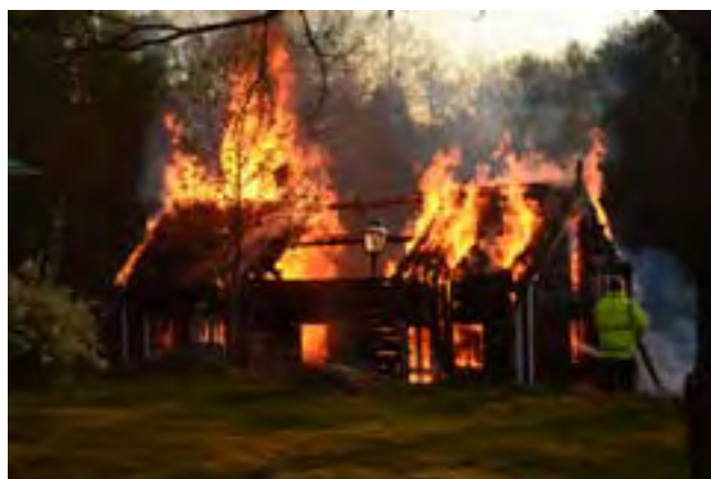
Lågornas rov. På bara några timmar blev den gamla 1700-talsstugan helt nedbrunnen.