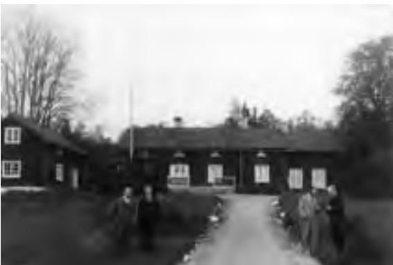
Bönared såg ut så här på 1920-talet.

I förra numret fick vi in fel bild på sidan sex. Den bilden vi hade med var en färgbild av betydligt senare datum än 1920 som bildtexten berättade om. Den rätta bilden ser Du här intill, men den hade kommit på avvägar.