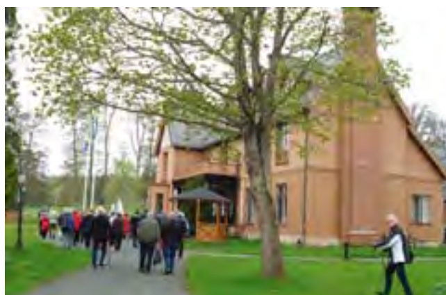
Utflykten till Ryfors. Detta var ett inslag som lockade många intresserade.