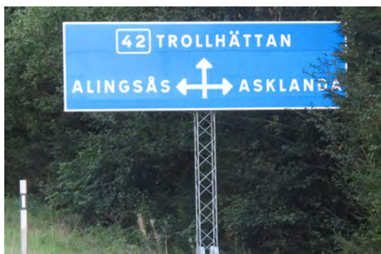
Orienterinstavla. Tavlan finns i Ljurhalla på Riksväg 42

Att hitta rätt när man är ute och åker är ganska viktigt och kör man fel kan man bli rätt irriterad. Men hur var det förr i tiden. I utkanten av vår socken som heter Asklanda finns det lämningar av en ridväg som lär ha varit vägen mellan Skara och Borås. Undra om det fanns vägvisare då. Genom socknen går en annan viktig väg. Den gick mellan Göteborg och Jönköping och vidare till Stockholm. Utmed den vägen fanns det vägvisare och milstolpar som hjälpte dåtidens kuskar att hitta rätt.