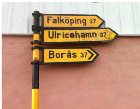
Centralt belägen. Lika långt till tre städer.