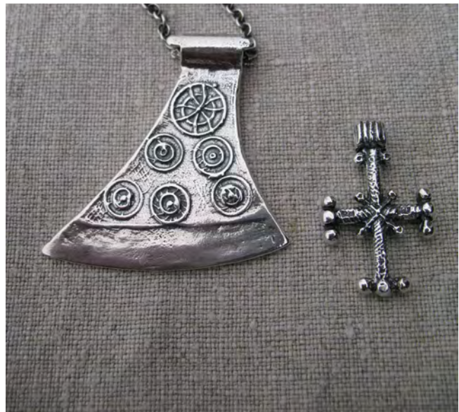
Sankt Olofsyxan och ett kors som souvenirer. Båda är framställda med gjutformar hittade i Lödöse.

Pilgrimer på väg till och från Santiago, Nidaros, Skara och Vadstena passerade Lödöse. Från Lödöse gick man via Edsleskog med S:t Nicolaikällan till Nidaros. Ur: Pilgrim och vallfartsled av Rune Ekre 1986