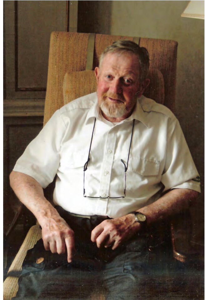
I huvet på en bonde kan det finnas mycket tänkvärt

Redan tidigt utgjorde skogen det största intresset för