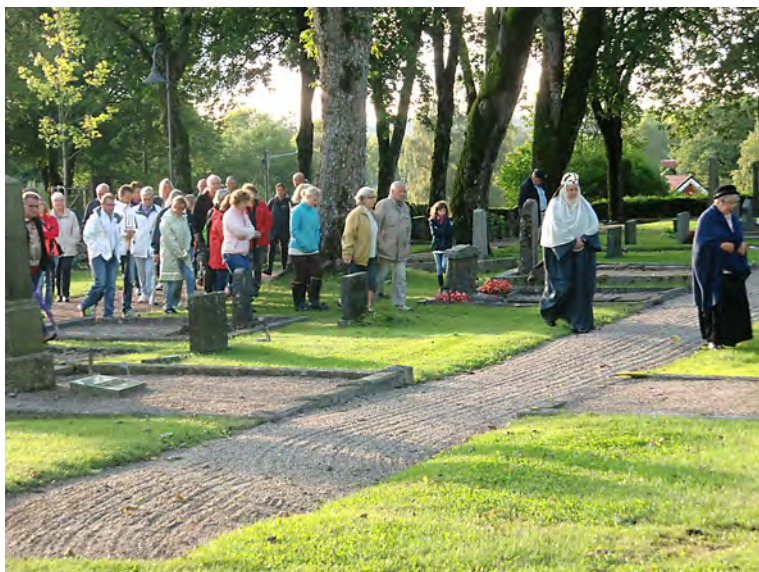
Kyrkogårdsvandring på Fristads kyrkogård.

Socknarna är jämte häraderna våra äldsta administrativa områden. Socknen kom till när kyrkan byggdes och bär på nära tusenåriga traditioner. Vid kyrkan fanns kyrkogården, som alltså är en bärare av bygdens historia genom tiderna. På många platser anordnas kyrkogårdsvandringar för att levandegöra historien, och i Fristad har vi försökt att göra det med dramatisering. Så har man också gjort i Borås.