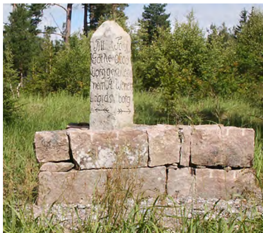
Vägvisare i Eklanda.