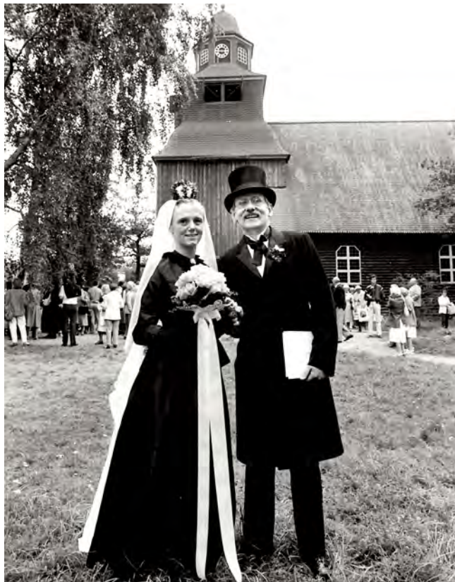
Bröllop på Skansen

Att aldrig underskatta någon person är viktigt. Lagstiftningen måste följas. Markägare hinner inte alltid