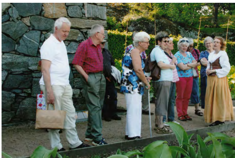
Guidning i köksträdgården.