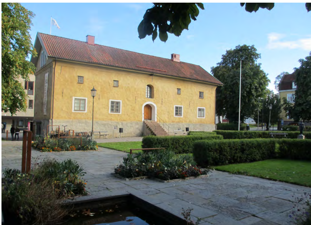
Alströmerska magasinet är åter Alingsås museum.

För fyra år sedan stängdes Alingsås museum av kommunen. Sedan dess har föreningen Museets Vänner med Ulla Nordgren i spetsen lagt ner mycket arbete för att få museet att öppna igen. Efter flera års slit har de nu nått sitt mål. I mitten av september återinvigdes Alingsås museum.