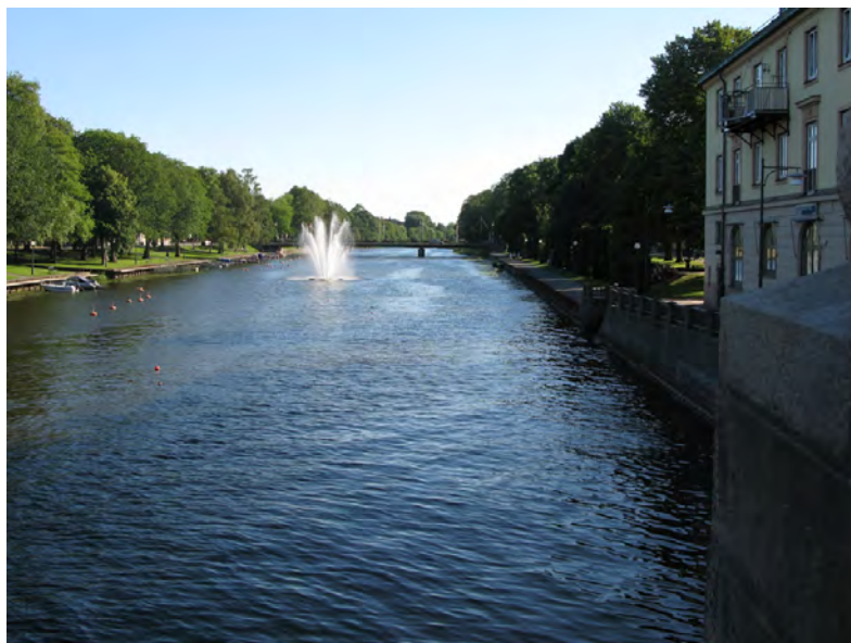
Älven. Än Lidan rinner genom centrum i Lidköping, men den sista biten ut till Väneren kallas än för älv.

Hantverksgården, med adress Hagagatan 2/ Kinnegatan 14 är den älderdomligaste och mest intakta gården i Gamla staden i Lidköping och bebyggdes på 1870- och 1880-talen. Här finns tre timrade bostadshus, en smedja i tegel samt stall och vedbod i trä. Det mindre och äldsta huset "Kinnegatshuset" används vid föreningens styrelsemöten och vid våra olika aktiviteter. Huset åt Hagagatan innehåller smedskontor och vävbod. Huset på andra sidan innergården, "Martins hus" används till