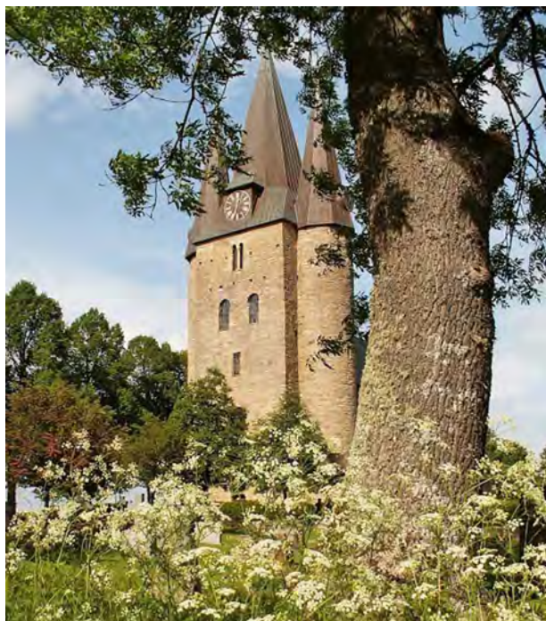
Stiftsstart? Kanske var det här i Husaby som Sveriges första stift började blomstra.

Hur som helst vet vi idag genom utgrävningar att kristendomen nått Västergötland senast under 800-talet, så den borde varit väl etablerad när stiftet bildades. Mycket tyder på att det till en början handlade om ett missionsstift, och bland annat östgötarna inlemmades för en tid i Skarastiftet även om det säkert fanns många