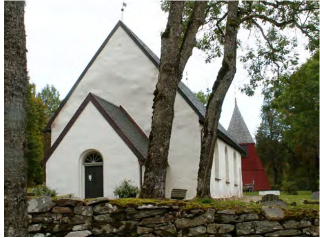
Borgstena. Platsen för en märklig begravning.

Det visade sig att en försäkring tagits på Ida på 10 000 kr. Idag räcker det väl knappt till begravningen, men paret – som visade sig vara gifta - hade bara hunnit sätta sprätt på 2 000 kr när de greps. Det visade sig att de gjort flera försäkringskupper, bland annat med hus som brunnit märkligt, och också ett tidigare försök till livförsäkringsbedrägeri. Men då svek dem nerverna i sista stund.