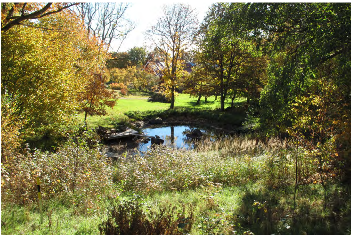
Höstmotiv från Ljurhalla.