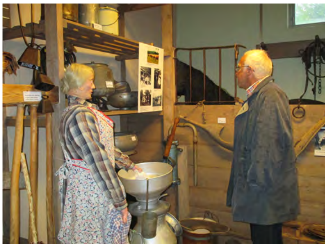
I Ladugården. Ett besök i ladugården väcker minnen.

Det var en gång ett ganska stort antal föremål, som stod huller om buller i en källare på Brandstorps hembygdsgrård. Där var de inte till vare sig glädje eller nytta för någon. Alla dessa ting hade anknytning till liv och arbete på landsbygden under tiden cirka 1850-1950.