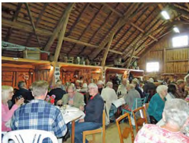
Uppskattat. Rännefesten har blivit trafiktion.

Sedan flera år tillbaka ordnar Horreds, Istorps och Öxnevalla hembygdsförening en gemenskapskväll på rännet i Klockaregårdens ladugårdsbyggnad, för aktiva medlemmar.