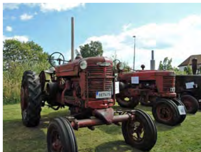
Trotjänare. BM10 från 1952, Farmall H från 1946, Farmall EMD från 1953.