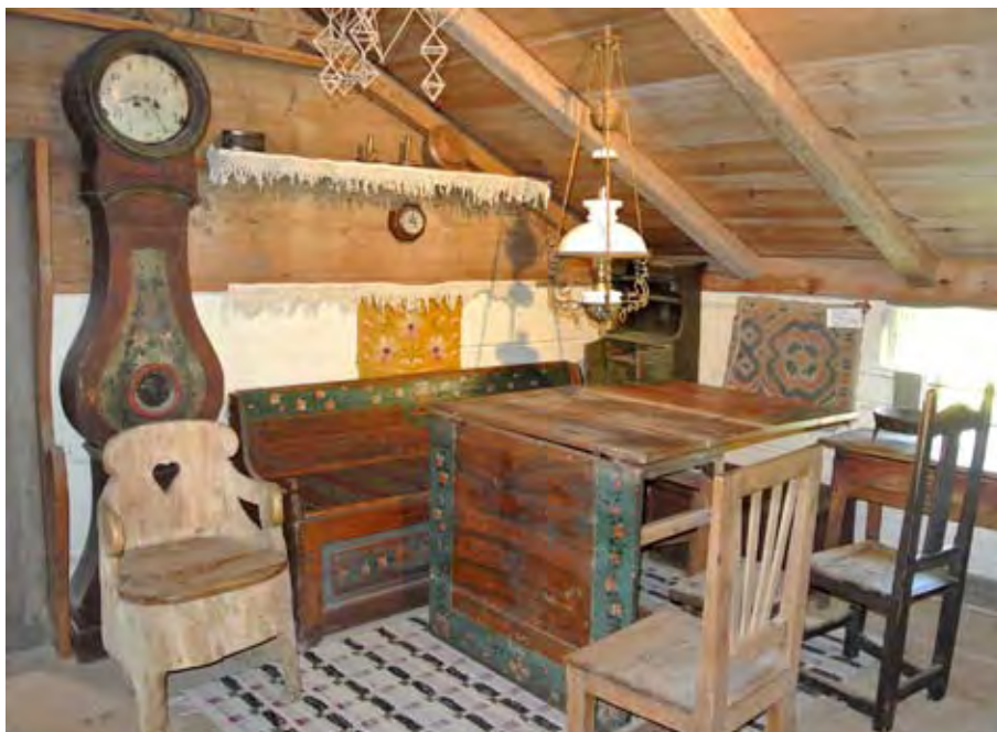
Interiör i Sparrestugan, Rackeby.

1935 beslutade Rackeby-Skalunda kyrkostämma att ge ett årligt anslag av 15 kr till fornmin-