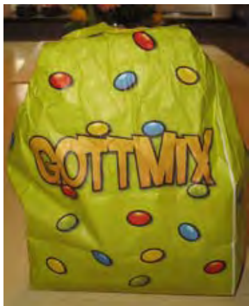
Oj då. Att köpa så stora karamellpåsar som vi gör idag var nog inte ens en dröm.