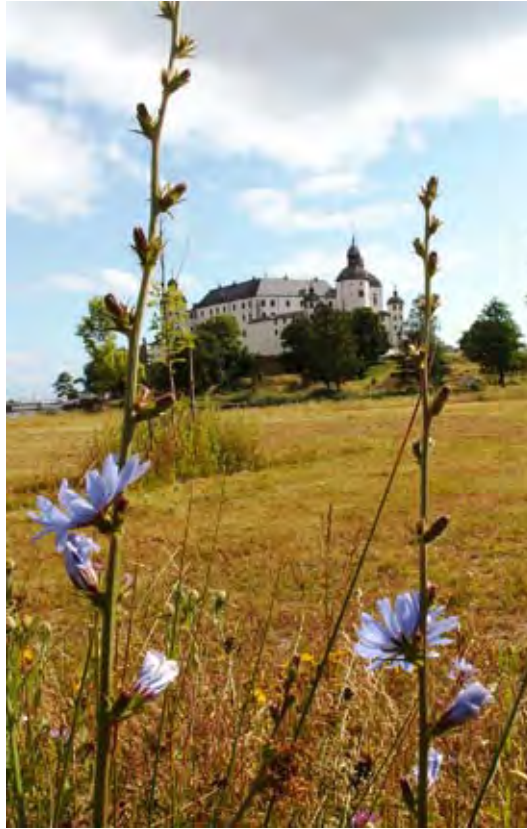
Kaffedags. Är förmodligen vackrare än vad den smakade i kaffekoppen.

Nu vid 70-årsminnet av krigsslutet letade jag fram den fina lilla bok som museet i Skara gav ut 1992, Beredskap. Hemmafront. Skaraborgare minns krigs-