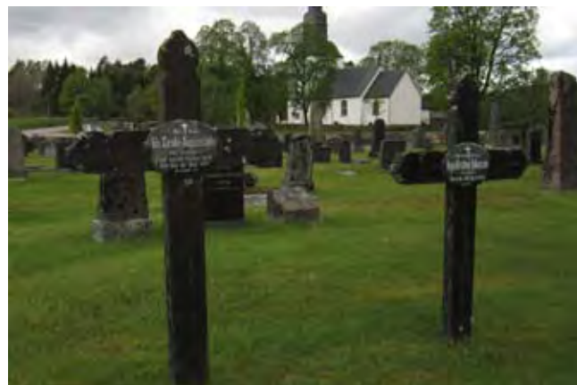
Enkla gravvårdar på Kinnarumma nya kyrkogård