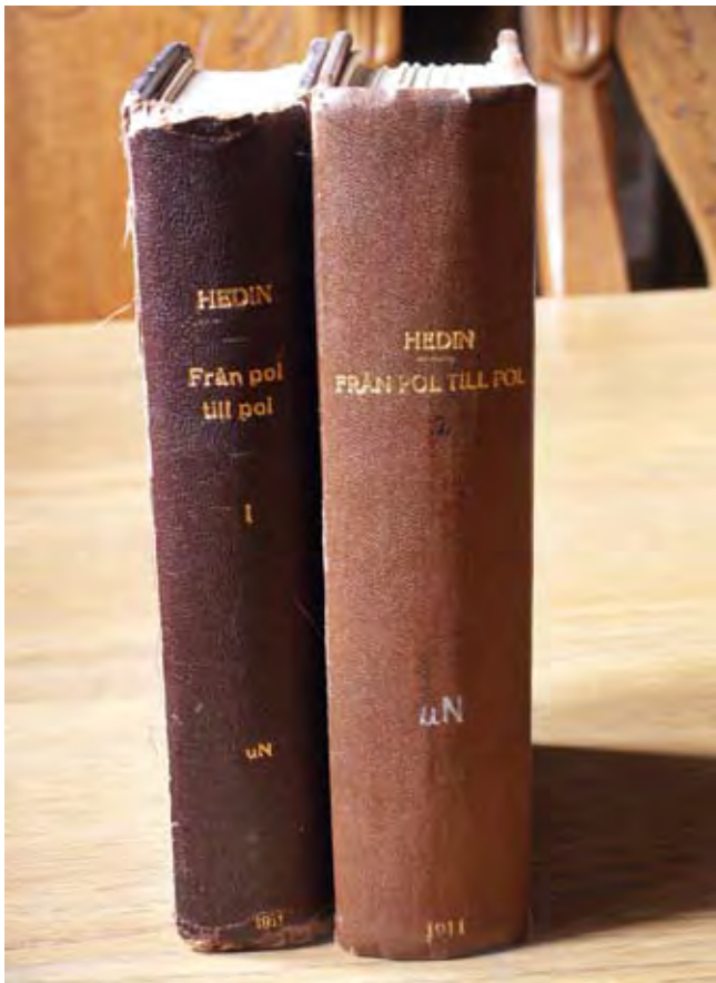
Från Pol till Pol. En av de mest utlånade böckerna i Herrljunga en gång i tiden.