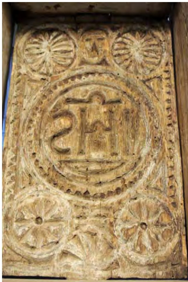
Det äldsta föremålet i Bo Carlsson gårdsmuseum är en ostform från 1600-talet. Märket är IHS med en Jesusbild längst upp.