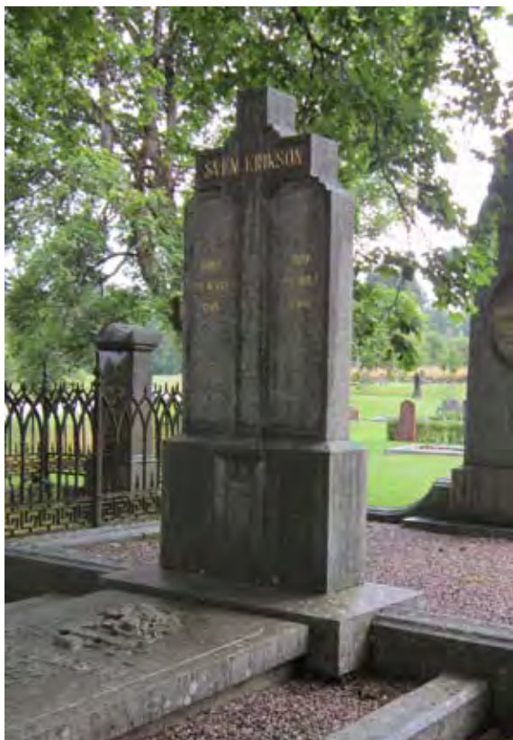
Praktfull gravvård i Kinnarumma.

På Kinnarumma gamla kyrkogård är flera förgrundsgestalter inom landets första textilindustri begravda i generöst tilltagna och vackert formgivna gravar.