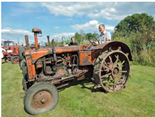
Allis Chalmers U från 1947