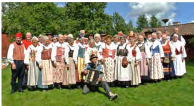
Västgötar på bussutflykt till Viala.

Hembygdsvänner från Lidköping, Skövde och Tibro gjorde gemensam sak och reste en augustilördag till Viala hembygdsgård och Västra Vingåkers Hembygds-