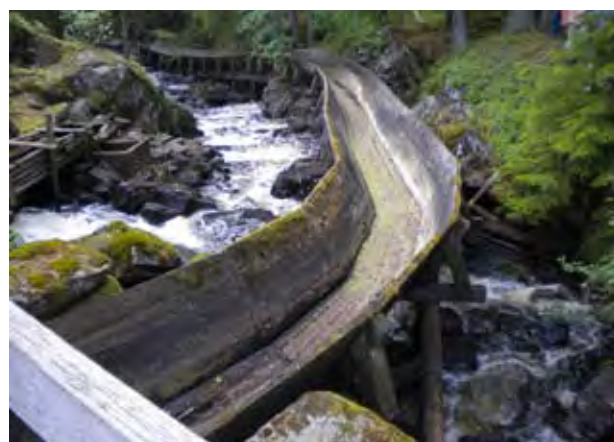
Återuppbyggd. En 40 meter lång återuppbyggd flötningsrännan