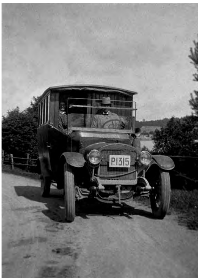
Den första bussen, en GMC, här i Östad.

Järnvägen Göteborg-Trollhättan öppnade 1877. Intresset för att åka tåg ledde till att man startade lokala busslinjer som kompletterade järnvägen. Älvängens Omnibustrafik är ett sådant exempel.