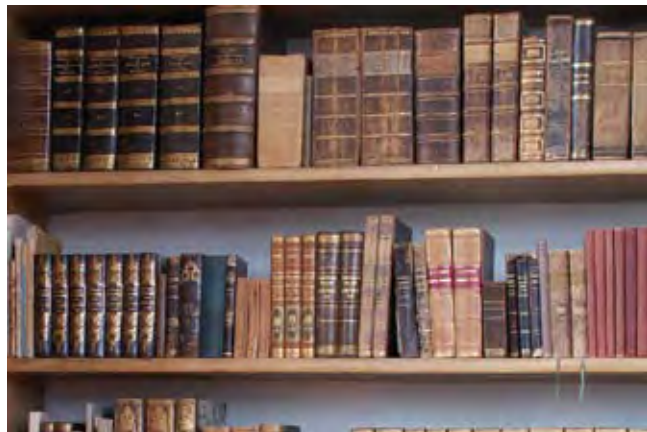
En bokhylla på ett bibliotek för många år sedan. Bilden är tagen på Stifts- och landsbiblioteket i Skara

Låntagaren är skyldig att ersätta den skada, som sker vid en bok, med undantag av oundviklig slitning.