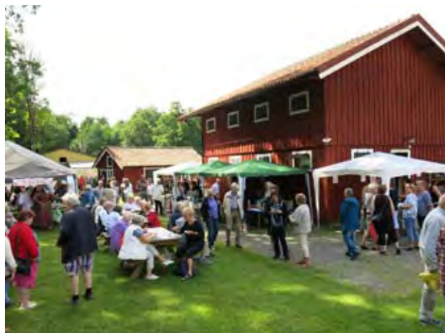
Hembygdens dag lockade många besökare.