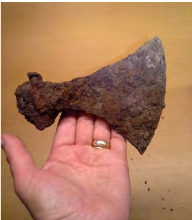
Vikingayxa. Denna förnämliga yxa hittades under sommarens grävningar.