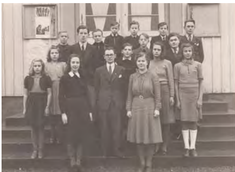
Klasskort. Bilden är tagen på trappan till Ordenshuset.

Alltnog, familjen insåg att den skolformen skulle kunna innebära lösningen för min del, och så blev det också. Det gjordes försök att starta en Robertsforsskola i Sjötorp, men där visade sig intresset ganska svagt. Det lyckades bättre uppe i Lyrestad, två år efter att mina folkskoleår var till ända. Men där var det Hermods konkurrent, NKI-skolan, som blev huvudman, och sexton förhoppningsfulla i något varierande åldrar hamnade där under en enda lärares ledning varannan dag i veckan. De övriga dagarna förväntades man sitta