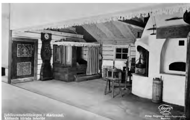
En vykortsbild från Jubileumsutställningen 1933 i Mariestad med Kållands härads interiör. Många av föremålen utlånades från Sparrestugan i Rackeby Fornminnesförening, bland annat den gamla dörren

Hembygdens år 1996 avslutades med en stor fest på Skalunda hög den 4 augusti. Det var ett samverkansprojekt mellan Västergötlands Hembygdsförbund och