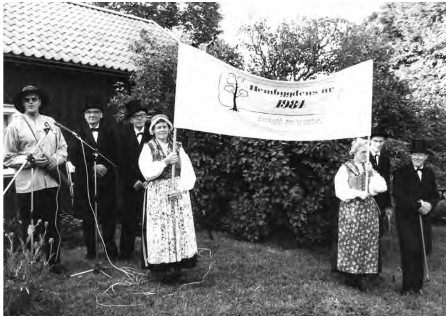
Hembygdens år 1984. Från Horla Hembygdsförening kom budkavlen till Svältornas Fornminnesförening och fortsatte sedan till Södra Härene Hembygdsförening. Bilden tagen på Landa Stora.

För att uppmärksamma Hembygdens år kommer SHFs styrelse att göra en nationell namninsamling kring ett budskap om kulturarvet och hembygdens betydelse för samhället.