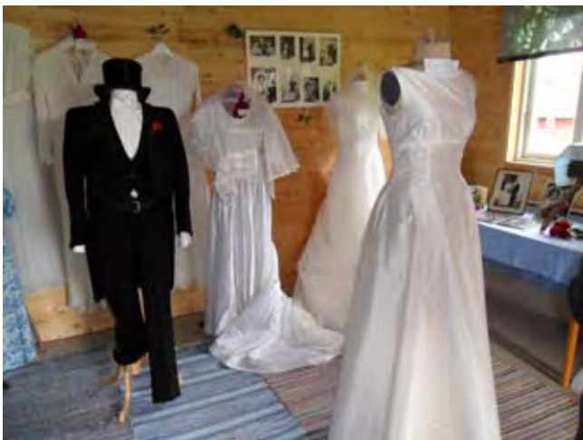
Brudklänningar från Ljungsarpsbygden.

Hembygdsgårdarnas dag den 2 augusti firade Ljungsarps hembygdsgårdens förening med att anordna en utställning av bröllopskläder. Ett tjugotal brudklänningar från år 1921 till 2014 visades och även många bröllopsfoton fanns att beskåda. Det äldsta från år 1892.