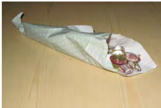
Karamellstrut. Den kommer från Balders Hage i Alingsås och innehåller hårda karameller.