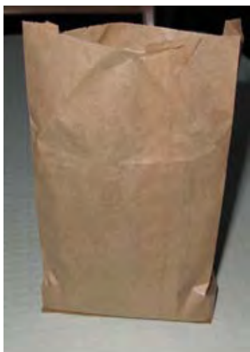
Karamellpåse. En karamellpåse var högtidligare än en strut