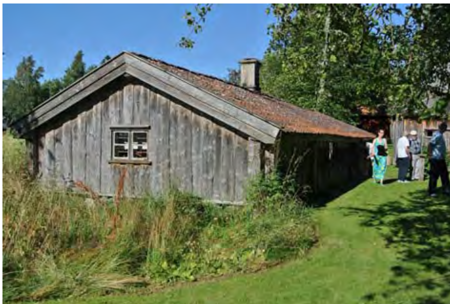
Sparrestugan , som plockades ner på Storegården och byggdes upp på sin nuvarande plats redan 1915.