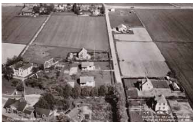
Vykort över Alvhem.

I februari 2015 anordnade Skepplanda Hembygdsväring och Bibliotekets Vänner en berättarkväll i Skepplanda bibliotek, med stationsområdet Alvhem i