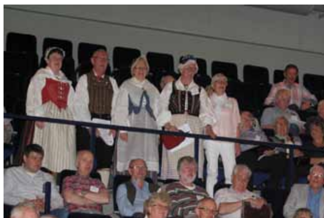
Högstupp. Ett gäng från Skara Gille följde förhandlingarna från ovan innan det var dags att jobba igen.