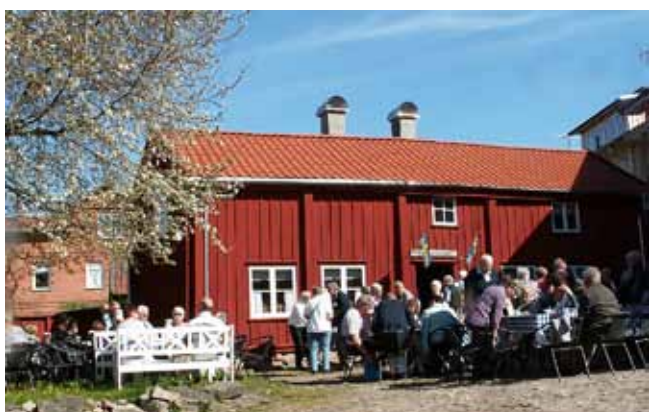
Eftermiddagskaffe. De olika stadsvandringarna avslutades med eftermiddagskaffe. För några grupper blev det på gården utanför Båtsmanshuset.