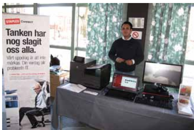
Kanske en ny dator. Om man behövde en ny dator till föreningen fick man goda råd under pausen.