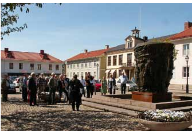
Krönikebrunnen på torget var ett av målen vid stadsvandringarna.