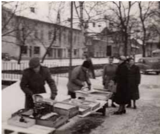
Fiskhandlare i Alingsås. Bilden är tagen omkring 1950.