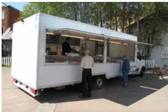
På torget i Herrljunga 2016. Varje torsdag middag kommer fiskhandlaren till Herrljunga.

För en tid sedan när jag letade i ett fotoalbum från början av 50-talet fick jag se den här bilden med ett par fiskhandlare som stod nere vid Lillån i Alingsås. På andra sidan ån ligger Stora Torget och där var det torgdagar onsdag och lördag. Men varför stod fiskhandlarna nere vid åkanten och inte uppe på torget tillsammans med de andra torg-handlarna? Kunde det vara så att de inte fick stå på torget för att isen i fisklådorna smalt och rann ut på gatstenarna som blev söliga och luktade illa. Nere vid åkanten var det inget problem, vattnet kunde rinna direkt ner i ån.