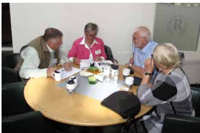
Gott med fika. Efter registreringen var det gott med kaffe och smörgås och lite koll innan stämman börjar.