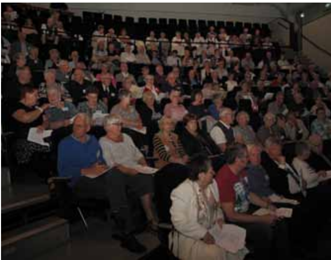
Tacksam publik. Hembygdsvännerna i Västergötland är intresserade av vad som är på gång.

geten för nästa år omsluter ca 800.000 kronor. Årsavgiften är oförändrad, men det påpekades, att den bör betalas så snart som möjligt på det nya verksamhetsåret. Hembygdsförsäkringen gäller inte, förrän avgiften är betald.