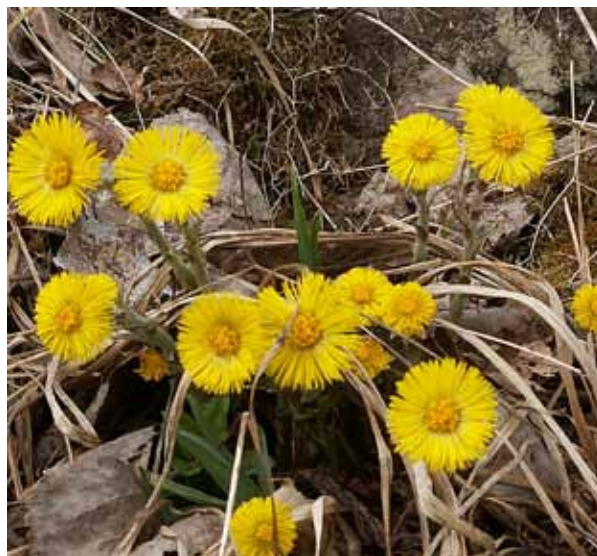
Fagra fålafötter varslar om blomstertiden.

Dessvärre används de ytterst sällan numera. Kan-