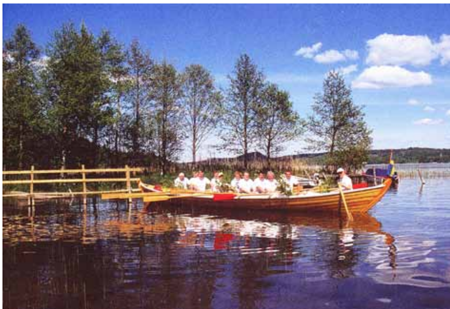
Kyrkbåten Roanta vid hemmahamnen Kvarnabo 2004. Det röda årparet ror in takten. Mitt i bild berget Väsåsen nordost om Gräfsnäs.

2000 bildades Kvarnabo kyrkbåtsförening. 2003 fick sjön Anten en ny kyrkbåt, byggd på Sollerön i Dalarna. Därmed återupptogs en nästan hundraårig tradition.