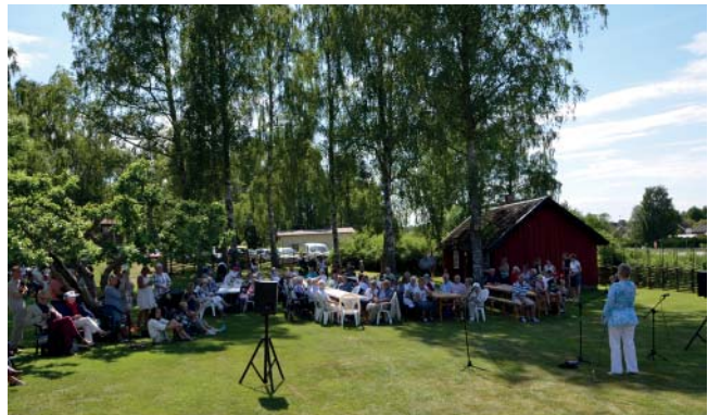
Nationaldagen i Järpås. Både unga och gamla deltog i firandet.

Järpås Hembygdsförening är verkligen en del av det levande samhället och samverkar på olika sätt med föreningar och den lokala grundskolan. Varje år bjuds till exempel skolbarn i åk 1 och 4 till en "prova på dag" i Hembygdsgården. Så var det även i år. Tvättvaggan, skurbänken, såpa och vatten var framtagna, stenugnen uppeldad, brödkakor på jäsning, alla hus och bodar upplåsta och öppnade. Glada och pigga barn satte genast igång. Några fick börja med stortvätt. Sällan har väl skådats så renskurade mattor och rena handdukar. I "Petterssons stuga" fick varje barn under sakkunnig ledning grädda sin egen brödkaka. Barnen fick också se och höra hur det var att leva och bo i en fattigstuga och innan besöket var slut hann de titta in i ladugård, magasin och smedja.