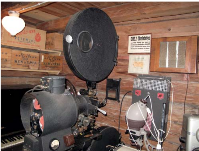
Mycket spänning. Filmprojektorn från Lyrestads Bio har säkert förmedlat både spänning och glädje.