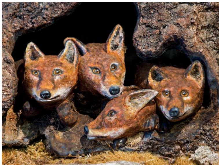
Nyfikna. Rävingarna tittar nyfiket ut från sitt gryt.

I en skog i Bredared växte en gran som var väldigt gammal. Stammen var helt vriden. Granen var fridlyst men vid en storm 1990 blåste den ner. Uno blev erbjuden att göra något av den. När han räknat årsringarna såg han att den slagit rot omkring 1730 och han sa då att den hade överlevt tolv kungar. Av stammen gjorde han en golvklocka, med siffror av kottflagor och visare av kottstammar. Allt tillhörde alltså granen. Han gröpte ur stammen för att få plats med urverket och satte en