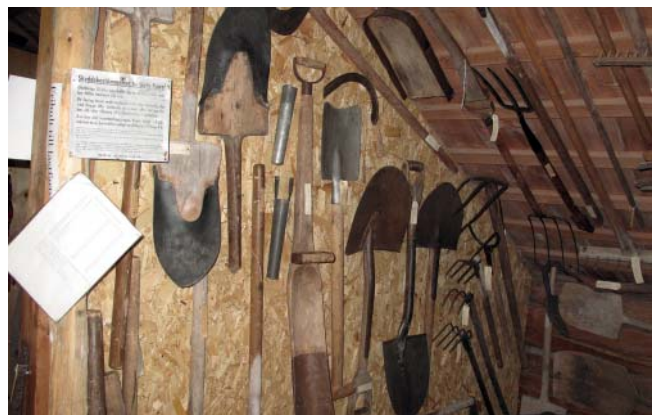
Redskap som kanske var med när Göta Kanal grävdes.

del upprustning och renovering krävdes. Arbetet framskred i den takt man mäktade med. År 2002 gjordes en ombyggnad och en renoverad serveringslokal kunde tas i bruk.