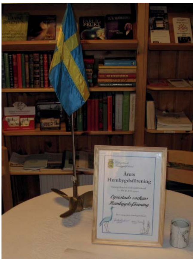
Utmärkelsen på hedersplats