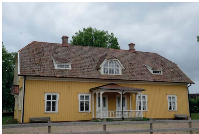
Nya skorstenar blev som gamla på Trevattnagården.

Trevattna gamla skola ägs idag av Trevattna Hembygdsförening och används som möteslokal och hembygdsmuseum. Skolan med lärarbostad är byggd kring 1910 och är fortfarande välbevarad, den utgör också en viktig del av miljön kring kyrkan med sitt inom Skara stift unika torn med trappgavlar. Skolan är utpekad som kulturhistoriskt värdefull byggnad i Falköpings kommuns bevarandeplan.