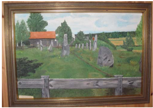
Tavla. Stensättningen vid Bäckersboda.

Centrum för verksamheten är Hamnmagasinet vid hamnbassängen i Lyrestad. Ett hundratal personer arbetar i caféverksamheten, varav ett femtiotal med servering och guidning. Många bakar eller hjälper till med underhåll. Kaffe och hembakat kostar 30 kronor, ett överkomligt pris även för barnfamiljer. Många bilister stannar till för en kaffepaus, men det kommer också en hel del cyklister och kanalfarare. Passagerarbåten Bellevue, som går mellan Sjötorp och Töreboda fyra dagar i veckan under sommaren, lägger till vid Hamnmagasinet för en kaffepaus. Den kan ta upp till 200 passagerare. Öppettiderna i Hamnmagasinet har växlat, och som mest var det kl. 10.00-18.00. I år är caféet öppet kl. 13.00- 17.00 under tiden mellan den 27 juni och den 14 augusti. Verksamheten sker huvudsakligen med ideellt arbete, men under ett 20-tal år har man haft hjälp av ungdomar, som får ersättning från kommunen. På torsdagskvällar i juli är det underhållning, och då är museet öppet till kl. 21.00. Hamnmagasinet omfattar tre våningar och har blivit ett förnämligt hembygdsmuseum. Besökare kan lämna en frivillig avgift.