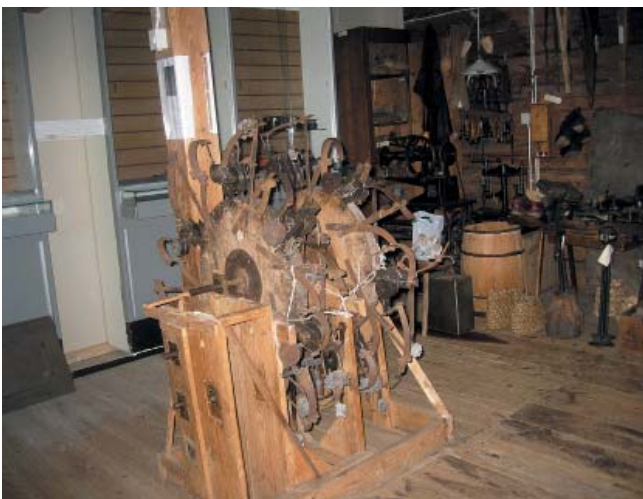
Raritet. På vinden i Hammagasinet kan man beskåda en evighetsmaskin