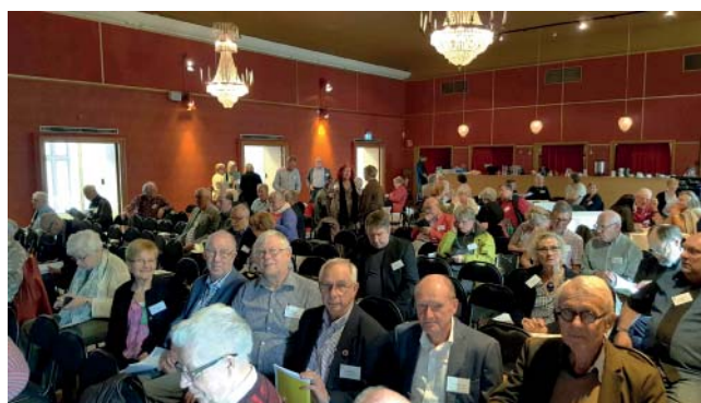
Samlat gäng. Västergötlands hembygdsförbunds delegater satt samlade på stämman.

Visionsarbetet är i sin linda i riksförbundet. För oss på lokal och regional nivå verkar arbetet gömma sig i skuggorna av den egna verksamheten. Endast 6 procent av de lokala föreningarna och 20 procent av de regionala förbunden hade svarat på enkäten. Det var mörka siffror, kan man väl säga? Eller är det ett uttryck för ”mossigheten”? Det vill jag inte tro. Vi kommer att få ytterligare en möjlighet att svara på enkäten. Då kom-