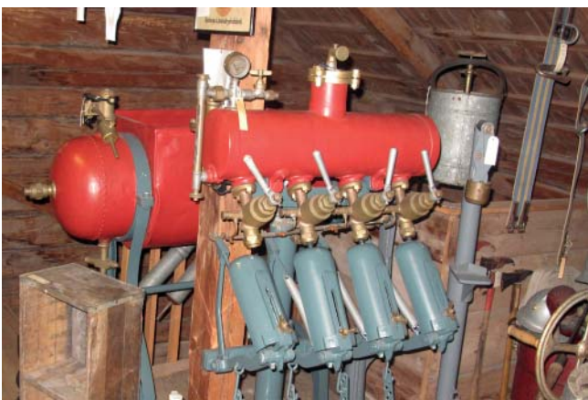
Tappmaskin. På bryggeriet i Sjötorp användes den här maskinen för att tappa läsk på flaskor.