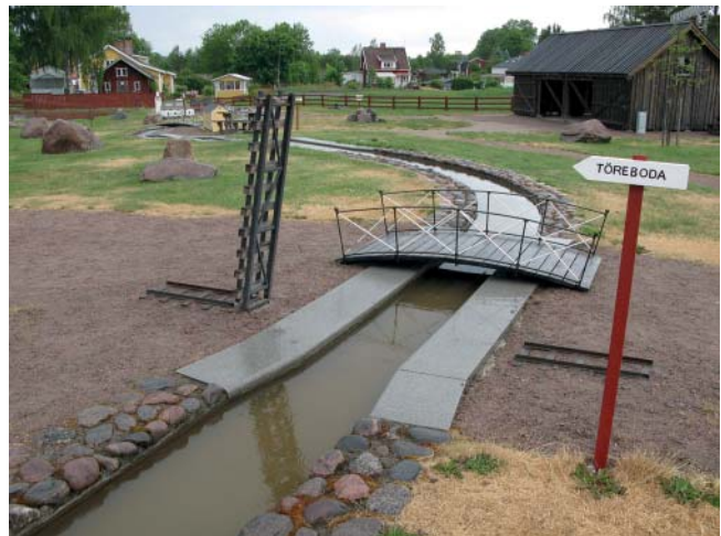
Minikanalen. Vid Norrqvarn finns den här minikanalen. Den är drygt 100 meter lång och 20 cm djup.