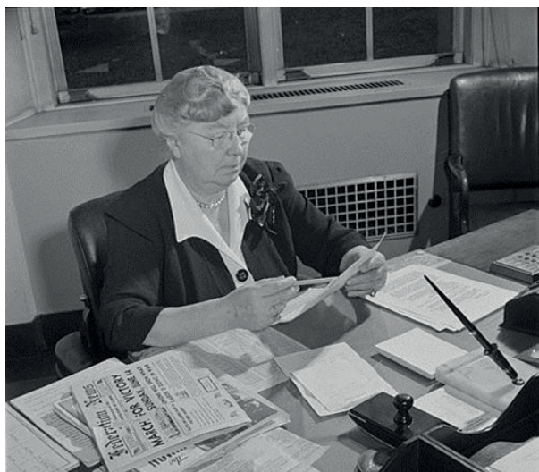
Mary Andersson på sitt arbete i Women's Bureau i Arbetsministeriet i Washington.