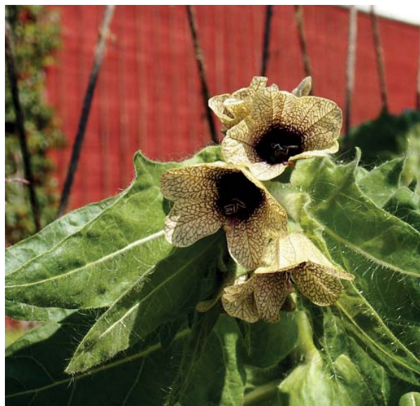
Bolmörten ser ju rentav farlig ut.

Vikingarna spred skräck var de än drog fram, och allra mest fruktade var bärsärkarna. Vikingar som påstods slåss utan att känna någon fruktan. Inte sällan struntade de i hjälm och skyddande kläder, de bet i vanvett i skölden och gick till attack. Omöjliga att stoppa.