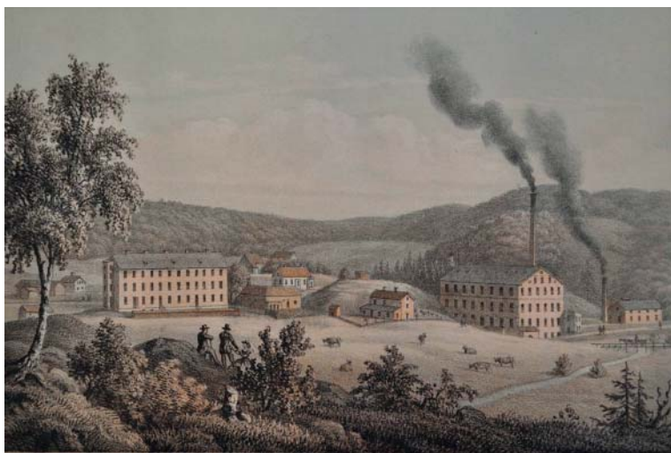
Ahlafors bomullsspinneri i byn Målje övre. Ahlafors var ett av de första riktigt stora industriföretagen i Göta älvdalen.