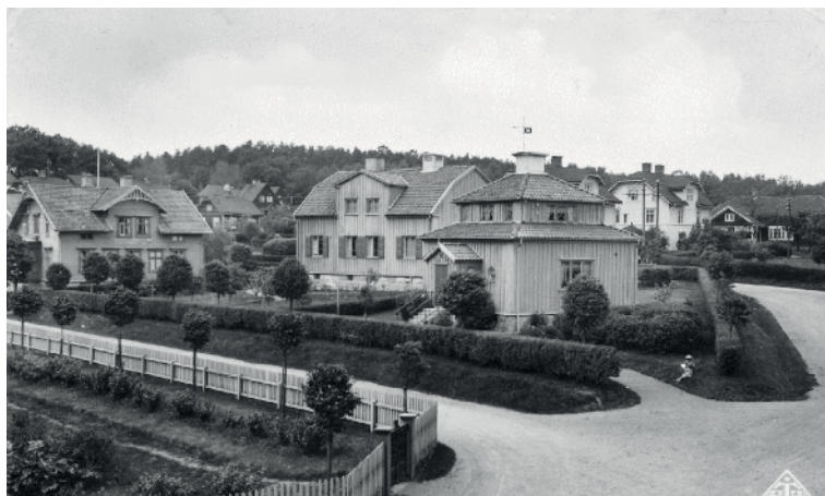
En del av villaområdet i början på 1930-talet. Längst till höger ligger Folkets Hus, tidigare Jönssons gård. Huset längst till vänster var mangården till ”Henrikes” gård.

Han hade svårt att glömma den tid då han vandrat