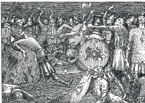
Utan svamp. Vikingarna behövde inget knark för att slåss vilt.