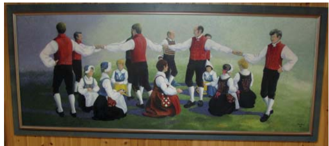
Polska. Amnebygdens Folkdanslag dansar Västgotapolska.

Mycket av verksamheten sker vid Hamnmagasinet, men en del är också "utlokaliserat" till platser runt omkring med hjälp av Sjötorps Bygdegårdsförening och Böckersboda byalag. Även Lyrestads samhällsförening är medarrangör vid till exempel nationaldagsfirande och Lyrestadsdagen. Hembygdsföreningens verksamhet är omfattande med grötfest, hembygdsfester och kafferepsdag i juli med bulle och sju sorters kakor. Under två dagar kom det förra året 225 personer. I juli firas också Lyrestadsdagen med knallar och underhållning.