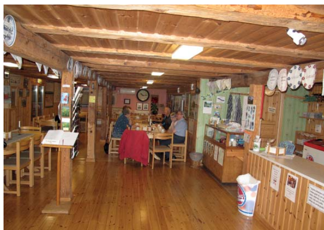
Kaffe och bygdehistoria serverades i cafeterian.

Just i Lyrestad korsas Göta kanal av vägen E 20, och detta sätter sin prägel på bygden. Lyrestads Sockens Hembygdsförening bildades år 1974 och har liksom många andra hembygdsföreningar sin bakgrund i kom-