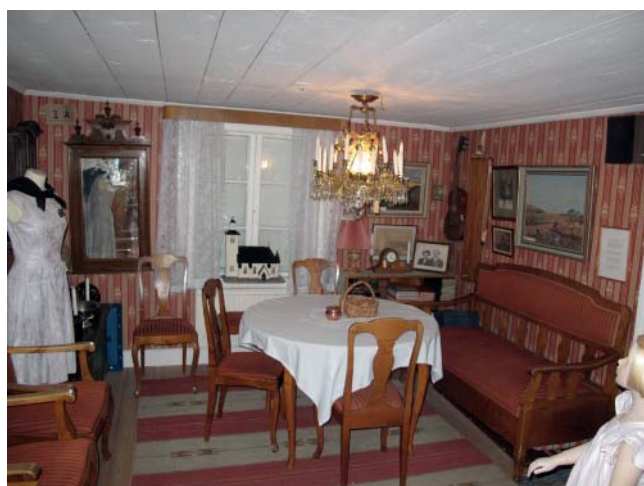
Lärinnebostaden. Ett av lärarinnans rum finns nu på museet.