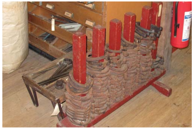
Hästskor ingick i den gamla lanthandelns sortiment.