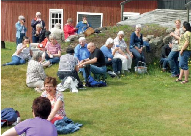
Populärt. Att gå på byavandring är uppskattat.