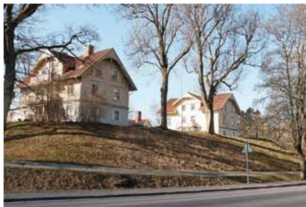
Gälakvist. På den här kullen tillbringade hertiginnan Ingeborg en jul i vånda 1317.

Ingeborg skulle egentligen haft en fantastisk jul i Skara 1317. Året innan hade hon som 15-åring fullgjort sin plikt och fött en son till sin man, hertig Erik, och nu fick hon en dotter på borgen i Skara. Ingeborg var norsk kungadotter och egentligen Sveriges första dam, för att använda ett amerikanskt uttryck. Eriks bror Birger var kung, men det var Erik som styrde.