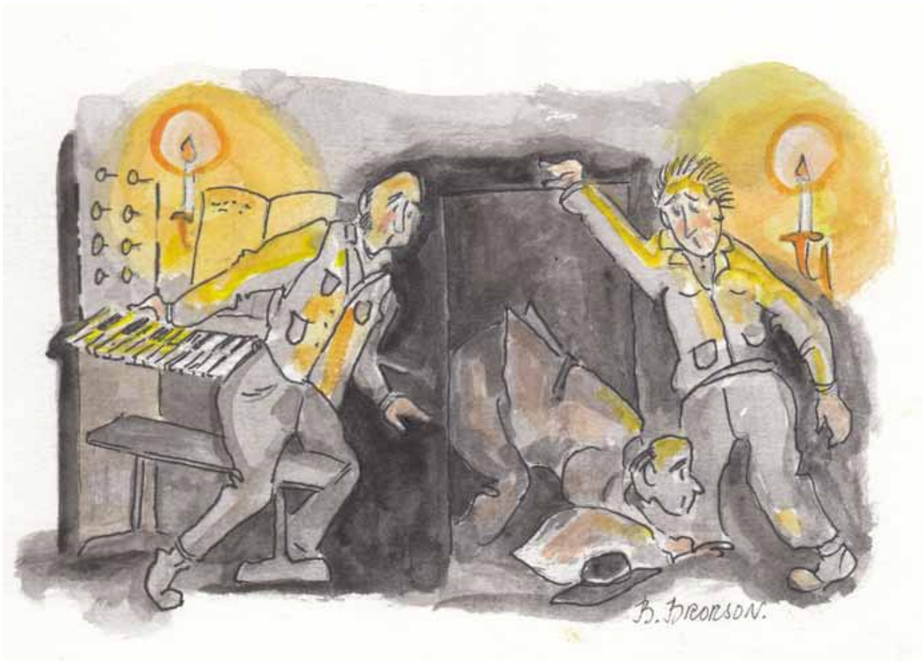
Tumult på orgelläktaren på jultorgonen.