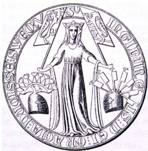
Sigill. Hertiginnan hade ett så här stiligt sigill.