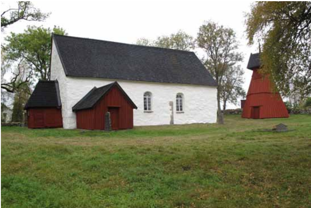
Räddad. Ornunga gamla kyrka räddades från rivning 1905. Den är en av de 435 kyrkor som skall underhållas. I höst har den kalkats och taket tjärats och klockstapeln målats.

Text Ann-Britt Boman