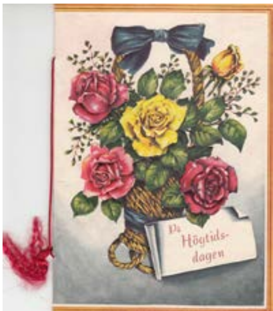
Adressen. Ett flersidigt gratulationskort med en vacker bild på framsidan.

När någon i socknen fyllde jämna år eller gifte sig, då var det självklart att det skulle uppvaktas. Uppvaktningen kunde ta lite olika former. Var man nära släkt, uppvaktade man kanske familjevis, men var man grannar eller goda vänner, då var man med på en gemensam uppvaktning.