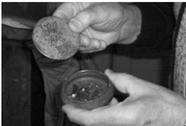
Göstas trollask finns på museet i Ornunga.

Han botade sjuka, både människor och djur, med stor framgång och han blev mycket anlitad. Folk kom miltals ifrån för att få bot eller hjälp. Han kunde också sätta sjukdom och annat ont på folk. Gösta skulle en gång ha satt diarré på de flesta besökarna på en auktion så att han kunde ropa in en ko till halva priset. Man kan säga att han var något av en fjärrskådare som kunde ta reda på försvunna djur och andra ting.