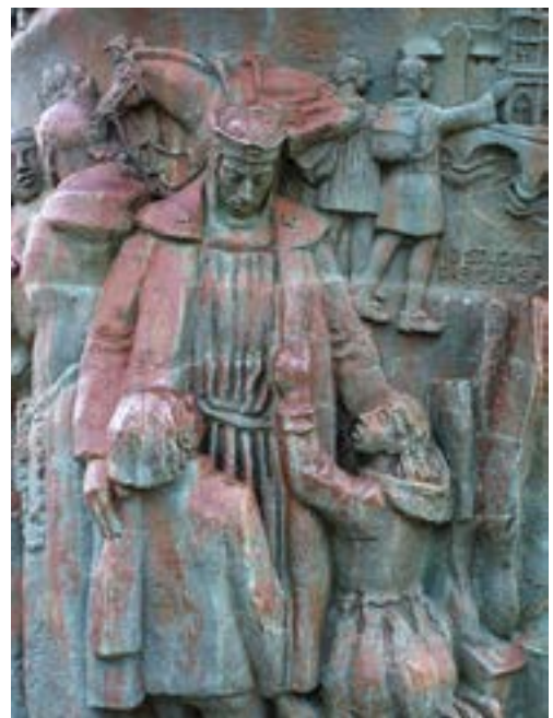
Torget i Skara. Kung Magnus befriar trälarna enligt en bild på Krönikebrunnen.