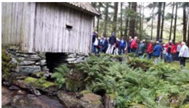
Utflykt. Hembygdsföreningens resenärer vid Ekarebo kvarn i Istorp. Som mest fanns det 37 kvarnar i Istorp.