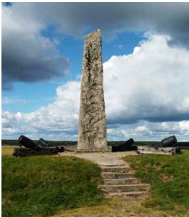
Kanonhyllning. Lennart Torstenssons minnessten står i vacker miljö alldeles vid vägen.

Detta glädde fältherren Lennart Torstensson, men än gladare blev han säkert av att den segern fick de kejserliga motståndarna att på allvar börja söka fred. Det tog visserligen tre och ett halvt år, men slaget vid Jan-