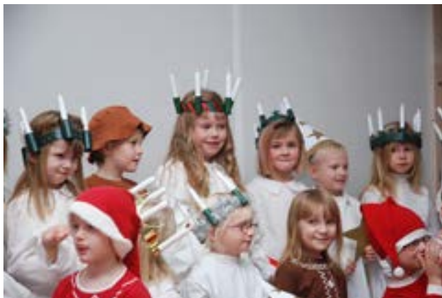
Luciafirande. Lucior, tomtégubbar, stjärngosse, pepparkaksgubbe med flera firade Lucia i förskolan Igelkotten utanför Skövde år 2010.