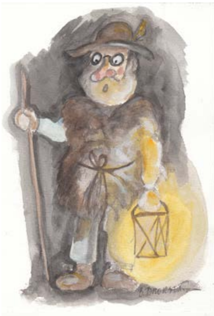
Lussegubben. Akvarell: Börje Brorson.