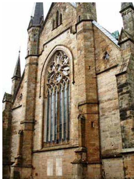
Skara. Det lär ha intrigerats rentav inne i domkyrkan ödesåret 1529.