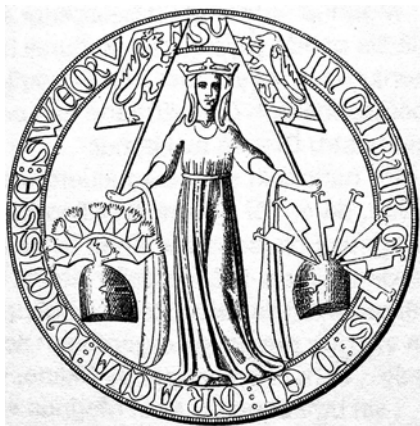
Bilden visar förstås Ingeborgs stiliga sigill, tillverkat för övrigt för exakt 700 år sedan, 1318.

Julen hade hon tillbringat på kungliga slottet Gälakvist i Skara, en jul fylld av glädje och fruktan. Dels fick hon sitt andra barn, en dotter, och det gladdes förstås, men samtidigt hade maken och lillebror Valdemar varit dumma nog att tacka ja till en inbjudan till att dricka jul hos storebror kungen på Nyköpings hus. Sedan hör hon inget.