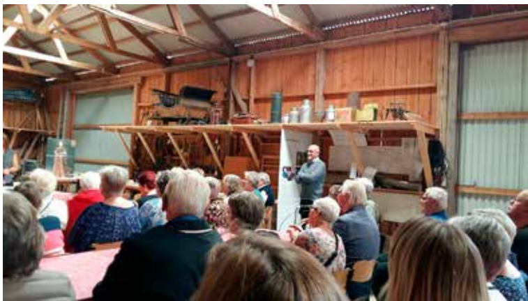
Bussresa. Ett av stoppen på färdvägen gjordes hos Långareds Hembygdsförening.