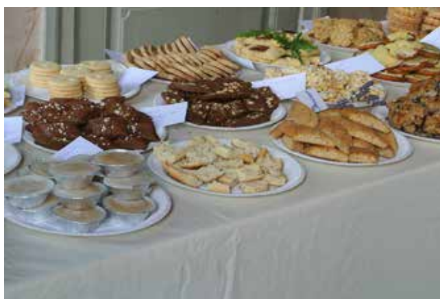
Kakbord. Några av alla de 80 kakor som årets kafferep i Skara hade att bjuda på.

Till ett kafferep hör bullen, mjuka kakor, minst sju sorters kakor och som avslutning givetvis – tårtan. Bullen, framförallt kanelbullen, är idag vårt vanligaste kaffebröd. Kanelbullen har till och med en egen dag, som infaller den 4 oktober.