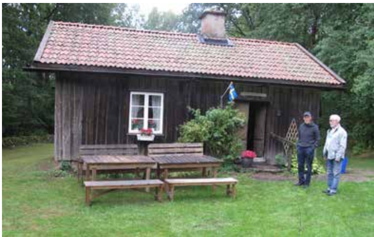
God kvalitet. Hembygdsstugan i Hov har tidigare stått på två andra platser och nu är den hemvist för Hovs Hembygdsförening.