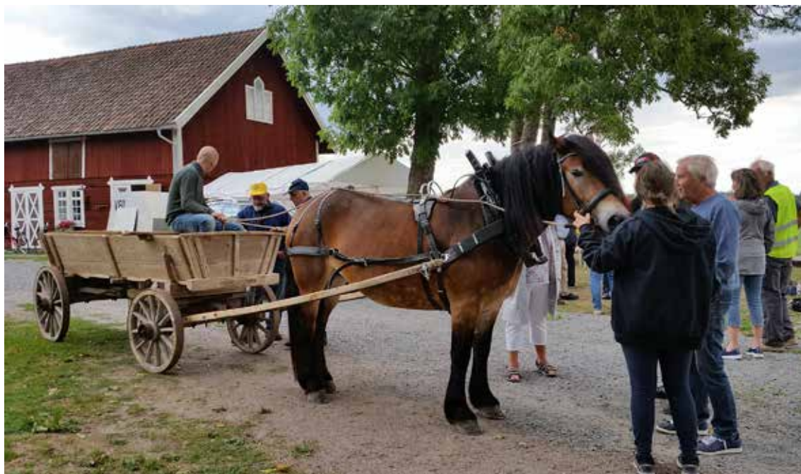
Varola-Vretens Hembygdsförening. En grann nordsvensk häst fick tjänstgöra under hembygdsdagen i Varola.