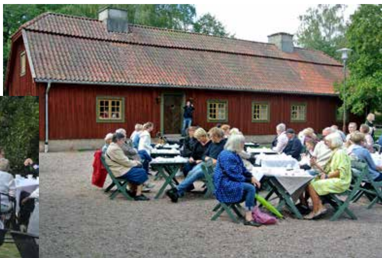
Kafferep i trädgården till Kråks herrgård. Här samlades lördagen den 25 augusti drygt 300 personer kring kaffeborden, som var dukade med fina dukar, gammaldags kaffekoppar och tillika porslinskannor. Och det fanns inte mer än 80 olika kakor att välja mellan.