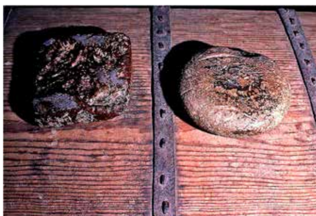
Brödet och osten i Husaby kyrka, Västergötland.

I äldre västgötalagens kyrkobalk stadgas att för sådana aktiviteter som på t ex påsk, allhelgonadagen eller apostlamässorna bröt sabbatsfriden, t ex att baka på helgdagar, skulle ge bot till biskopen på åtta örtugar. Liknande bestämmelser finns i andra landskapslagar. Det kunde vara en pedagogisk förklaring till brödstenar. Det måste också nämnas ett par andra intressanta alternativ. Osten i Husaby kunde t ex ursprungligen ha varit en altarsten till ett buret altare, ett resealtare. Dessa hade sin fasta plats på det reguljära altaret.