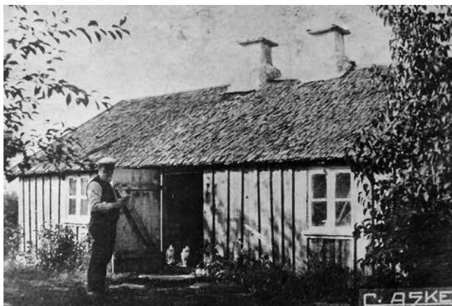
Asklanda fattigstuga. Utanför stugan står Ferma-Petter.

Fattigvården var jämte skolan den dominerande uppgiften under 1900-talets första hälft. Och det var en lagstadgad skyldighet enligt en lag från 1847.