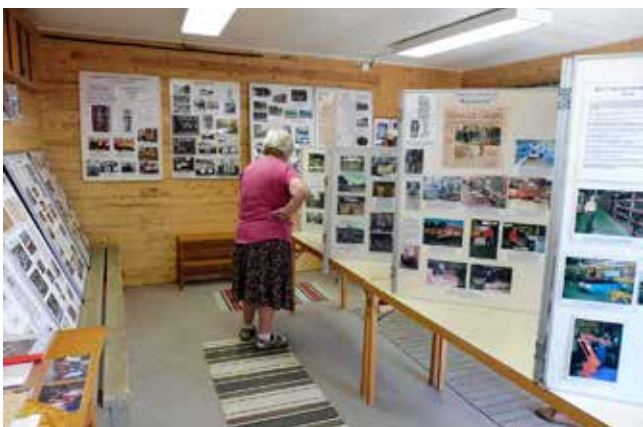
Fotoutställning i Ljungsarp.