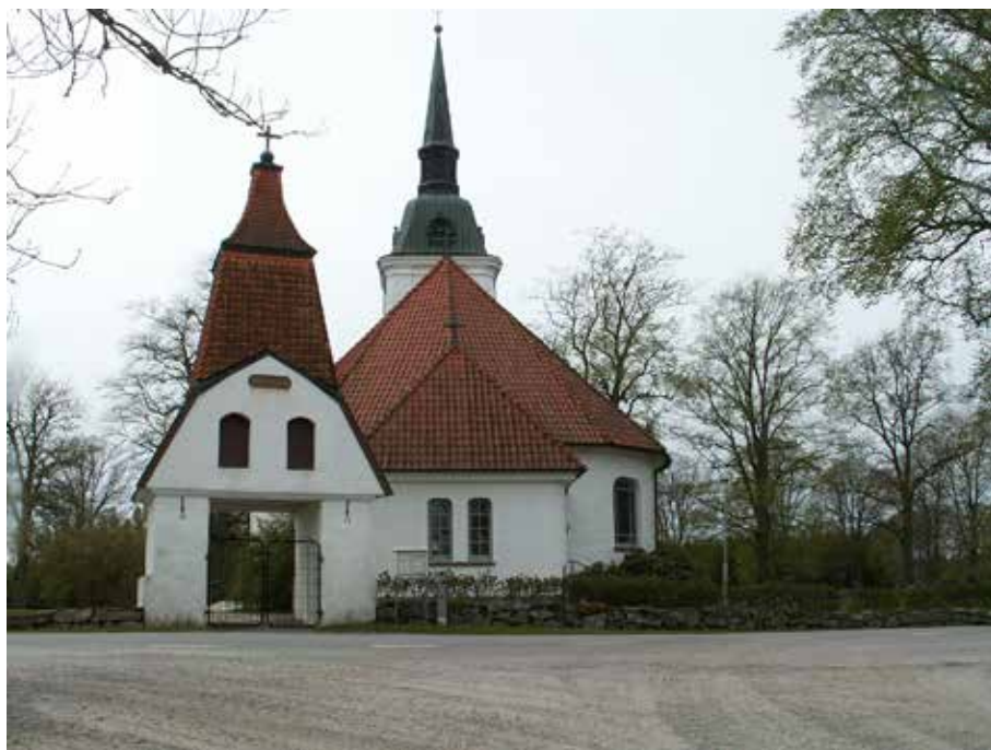
Så här ser Främmestads kyrka ut idag.

Sedan några år hade man bestämda planer på en grundlig renovering och utbyggnad. Men uppfattningarna var delade, och det kom inte mycket sten till kyrkbygget.