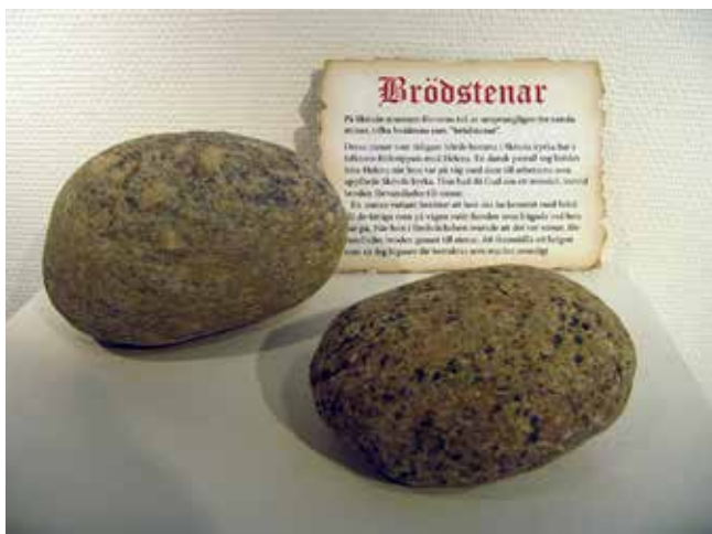
Bröden i Skövde.

skulle ha bakat en söndagsmorgon år 1313. Detta var ett brott som straffades med att brödet förvandlades till sten. Detta påminner om legenden från Passio Olavi.