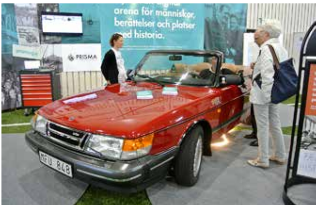
Hembygdens år 2016 – Tångamässan Vårgårda. Prisma VG, erbjuder en digital arena med berättelser och föremål om industrin från dåtid till nutid.