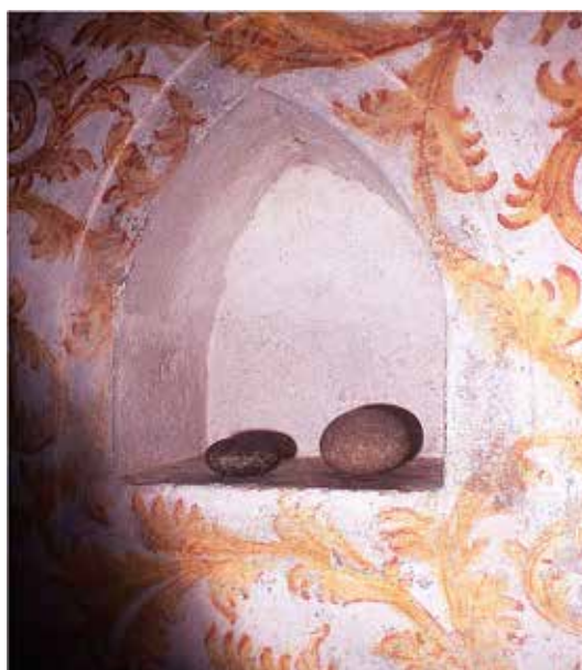
Brödstenarna i Bro kyrka, Gotland.