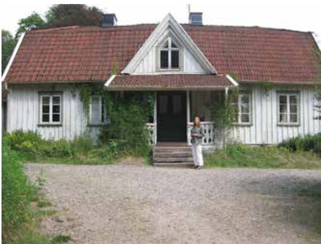
Lerbäcksbyspelet. I den här miljön har spelet uppförts år 2015 och 2017 med ett 40-tal medverkande och många hundra åskådare.