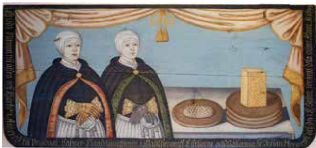
Altarskiva till kvinnoaltare i Angereds gamla kyrka (efter Terese Zackrisson).

Tyvärr är jag inte nöjd med denna förklaring om uppvärmning av vatten genom stenar. Som arkeolog vill jag syna den materiella grunden för att se om en teori stämmer. Problemet är nu i första hand det att stenar som använts på detta sätt upprepade gånger brukar visa upp spår efter upphettning och sedan avkylning. Det visar sig genom lös yta eller sprickor rakt igenom. Begreppet skörbränd sten eller skärvstenar är en klassisk boplotsindikation i stora delar av förhistorisk tid. Men ingen av de brödstenar jag själv har sett eller har fått tag i bilder på har några skador av den typ som uppträder på skörbränd sten. De har en extremt jämn yta, ibland nästan polerad. Dessutom förstår jag inte alls varför flera är så stora och runda. På så sätt blir de ju svåra att hantera när de i så fall skulle ha transporterats