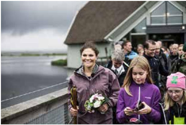
HKH Kronprinsessan Victoria Västergötlands Hembygdsförbunds beskyddarinna

Bilden ovan är tagen vid Kronprinsessans vandring i Västergötland i september 2017.