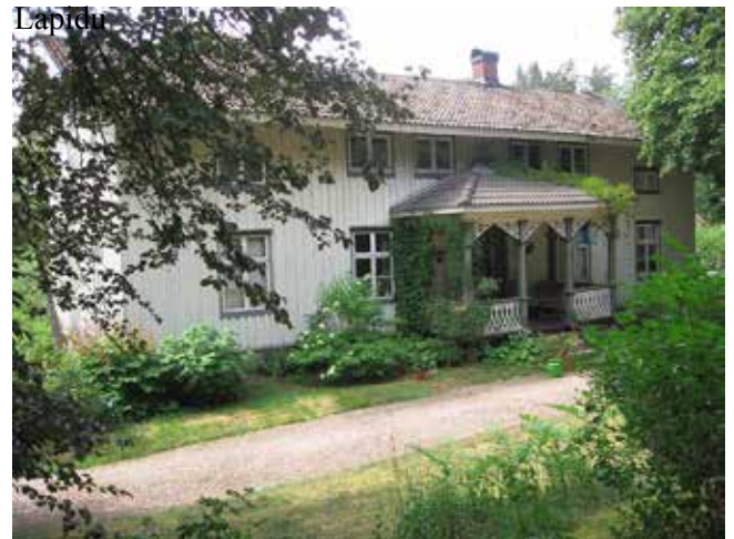
Lerbäcksbyn. I byn finns såväl förläggar- som magasinbyggnader.

tävlingar. När det gäller poesi, nämner hon Tomas Tranströmer och Edith Södergran bland favoriterna, och hon skriver själv dikter.