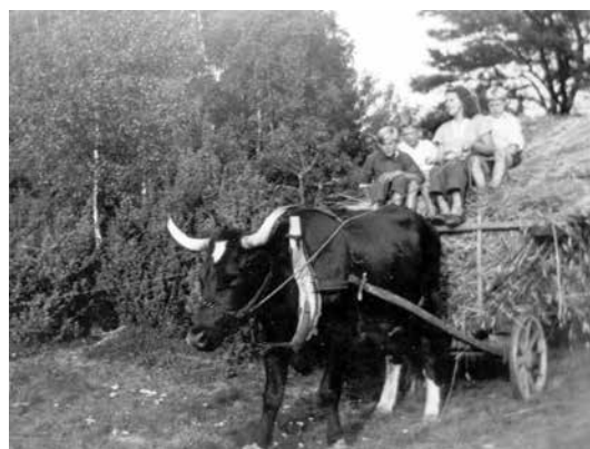
Skålaberget. Oxen drar en vagn med syskonen Svensson.

Därefter åkte vi till Rudenar, och här fick vi höra att den sist boende personen hittats död. Man befarade att ett inbrott och en misshandel hade förorsakat mannens död. Vid undersökningen av den förmodade brottsplatsen hittade man ca 80 avlöningspåsar, där lönen låg kvar oanvänd i en byrålåda. Den ditkallade läkaren fastslog att dödsorsaken var någon form av slaganfall, varvid mannen ramlat mot järnspisen med kraftigt blodflöde som följd, vilket gjorde att han avled. Därefter avskrevs brottsmisstanken. Vid denna gård fanns