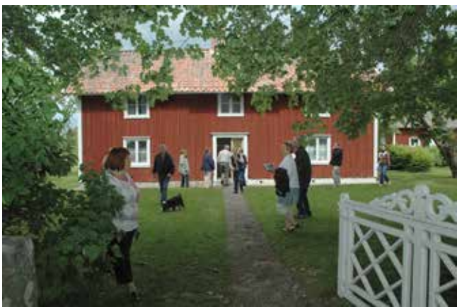
Kulturreseptatet Vallby Sörgården. Tioårsjubileum i år sedan invigningen 2009.