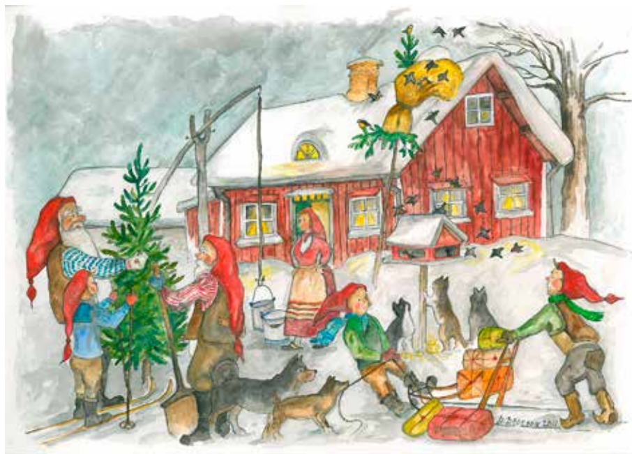
Julmotiv från hur det var förr i tiden. Teckning: Börje Brorson (2011).

Gröt, gryta, gryn och grus är besläktade ord och betyder något som krossats. Ur gröt som fått jäsa har troligen både bröd och brygd utvecklats. Efter måltiden var det dags för några små julklappar. De hemstickade strumporna var visserligen varma, men de stacks. Om man