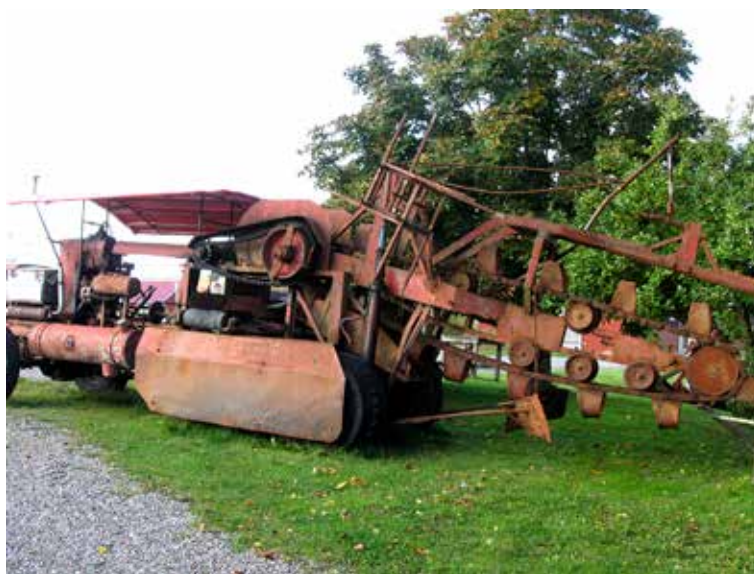
Utanför verkstaden står en stor täckdikningsmaskin.

I framtidsplanerna ingår byggandet av en stor hall för visningar av alla fordon och föremål som kommer in till föreningen. Den är redan utstakad vid sidan av de andra byggnaderna. En viktig del av föreningens verksamhet är dokumentation av bygden genom böcker och filmer. Vidare är det viktigt att överföra kunskap och historia till kommande generation. I renoveringsarbetet