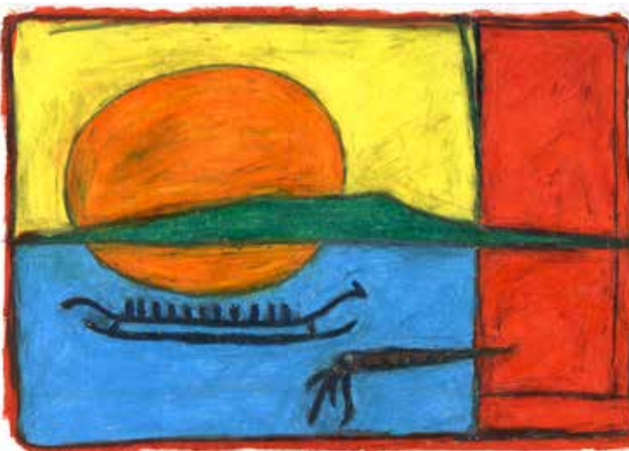
Kinneulle sökande sin nya identitet. Pastell 2019 av Benny Lönn.

K inneulle, med sin högsta punkt 300 meter över havet, är det ”magiska berget”. Med öppet sinne kan du med bergets hjälp förflytta dig en halv miljard år bakåt i tiden. En 500 miljoner år gammal begravningsplats för bläckfiskar är inte den sämsta utgångspunkten om det skall funderas på människans ursprung och framtid.