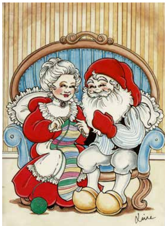
Ett julkort från våra dagar. Tecknare: Line © Svenska Vykort/Bläckhornet, Skövde (1990-tal).

1848 togs idén upp av M Egley Jr, fortfarande utan att det lyckades ekonomiskt. ”Merry Christmas” var