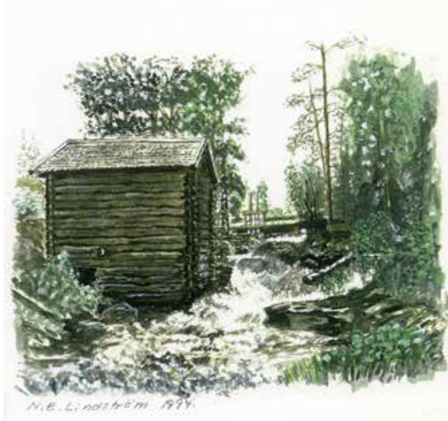
Skvaltkvarnar i Sverige. Teckning av N E Lindström.