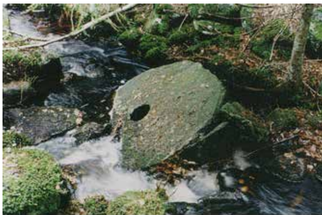
Kvarnplats i Pålsbobäcken , Sandhults socken i Älvsborgs län. Skvaltkvarnen har stått tvärs över bäcken och då kvarnhuset ruttnat har understenen fallit rakt ner i bäcken. Stenen har inga räfflor utan malytan är pickad med pikhacka. Diameter 139 cm, kanten är endast grovt tuktad. Överstenen ligger på höger sida strax intill bäcken. Den saknar också räfflor, d=120 cm, pickad malyta.