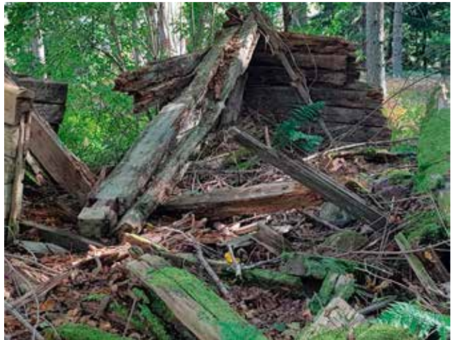
Nyhagen. Rester av huset, som det ser ut idag.

Sedan gick färden till församlingshemmet där det var tänkt att det medhavda kaffet skulle inmundigas, men denna vackra höstdag ville alla sitta vid borden i trädgården.