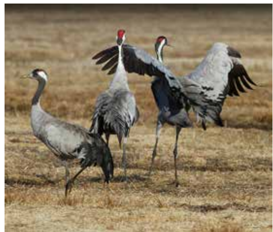
När man tittar ut från trankaféet kan man mötas av den här synen.

Det är tydligen inte många ens i Gudhem som minns