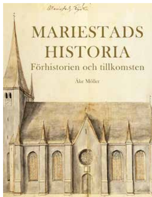
Omslaget till boken visar förstas Mariestads domkyrka.

Mest handlar förstas om bygden kring blivande Mariestad och där spelar förstas Ullervad en viktig och spännande roll. Orten hette från början Ullervi, vilket berättar att här firades asaguden Ull med stor omsorg.