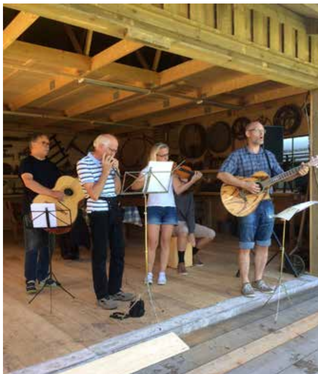
Hemsjö 50-årsjubileum. Lokala musiker bjöd på klämmiga låtar från då och nu.

Det var många i Hemsjö som gick här och undra hur åren förflutit i flertalet hundra ja det säkert var slitsamt och knappt. För dom bodde på utmark därborta i skogen man fick jobba och slita hos bonden med plogen ja det måste gå genast och snabbt.