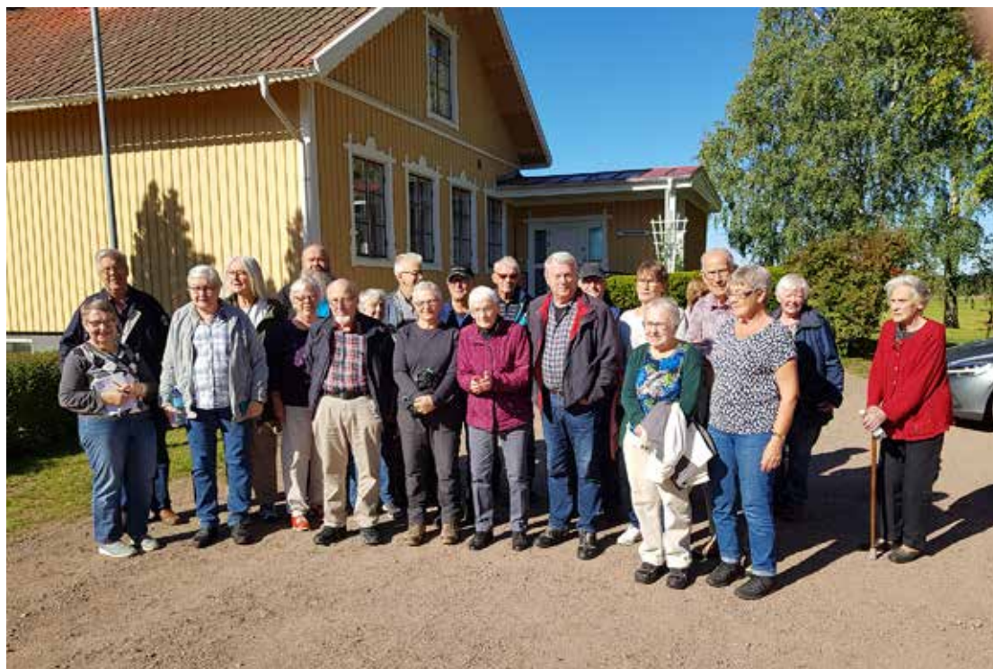
Breviks församlingshem. En bild på gänget som åkte runt och torpvandrade.