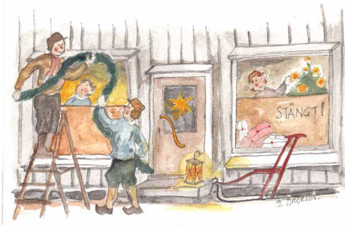
Hemligheter. Va sum gömde säk bakom papert i fönstera va en hemlighet. Teckning: Börje Brorson

Dä ä en gammel tradition mä julasköltning i affärer. Men ja tror att dä va roliare på femtitalt mä sköltsöndan än dä ä i da. Nu för tia ä affärer i stan öppna för jämnan, sönda sum varda. Julsakera kommer fram i slutet på oktober. Därför blir dä inte julstämning på samme sätt sum förr i tia. Dä va sköltsöndan en reckti fest. Bussa geck dubbla turer frå landsbögdä för att alla sum velle sulle kunna åka te stan å se grannlöta.