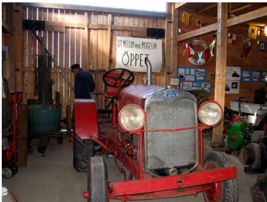
I museet finns den här Ford-traktorn av äldre modell.