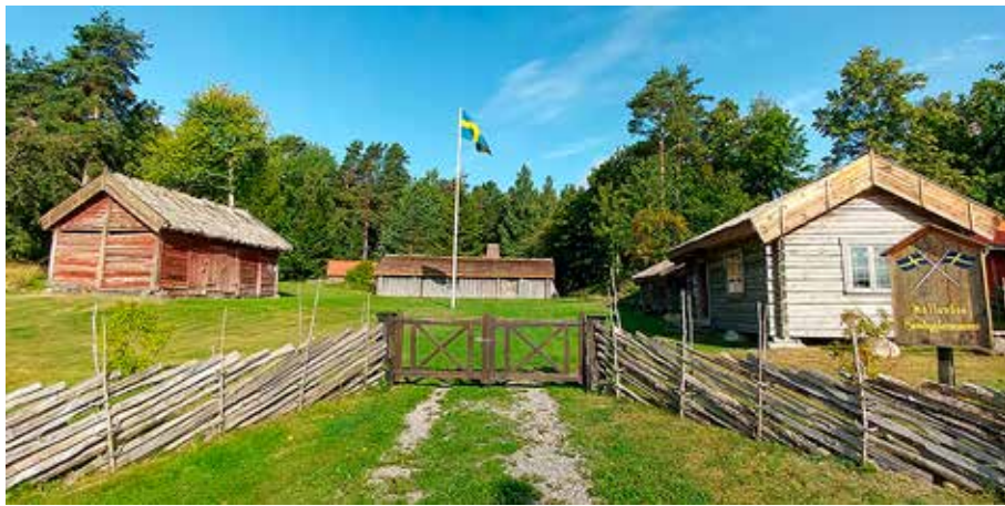
Hembygdsgård på Kållandsö. En vacker sommarbild. Kållandsö Hembygds- och Formminnesförening fyllde 100 år 2019.