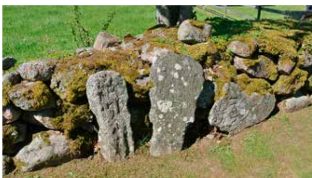
Tre äldre gravstenar, fint uppställda framför muren.