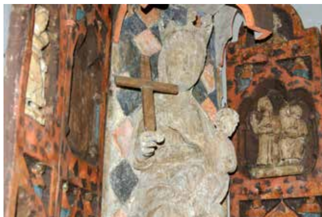
Madonna. Del av en madonnaskulptur i ett altarskåp från 1275–1300.