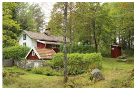
En idyllisk bild av backstugan.

Idag kan man glädja sig åt att ha räddat ett ovärderligt kulturminne, den enda byggnadsminnesförklarade backstugan i vårt län. Verksamheten är mycket omfattande, och engagerar både unga och gamla. Bland annat har förskolebarnen fått pröva på potatisodling. Vi får i det sammanhanget också en rejäl lektion om potatissorter som finns att välja på.