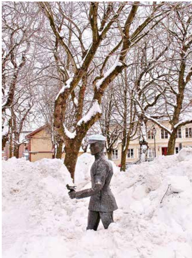
Skaradjäknen med sånglärkan ser ut att trivas även i djup snö.