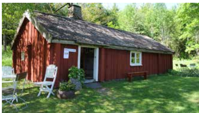
Ryggåsstuga i trädgården utanför Crea Diem Bokcafé i Od.