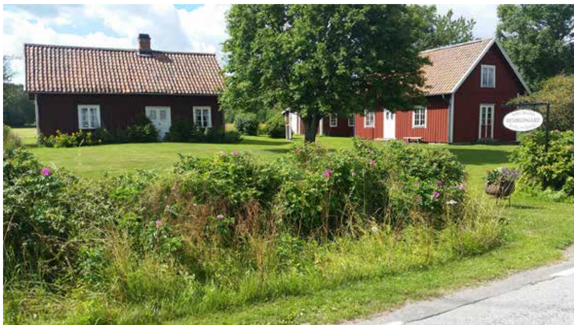
Björkandersgården i Böja. Norra Billings Hembygdsförening. Samlingssal i Lilla Bodarne till höger.