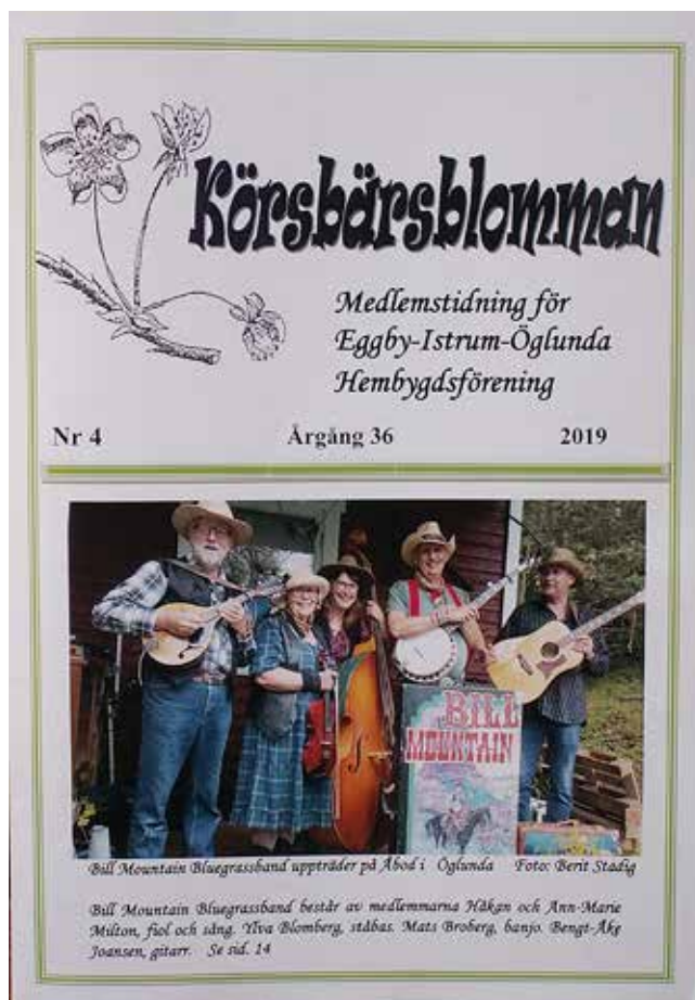
Omslagsbilden visar Bill Mountain Bluegrassband som uppträdde i Öglunda.