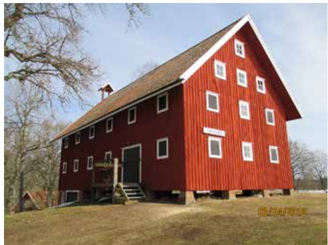
Skogsmuseet på Remningstorp. Norra Billings Hembydsförening.