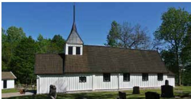
Jällby kyrka. En bild från en vårutflykt 2014. De äldsta delarna av kyrkan tros vara från slutet av 1100-talet, men den är ombyggd under 1700-talet.