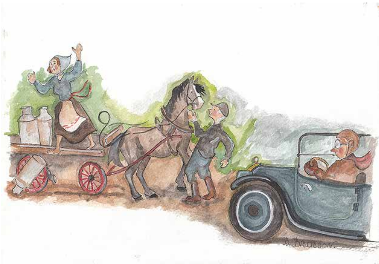
Börje Brorson skildrar mustigt problemen när hästar och bilar skulle samsas.