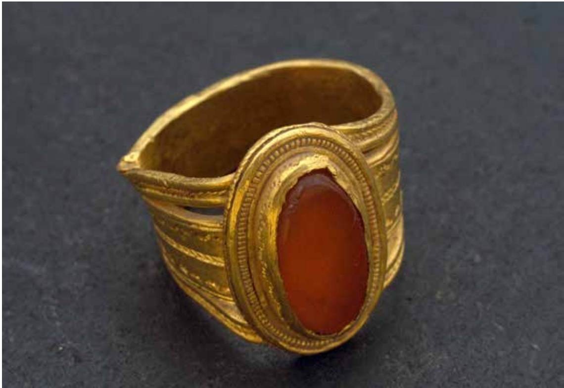
Guldring, upphittad i Forsby 1848. Foto: Ulf Bruxe, Statens historiska museum, CC BY. Ringen finns nu i Guldrummet. (Creative Commons licens på föremålsbilder enligt https://creativecommons.org/licenses/by/4.0/deed.sv )