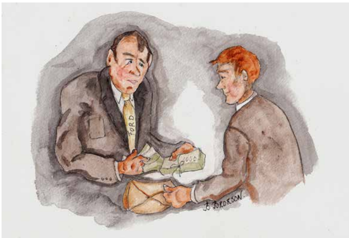
Illustration: Börje Brorson.

På sjuttitalt va ja bekanter mä en sum hette Gunnarsson å sum sålde toapaper å köksrulla te en hoper ICA-handlare runt i kring. En gång berättat han för mäk hur dä geck te när han sulle buta te en nuare Ford. Han åkte in te Olle i stan sum sålde Ford. Han geck in på kontort, satte säk ve skrivbort mett emot Olle å framförde sett ärende. Så häringa ungefär berättat han um hur affärn geck te.