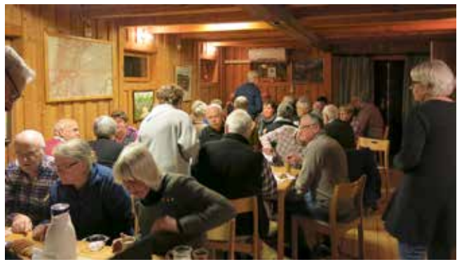
Bildvisning i Grönköping, Skepplanda Hembygdsförening.

Flera bilder på Kyrkskolan från olika epoker visade utvecklingen. Från början hade man ett magasin för säd på vinden, säden lånades ut till bönder mot ränta. På bilden skymtade sockenmagasinet, som byggdes 1868 och därefter fyllde denna funktion. Sockenmagasinet flyttades senare till Försörjningshemmet/gamla ålderdomshemmet i Skepplanda. Sedan 1988 finns magasinet på Skepplanda Hembygdsgård och används som samlingslokal och museum.