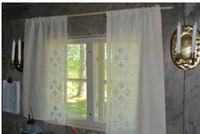
Kyrkgardiner. Det är inte ofta man ser gardiner i en kyrka. Enligt guiden så hade gardinerna hängt där i cirka 50 år.