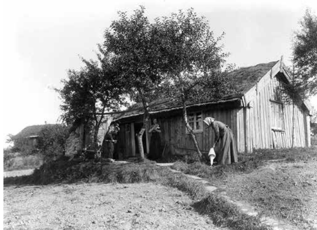
Soldattorp, sent 1800-tal. Kvinnor utanför ett soldattorp i Borgunda.

Om man räknar med ett genomsnitt av barn som finns noterade i registret till 4,6, och med 1,9 föräldrar samt en hustru för varje soldat, så blir det totala antalet svenskar under åren 1682–1901 som finns i registret i dag ca 3 500 000.