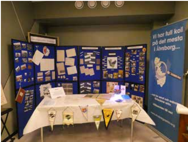
Arkivens dag i Svenljunga. Bildutställning i Teaterbiografen.