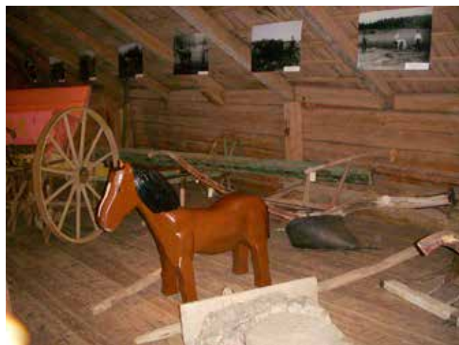
Liten Ardennerhäst att sitta på för de små barnen.

Hantverkarna lämnar ut kniv till barn i målsmans sällskap. I annat fall får man använda säkrare redskap och det brukar åtgå ca en stor kasse bark per vecka.