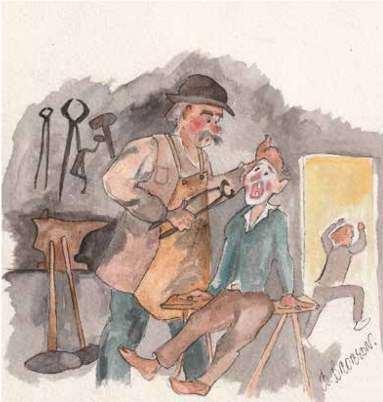
När smen va tannadoktor.

Nôken gång på vårn brukar vi få ett kort ifrå tannadoktorn att vi ä välkomna för kontrollbesiktning. Dä ä la inget ja längtar ätter precis. Men en får la va tacksammer, att dä finns fölks sum vell se te att en blir finer i mun. Di tar allt bra betalt, men ja sulle inte vella stå å gräva i käften på fölks dan i äne, så en får la inte protestera mot betalninga.