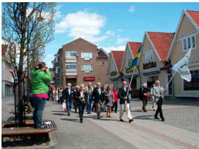
Den som får en hembygdsförening mot sig är i regel förlorad.