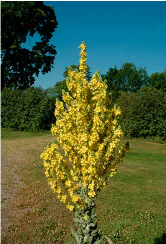
Naturens och sommarens ljus – Kungsljus.