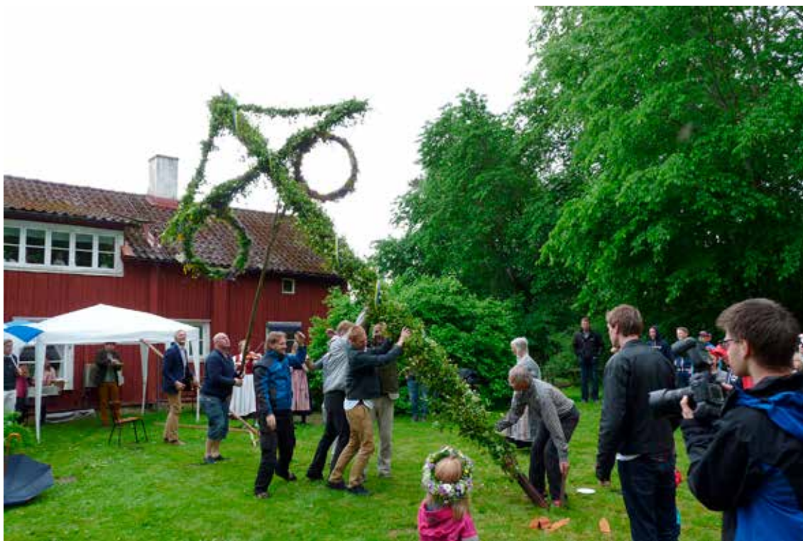
Midsommarstången reses i trädgården till Bönareds hembygdsgård,