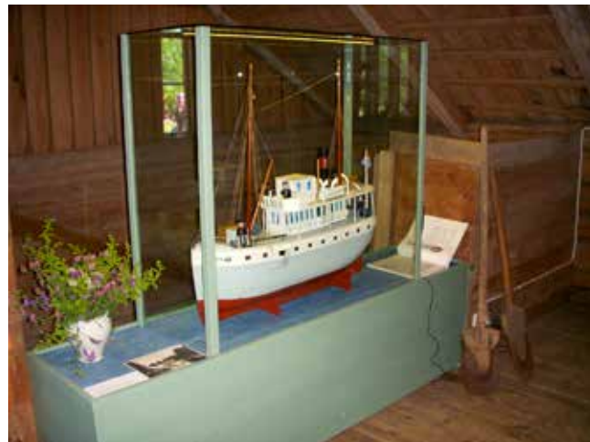
Modell av kanalbåt som tillverkats till Bernhard när han var barn i början på 1900 talet.

också in sitt namn och årtal som blir till en gästbok för barnen. Man kan senare komma och se den rand man vävde eftersom vi sparar alla mattvävar, det brukar vara ca 200 barn som väver under sommaren.