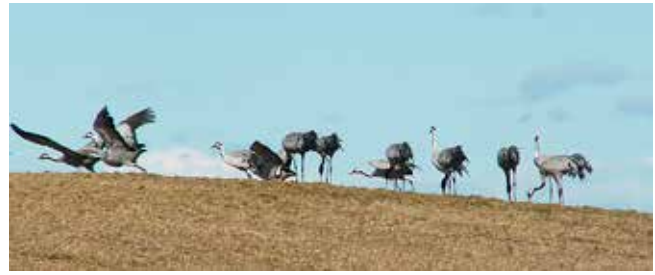
Lidköpingspojken Rudolf Söderberg kämpade för fågelparadiset där tranorna är mest kända.