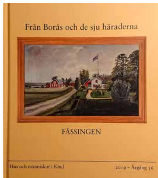
Årsbok. Fässingen – Hus och människor i Kind.

Läs denna bok och ta del av en bortglömd och skadad forn lämning i Västergötland. En sådan här forn lämning av sådan dignitet bör enligt mig klassas som ett riksintresse.