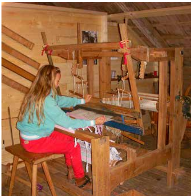
Tyra väver i barnens vävstol.

I vävstolen kan man prova på att väva, då väver man