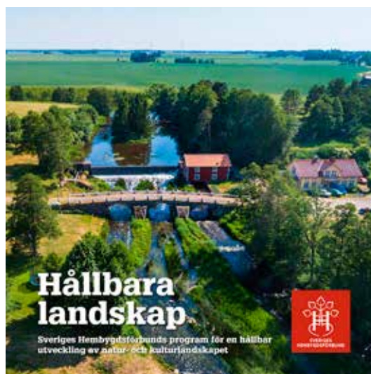
Programhäftet visar på omslaget Resville kvarn i Lidköpings kommun.

Gå gärna in på SHF:s hemsida och ladda ner pdf-filen eller beställ den tryckta versionen.