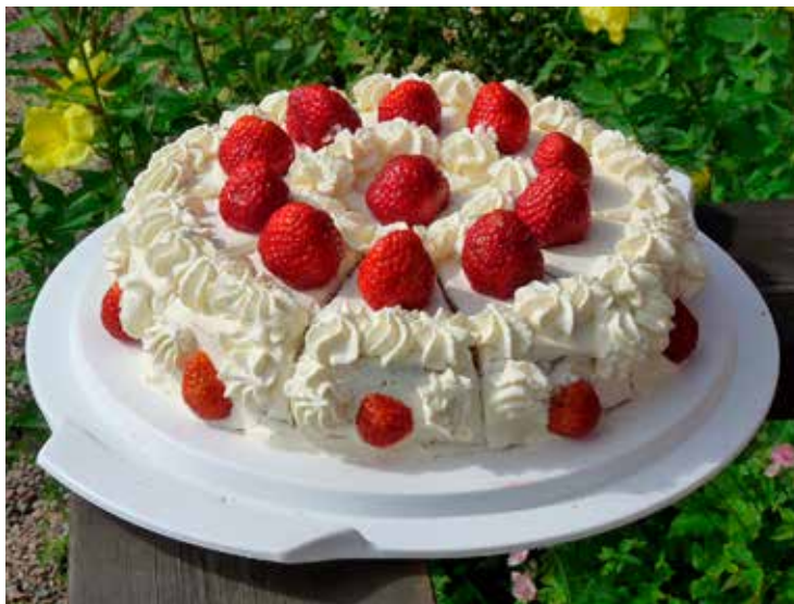
Jordgubbstårta. Sommaren 1985 började hembygdsföreningen sin servering av jordgubbskaffe, vilket har fallit mycket väl ut. Sommaren 2020 är serveringen inställd på grund av coronaviruset.

Nu var hembygdsgården i föreningens ägo och med detta följde naturligtvis ett stort ansvar. Föreningen har använt tiden efter 2012 till att rusta upp delar av gården som blivit eftersatta. Numera finns en hyggligt stor parkering och en modern, handikappanpassad toalett. De senaste åren har föreningen fått möjlighet via länsstyrelsen, läns museet, Mullsjö kommun och EU-pengar att göra en total upprustning av gårdens fyra byggnader. Denna upprustning har gjorts