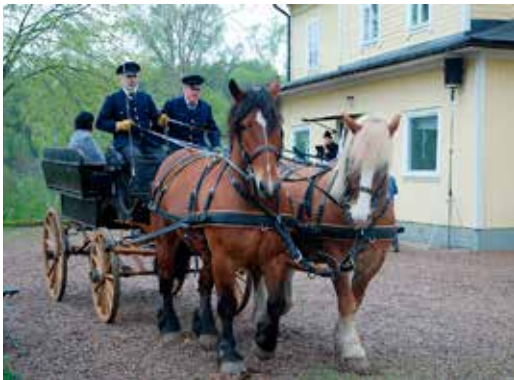
2015 var Tånga hed i Vårgårda platsen för hembygdsförbundets årsstämma.

Detta år, 2020, är speciellt, då ingen vanlig VHF-årsstämma har kunnat genomföras. Istället blev det en digital stämma den 3 juni. Här kan vi blicka tillbaka på de senaste åren utan corona, även om man blir lite fundersam inför figuren till höger, som var med på stämman i Skara 2016. Denne kommer från Lyrestad som blev Årets Hembygdsförening 2016.