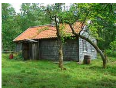
Torpet i Sanhult håller på att restaureras.

Torpstugan och ladugården uppfördes under första halvan av 1800-talet, och föreningens syfte är att bevara och kunna visa hur torpen såg ut omkring år 1900. I Risveden fanns det massor av torp på den tiden, men inget är bevarat som detta. Stugan är liten och trång, har