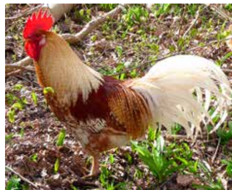
En färgglad tupp i Kinnarumma.