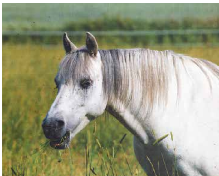
En lycklig häst med munnen full av mat i Stenbäcken, Fågre, under 1990-talet.

Tamhäst ( Equus ferus caballus ) är en domesticerad underart av vildhästen som tillhör släktet hästar ( Equus ). Hästen domesticerades för cirka 6 000 år sedan, och har sedan dess använts som dragdjur eller riddjur. Under lång tid har man avlat fram flera skiftande typer i färg och kroppsbyggnad, vilket utvecklats till dagens hästraser. (Wikipedia)