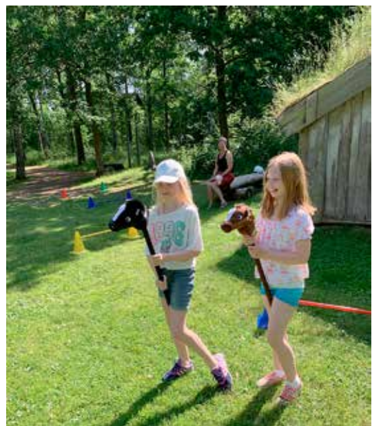
Sommarskoj. Ridtävling med käpphästar.