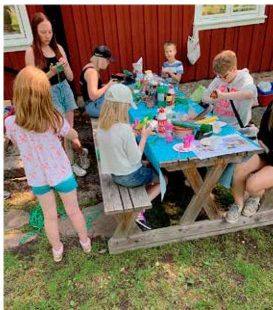
Sommarskoj. Pyssel i Munkgårdens trädgård.