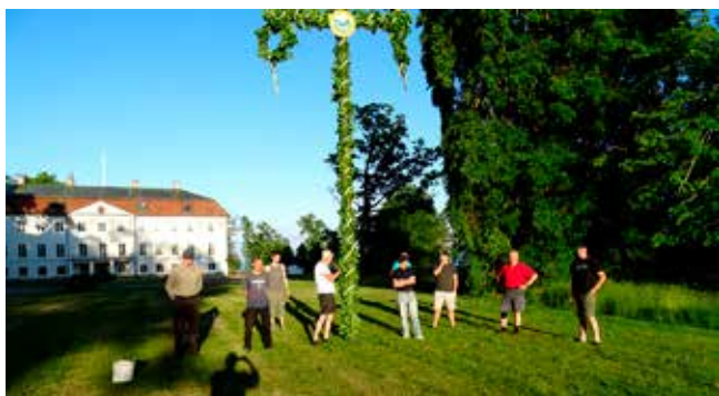
En rad kraftkarlar i Fågelås Hembygdsförening reste midsommarstången vid Almnäs egendom.

Skicka in era berättelser om händelser i nutid och det som ni minns från förr. Teknikutvecklingen under de senaste 60-70 åren har gått snabbt. Minns du den första teven eller radion du kom i kontakt med? Den första datorn eller den första Volvo Amazonen? Hör av Dig! Kontaktuppgifter på sidan 31.