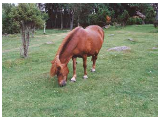
En vacker häst i Ekehagens Forntidsby, söder om Falköping, i början av 2000-talet.