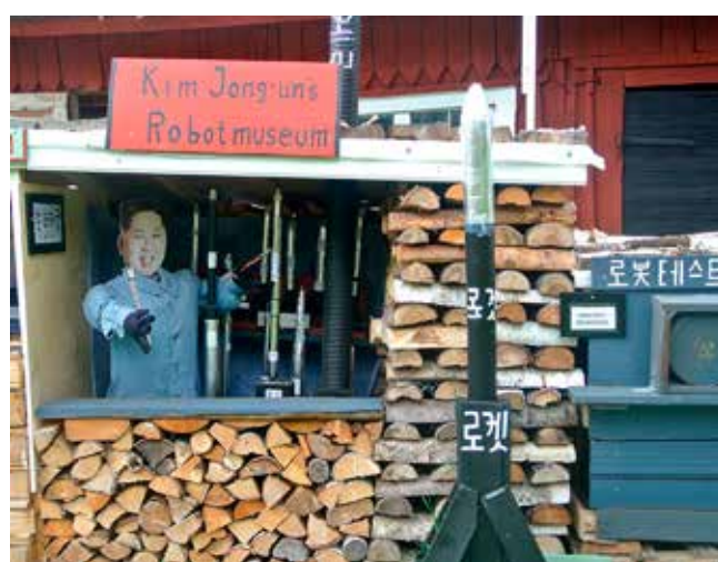
Nordkorealedaren Kim Jong-Un visade sina maktsymboler i ett vapenmuseum.