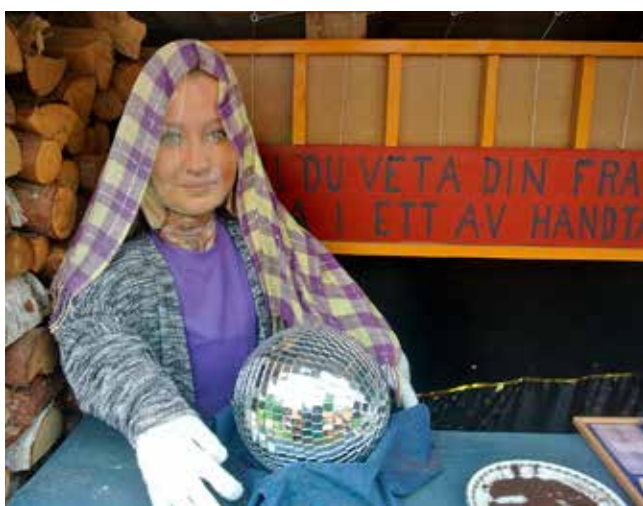
Ebba Busch Thor tittade i sin kristallkula och siade om framtiden.