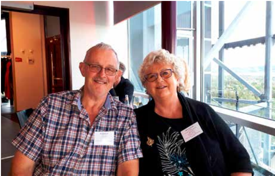
Fotot från Arctura restaurang: Utsikten är vacker, man ser hela Östersund, Byggnaden är 65 meter hög, kallas "termosen" och är ett vattentorn. Restaurangen ligger högst upp. Foto från Sveriges Hembygdsförbunds riksstämma i maj 2019.

Du som läser detta: Undrar Du över hur man ska få tiden att gå? Fråga Ingrid.