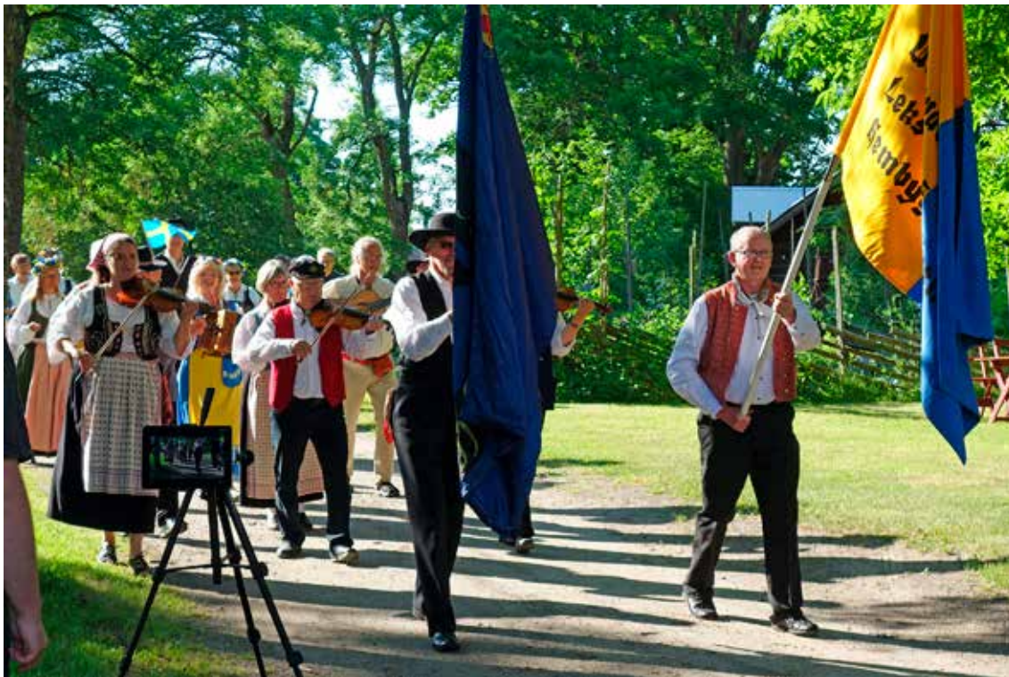
Kortege med fanbärare, musiker, dansare och någonstans därbakom kommer midsommarstången. I vanliga fall innehåller kortegen också massor av barn, men 50-gränsen satte den här gången stopp för dem alla.

I nget har varit sig likt i sommar. Runt om i landet har annonserats om inställda midsommarfiranden. Det var naturligtvis helt omöjligt att genomföra några stora, välbesökta arrangemang så här i coronatider. Men med lite kreativitet fanns det faktiskt alternativ. I Karleby utanför Mariestad genomförde Ullervad-Leksbergs Hembygdsförening ett traditionellt midsommarfirande – men utan publik. Den sedvanligt stora publiken nåddes i stället via föreningens hemsida och YouTube.