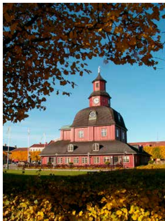
Dessbättre återuppstod det brunna gamla rådhuset i Lidköping.