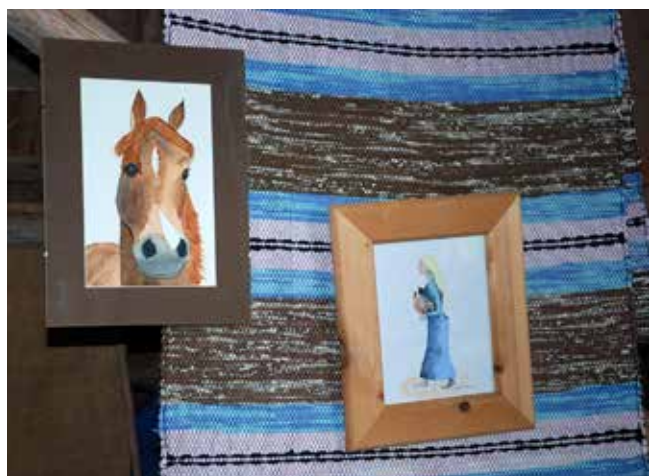
Häst på konstutställning i Varola Storegården i början av 2000-talet. Konstnär: Karin Breman.

Tamhäst ( Equus ferus caballus ) är en domesticerad underart av vildhästen som tillhör släktet hästar ( Equus ). Hästen domesticerades för cirka 6 000 år sedan, och har sedan dess använts som dragdjur eller riddjur. Under lång tid har man avlat fram flera skiftande typer i färg och kroppsbyggnad, vilket utvecklats till dagens hästraser. (Wikipedia)