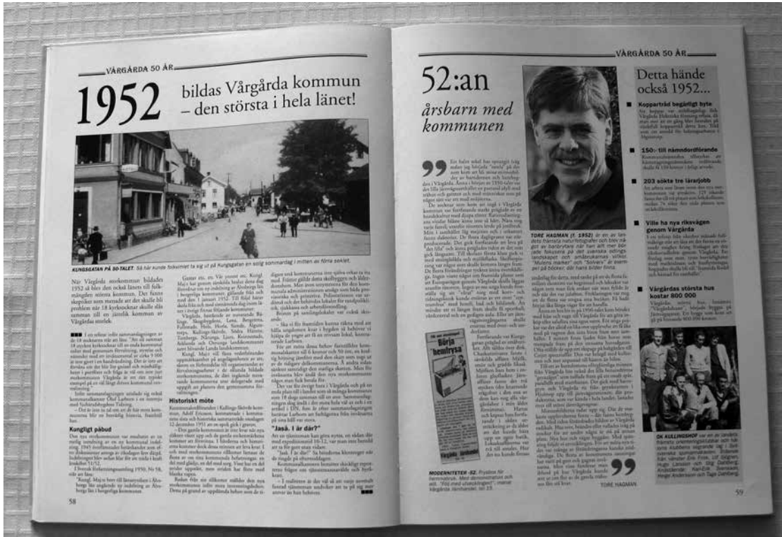
Jubileumsboken. Uppslaget om 1952.

När Vårgårda kommun firade 50-årsjubileum som storkommun 2002 gav kommunen och Alingsås Tidning ut en jubileumsbok som bland annat innehåller ett uppslag för varje år. I boken finns också lite historik och en presentation över företaget och föreningar som var aktiva inom kommunen 2002.