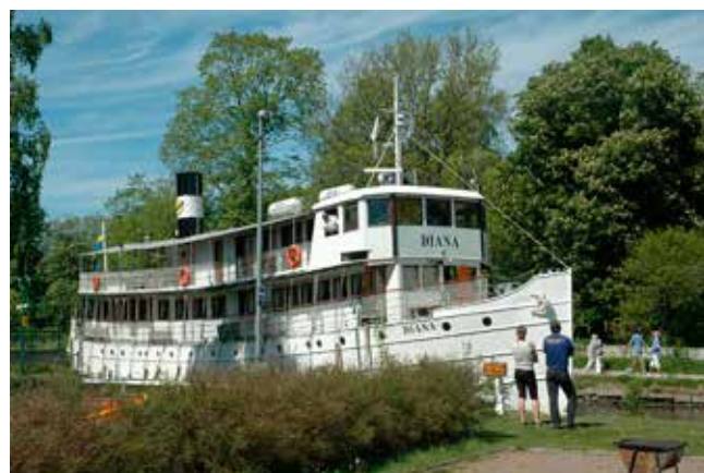
Passagerarbåten Diana, som varje sommar trafikerar Göta kanal, men i år är kryssningarna med kanalbåtarna Diana, Juno och Wilhelm Tham inställda på grund av coronan.