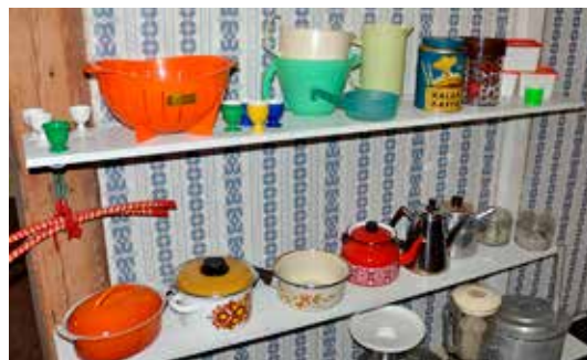
Äldre nyttoföremål i magasinet.