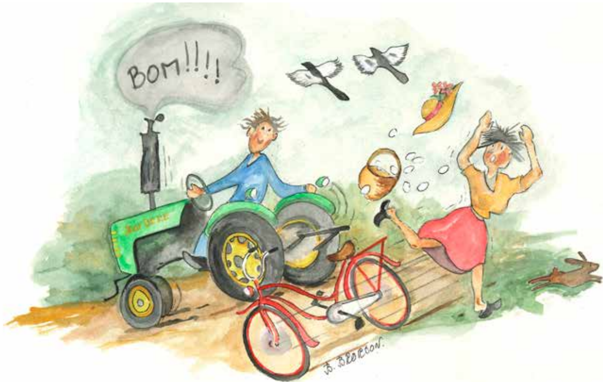
Dä ble löckat. Dä small redit.

F örr i tia åkte gubba te stan på häst å vang. Di feck ge säk å bettia um môran för å hinna in te stan i ti. Dä va kanske marten eller törgda. När dä va fär-ditörgat va dä andra ärende å bestura. Hele dan geck ôt å när dä bar å hemmôt kunne gubba va redit trötta. Dä kunne te å mä hända att di la säk i vagnkôrgen å sôv ena vanna. Hästen kunne ju vägen hem. Då kunne dä hända saker. Min sagesman va födder på 1870-talt å han berättta en gång för mäk, att han å hansa brör hade gått å satt säk bakom nôka buska ve ena li, å när dä kom en hästskjuss skrämde vi hästen så han satte å i sken nerfôr lia. Gubba hade ju inte hört nôkett, han sôv ju. En gång geck dä så illa, att dä ble bara elleve utå vagnkôgrn. Dä va ju fasa uschelt gjort när en tänker påt nu, men då va dä skôjit. Å vi ble aldri besköllda fört heller, sa han. Um du setter å språkar mä nôken gammel gubbe kan du få höra mö sum di hetta på förr. Ja tror inte att ongdoma ä värre nu för tia.