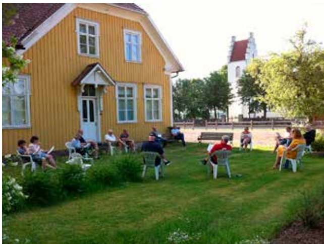
Årsmöte utomhus med Trevattna Hembygdsförening. I bakgrunden syns Trevattna Kyrka med sitt trappstegstorn.