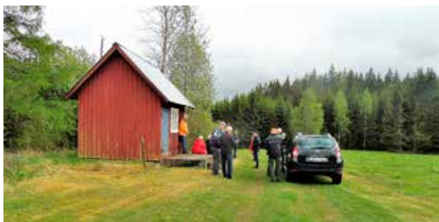
Byavandring i Ljungsarp. Tre fastigheter besöktes i östra delen av socknen.

Ljungsarps Hembygdsförening inbjöd till byavandring i östra delen av socknen, där tre fastigheter besöktes.