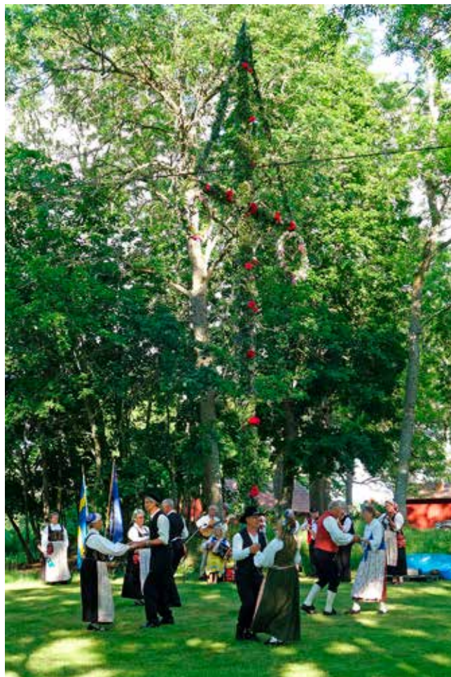
Folkdans kring stängen med Mariestads Folkdansgille och Spelmän.

Blev ditt eget midsommarfirande inställt? I så fall kan du fortfarande fira Midsommar i Karleby. Gå in på föreningens hemsida https://www.ullervad-leksbergs-hembygdsf.se/ och klicka dig vidare!