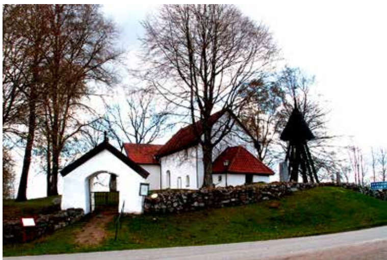
Eriksbergs kyrka hörde till de många som förknippades med de 11 000 jungfrurna som egentligen bara var 11.

Under medeltiden måste varje kyrka ha relikier som på olika sätt minde om heliga personer. Helst förstås lokala helgon, men fanns inga sådana hämtades de från andra håll. Så kunde man hitta ben av 11 000 jungfrur i en rad västgötska kyrkor.