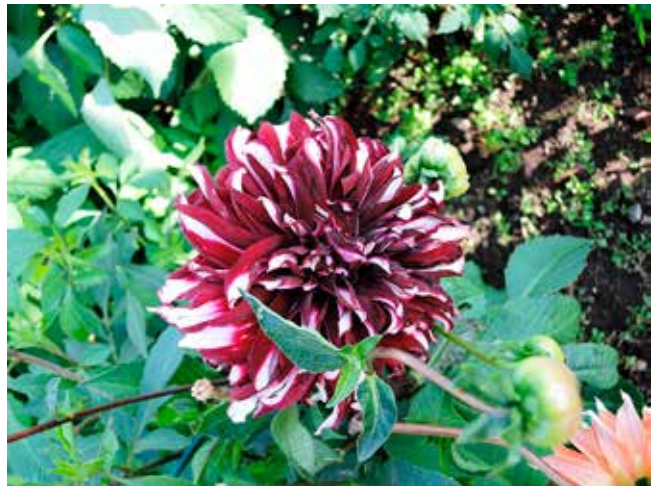
En prunkande dahlia att fästa ögonen på i den blomstrande trädgården i Tostared.

– Lyckliga hund, tänker vi, att få vara hund här måste vara fint.