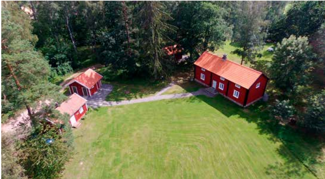
Flygfoto över Fornparken och Munkagården i Götene.

I denna märkliga tid som inte är lik någon annan så har många, om inte alla, aktiviteter måst inställas eller flyttas till framtiden. Så även för oss i Götene fornminnes- och hembygdsförening.