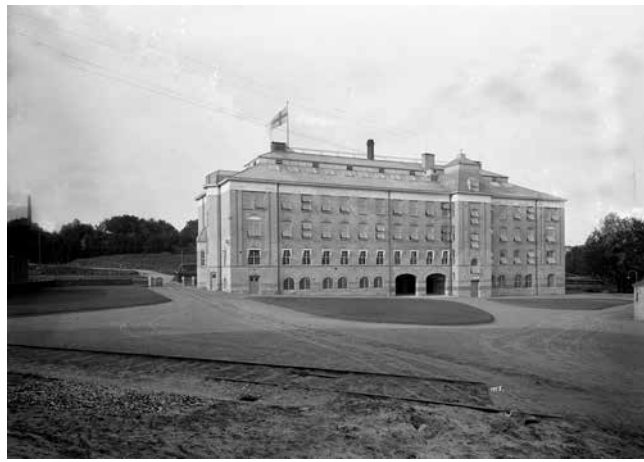
AB Sveriges Förenade Trikåfabriker (EISER) vid Spårgatan. Gårdssidan. Foto: Gustaf Nilsson 1915. Fotot tillhör Borås Stadsarkiv.

Högskolan i Borås etablerades och har byggts ut från den första Bibliotekshögskolan och Förskoleseminariet. Borås har åter blivit ett textilcentrum med Textile Fashion Center, Textilhögskolan och Textilmuseet. Smart textiles är ett nytt begrepp med ständiga innovationer.