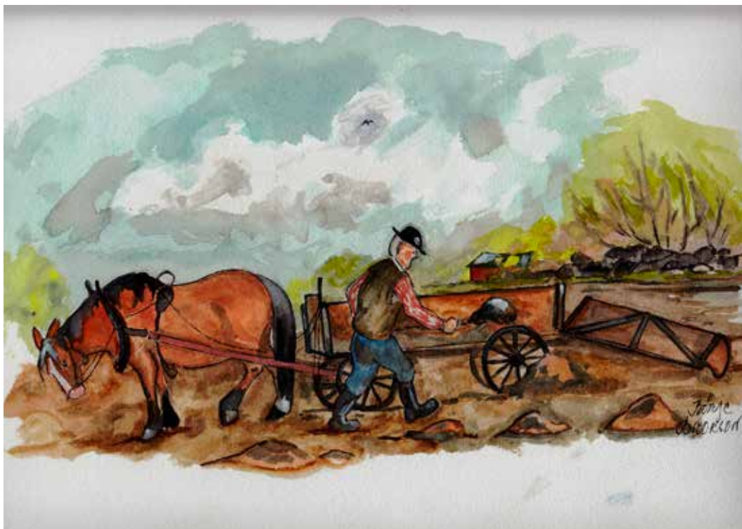
Så kunne dä gå te å köra ut göchla förr i tia.

Tänk secken skellnad dä ä på vårbruket nu mota förr i tia. Nu setter bonnen i traktorn när han sprir ut både göchla å köpegöchla mä spridare. När di plöjer har di en plog sum kan plöja sju fôrer på en gång. Harva hänger bakpå traktorn å harvar en sex-sju meter i taget, å ringvälten kan va upp te tölw meter bre.