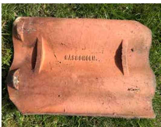
Näsbyholms Tegelbruks AB. En tegelpanna.