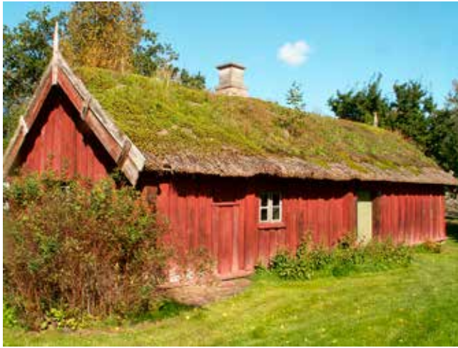
Dikartorpet från Höjentorp kan idag ses i Skara fornby under namnet Höjentorpsstugan.