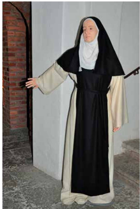
Den här nunnan i museets djupa källare visar vägen till kansliets lagerlokaler.