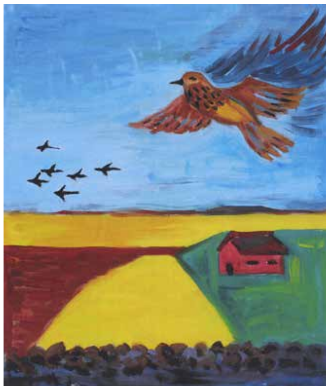
Bild nr 1, Lärkan, i skriften – Från Kullen Kindaberg till Destinationen Kinnekulle. 19 bilder med berättelser och historia om bygden kring Kinnekulle.

Bild och text: Benny Lönn, Västerplana. Tryck: Solveigs tryckeri, Skara, 2021.