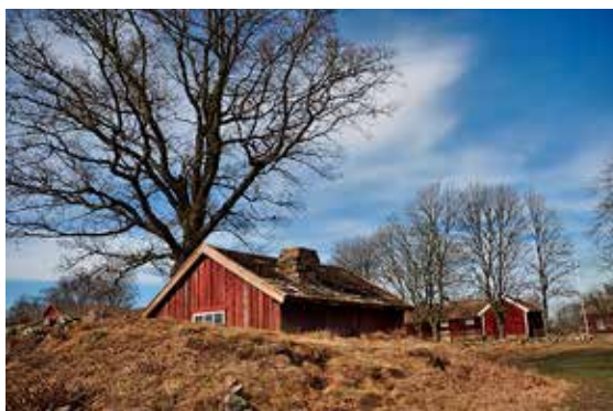
Kulturreseptatet Vallby Sörgården, smedjan. Se omslaget och sidan 10. Sörgårdens smedja ligger här delvis ingrävd i en gravhög från yngre järnåldern. Smedjan uppfördes troligen i slutet av 1800-talet.