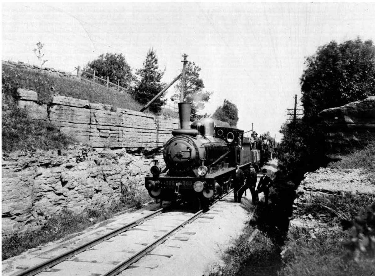
Ett tågfoto från 1903 i en "djup sprängning" mellan Skövde och Stenstorp på Västra stambanan. Söder om Skultorp byter man 1903 ut rälsen som lagts 1896. Då vi inte har något foto från kronprinsparets resa år 1881 så får detta foto ge en tidsbild från slutet av 1800-talet och början av 1900-talet. Fotograf är Karl Fredrik Andersson (1865–1949), en lokal bygdefotograf i Skaraborg. Innehavare av Firma Karl Fr. Andersson, etablerad 1895 i Skultorp. Verksam från samma år i denna ort med omnejd. Karl Fredrik Andersson har främst fotograferat folket i de små stugorna på landsbygden.

mitt för fruntimmersläktaren slog kronprinsessan ned ögonen troligen av blygsel öfver de många ögon som då rigtades på henne. Då de voro mitt för afstigningsplatsen stannade tåget på gifven signal. Dörren öppnades och nu steg kronprinsen ut ledande Kronprinsessan vid armen. Skövde arbetarförening viftade med hattarna samt uppstämde ett trefaldigt hurra då de gingo öfver plattformen. Då tåget blef synligt uppspelades folksången.