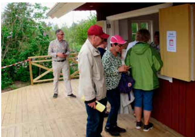
Premiär. De första kunderna vid den nya serveringslokalen.