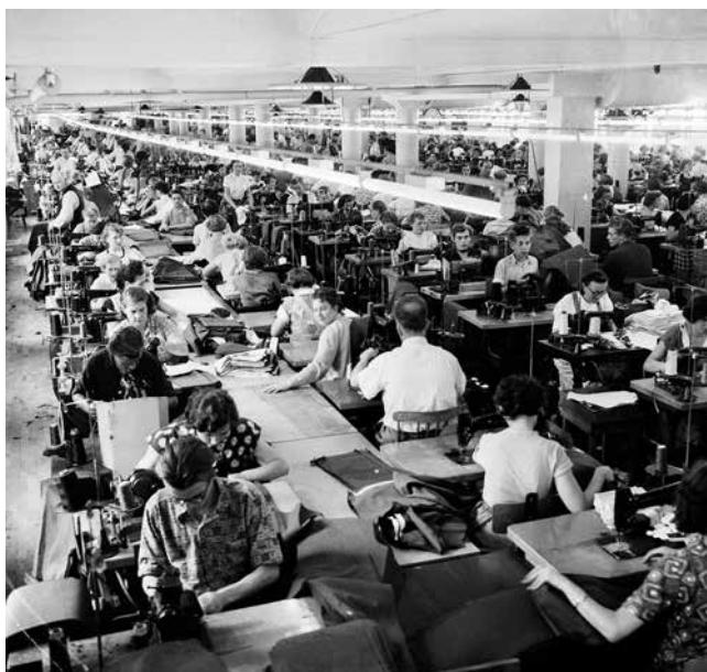
Algots fabriker, Borås.

Gårdfarihandeln och den textila verksamheten dominerade Sjuhäradsbygden. Råvarorna var lin och ull, men i början av 1800-talet kom bomullen. Hemvävna den organiserades av förläggare som t.ex. Sven Eriksson. Han startade år 1834 tillsammans med två kompanjoner Rydboholms Konstväfveribolag. Så småningom etablerades textilindustrin i Borås omkring 1860. Borås Wäfveri grundades 1870, Druvefors Wäfveri 1871 och