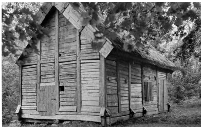
Byggnaden på fotot är ladugården som tillhörde soldattorpet Eriksberg, Stora Mellby Rote 344. Den är flyttad och finns numera i Gräfsnäs slottspark. Min farfar, som också var knekt en del av sitt liv, hade soldattorpet bredvid i Stora Mellby. Kring detta finns också en historia, men den är lång och kan inte få plats här, förutom att; de två ladugårdarna låg i kors så man fick korsa varandras väg i knuten för att komma till sin ladugård! Fotot finns i Vänersborgs museum.