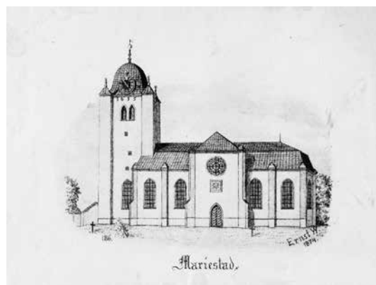
Mariestads kyrka, tecknad av Ernst Wennerblad.

Möller presenterar en lång rad kyrkoteckningar från Mariestadsbygden plus en nytagen bild och information om kyrkan. Ett bra sätt att utnyttja den konstnär-