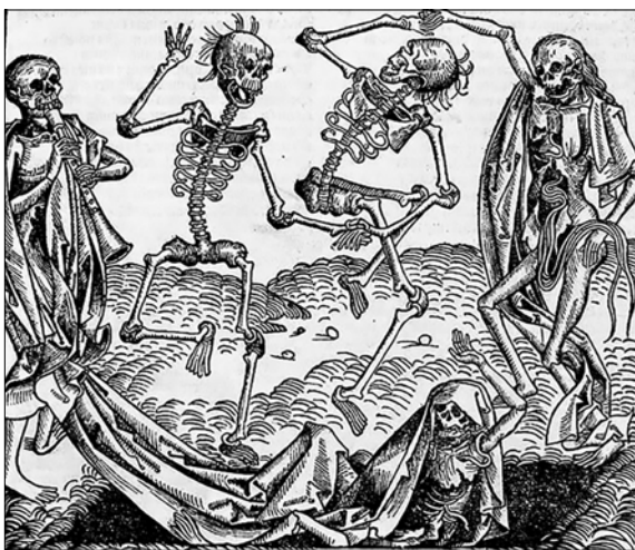
Dödsdansen, förmodligen ritad av Michael Wolgemut 1493, får illustrera skräcken under kolerans härjningar.

Idag kretsar allt i nyheterna om covid-19 och hur den skall stoppas, eller i alla fall undvikas. 1834 var det koleran som spred skräck. I februari det året förklarades Norge fritt från kolera så man beslutade att hålla tacksägelsegudstjänster i Sveriges kyrkor eftersom vi förskonats från sjukdomen.