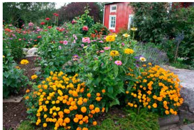
En härlig sommarbild från Dahliälunden i Älekulla. Se Västgötabygden nr 1 2021.