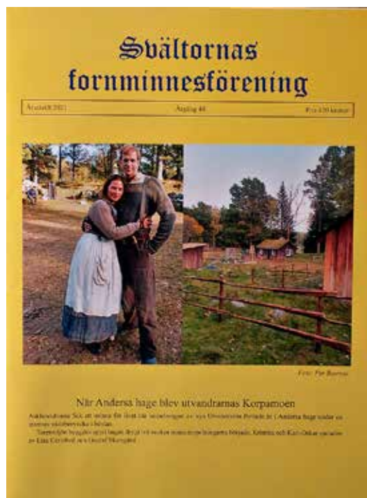
En ny film om utvandrarna från Korpamoen spelades in i Andersa hage i Asklanda.

Gustafson som blev amerikansk krigshjälte och fick ett fartyg uppkallat efter sig, USS Gustafson.