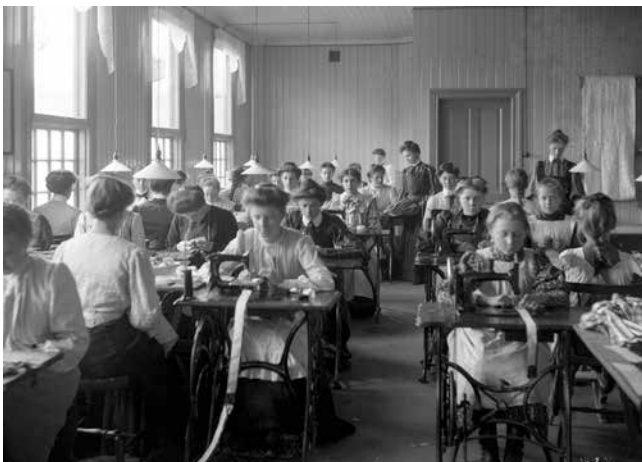
Borås Kravattfabrik. Foto: Gustaf Nilsson 1906. Fotot tillhör Borås Stadsarkiv.