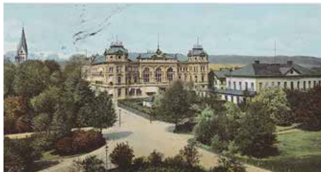
Hotell Skövde är den vita byggnaden som ses till höger i bild. Järnvägsstationen är belägen ungefär där fotografen står. Hotell Billingen var inte uppfört 1881, utan det stod färdigt först 1888.