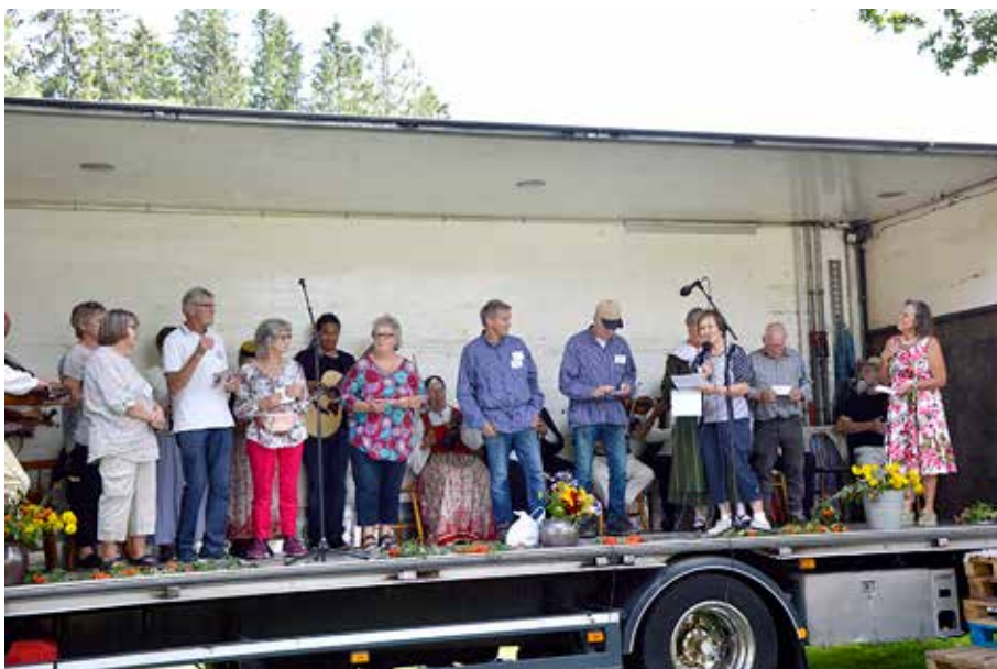
60-årsjubileum i Södra Vings Hembygdsmuseum. 160 personer deltog i en barn- och familjefest.

Söndagen den 22 augusti firade Södra Vings Hembygdsmuseum 60-årsjubileum vid hembygdsgården Bogastugan. Föreningen bildades hösten 1961.