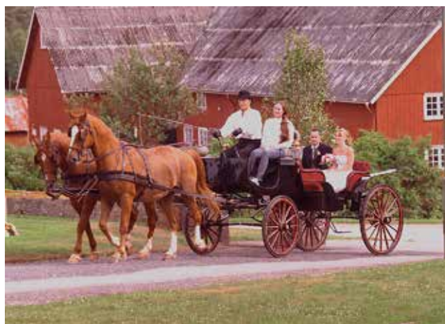
Ett av museets eleganta hästekipage med kusk, Stens dotter som medhjälpare och ett brudpar.