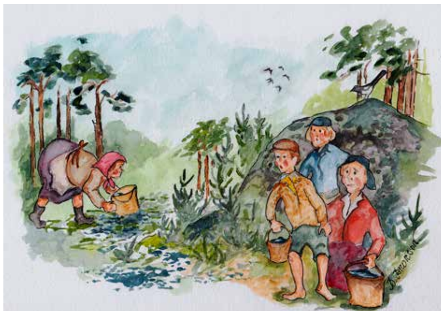
Vi satt där å tröckte länge å höppades att ho inte skulle komma på öss.

E n gång i metten på augusti ble vi bjudna te Majes. Dä ä ett ställe i ena grannsocken. Dä bor inte nôken där nu för tia, både stûva å fäghust ä revna för långesina. Men di sum äger stället har böggat upp ett aent litet hus, men dä bor ingen där. Iblann ä scoutera där, å iblann kan dä va nôka förening sum träffas där.