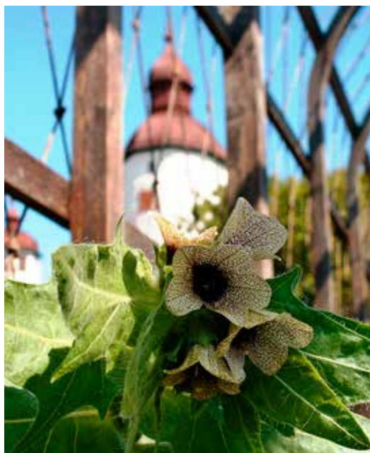
Bolmörten är giftig men flitigt använd som medicin.