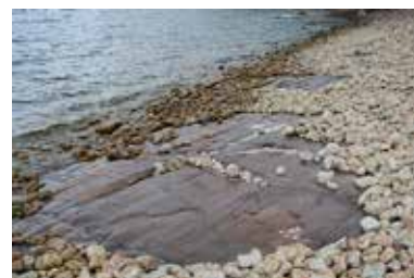
Bild 4: Foto den 8 augusti 2021. Nutida klapperstenstrand på Kinnekulle. Hur kommer det se ut här om 500 miljoner år?