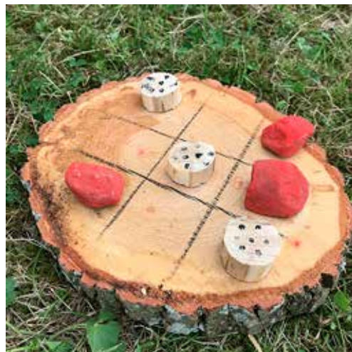
Egentillverkade luffarschack finns nu i många hem i trakten. Stenar, träbitar, kottar och småpinnar. Det finns mycket i naturen som går att använda som spelpjäser. Med hjälp av knivar och målarfärg blev varje spel unikt.