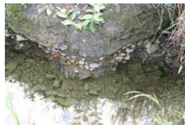
Bild 2: Foto den 4 augusti 2021. Ena sidan av "rännan". Överst är det fast berg av sandsten. Under det kommer konglomeratet, ihoppresade klapperstenar och sand. I "rännans" botten är det speglande vatten och nedrasat sandstenskross från fräsningen.