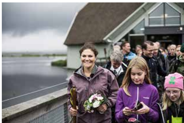
HKH Kronprinsessan Victoria Västergötlands Hembygdsförbunds beskyddarinna

Bilden ovan är tagen vid Kronprinsessans vandring i Västergötland i september 2017.