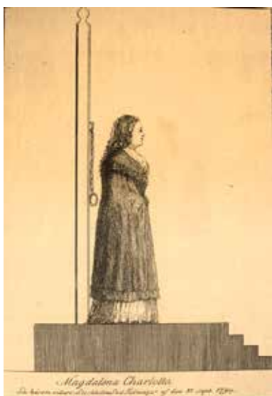
Tidningsskvalver. Naturligtvis missade stockholmarna inte dramatiken. En av den tidens tidningsbilder.

Alla känner till agent 007, James Bond, med rätt att döda, men hur många minns agent 006, Magdalena Rudenschöld, med rätt att älska? Ja, möjligen några i trakten av Kroppfjäll ut- anför Gullspång, men annars?