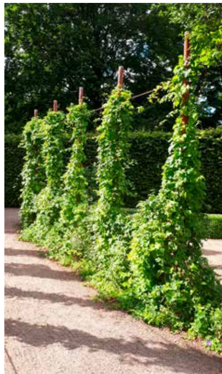
Humlestöror i Jonsereds Trädgårdar..

HembygdVäst stöds ekonomiskt av Västra Götalandsregionens kulturnämnd. Ett stöd som vi är mycket tacksamma för. Tack vare det stödet kan vi erbjuda våra föreningar en omfattande och kvalitetsmässigt bra verksamhet.