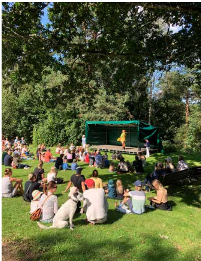
Nedanför scenen var uppslutningen total, då Pippi Långstrump framträdde.