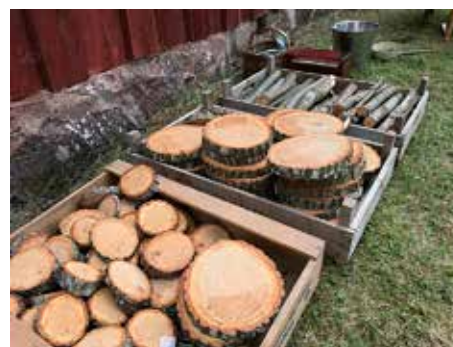
Billigt material från bygden som barnen kan använda kreativt.