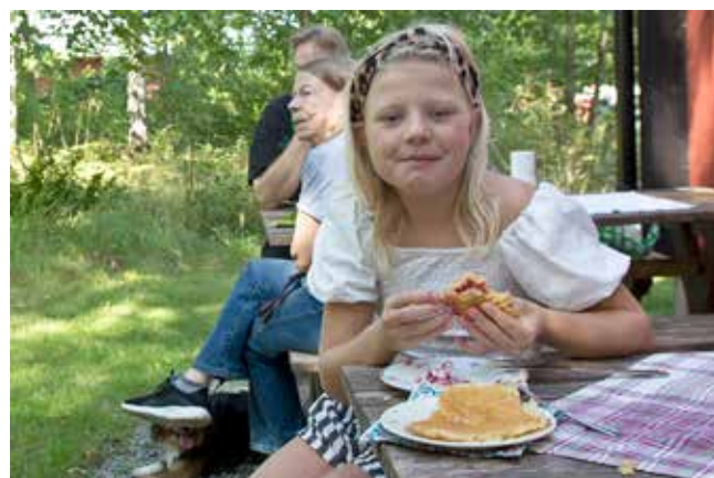
Både små och stora lät sig väl smaka av goda nybakade våfflor med sylt och grädde.