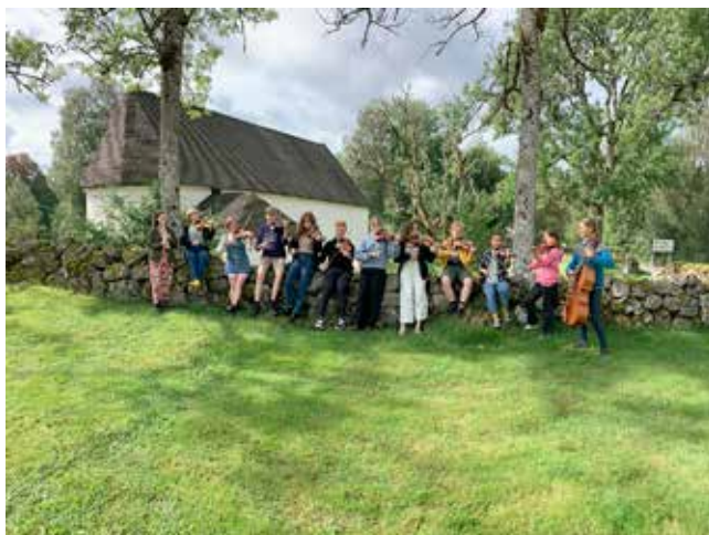
Att få vara med på Ornungastämman är en höjdare tyckte dessa ungdomar.