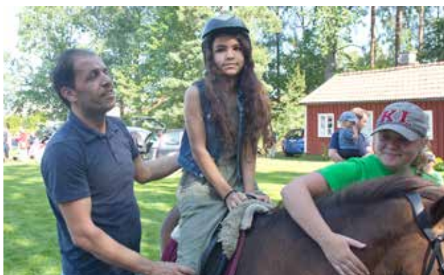
Ponnyridningen var populär och lockade många barn att prova på hästryggen.

Under förmiddagen och över lunchtid så var trycket stort med många besökare. Föreningens ”kaffetanter” Runa, Marianne, Mona, Ranita och Mailis hade fullt upp med att grädda våfflor och servera kaffet och ta betalt. Kön till kaffet ringlade sig lång.