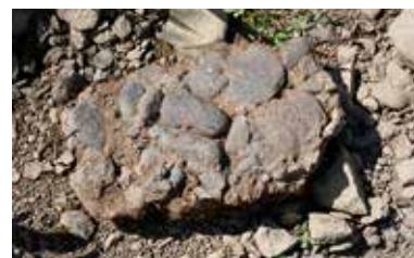
Bild 3: Foto den 4 augusti 2021. Ett av schaktmassornas konglomerat. Oklart från vilken nivå det kommer. Rundade klapperstenar som hamnar under hårt tryck kan plattas ut, och så tycks det vara.