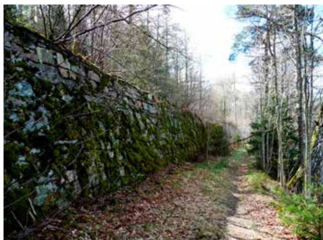
Hästabräckan i Hemsjö. Rampen är så välbyggd att den är likadan efter 160 år.