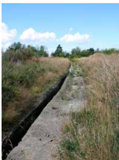
Bild 1. Foto den 4 augusti 2021. Schaktet mot väster med den uppfrästa "rännan". Det står vatten i den borte delen.

Den största upptäckten just nu är en fossil stenstrand i Blomberg. Vid Stenhagsvägen mellan stationssamhället Blomberg och Blombergs gamla kalkbruk, på nivån ca 40 m över Vänerens yta, ligger ett plant åkergräde med vittringsjord. Jorddjupet är ca en halvmeter och jorden överlagrar den underliggande sandstenen, en sedimentbergart, som sträcker sig ända ned till Vänerstranden.