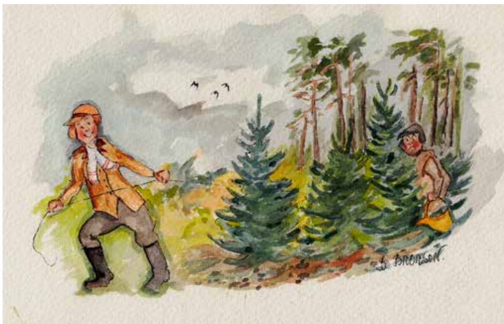
Köpter eller fådder gran ä bätter än ena knöckter.

När du setter å läser den häringa tinninga står snart jula å bankar på dôra. Då har du kanske börjat grunna på um du sa ha nôka julagran. När ja va liten hade vi bara stearinljus i julagrana sum sto inne i bästarummet. Ljusena va bara tända ena lita stunn på julafta, å då feck en se ätter grana så dä inte tog ell i glittert eller julgranskaramellera. När en hade julakalas hände dä att en tände julgransljusena ena lita stunn.