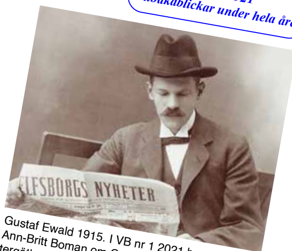
Gustaf Ewald 1915. I VB nr 1 2021 berättar Ann-Britt Boman om Gustaf Ewald, en av Västergötlands första pressfotografer, en förgrundsgestalt inom hembygdsrörelsen. Han blev Västgötabygdens förste redaktör 1946.