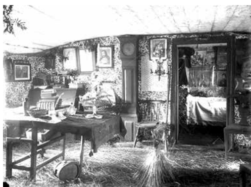
Julhalm på golvet, julbocken, Hudene, 1903.

”För övrigt var julbaket av stor vikt och ingick häri en hel del vidskepligheter med 'signerier', läsning, kors-teckning och dylikt. Mjölet siktades med 'tagelsekt' och finare bröd med 'florsekt'. I ett välmående hus bakades först en tunna råmjöl av vars ena hälft grovt 'blannbröd' (med tillsats av havremjöl) och av den andra hälften som siktades gjordes fint siktbröd som knådades med vatten, och en del 'vörtbrö' som knådades med söt vört. Även gjordes limpa och 'leva' vilket överströkos med vörtsirap eller enbärsbrännvin. 'Julleven' bakades sär-