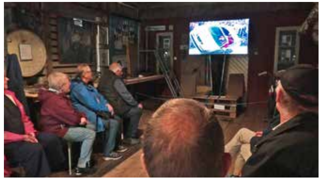
Rallyfilmvisning på storskärm i Godsmagasinet.

Börje Andersson Nossebro Hembygdsförening