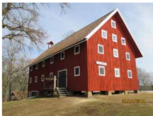
Skogsmuseet på Remningstorp mellan Skövde och Skara. Norra Billings Hembygdsförening.