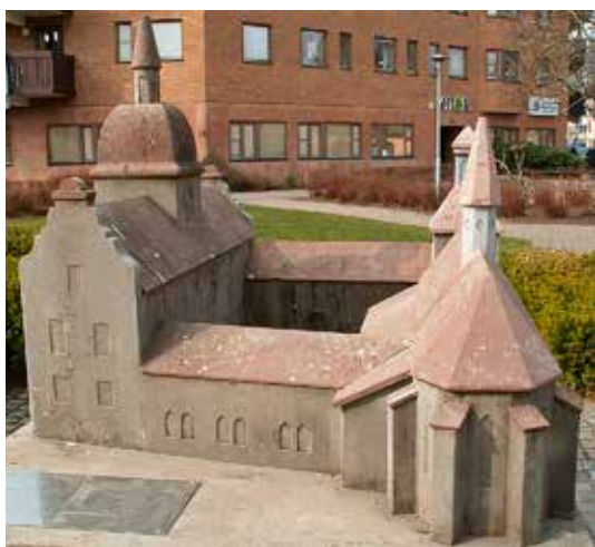
Skara. Gälakvistborgen ersattes i slutet av 1500-talet av Skara borg där landshövdingen skulle ha bott. Idag kan vi se en modell av borgen. Läs mer på sidorna 18-19.