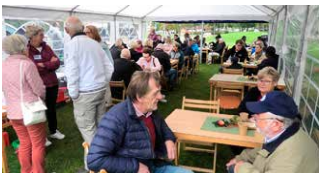
Flera tält var uppsatta på gräsplanen invid Stationshuset. Här serverades förutom kaffe med hembakt även rallykottlett och potatissallad.

Åtta (av totalt nio) av kommunens hembygdsföreningar, varav en bygdeförening, nappade på idén och inbjöd under helger från den 1 augusti till mitten av september till visningar, utställningar och hantverksdemonstrationer.