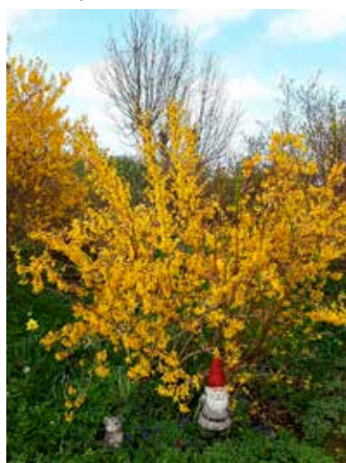
Tomten tittar fram under forsythian i väntan på julen.

Stämman antog den nya verksamhetsplanen för 2022–2024. Den är upplagd på ett lite annat sätt än tidigare. Vi har tjuvkikat på Sveriges Hembygdsförbunds upplägg. Tanken är att den skall vara lättare att följa. Vi har nu sex målområden som vi skall jobba med under 2022. Målområdena kommer att konkretiseras och vidare mynna ut i aktiviteter som blir tydliga för oss alla.