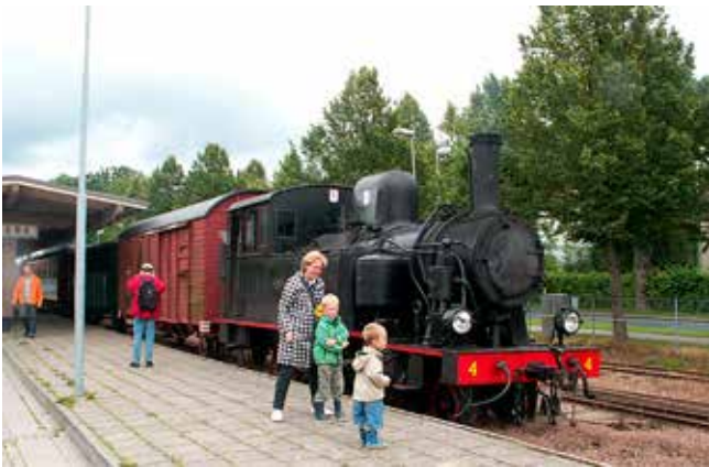
Idag kan vi återuppliva järnvägstiden med hjälp av museibanan till Lundsbrunn.