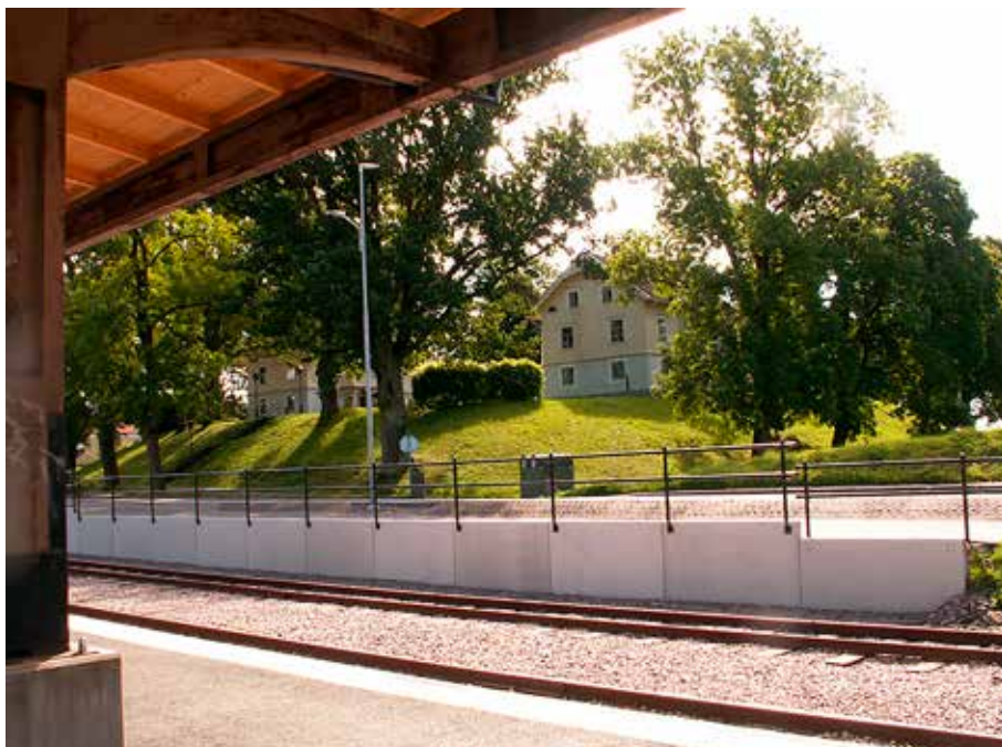
Resterna av kungliga borgen Gälakvist i Skara ligger granne med spåren efter vad som kanske var Nordens största smalspåriga järnvägsstation.

R esterna av kungliga borgen Gälakvist i Skara ligger granne med spåren efter vad som kanske var Nordens största smalspåriga järnvägsstation.