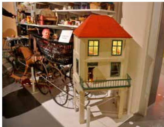
Leksaksmuseet i Kulturfabriken i Skövde är populärt.

säkringsfrågorna. Är ni dubbelförsäkrade? Sedan några år ingår sanering av skadedjur samt husbocks- och hästmyreförsäkring för alla fullvärdesförsäkrade byggnader, ej oisolerade byggnader, i Hbf-försäkringen.