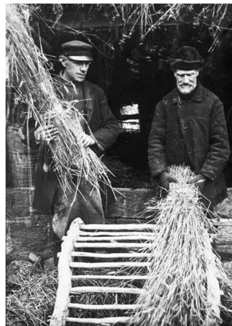
Rågböstning Grimstorp, Hudene, 1903.

skilt och gömdes till våren för att ätas då vårarbetet påbörjades och kallades då för 'säsleven' eller 'såkaka'. Det grövre brödet hängdes på spett på 'flaken' och det bättre lades på stänger.”