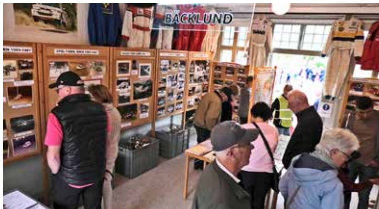
Ny idé i gamla hjulspår, Nossebro. I Stationshuset var elva skärmar fyllda av bilder, kartor och diplom. Läs vidare på sidorna 16-17.