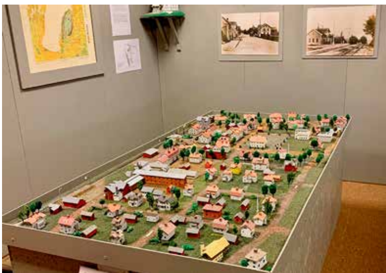
Götene. Götene centrum från 1950-talet i miniatyr. Läs mer på sidan 13.

God Jul och Gott Nytt År! tillönskas alla våra läsare!