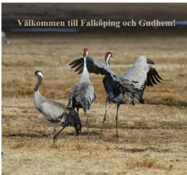
Trandans vid Hornborgasjön.