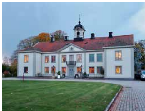
Herrgårdsbyggnaden och tillika officersmäs- sen Sätenäs. Foto: Försvarsmakten/Ove Larsson, 2021.