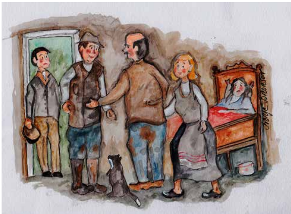
Ho lurte dum. Sjúker va ho inte, men ho hade en friare sum Farn inte vesste um.

N u för tia töcker vi att dä ä självklat, att dä ä di sum sa gefta säk sum sa bestämma vem di sa gefta säk mä. Iblann kan vi läsa um att dä förekommer tvångsgefte å då blir vi upprörda.