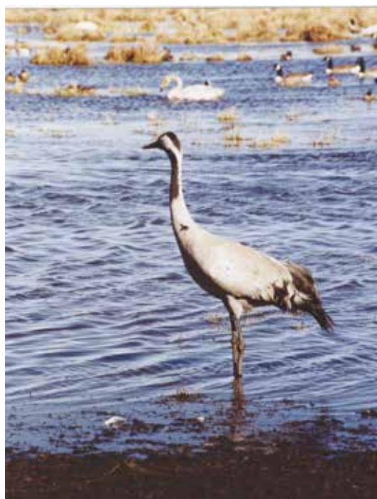
Trantider. Bra föreläsningar om Hornborgasjön på sidan 29.