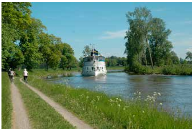
Populär cykelled. I nutid tar många, såväl turister som närboende, gärna en cykeltur utmed kanalen.

I början av 1800-talet ingick knappast ordet kändis i vokabulären, utan här var det mäktiga, härsklystna män som stod i centrum helt enkelt.