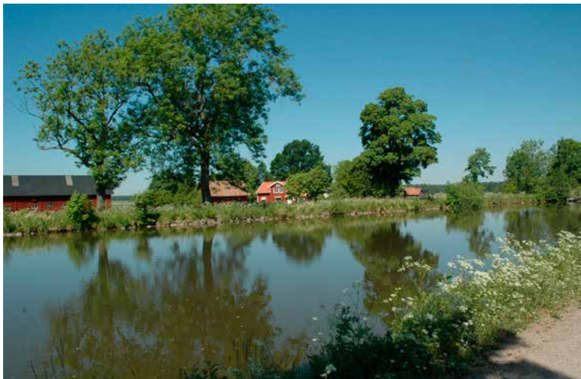
Göta kanal vid Jonsboda, Fägre, Töreboda kommun.

B ygget av Göta kanal började år 1810 och var färdigt 1832. Det är ett av de största byggnadsprojekt som någonsin genomförts i Sverige. Göta kanal sträcker sig från Sjötorp vid Väneren till Mem vid Slätbaken och är 190 km lång med 58 slussar. Av sträckan är 87 km grävd, för hand, av cirka 58 000 svenska soldater.