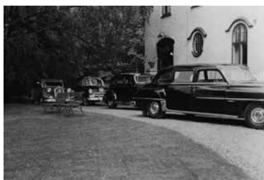
Tre kungliga svarta bilar på Kärrbogärde. 1950-tal.