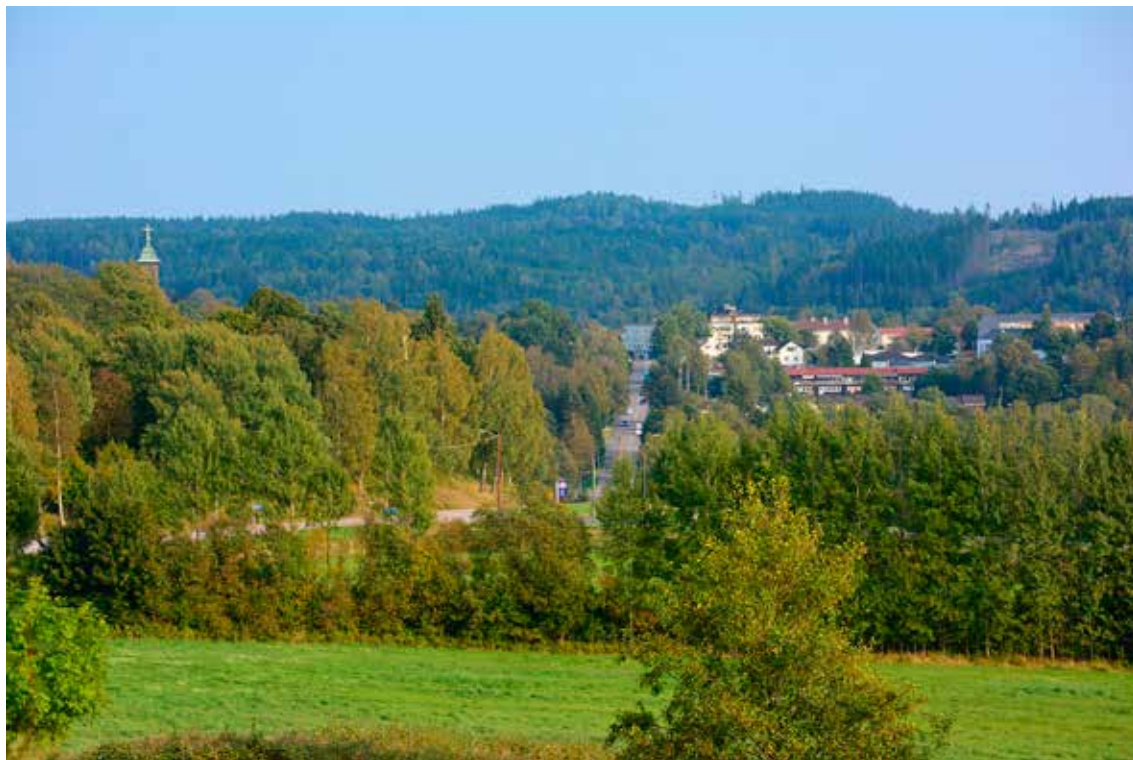
Översiktsbild över Bollebygd.

B ollebygds kommun ligger i västra Västergötland mellan Borås och Göteborg. Läget gör att många arbetar i dessa städer. Göteborg med förorter drar till sig de flesta, men ca 20 procent arbetar i Borås. R 40 har byggts ut till motorväg, så förbindelserna är goda. Diskussionen om höghastighetståg har pågått i många år, och de är ännu inte avslutade.