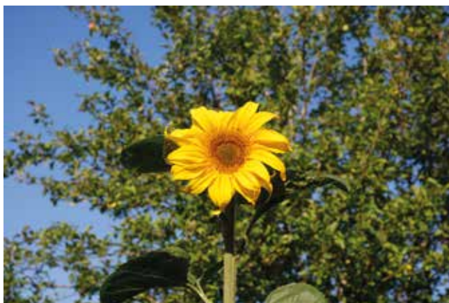
Vi tackar honom postumt.