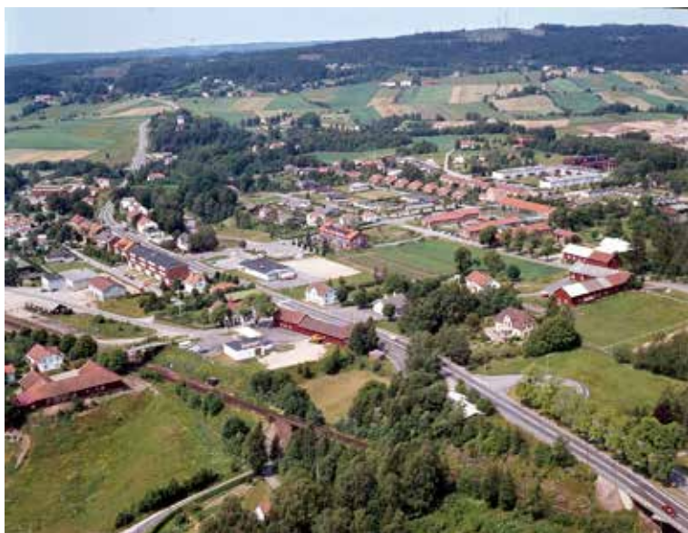
Flygfoto över Bollebygd 1976. Årsstämma i Bollebygd den 14 maj, se sidorna 5, 7 och 8.