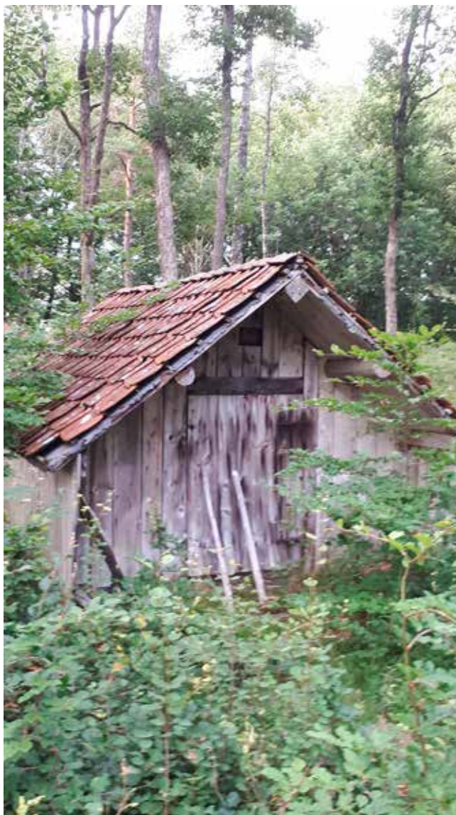
Inte långt från Västra Kulla och Hvatared ligger en gammal linbasta på Hallandssidan, i Oleträ.

Text och foto: Ingrid Zackrisson Yostared