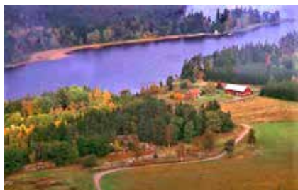
Råhagen år 2001.