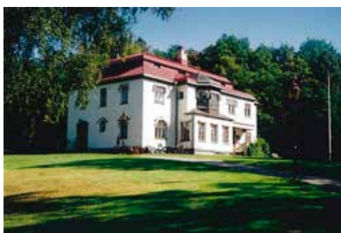
Kärrbogärde i Hemsjö. Foto sept 2000.

Hur många är vi inte – när vi har åkt E 20 nerför Högelidsbacken från Tollered mot Hemsjö – som har funderat över vad som döljer sig i den vackra och storslagna villan på vänster hand bakom trädridan? Jo, det är Kärrbogärde, som under en stor del av 1900-talet har hyst flera intressanta personer.