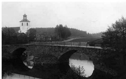
Stenbron – äldre foto.

Den gamla stenbrons stödmurar, valv och sidomurar var uppförda av kilade naturstenar i kallmur. Den är 45 m lång och spannen är 9,3 respektive 9,8 m. Räckeståndarna är förbundna med dekorativa järnkättingar.