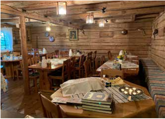
Dukat för lunch i Svenljunga Hembygdspark.