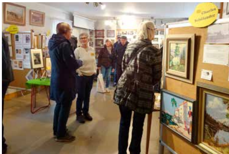
Konstutställning i Rävlanda. Konstnärer från förr och deras verk. Läs om detta på sidorna 10-11.