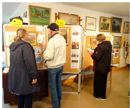
Besökare på årets konstutställning i hembygdsgården i Rävlanda.