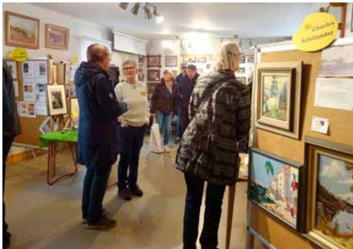
Besökare på årets konstutställning i hembygdsgården i Rävlanda.