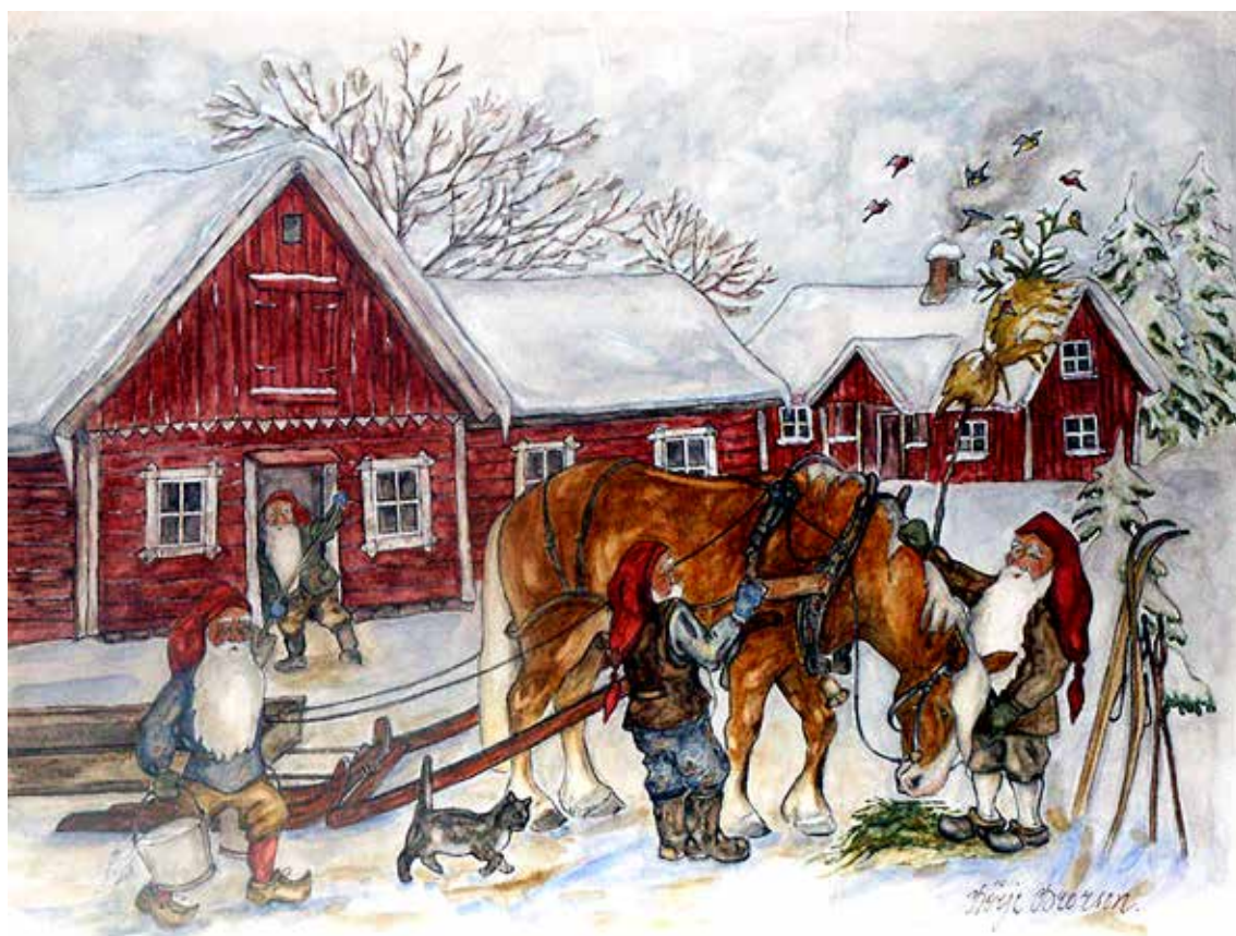
En tomtebild från bondesamhället förr på landet, där hästen var sin tids havremotor. Den här målningen har tidigare varit med i Västgötabygden 2006. Bild: Börje Brorson.

Längre tillbaka före 1700-talets upplysning var människornas vardag präglad av övertro och magi. Man har alltid velat ha förklaringar till vad som händer, och där spelar folktron en stor roll.