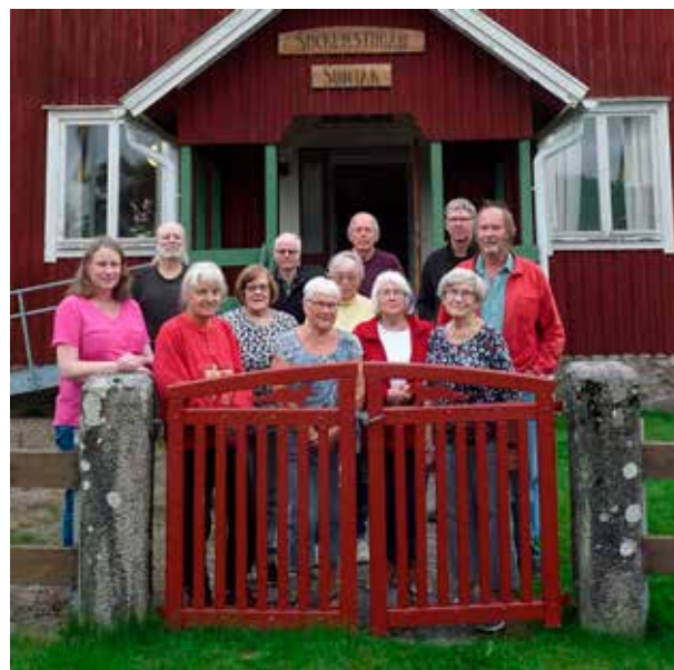
Deltagarna i studiecirkeln om Sunktaks sockens historia framför skolan, nu sockenstugan, mitt i byn.