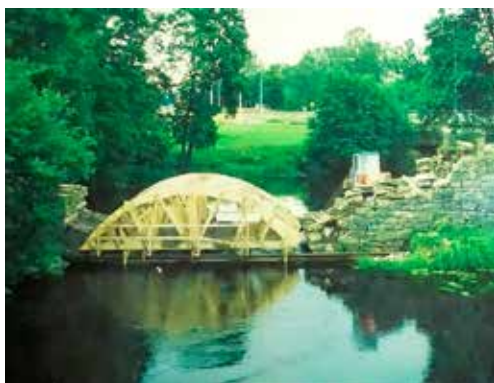
Stenbron – vid renovering.

Gamla bron över Ätran i Svenljunga, Kinds härad, beskrivs i läns museets broinventering 1980 som ”ett av Älvsborgs läns vackraste byggnadsverk”. Dess verkliga ålder är inte styrkt, men vid inventering och granskning av bron 1994 nämns år 1822/1823 som byggnadsår. Klart är att det är en av de äldre större broarna i Sjuhärad. Bron är R-märkt, vilket betyder att det är en fast forn lämning.