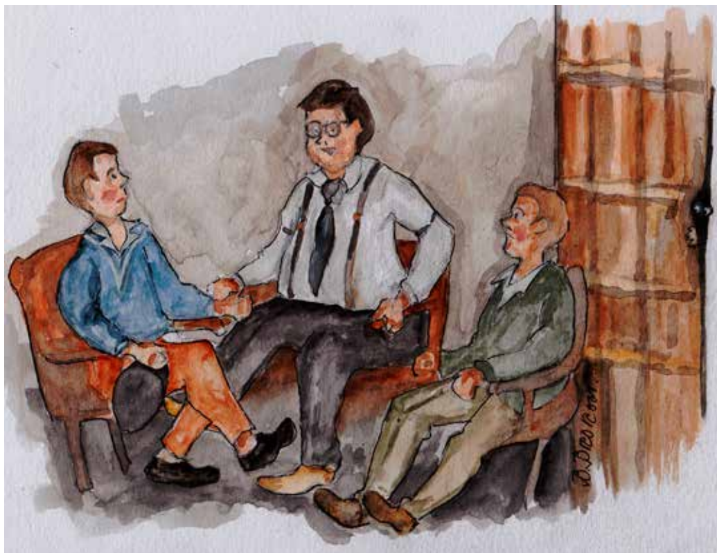
Ongdoma vesste att di va välkomna te skollärarn å hanses fru.

Min Far va skollärare i ena socken på Falbögdä för en sjutti-åtti år sen.