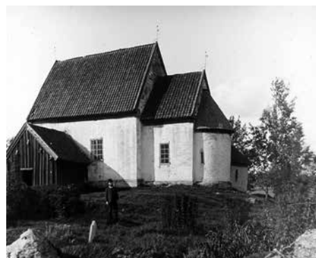
År 1891 tog Sanfrid Welin denna bild av 1100-talskyrkan i Suntak.