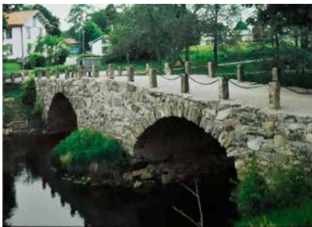
Stenbron efter renoveringen 1999.

Med anledning av stenbrons 200-årsjubileum har Svenljunga Hembygdsförening under sommaren haft utställning i Gästbyggnaden i Hembygdsparken. Utställningen bestod av text, foton och tavlor.