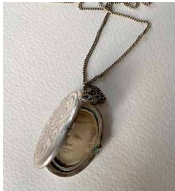
Ebbas mormors medaljong med morfar.

pandemin 2020 så gick klubben i kvav pga ålder och problem med covid19.