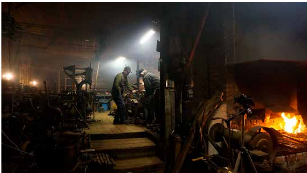
Verkstaden i Mellby med orörd maskinuppsättning.