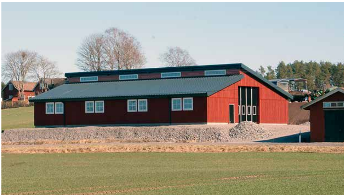
Melby Mekaniska museihall. Till höger i bild bakom museihallen ses en täckdikningsmaskin.

mest stolt över. När mekaniseringen av lantbruket ägde rum var det betydligt billigare att bygga om en äldre lastbil till en traktor och här kom lokala personer med uppfinningsrikedom fram.