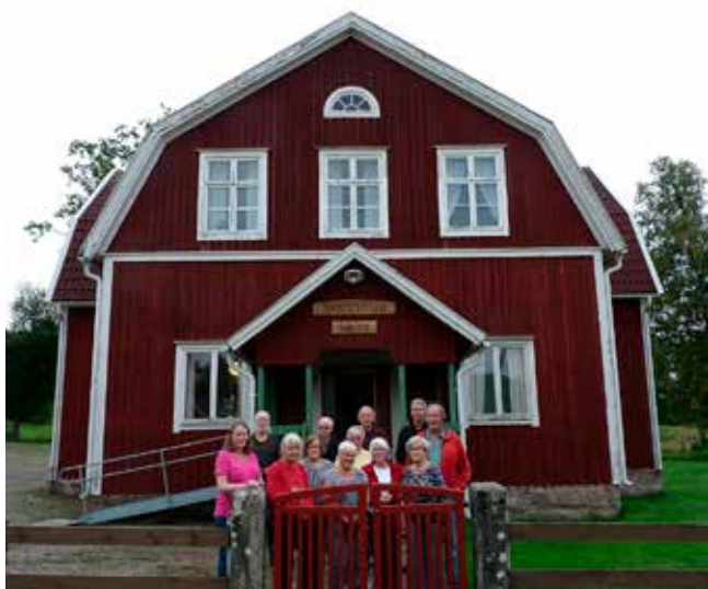
Suntaks historia. Ny bok om Suntak. Läs om boken på sidan 15. Foto: Lena E Jonsson, SV, Tidaholm.