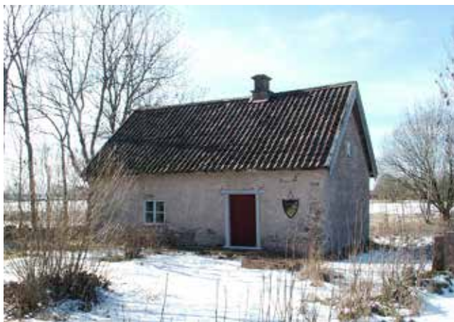
Soldattorp på Kullen. Knekten och hans familj behövde nog piggas upp till julen.

På vissa håll stod det i kontraktet att knekten skulle ha julgåvor, på andra håll fick han det ändå eftersom det var en gammal sed. I Pjätteryd i Småland bestod julkosten av en grovbröds-kaka, en siktbröds-kaka, en hackekorv, en bit fläsk, ett stycke torkat fårkött, två talgljus och malt. Rundvandringen startade redan på morgonen hos