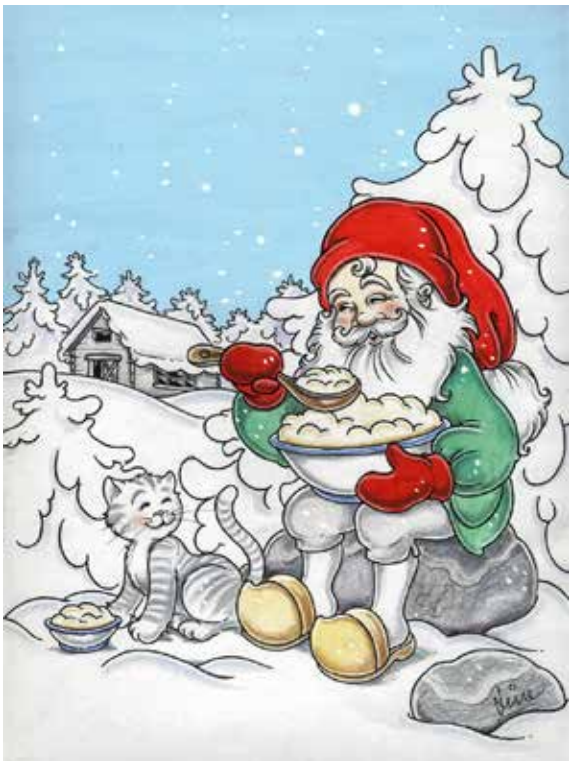
Julkort. Tecknare: Line.

år 1871 i Göteborgs Handels- och Sjöfartstidning berättelsen "Lille Viggs äventyr på julafton". Det blev en vändpunkt i den svenske tomtens liv. Folktrons farliga och lättretliga tomtegestalt blev god och delade ut gåvor. Men julvännen stannar också vid en ladugård och hälsar på tomtormen, som var hemmets goda ande med anor från romarna.