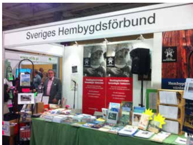
Hembygdsförbundets monter på Bokmässan