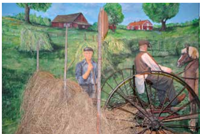
Bondens år Cesarstugan. Bondeliv förr.