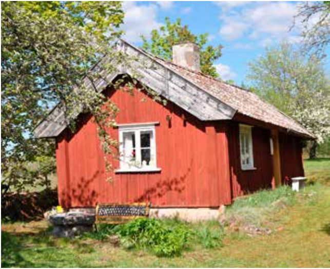
Hannas stuga i Dala. Den 18 maj inbjöd hembygdsföreningen till besök här och i Kalltorpsstugan i Dala.