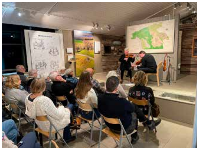
Konsert i Fjärås.

– Det är alldeles för tidigt att avgöra. Sammantaget kan nog materialet betraktas som ganska spretigt och en utgivning tjänar på att ha någon form av röd tråd.