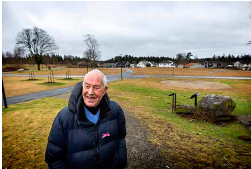
I bakgrunden syns villaområdet vid Kärra, till vänster i bild låg Rolands barndomshem.