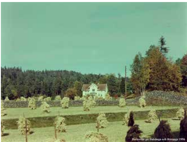
Havreriar i en gammal terrassering.

Kreatursskötseln i Torstad gav uppskattningsvis 50 ton mjölk per år samt ett antal livkalvar och ungdjur. Hästarna var outhärliga som dragare och svinhållningen en viktig proteinkälla. Fisket i samfällda vattendrag bidrog till en varierad kosthållning och biodlingen gav extraförtjänster. Småviltsjakten gav också tillskott, medan älg och rådjur var sällsynta som följd av det omfattande skogsbetet med tamdjur. Sammantaget hade landsbygden, som i det här exemplet, kapacitet att inte bara försörja sin egen befolkning utan bidrog också till den övriga samhällets välståndsutveckling, inte minst tack vare förädlingen av jordbrukets produkter.