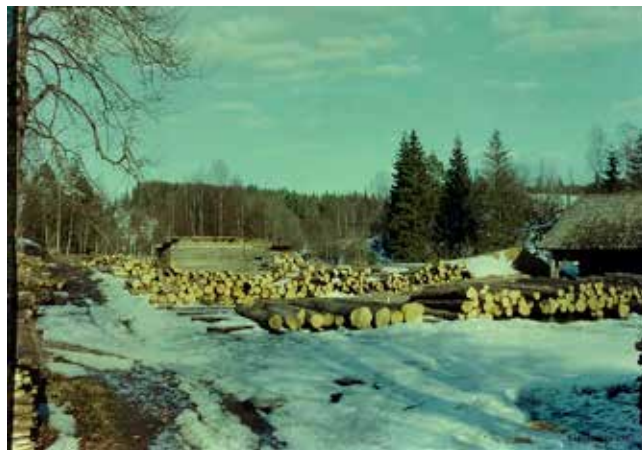
Sågplanen i Torstad vid mitten av 1950-talet.

Landsbygden är avgörande för den gröna omställningen heter en delrapport i Naturvårdsverkets fördjupade utvärdering av Sveriges miljömål 2023. I rapporten, som kom i januari 2023, redovisas hur Sverige ”ska kunna utvecklas mot en cirkulär, biobaserad och fossilfri ekonomi där naturresurserna utnyttjas hållbart.”