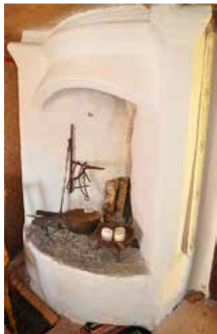
I stugans rum står spisen, som såväl var värmekälla som platsen för matlagning.