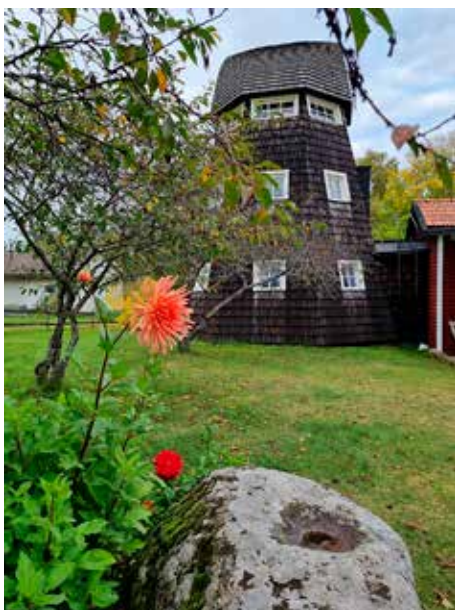
Kvarnen, Stenhammar. Hembygdsföreningen i Gösslunda höll sitt årsmöte här.