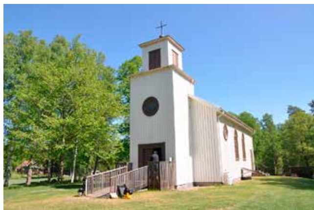
Suntorps kapell, Sventorp, som i november fyller 90 år. Allt arbete sker ideellt, men verksamheten är inordnad i Vårsås pastorat.