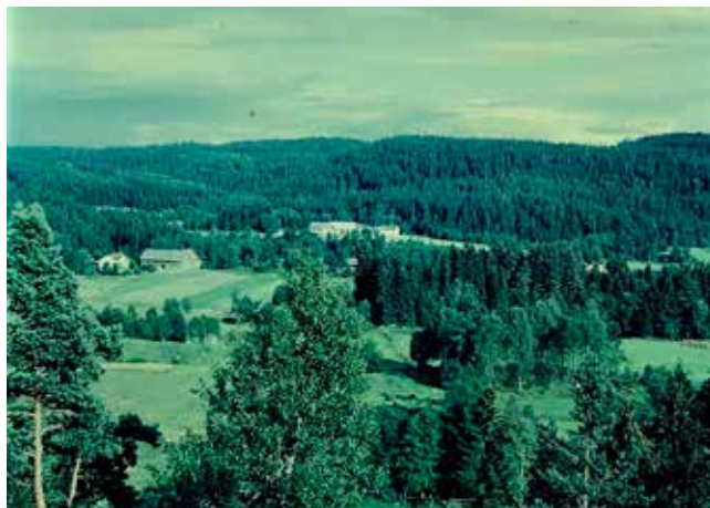
Torstad vid mitten av 1950-talet. Bykärnans sju gårdar låg före Laga skiftet bakom granskogen i mitten av bilden. Foto: Roland Persson 1955.

Cirka 40 personer fördelade på sju gårdar, levde i byn vid slutet av 1930-talet. Så kallade undantag innebar att