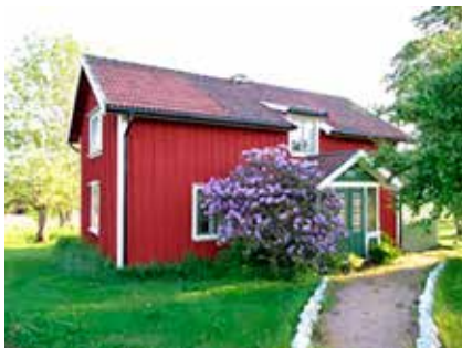
Rolands vackra barndomshem vid Kärra i juli 2009.

Fynden visas i en monter vid kullen och Svenska Kyrkan har satt upp en informationsskylt på platsen som berättar om järnframställningen och Rolands arbete.