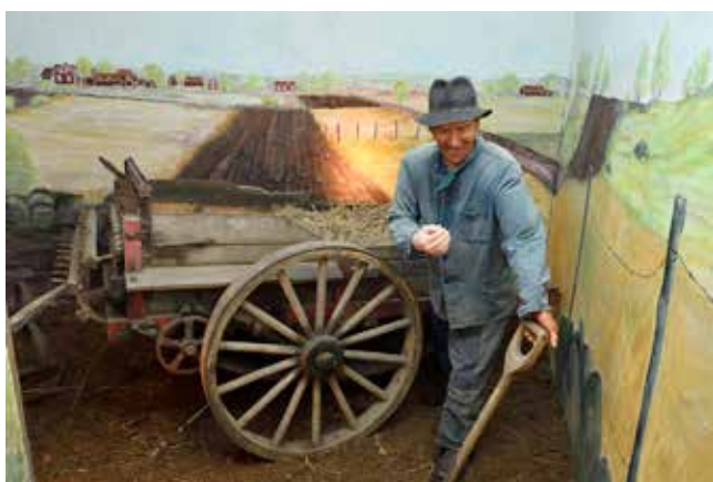
Bondens år, Cesarstugan. Bondelivet förr var helt annorlunda mot idag. En sevärd utställning.

Västergötlands Hembygdsförbund och Sveriges Hembygdsförbund samarbetar med Studieförbundet Vuxenskolan vid kurser och konferenser.