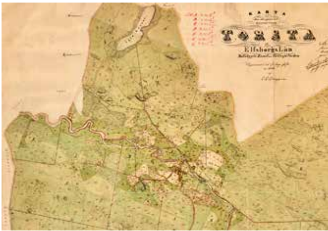
Torstad by vid Laga skiftet 1856.

Lagaskiftesreformen hade inneburit en rationalisering av brukningsenheterna som möjliggjorde en högre grad av mekanisering. Samägda självbindare, potatisupptagare, frösåningsmaskiner och ogrässprutor bidrog ofta till moderniseringen, men den begränsade åkerarealen satte gränser för hur långt mekaniseringen kunde gå. Självbindaren var en genial uppfinning som inte bara skar säden utan också band den i lagom stora neker, anpassade för torkning på riar. Efterföljaren skördetröskan var effektivare men långt mindre tekniskt avancerad.