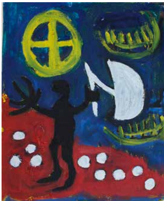
Hällristningar: Vad vill yxmannen från bronsåldern berätta?

De äldsta kristna gravarna i Skaraborg är från 900-talet. Då dyker det även upp kristna runstenar med inhuggna kors, bl a en i Källby. Kristendomen är på frammarsch. På sandstensterrassen i Husaby finns då en träkyrka samt flera heliga källor. År 1008 döptes kung Olof Skötkonung i Husaby, och blir därmed den första döpta kungen i Sverige. Första biskopen i Husaby hette Thur-