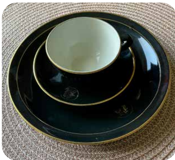
Del av begravningservis. En kopp med fat och assiett, tillverkad av Lidköpings porslinsfabrik för minst 100 år sedan. Det syns svagt ett företagsmärke i porslinet, men det har nästan slitits bort.

Nu förändras begravningssederna mycket. Förr var begravningen ett uttryck för ett mer kollektivt levnads sätt. Byborna följde de sina till graven och hade ansvar. Nu sker ofta begravningar i stillhet inom familjen, och det är inte så många minnesstunder och samlingar efter begravningen. I Stockholm lär nu 10 procent vara "direktare", alltså direkt transport till krematoriet utan någon ceremoni alls. Det säger något om vår syn på livet och döden och vår respekt för de stora skeendena i vårt liv på jorden.