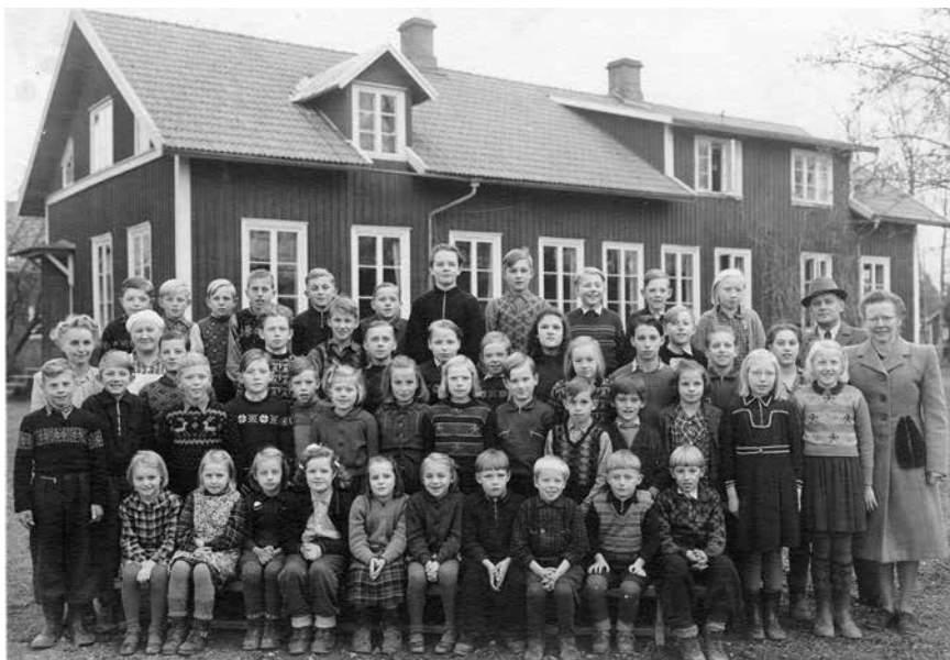
Elever och personal i Habo skola samlade år 1946. Till vänster ses småskollärarinnan och skolbispisningsföreståndaren, till höger makarna Hellström. Artikelförfattaren står som nr 3 från vänster med en stickad tröja med renar.