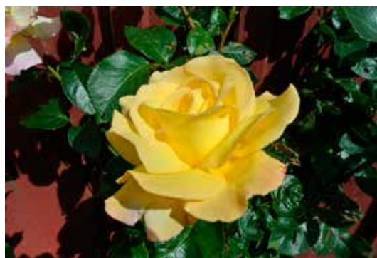
En doft av sommaren som gick. Nu får vi snart tända ljusen som lyser upp höstmörkret.