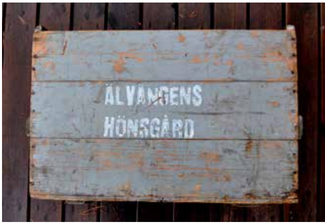
En ägglåda från hönsgården.