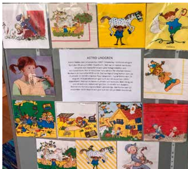
Servettutställning. Motiv från Astrid Lindgrens barnböcker.