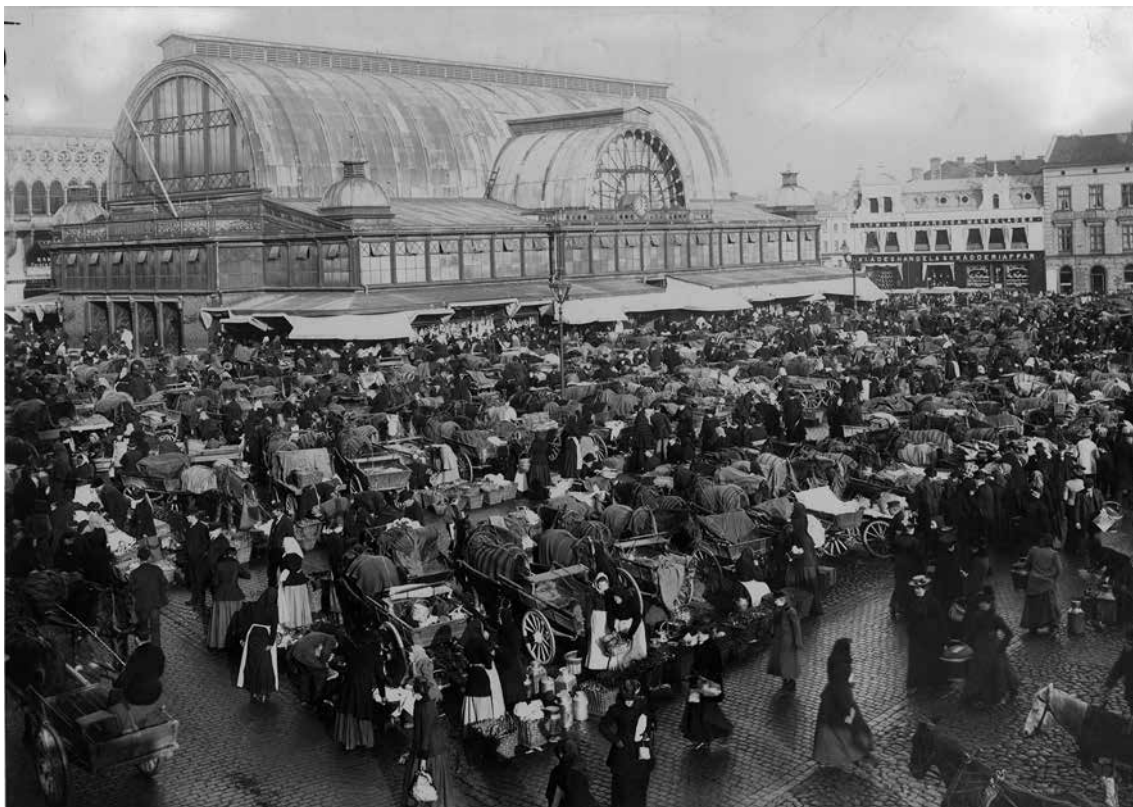
Kungstorget – ett skaffereri för göteborgarna vid sekelskiftet 1900. Hästar och kärror från Bohuslän stod i en rad, från Halland i en annan rad och från Västergötland i en tredje. Det ansågs vara en säkerhetsåtgärd. Bilden togs på 1890-talet av Aron Jonason. Bild från Göteborgs Stadsmuseum.