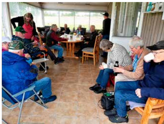
När regnet öser ner är det skönt att sitta i ett varmt uterum.