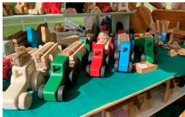
Traktorer med sågade trävaror på släp.