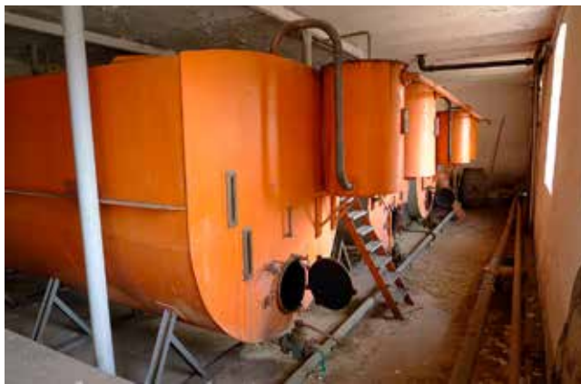
Jäskällaren med fyra slutna jäskar i helsvetsad plåt. Efter tre dygns jäsning i jäskaren omvandlades sötmäskan till surmäsk, som sedan pumpades över till spritkolonnen. Foto Eric Julihn 2012.

Det tredje argumentet är kanske viktigast. Stora Bjurums bränneri är den enda återstående anläggningen i Västra Götalands län som ger möjlighet att rent praktiskt studera hur brännvin tillverkades av potatis på traditionellt sätt. I de tre sydligare landskapen Skåne, Blekinge och Småland har detta ansetts vara så märkligt och värdefullt att motsvarande anläggningar skyddats som byggnadsminnen.