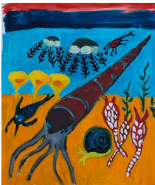
Ortoceratit: Det kan finnas upp till tio stycken bläckfisksfossil på en kvadratmeter kalkhäll.

Ett världsarv måste uppfylla minst ett av tio kriterier (se nedan), med undantag för kriterium sex som världsarvskommittén endast antar som kriterium tillsammans med andra kriterier. År 1992 antog världsarvskommittén möjligheten att ge områden med värdefullt kulturlandskap världsarvstatus, vilket blev det första internationella instrumentet för att skydda denna typ av område. Medlemslandet är i enlighet med konventionen förpliktigt att sörja för att världsarvet bevaras åt eftervärlden. (År 2010 ratificerade Sverige Den