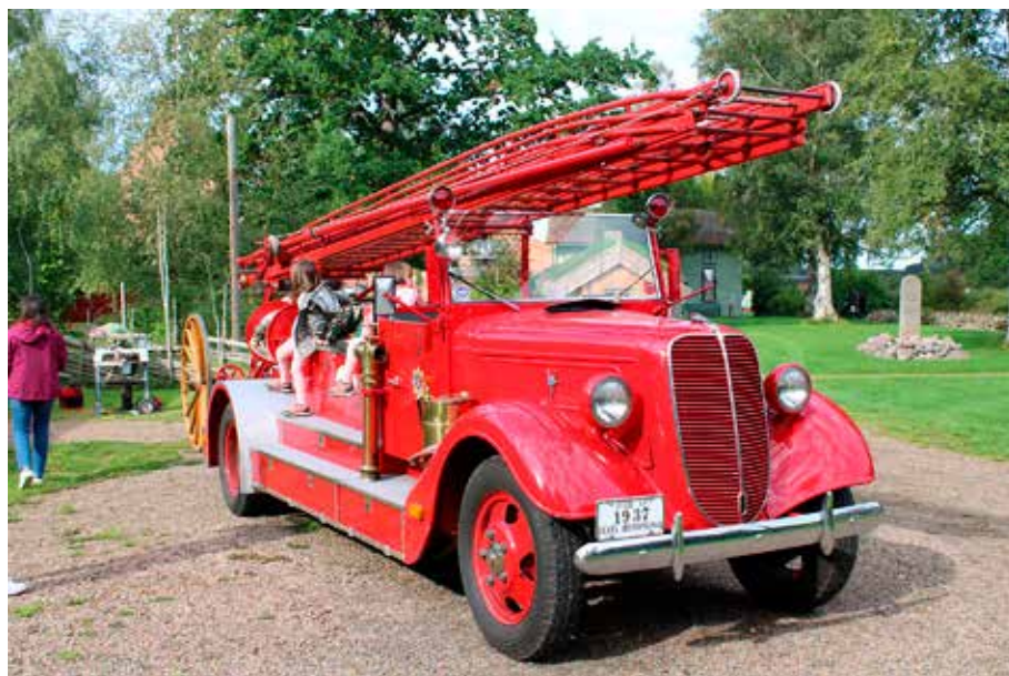
Hembygdsmässa i Fornbyn, Skara. Den gamla brandbilen lockade många intresserade. Läs mera på sidan 12 och 27.