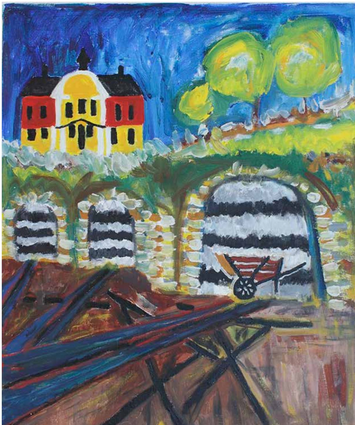
Kinneulle. Kalkugnar laddade för bränning med kalksten och alunskiffer. Läs mer på sid 8.