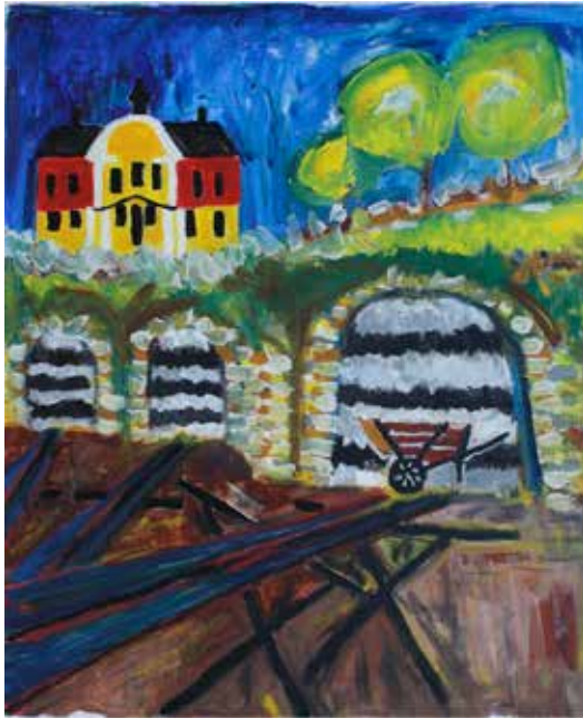
Kalkugnar laddade för bränning med kalksten och alunskiffer.

ett biosfärområde är att bevara biologisk och kulturell mångfald, ekosystem och landskap. Biosfärområdet ingår i UNESCO:s nätverk och har alltså ett internationellt värde. Senast har Kinnekulle blivit en del av ”Plåtbergens geopark”, också inom UNESCO:s nätverk, med internationell status.