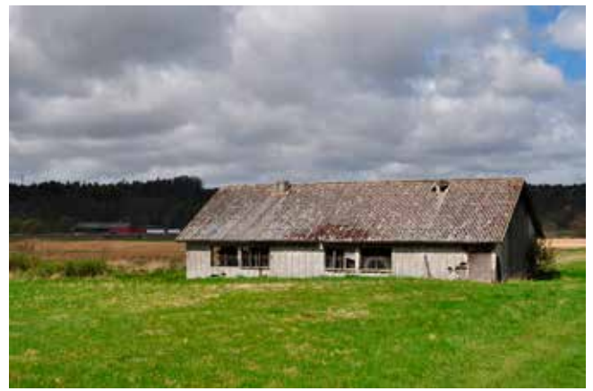
Det nedre hönshuset.