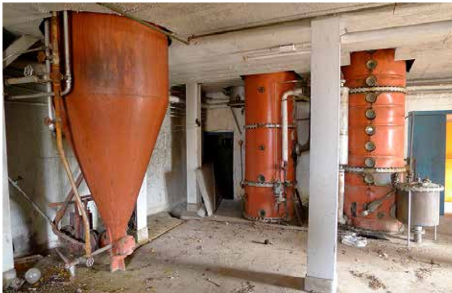
Avverkningsrummet med kolonnerna var bränneriets hjärta, där spriten destillerades fram ur mäsken. I mitten syns spritkolonnen, till höger mäskkolonnen och till vänster potatiskokaren. Foto Eric Julihn 2013.