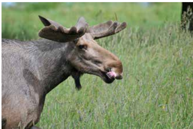
Med tungan rätt i mun.