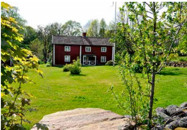
Brännhult, Ransbergs Hembygdsförenings gård.