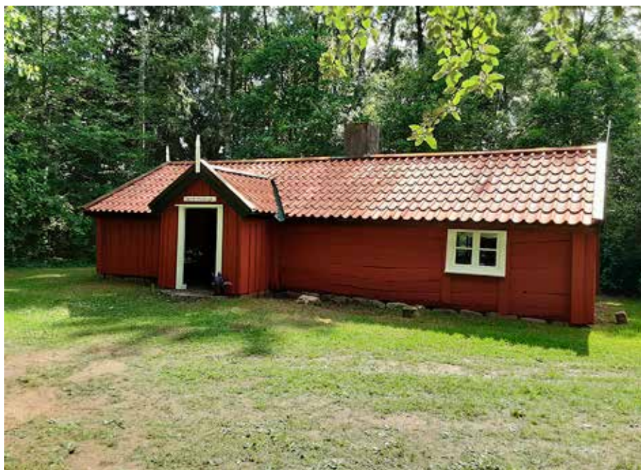
Tråvads fornminnesstuga som flyttades för 90 år sedan till Tomternas park.