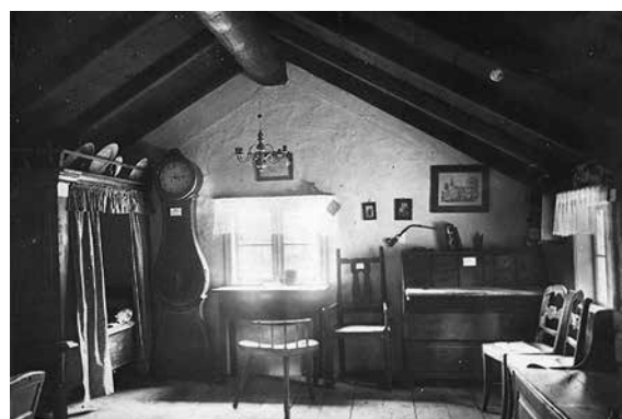
Inredningen i Tråvads fornminnesstuga. Foto från 1933.