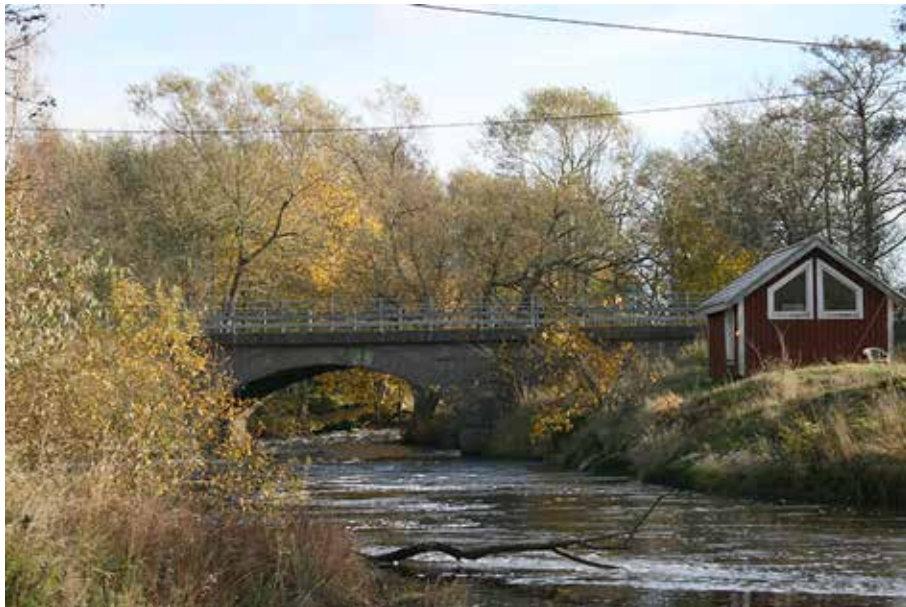
Tråvadsbro 100 år. Den gamla landsvägen mellan Vänersborg och Falköping som går genom Tråvads samhälle.

som blev över vid upphuggningen ur berget krossades med en bergskross som drogs av en fotogenmotor. Den krossmassan lades sedan på Bräddehagsvägen”.