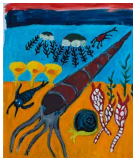
Kinneulle. Ortoceratit. Se artikel på sidan 8.