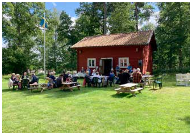
Svenljunga hembygdspark. Under fem sommarsöndagar har det varit öppet för kaffeservering, underhållning och utställning.