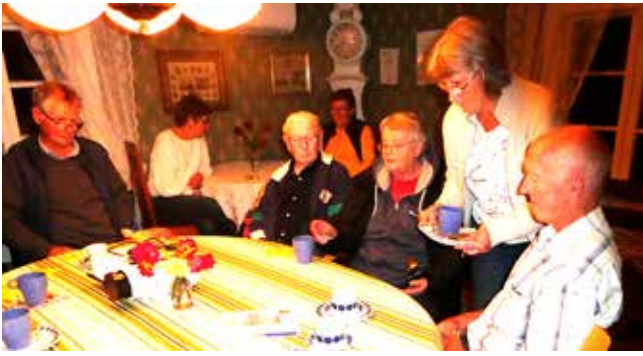
Filmkväll i Ljungsarp.