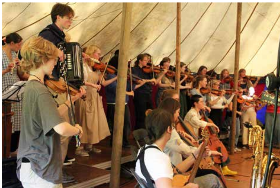
Ornunga. Ungdomarna i Västra låtverkstan hade en egen konsert i tältet vid hembygdsgården i Ornunga. Sidan 16.