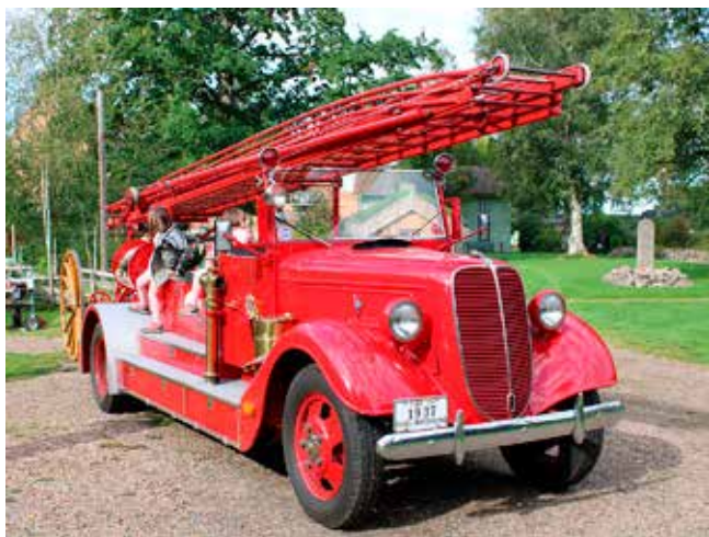
Den gamla, vackra brandbilen i Skara ställdes ut i Fornbyn vid hembygdsutställningen den 2 september 2023. Den har således inget att göra med den första yrkesbrandkåren i Göteborg 1872.