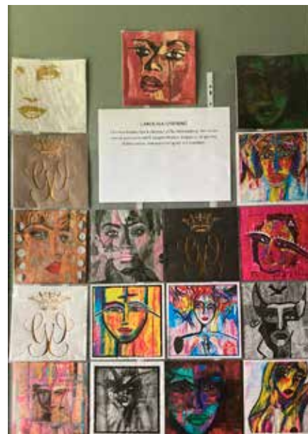
Servettutställning i Svenljunga. Poul Pava, konstnär. Se sidan 19.