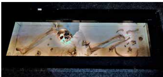
Bredgårdsmannens kvarlevor visas i en monter i Statens Historiska Museum i Stockholm

De första människorna, Homo sapiens, ”föddes” i Afrika för omkring 200 000 år sedan och de var mörkhyade,