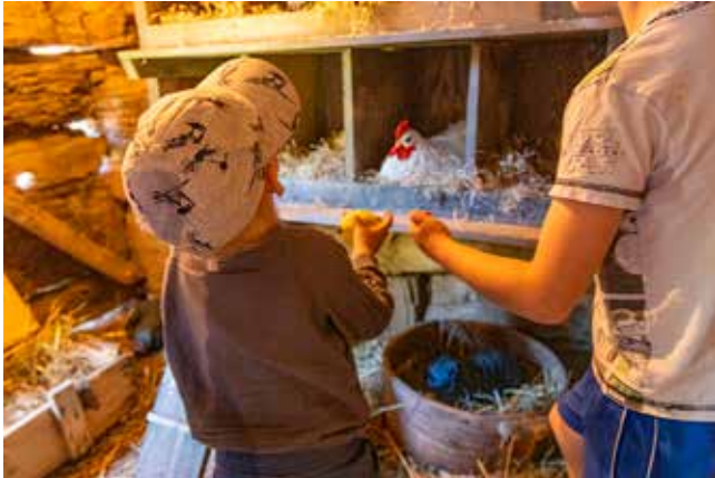
Barnens söndag i Herrljunga hembygdspark. Här tittar barnen in i hönsredet.

Hur får vi barn till hembygdsrörelsen? Det har vi i Herrljunga hembygdsförening lagt en del huvudbry åt under ett flertal år. Vad är det som lockar denna målgrupp och kan det finnas saker i parken som kan användas när det inte är evenemang – för barnlediga, förskoleklasser och dagmammor med flera.