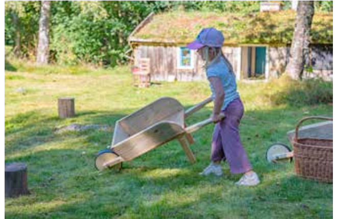
Skottkärre race – en populär aktivitet – i Herrljunga hembygdspark. I år ersattes ponnyridningen med en tur i den gamla brandbilen, se omslaget, sid 24.

Varje år anordnas Barnens söndag som lockar många barn, föräldrar och far- och morföräldrar. I år ersatte en tur med den gamla brandbilen vår tidigare ponnyridning och köerna var långa. Barnens snickeriverkstad är ett traditionellt inslag, där båtar, flygplan och just i