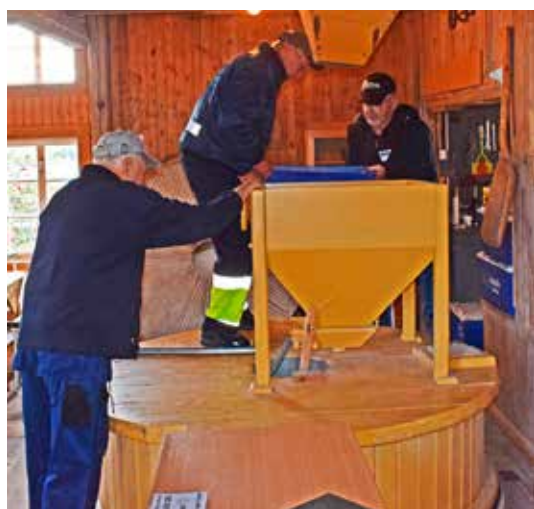
Här matas kvarnstenarna med råg.

I år maldes 300 kilo råg med ett resultat av 174 påsar färdigt mjöl á 1,5 kilo styck – perfekt till det stundande julbaket! Under dagen såldes 41 påsar direkt över disk. Mjölet säljs även i en av Nossebro's livsmedelsbutiker.