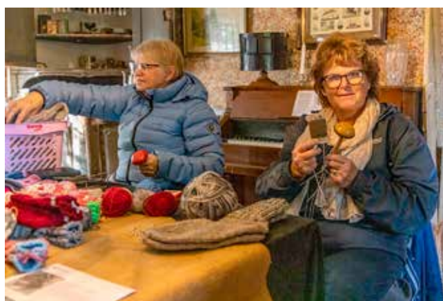
Arbetsstuga med strumpstoppning på temat ”huvudsaken är att man är torr om fötterna”.

I syfte att medvetandegöra den enskilde invånaren och skapa insikt arrangerade hembygdsföreningen i Herrljunga söndagen i beredskapsveckan en dag på temat, med rubriken ”Kris och krig, svensk krisbered-