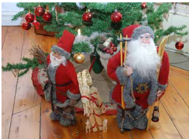
I salen vaktar tomtarna julgranen, men där brukar även julklapparna få plats.