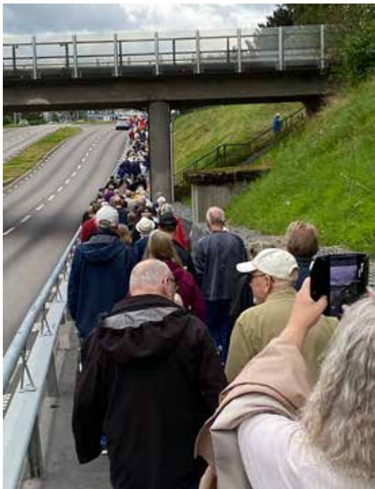
Kön ringlar lång. Alingsåsarna är kunskapsstörsta på sin gamla stad.