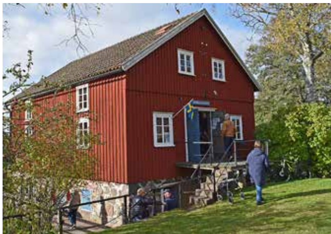
Nossebro Hembygdsförenings årliga malning i anrika Kerstins Kvarn, Nossebro. Läs artikeln på sidan 9.