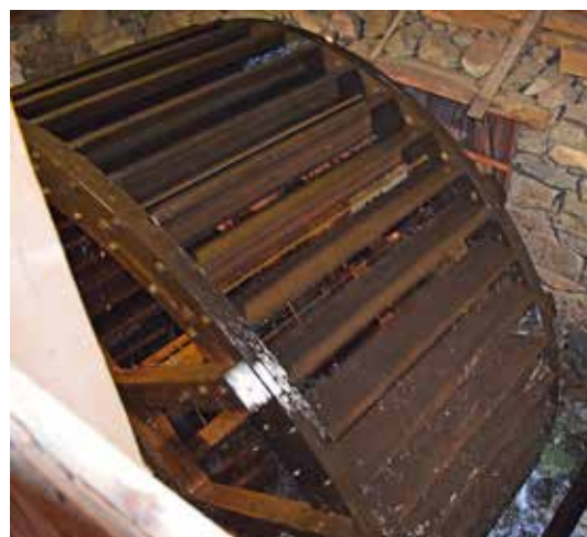
Vattenhjulet, som driver maskineriet, mäter 4,20 meter i diameter.

Nossebro Hembygdssförenings årliga malning i anrika Kerstins Kvarn blev i år succé med rekordmånga besökare. Drygt 100 personer, många långväga, kom för att se kvarnen i arbete och köpa nymalt mjöl.