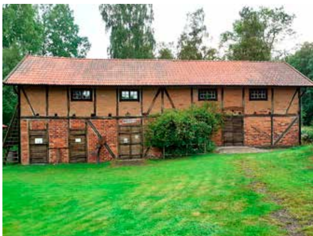
Amnehärads hembygdsförenings hembygdsgård och sjöfartsmuseum.

När man åker genom Otterbäckens samhälle i norra Skaraborg kan man inte undgå att se och förundras över en märklig tvåvåningsbyggnad i norra delen av samhället. Huset är nämligen byggt i den för våra trakter mycket ovanliga korsvirkesstilen.