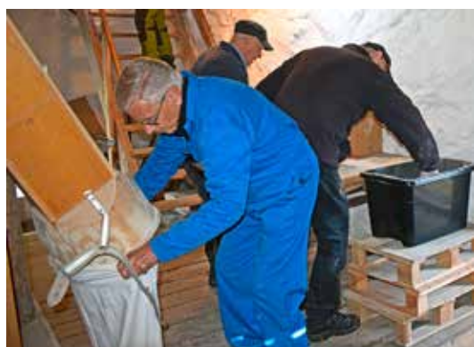
Nere i kvarnmaskineriet samlades mjölet upp i säckar.

I år var vattenståndet perfekt för malningen och i det soliga vädret lockade eventet särskilt många intresserade. Vattenhjulet mäter imponerande 4,2 meter i diameter och driver med ett komplicerat kugghjulssystem stenarna som mal mjölet.