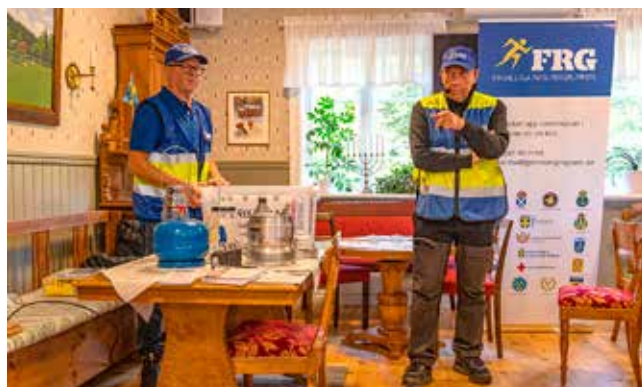
”Kris och krig, svensk krisberedskap genom tiderna”. Om detta ämne ordnade Herrljunga hbf en hembygdsdag.