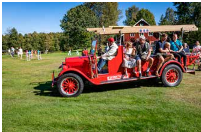
Barnens söndag i Herrljunga hembygdspark. I år ersattes ponnyridningen med en tur i den gamla brandbilen. Läs Peter Backenfalls artiklar på sidorna 7 och 8.